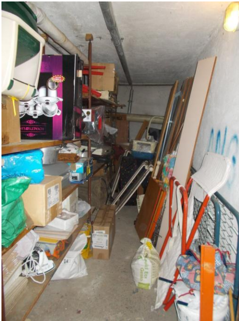
51. Interno della cantina