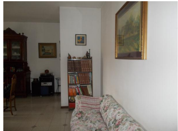
12. Ingresso (verso il soggiorno)