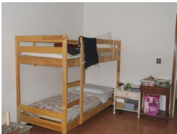
39. Seconda camera