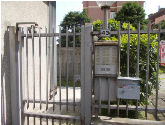
1. Cannello di ingresso pedonale