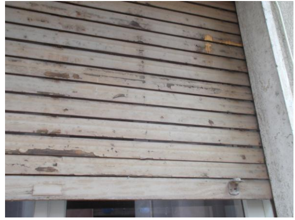
36. Avvolgibile esterna