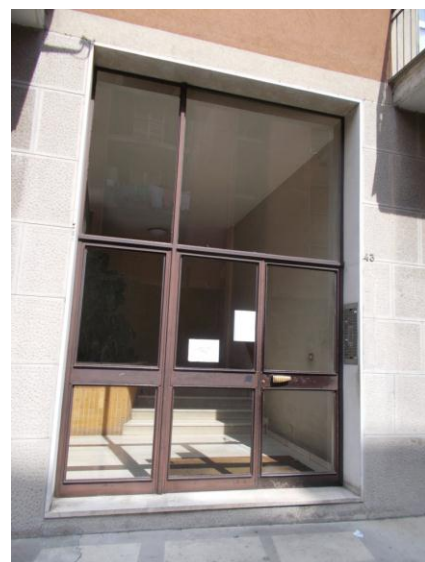
6. Portoncino di ingresso allo stabile