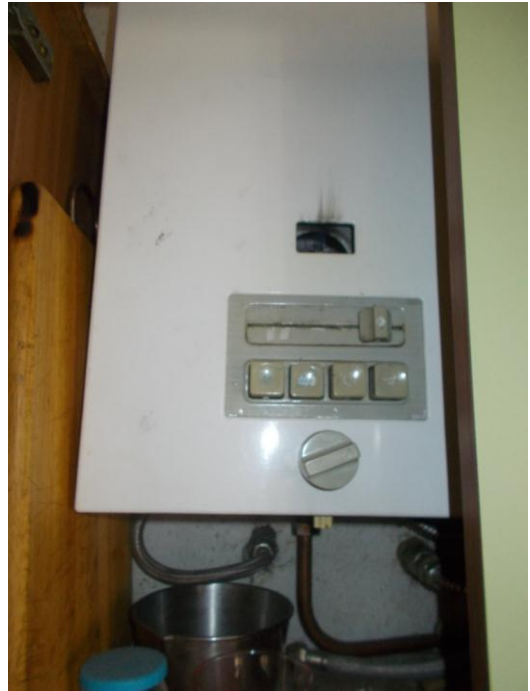
48. Caldaia per acqua calda (in cucina)