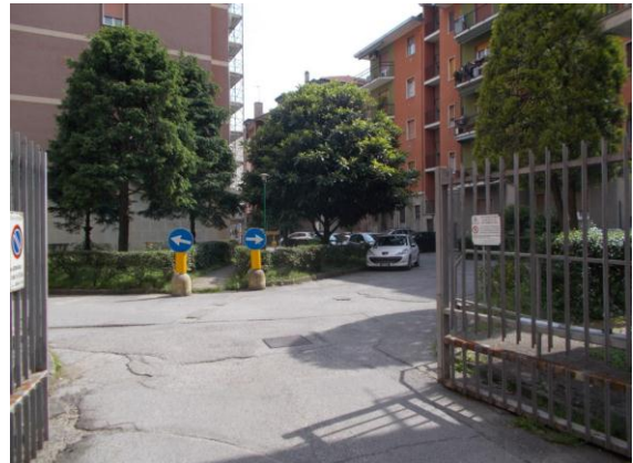
2. Cannello carraio