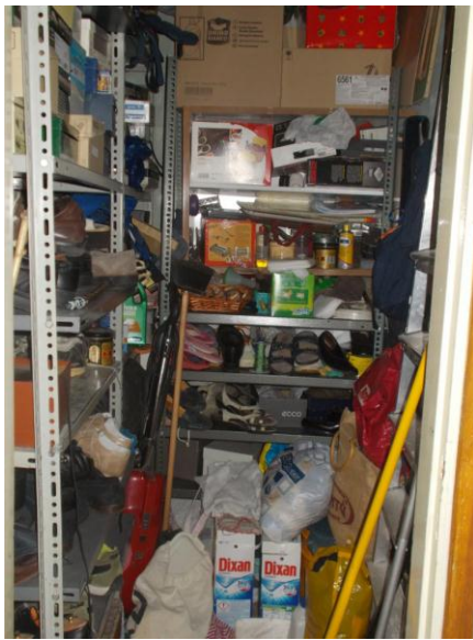
37. Interno del ripostiglio