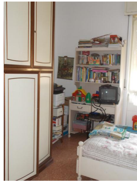
38. Seconda camera