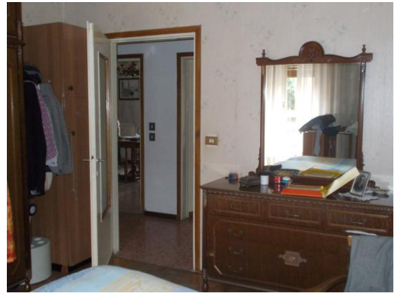
30. Camera (verso il disimpegno)