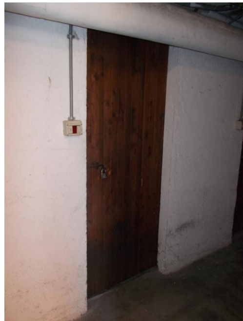
50. Ingresso alla cantina di pertinenza