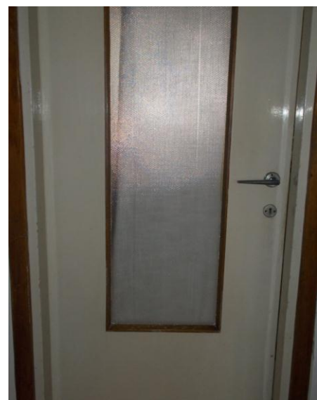
46. Porta interna