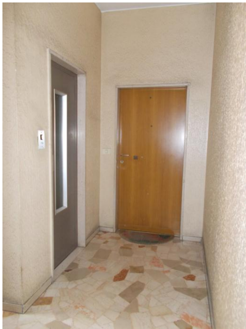
9. Ballatoio di ingresso all'appartamento e porta di arrivo ascensore