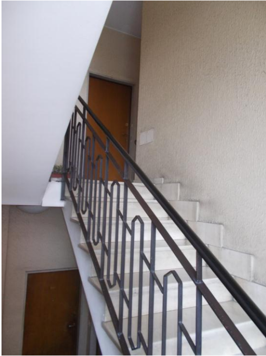
7. Corpo scala comune