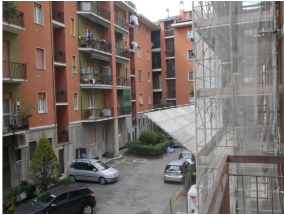
35. Vista dal balcone