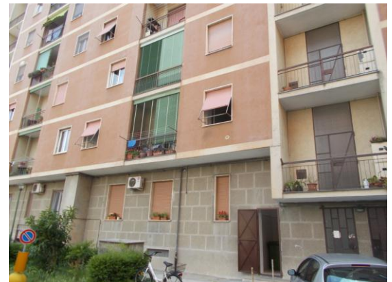
4. Facciata esterna dello stabile