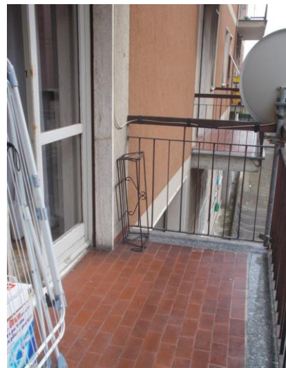
34. Balcone della camera