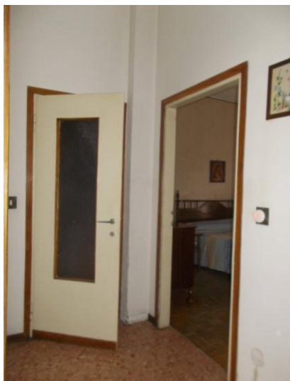
19. Disimpegno "zona notte"