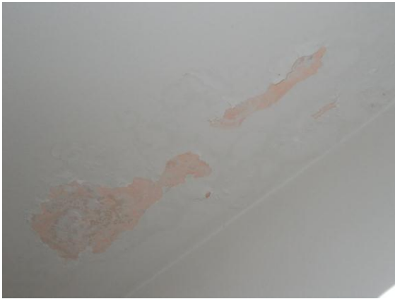
23. Soffitto del bagno