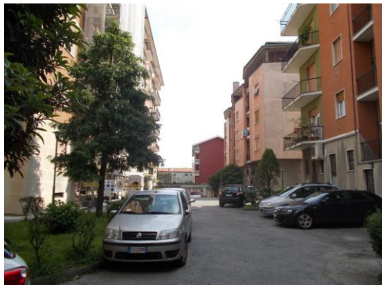
3. Cortile comune condominiale