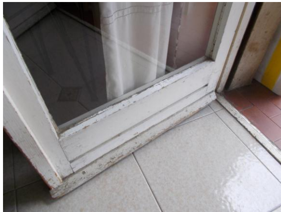
25. Serramento esterno