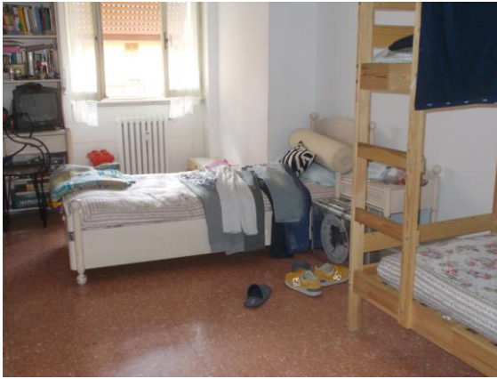
41. Seconda camera