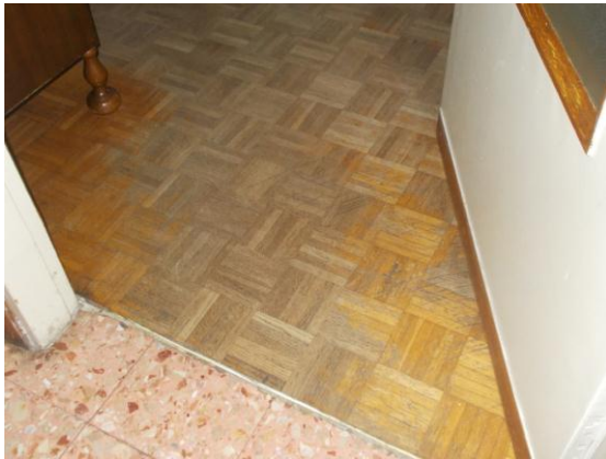
43. Dettaglio del pavimento della prima camera e del disimpegno "zona notte"