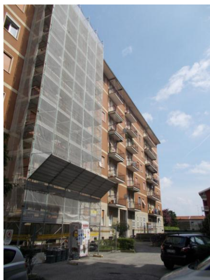
5. Facciata dello stabile