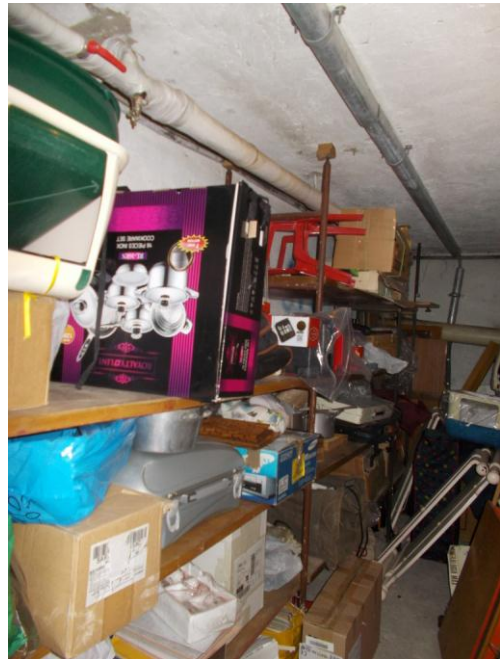
52. Interno della cantina