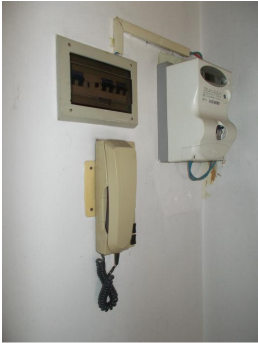
47. Citofono, contatore e salvavita