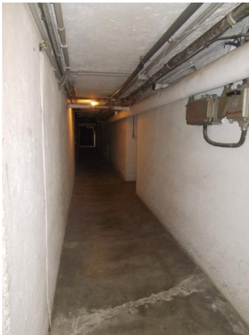
49. Corridoio comune alle cantine