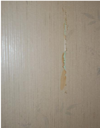
31. Dettaglio parete della camera