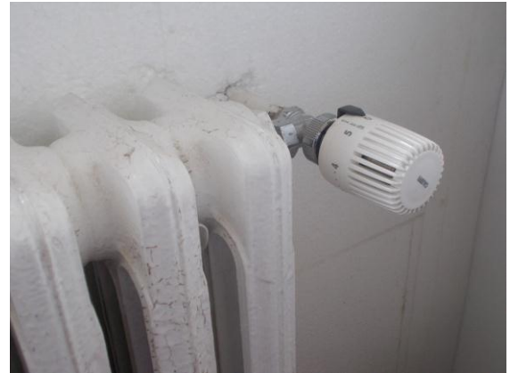
44. Valvola di termoregolazione