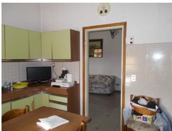
15. Cucina (verso la zona di ingresso)