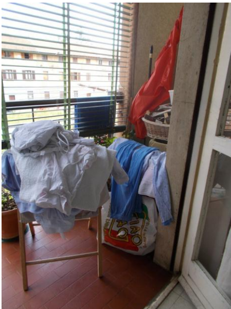
27. Balcone del soggiorno