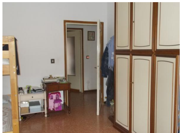
40. Seconda camera