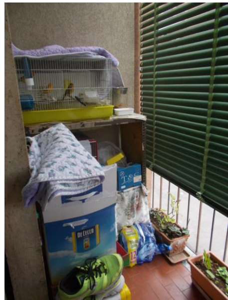
28. Balcone del soggiorno