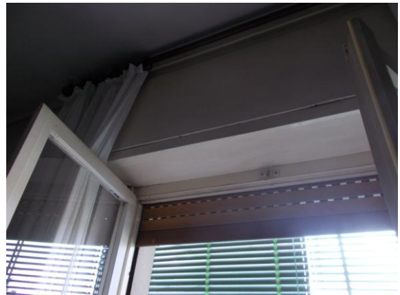
26. Serramento esterno