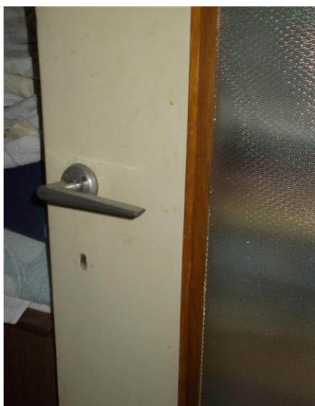
45. Porta interna