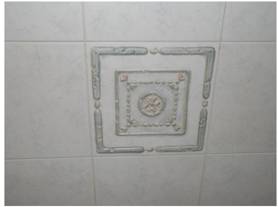
24. Dettaglio rivestimento del bagno