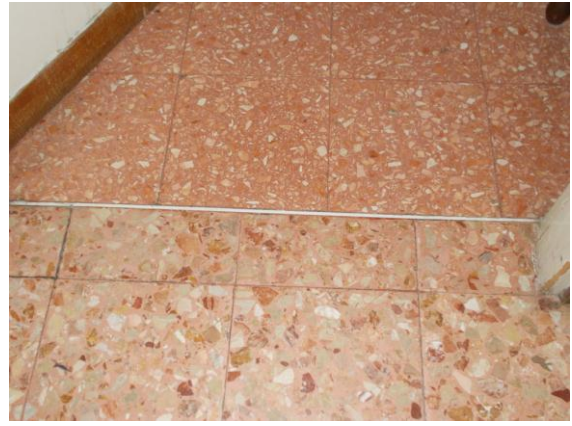
42. Dettaglio del pavimento della seconda camera e del disimpegno "zona notte"