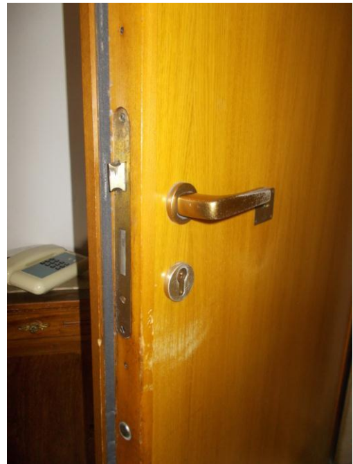
10. Portoncino di ingresso