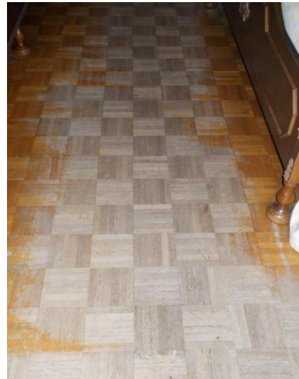
32. Pavimento in parquet della camera