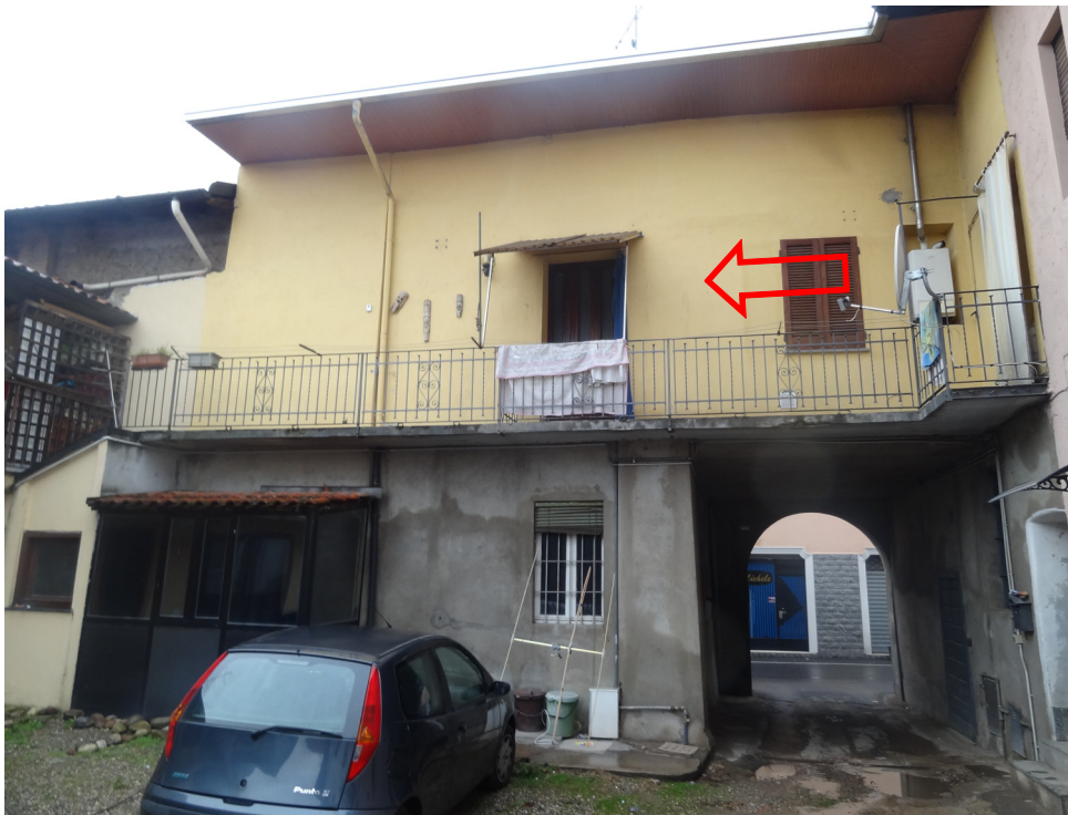
Foto esterna - corte interna con cespite di riferimento