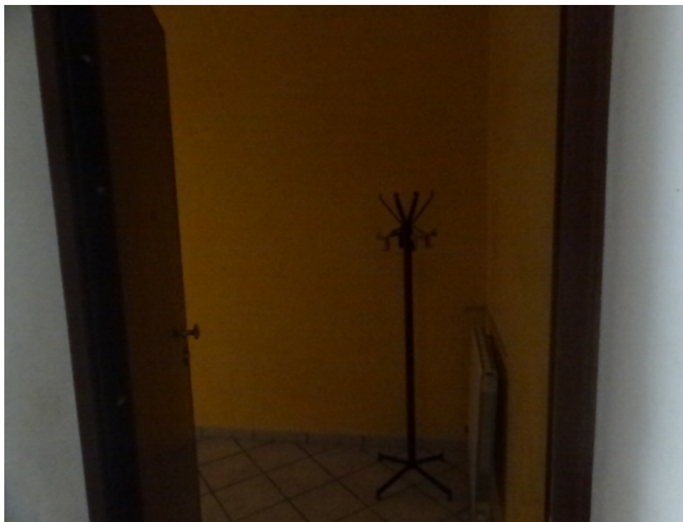
Foto esterna - ingresso cespite di riferimento

Viale Gian Galeazzo n. 17 20136 Milano (MI) Cell. +39.347.3129596 Tel. fax +39.02.36560692 P. IVA 03227970278 E – mail line_project@hotmail.it