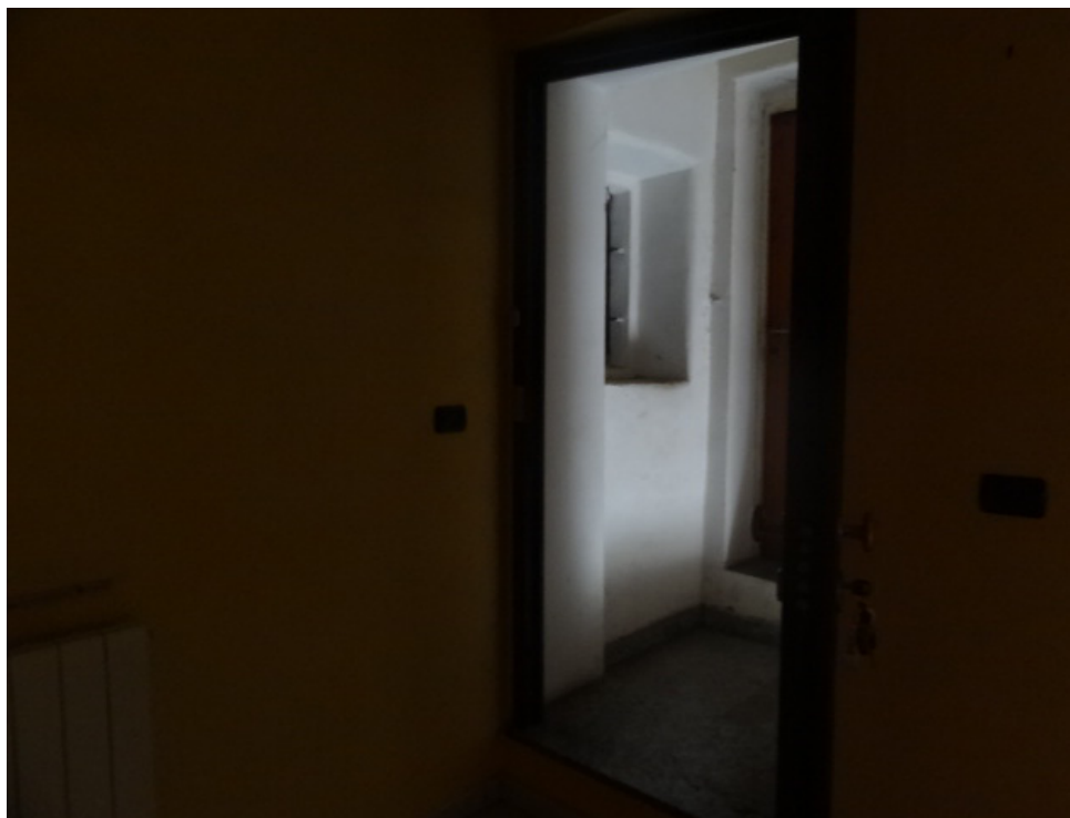
Foto interna - ingresso cespite di riferimento lato interno