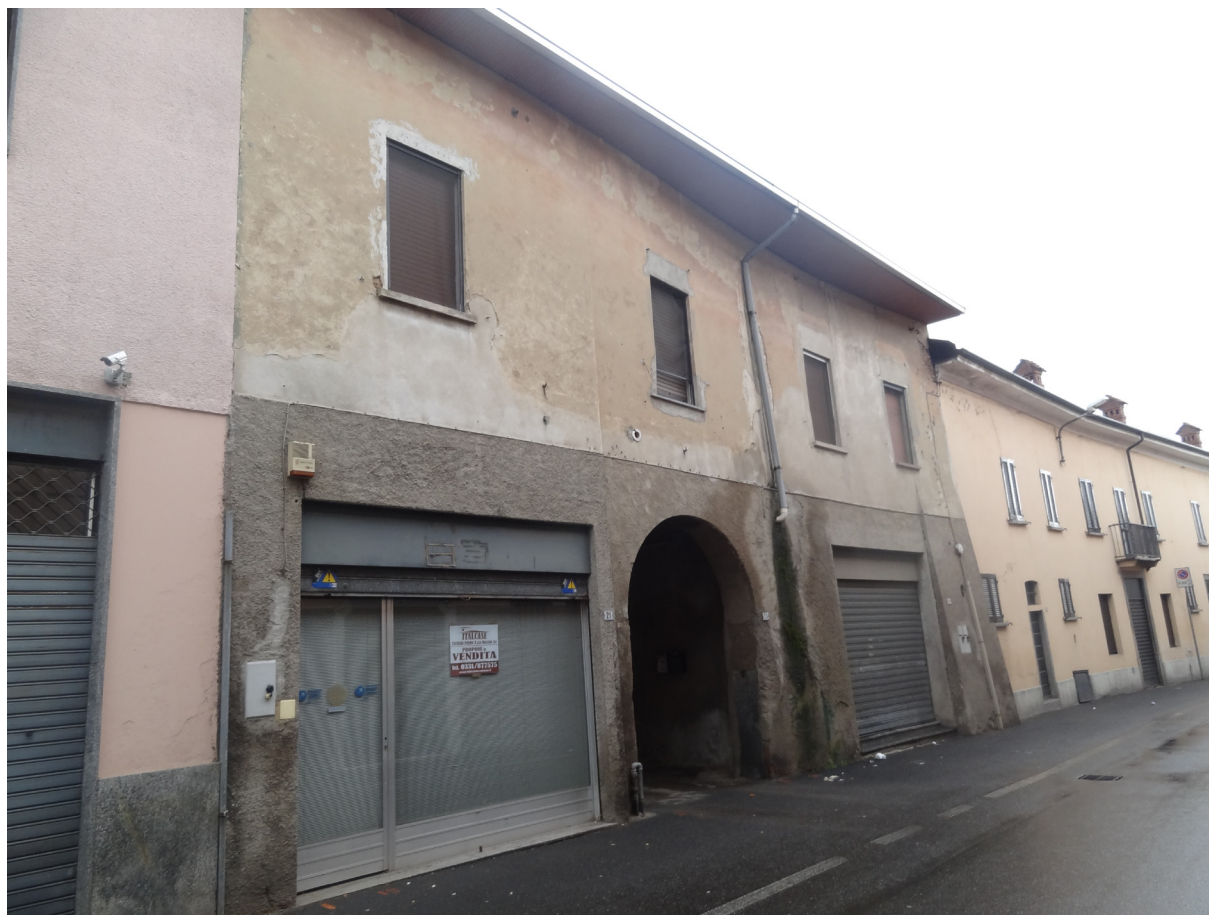
Foto esterna - Palazzina sul fronte strada