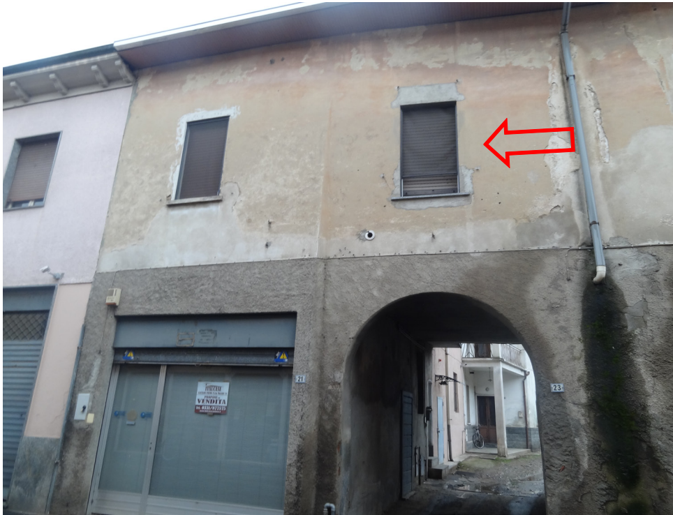
Foto esterna - ingresso corte interna fronte strada