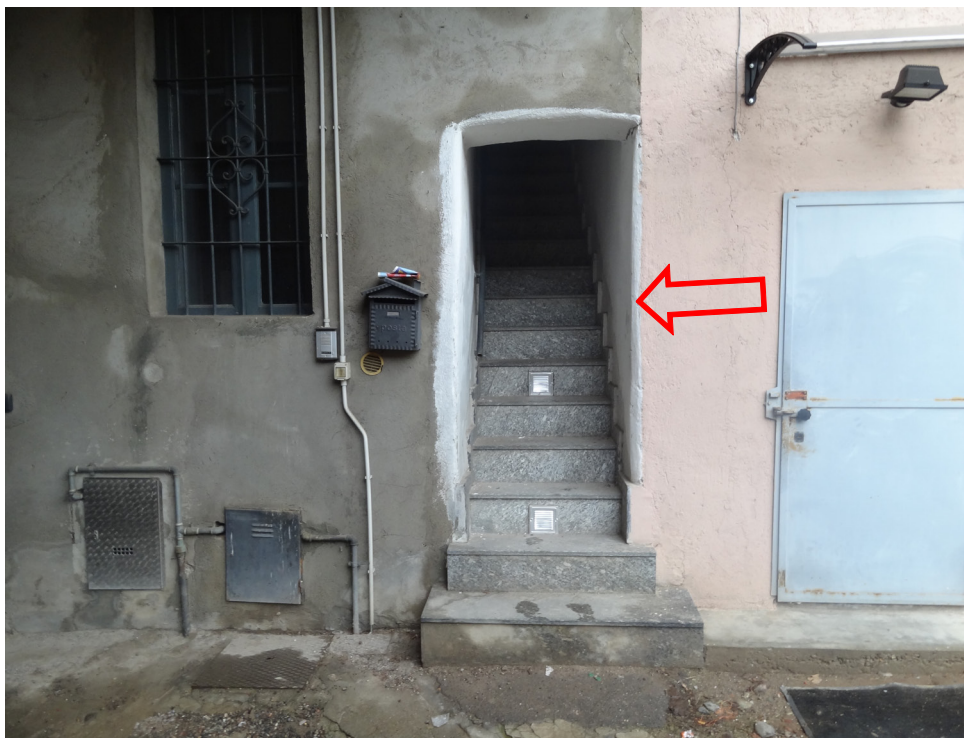
Foto esterna - scala d'accesso al cespite