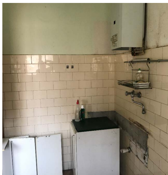
Foto n. 8 Cucina