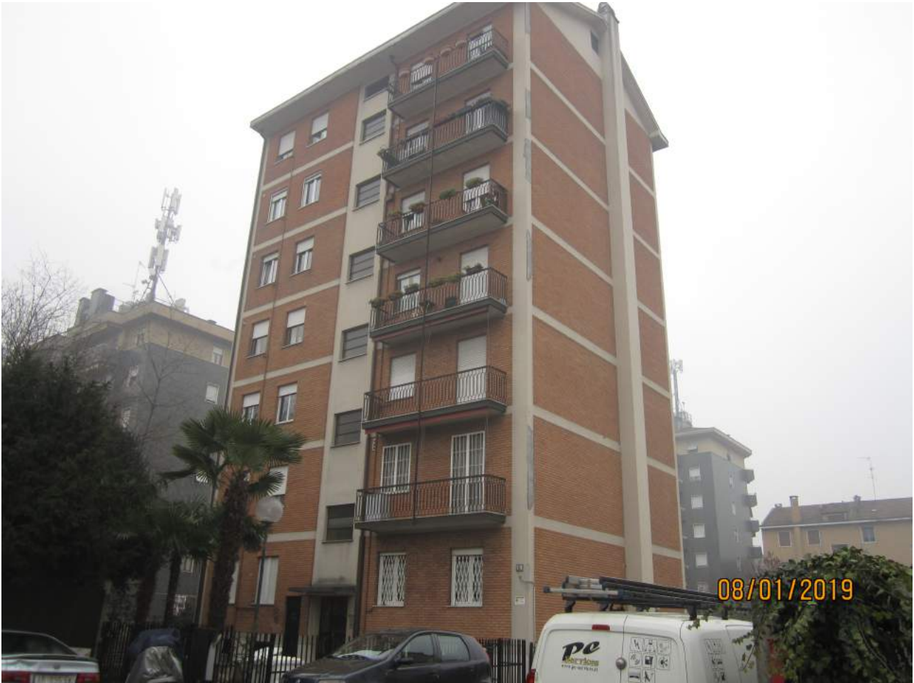
FOTO N. 1 PROSPETTO PALAZZINA