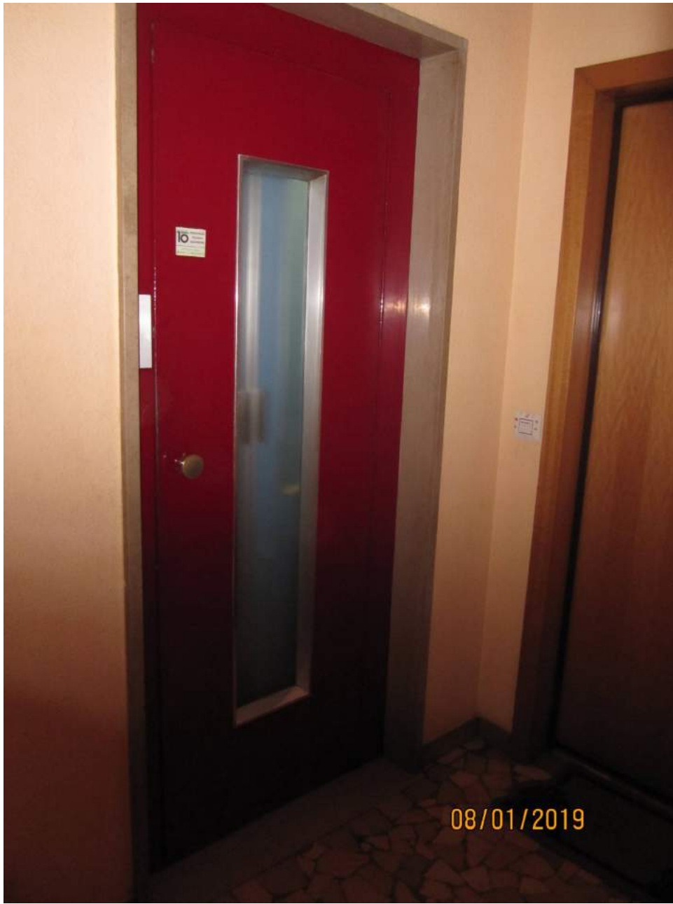
FOTO N. 6 ASCENSORE