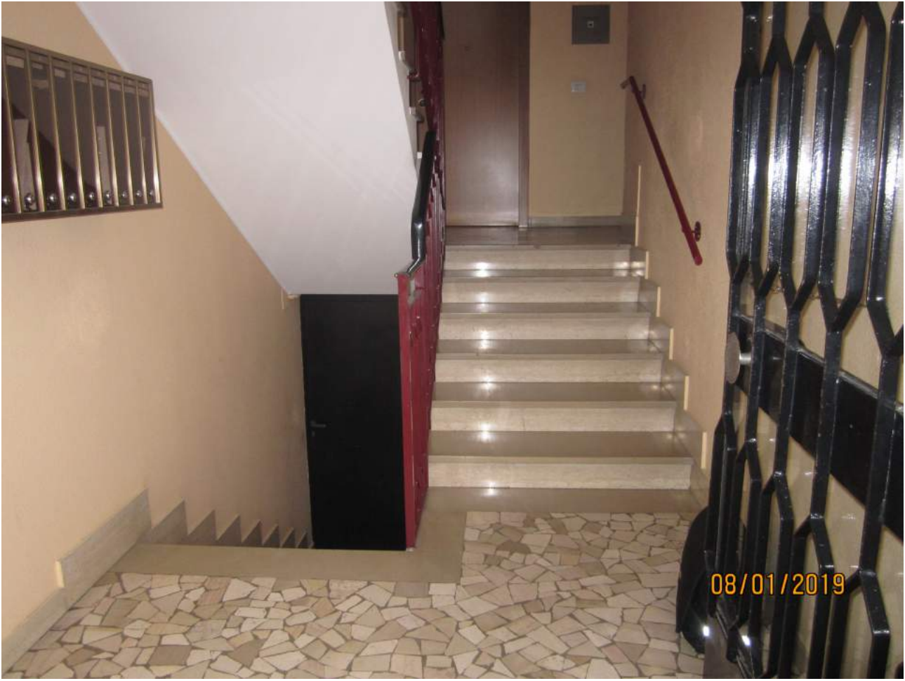
FOTO N. 5 ATRIO INGRESSO E SCALA COMUNE