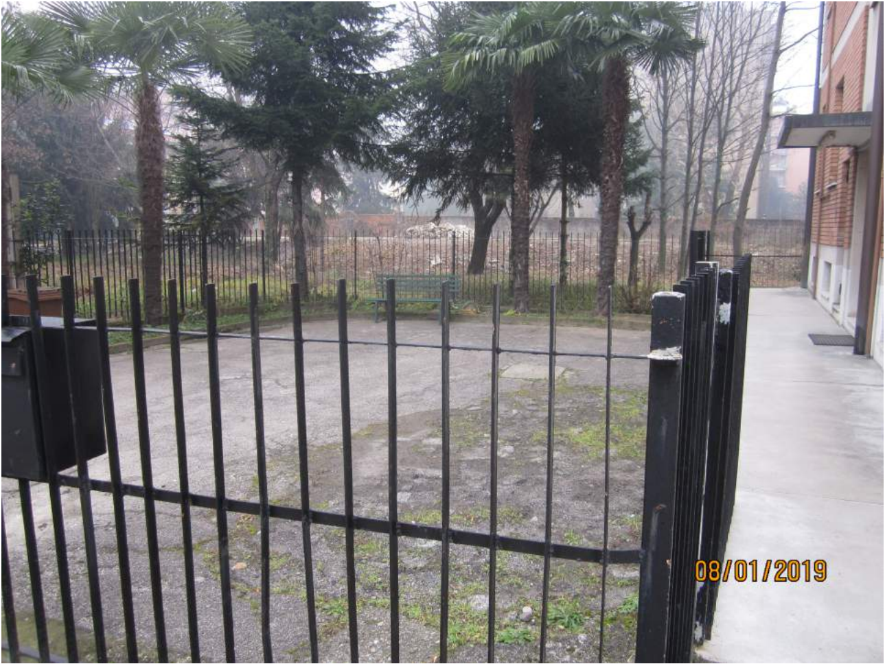
FOTO N. 4 AREA CORTILIZIA