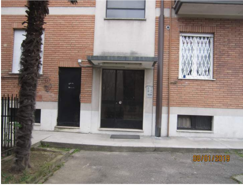
FOTO N. 2 INGRESSO FABBRICATO