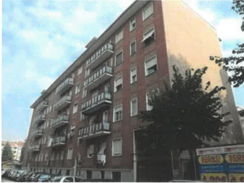
Esterno – Accesso da via Diaz