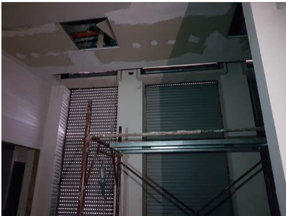
FOTO 5: MILANO, VIALE RAPISARDI 3, zona giorno dettagli finestre e plafone FOTO 6: MILANO, VIALE RAPISARDI 3, zona giorno dettaglio parete e plafone