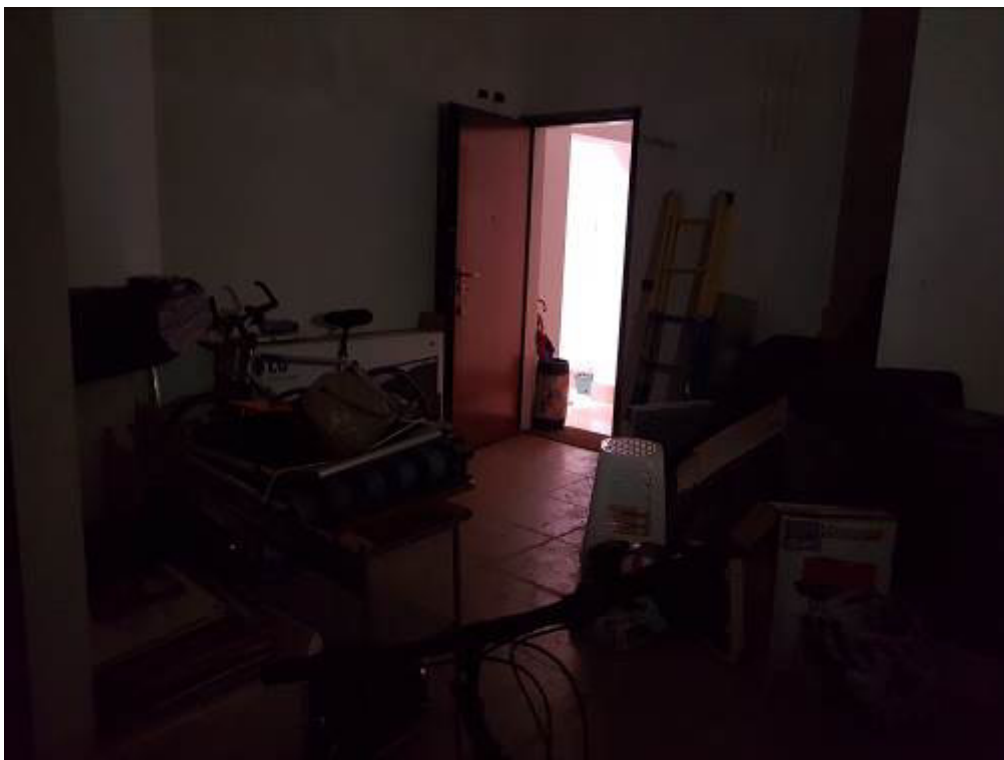
FOTO 4: MILANO, VIALE RAPISARDI 3, zona giorno vista porta d'ingresso