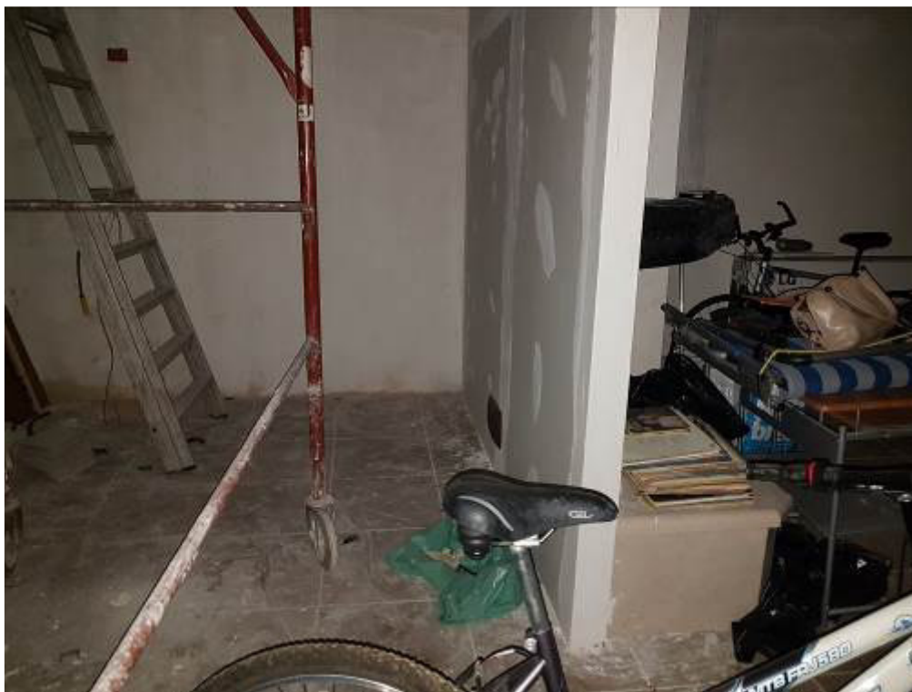
FOTO 7: MILANO, VIALE RAPISARDI 3, zona giorno parete e pavimentazione FOTO 8: MILANO, VIALE RAPISARDI 3, zona giorno dettaglio camino