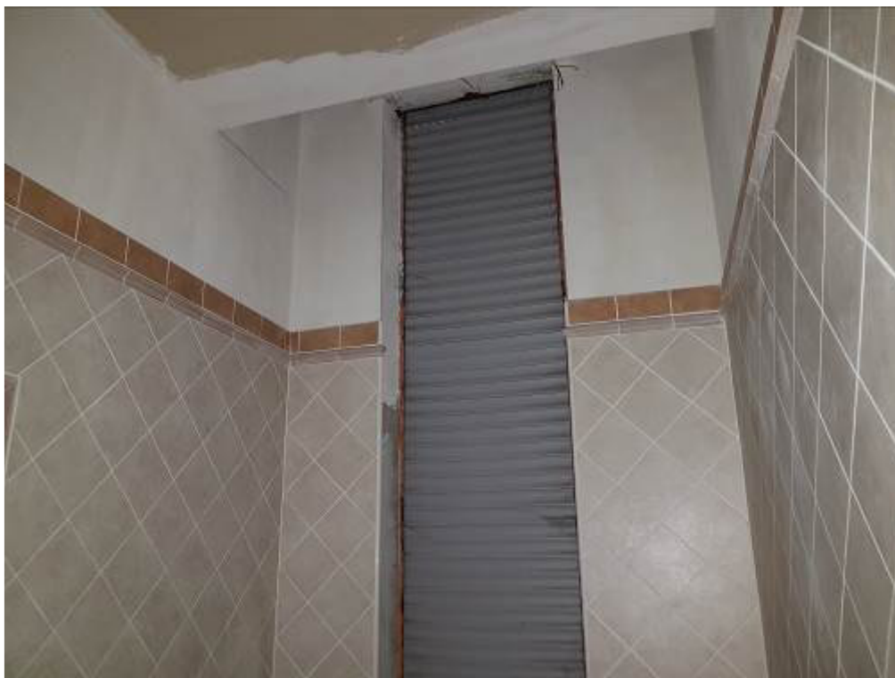
FOTO 11: MILANO, VIALE RAPISARDI 3, bagno dettaglio finestra e plafone FOTO 12: MILANO, VIALE RAPISARDI 3, bagno dettaglio doccia