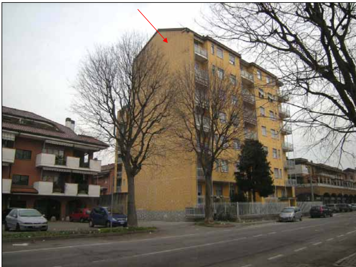
Foto 1 – Vista d'insieme della via Cavour. Il fabbricato in esame indicato dalla freccia.