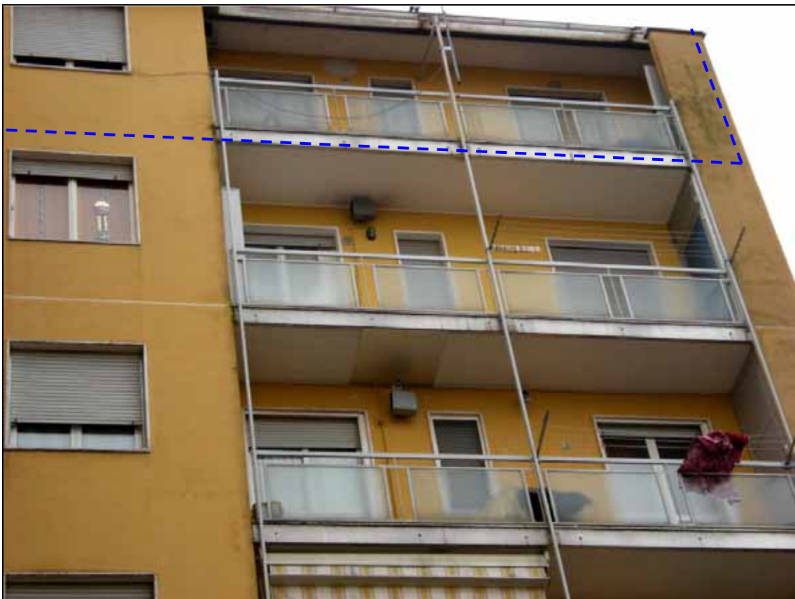
Foto 12 – Il prospetto nord con l'unità in esame delimitata dal tratteggio.