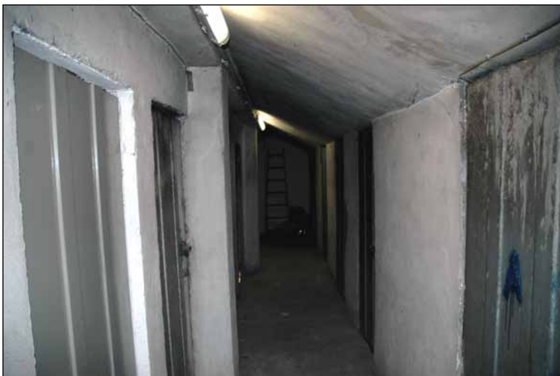
Foto 22 – Vista d'insieme del corridoio comune al piano sottotetto.