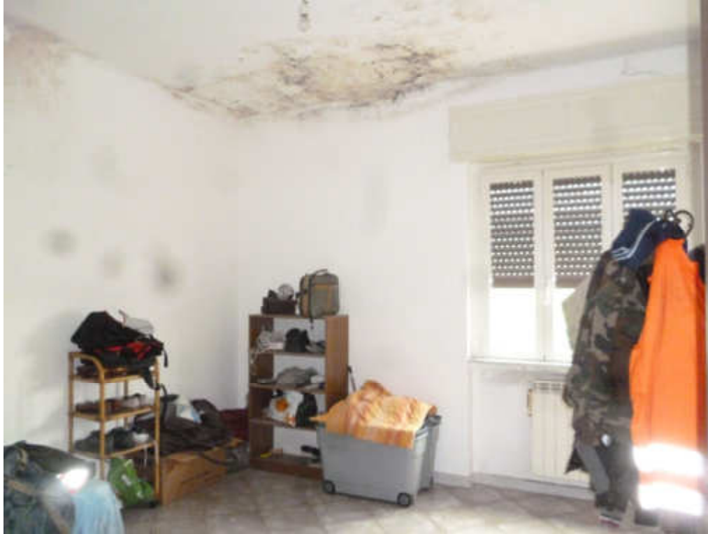
FOTO 11 – Camera da letto, a soffitto tracce di infiltrazioni meteoriche