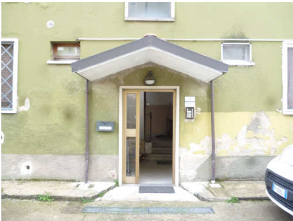
FOTO 2 – Portone di ingresso all'edificio in cui al secondo piano si trova l'unità A pignorata