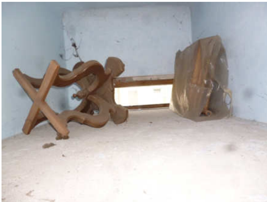
FOTO 14 – Particolare del controsoffitto finestrato sovrastante il locale bagno