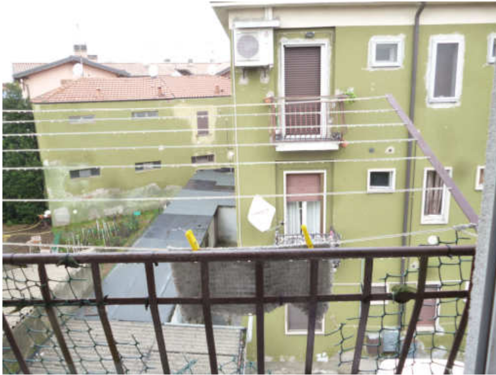
FOTO 15 – Vista dal balcone e sottostante costruzione corpi cantina esterni (unità B)