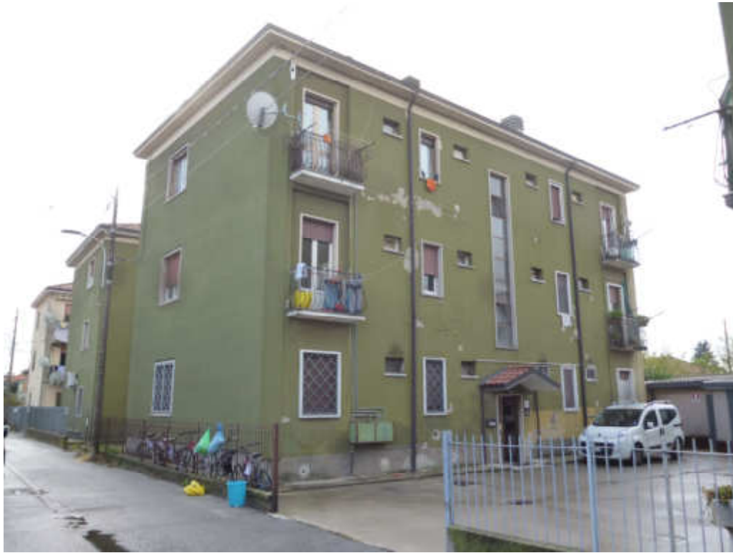
FOTO 1 – Edificio sito in Pozzo d'Adda, Via Don Arturo Piazza 8 con accesso pedonale dal cortile comune