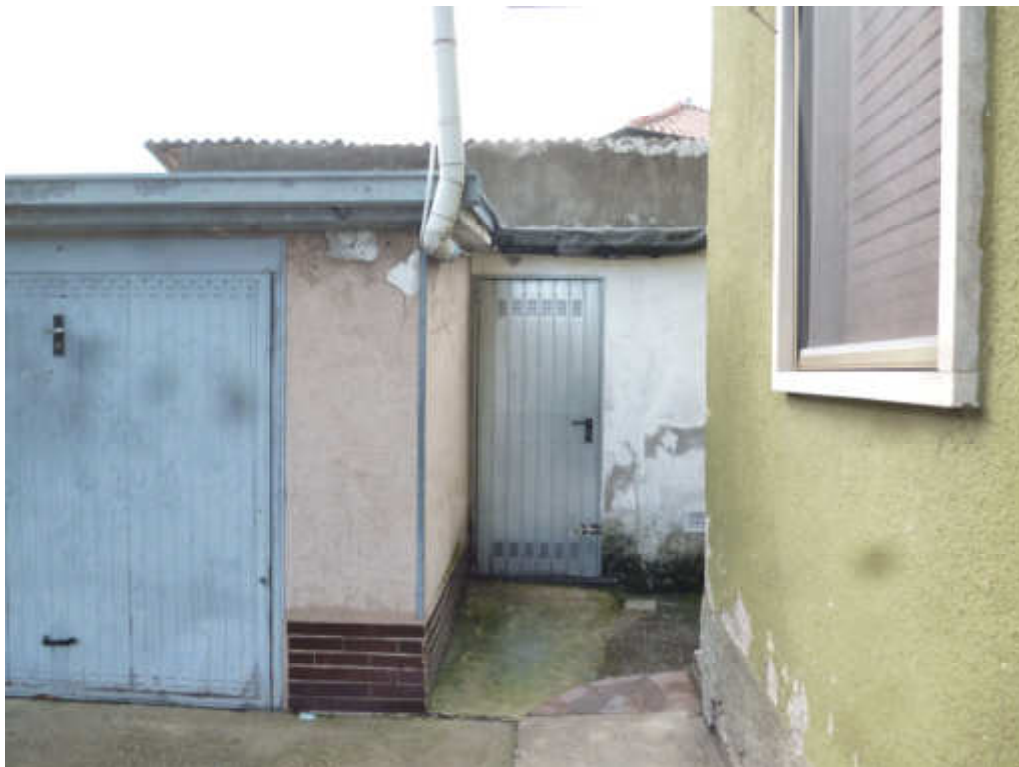
FOTO 16 – Posizionamento e porta cantina corrispondente all'unità B