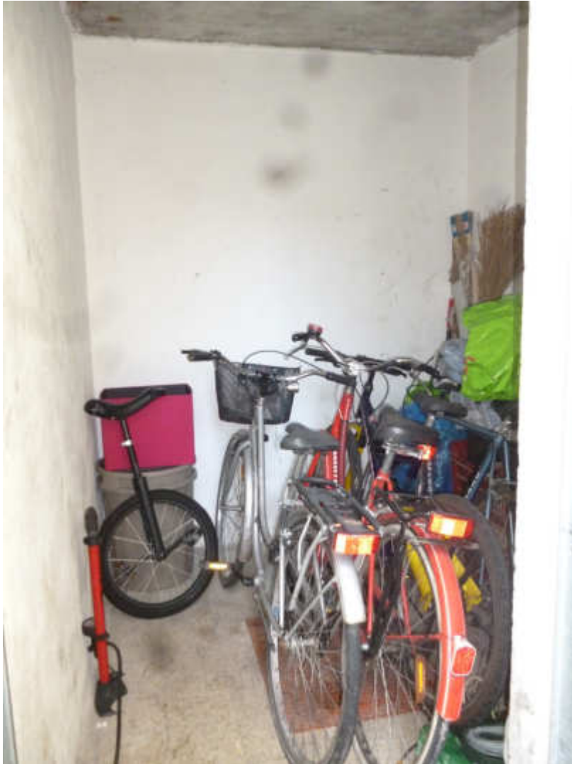
FOTO 17 – Unità B cantina, a pavimento botola impianto condominiale