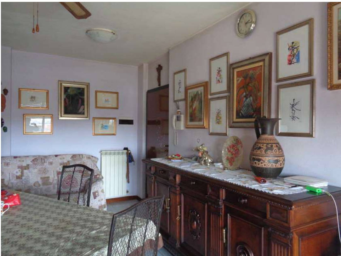
Immagine. 6. Soggiorno