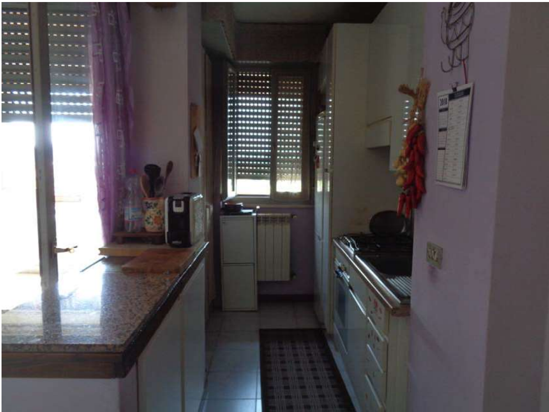
Immagine. 8. Vista cucina