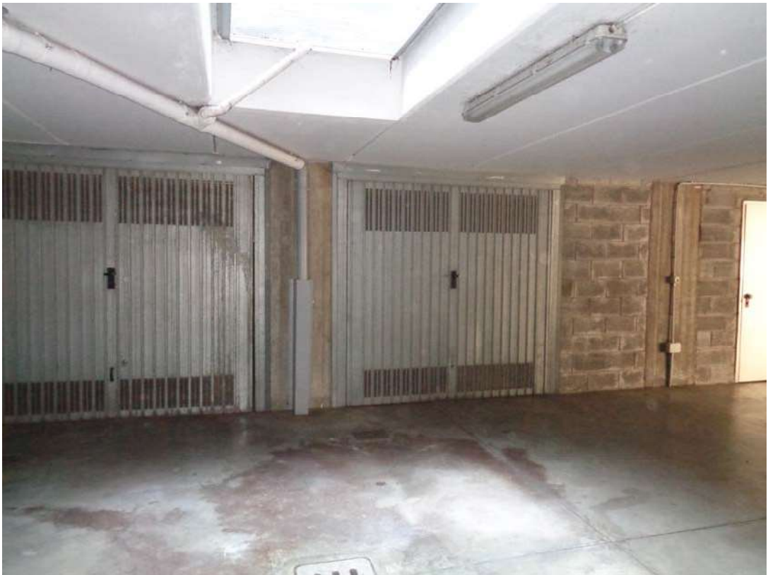
Immagine. 12. Corsello box