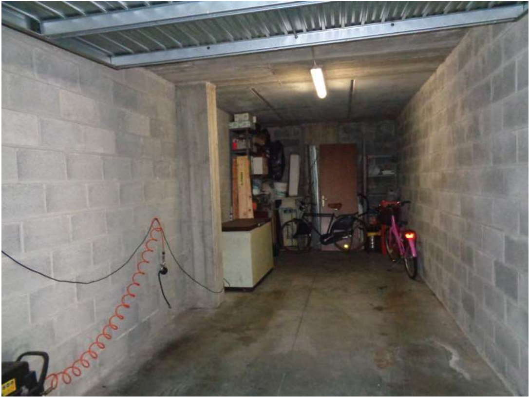
Immagine. 13. Interno box