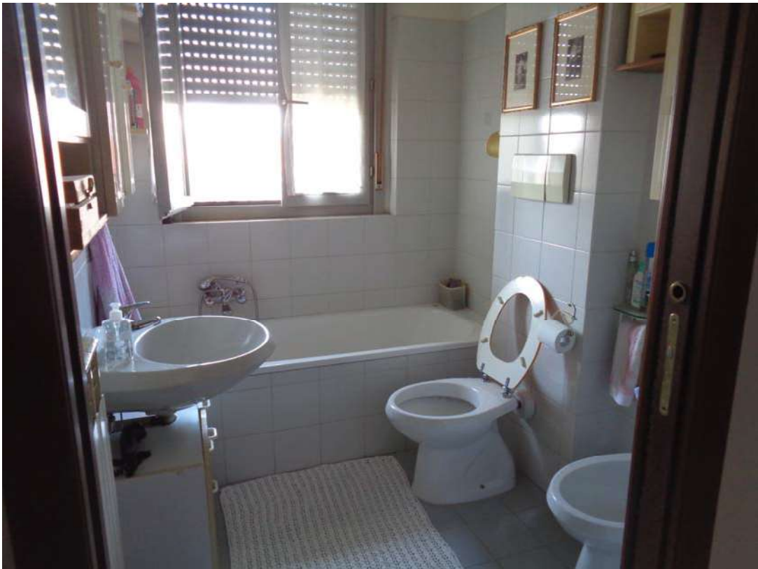
Immagine. 10. Bagno