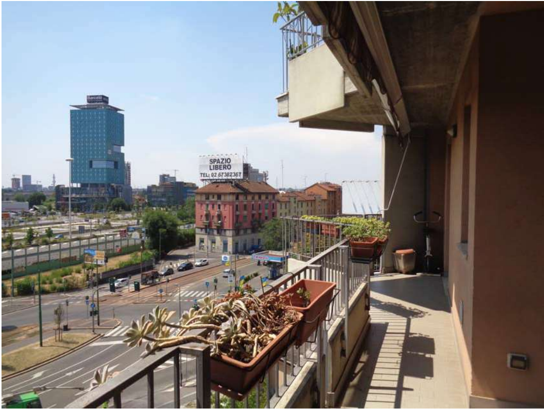
Immagine. 9. Balcone.