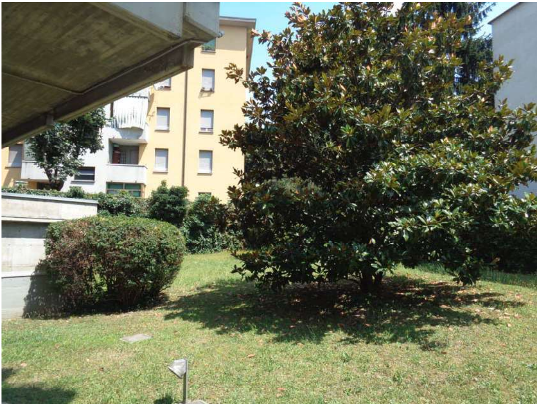
Immagine. 4. Vista cortile comune.