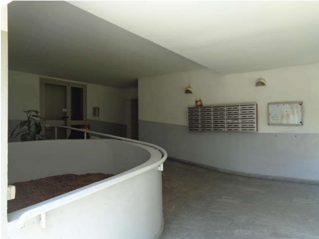
Immagine. 5. Ingresso dell'edificio.