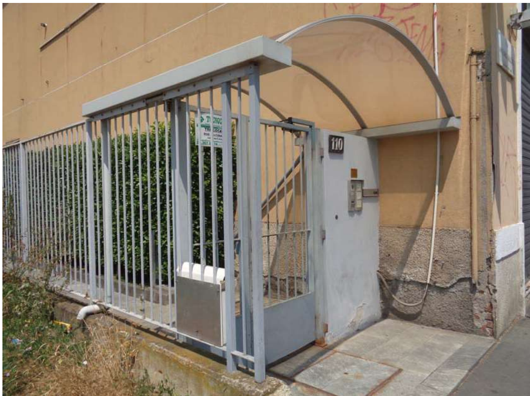
Immagine. 2. Ingresso pedonale da via Aldini