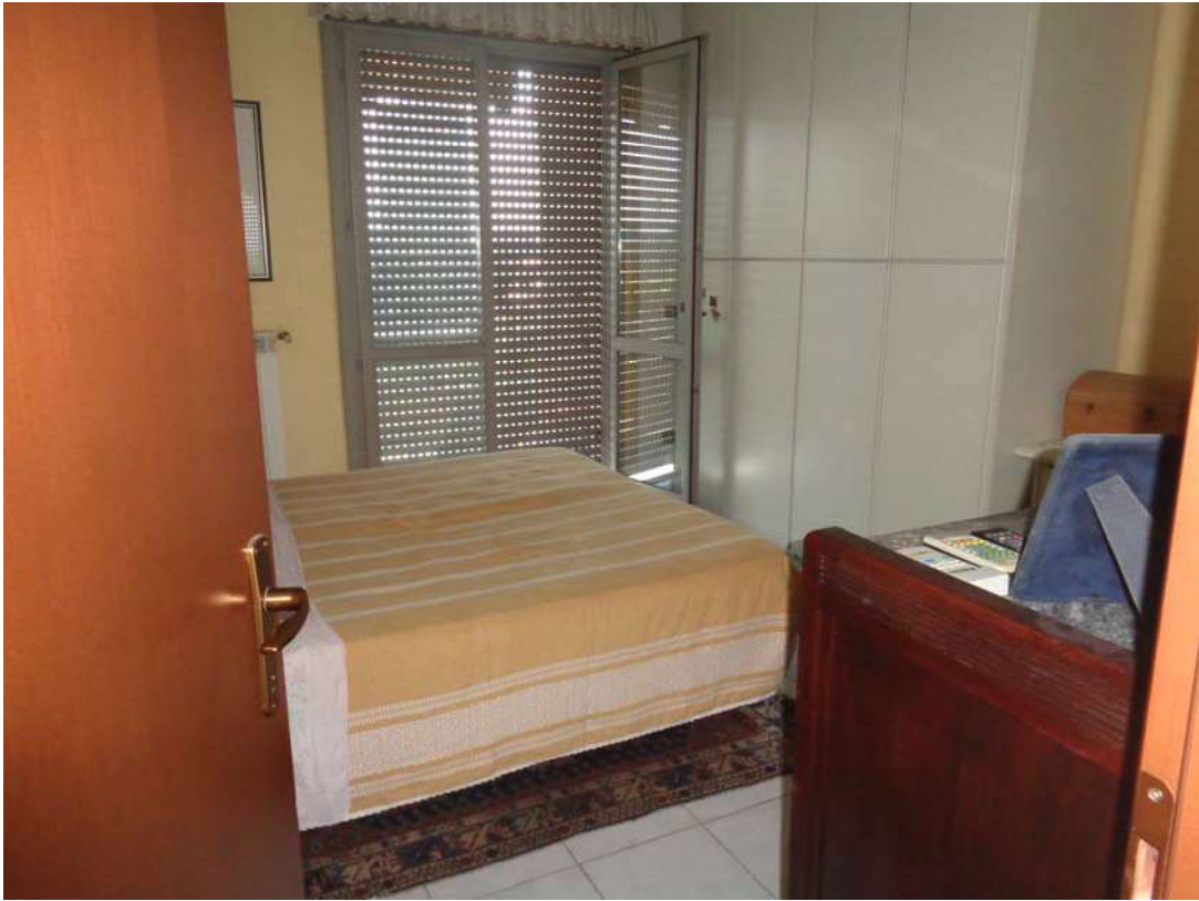
Immagine. 7. Camera da letto