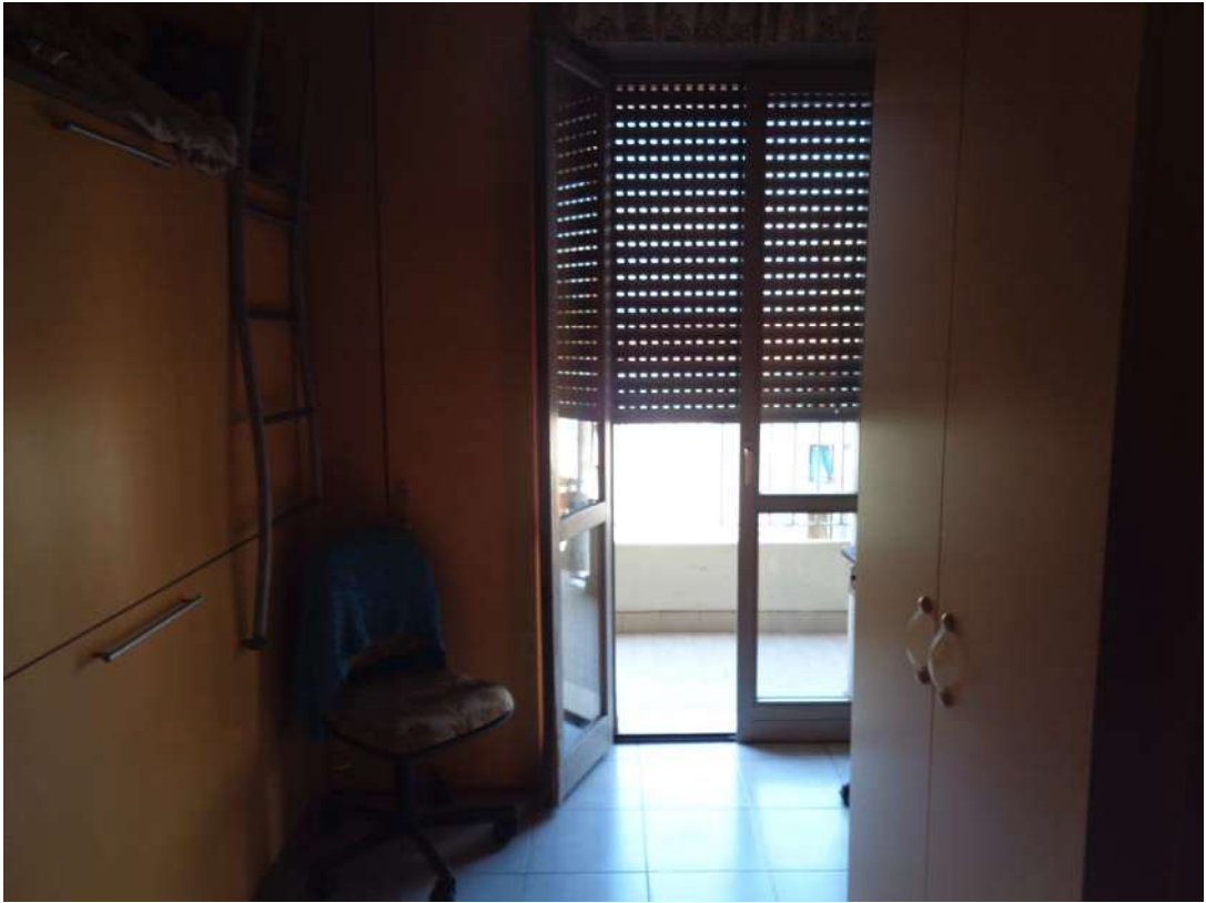
Immagine. 11. Seconda camera