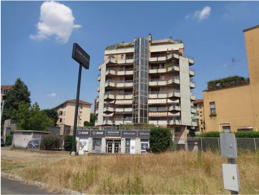
Immagine. 3. Da Largo Umberto Boccioni .