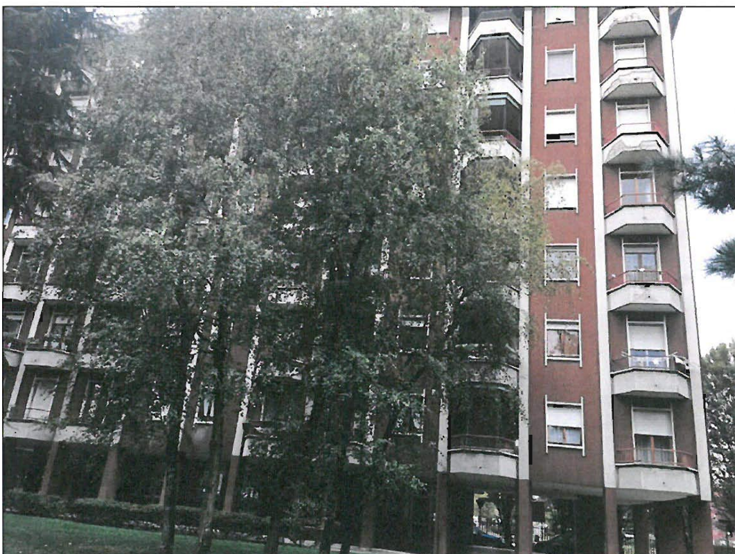
PROSPETTO EST SU AREA A VERDE