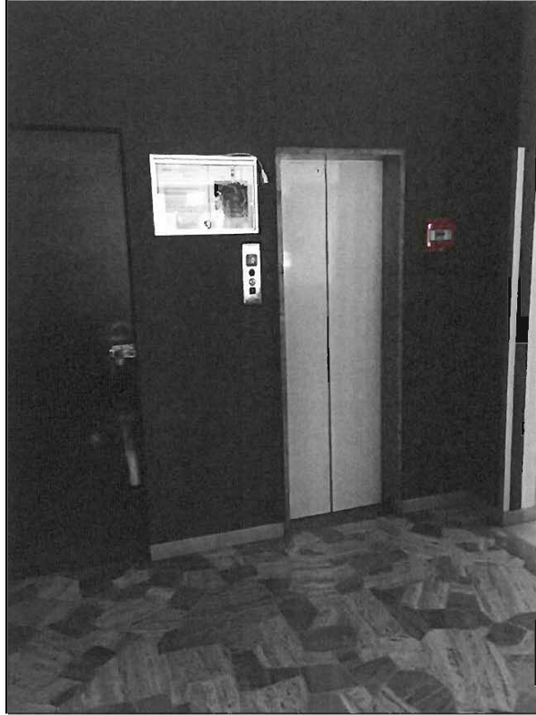
ATRIO PIANO TERRENO