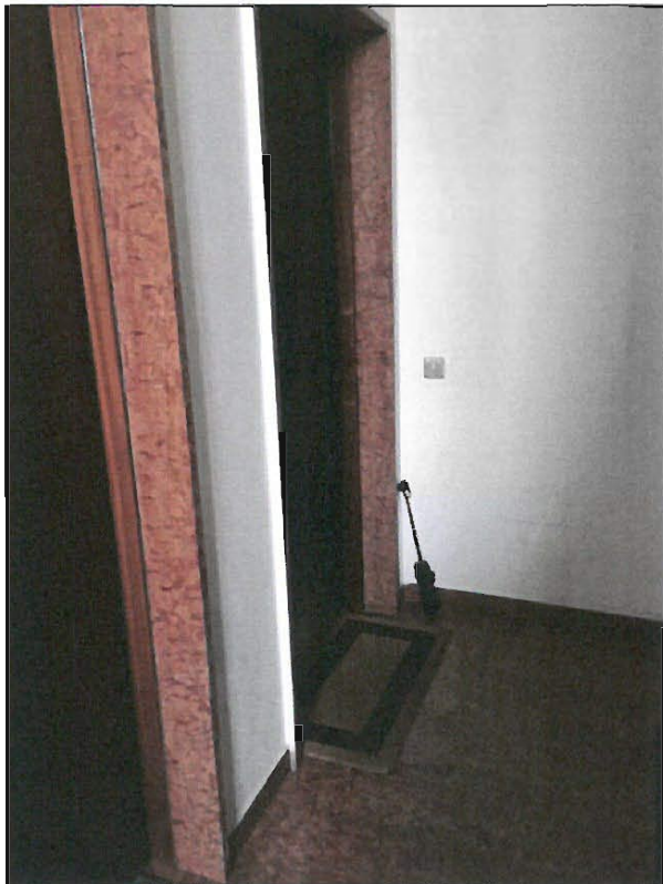
INGRESSO UNITA' IMMOBILIARE