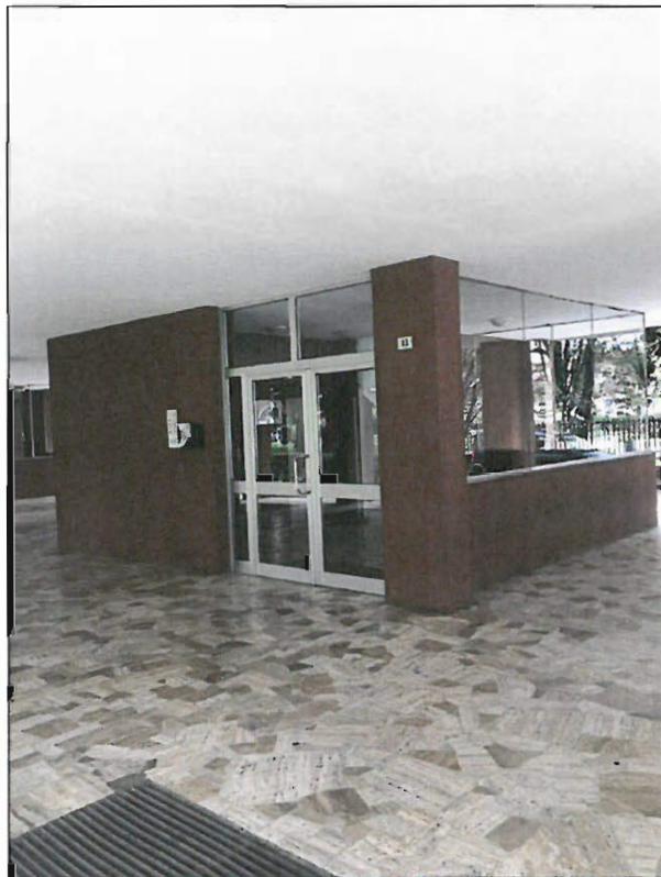
INGRESSO CIV. 125/13 FABBRICATO B - C