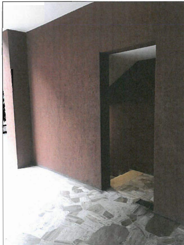
ACCESSO AI BOX