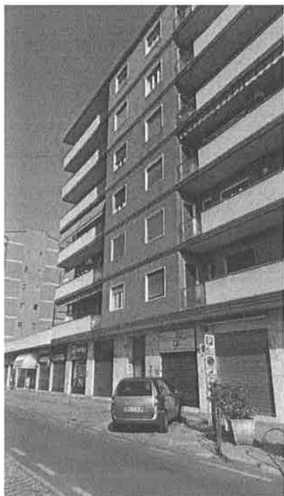
VIA L. DA VINCI, 110 - FACCIATA