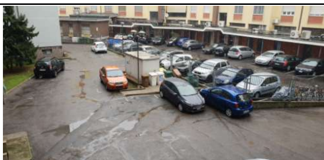
Immobile in via L. Da Vinci, 70 Trezzano S. Naviglio: cortile interno