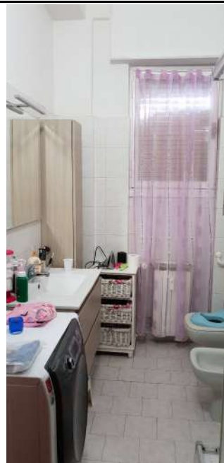
U.I. in via L. Da Vinci, 70 Trezzano S. Naviglio: bagno