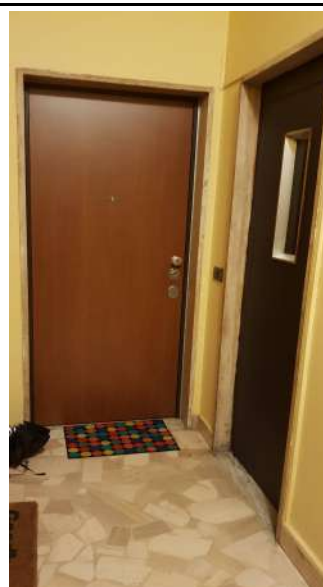
U.I. in via L. Da Vinci, 70 Trezzano S. Naviglio: porta di ingresso