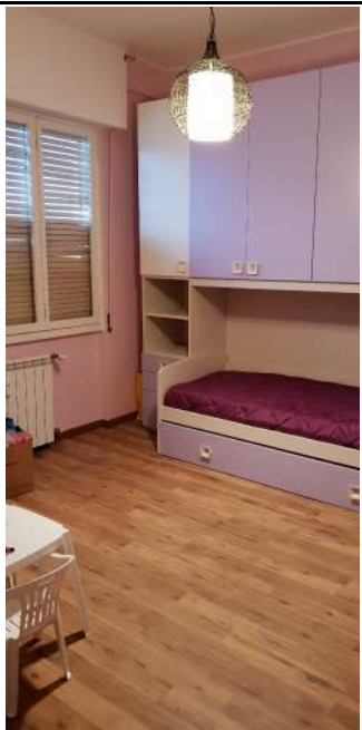
U.I. in via L. Da Vinci, 70 Trezzano S. Naviglio: camera