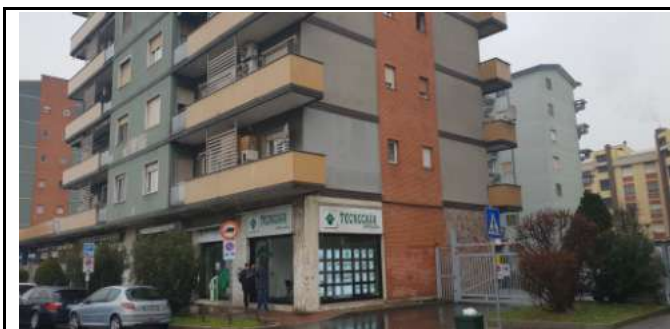
Immobile in via L. Da Vinci, 70 Trezzano S. Naviglio: immobile fronte strada