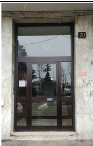
Immobile in via L. Da Vinci, 70 Trezzano S. Naviglio: portone di ingresso