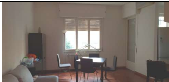
U.I. in via L. Da Vinci, 70 Trezzano S. Naviglio: soggiorno altra foto