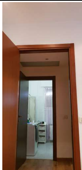
U.I. in via L. Da Vinci, 70 Trezzano S. Naviglio: dsimpegno