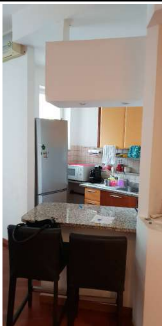
U.I. in via L. Da Vinci, 70 Trezzano S. Naviglio: angolo cottura