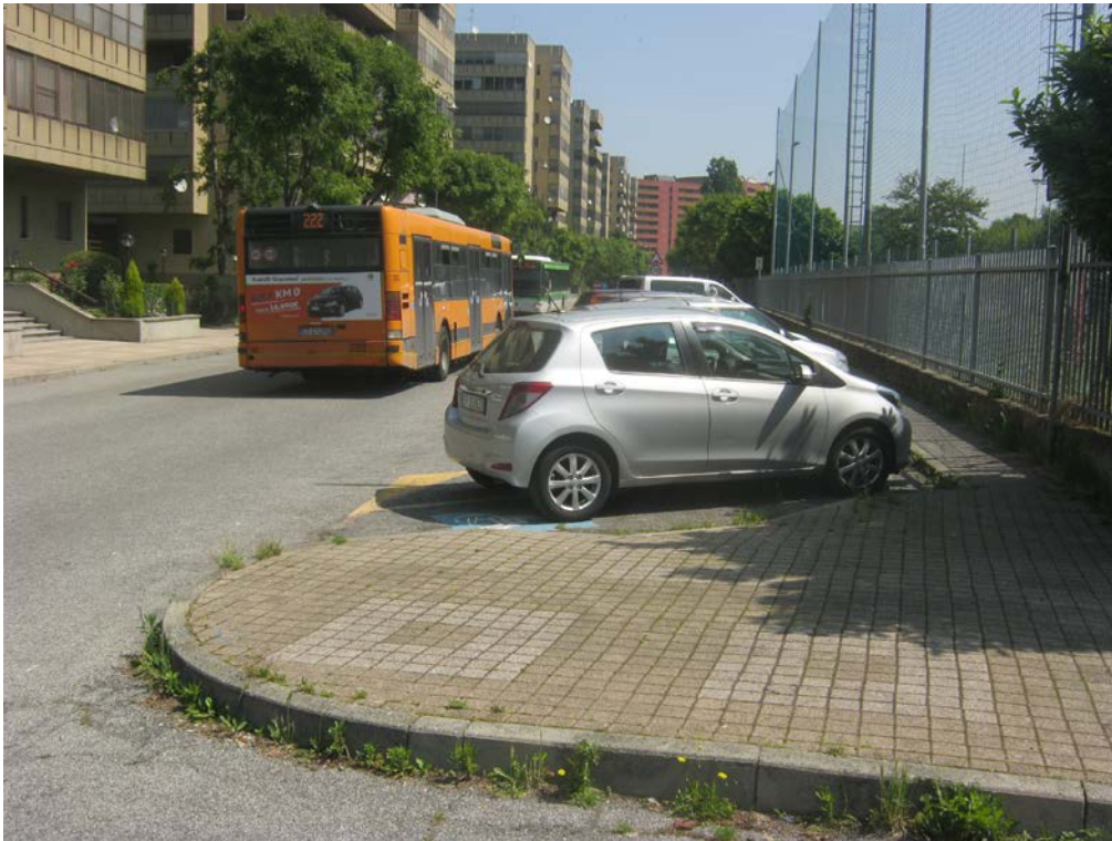
Rampa di accesso al corpo box

Immobile ubicato in Comune di Pieve Emanuele, via Delle Betulle Procedura di Esecuzione Immobiliare N. 2395/2017 del Tribunale di Milano