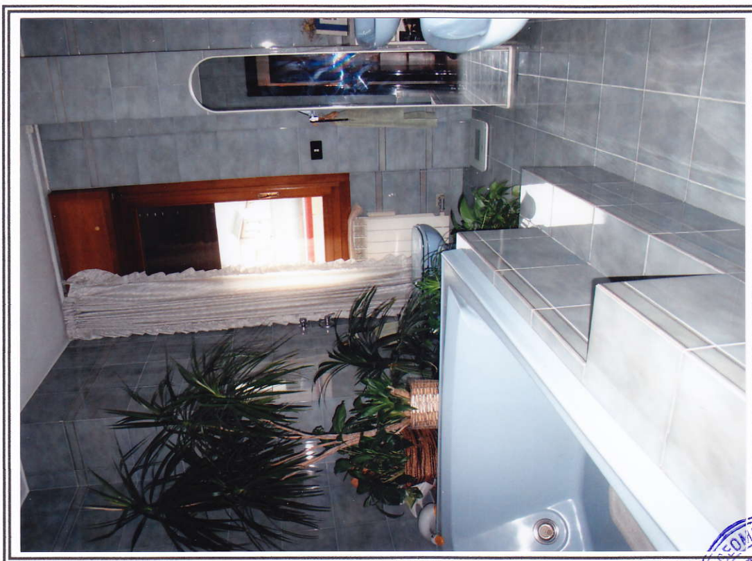
Interno appartamento – bagno principale