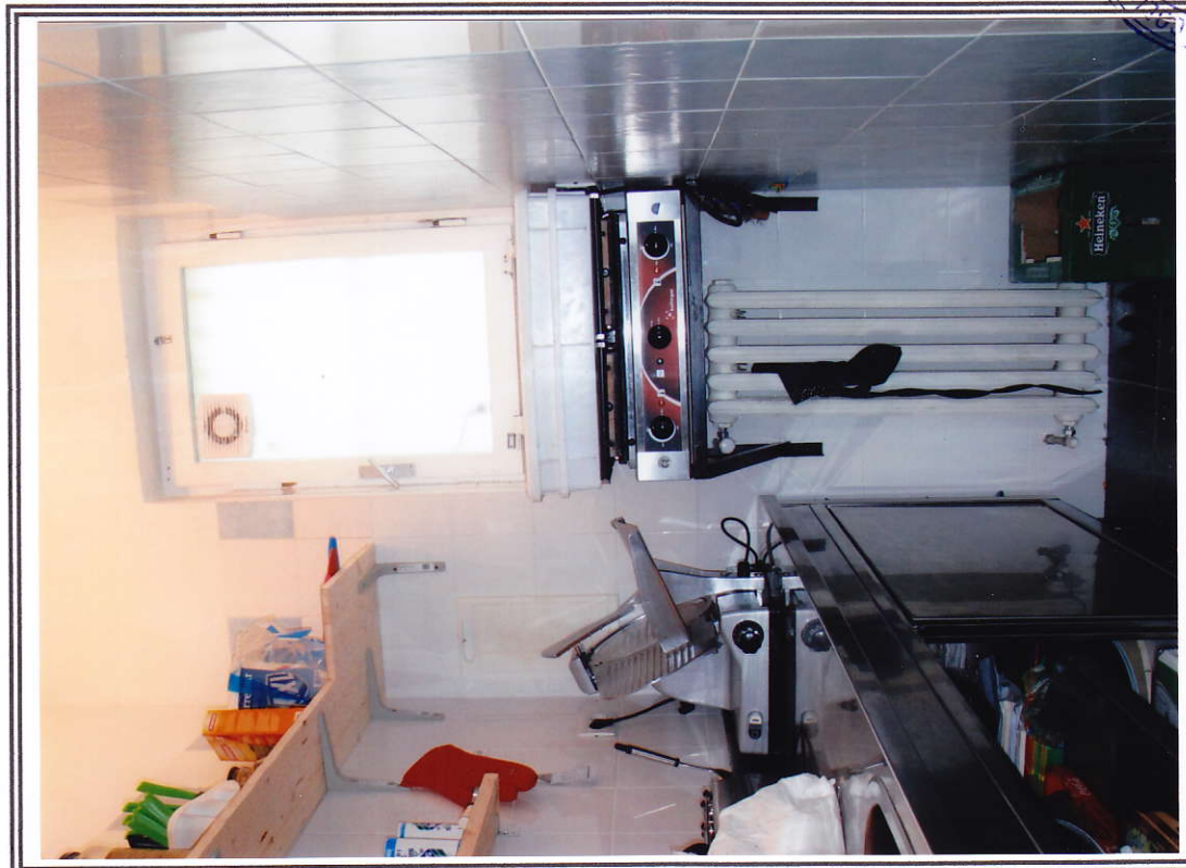
Interno negozio (sub. 13 e sub. 14)