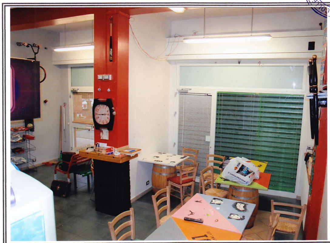
Interno negozio (sub. 13 e sub. 14)