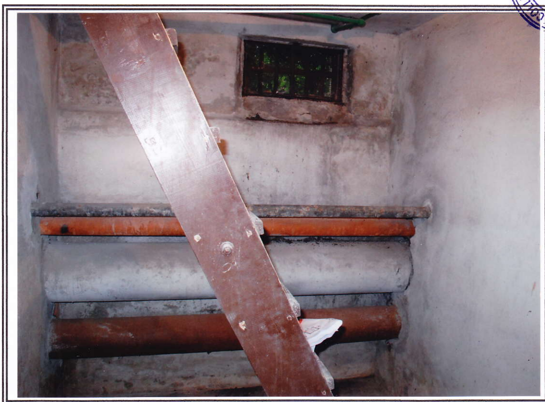
Interno negozio (sub. 13 e sub. 14) – cantina sub. 14