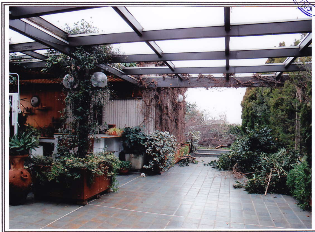
Interno appartamento – terrazzo