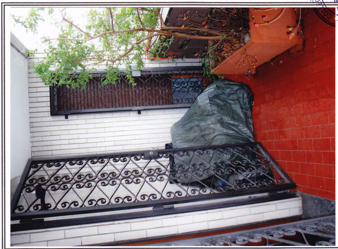
Interno appartamento – balcone