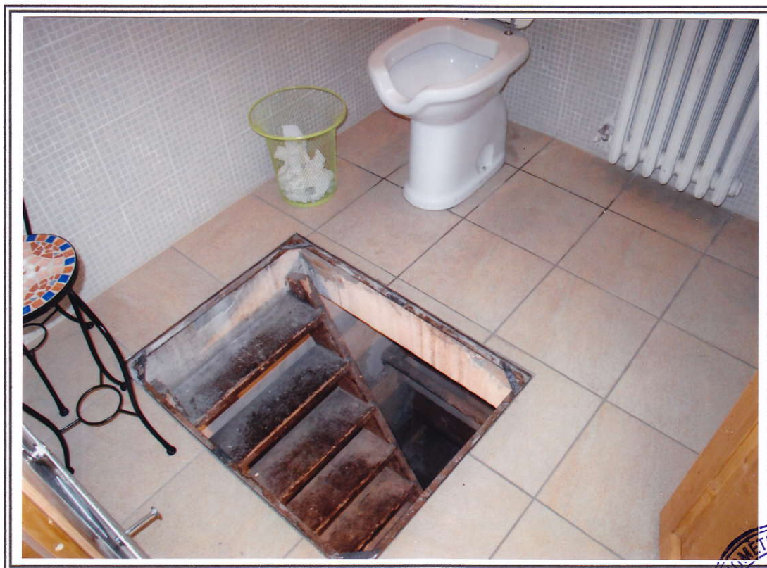
Interno negozio (sub. 13 e sub. 14) – bagno sub. 14