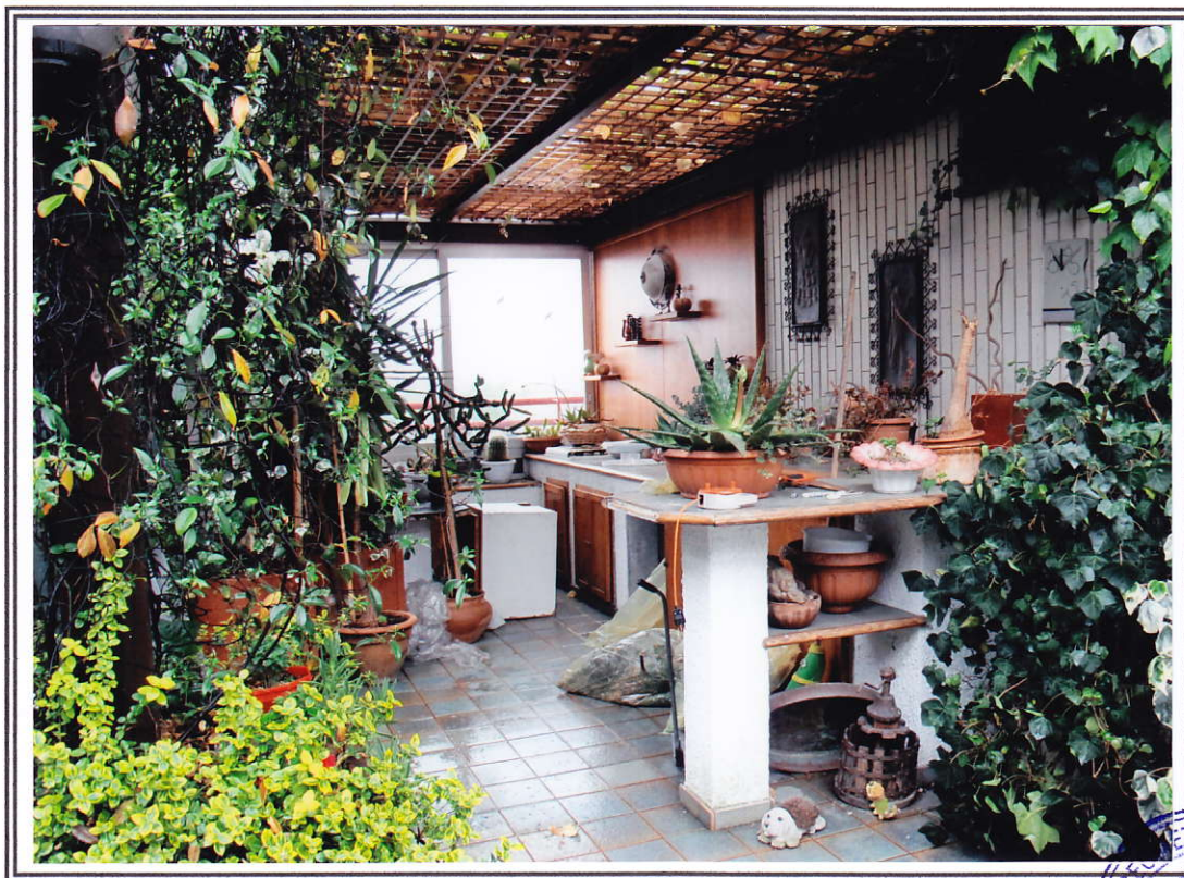
Interno appartamento – terrazzo