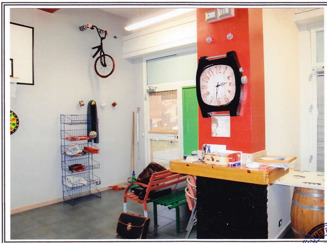
Interno negozio (sub. 13 e sub. 14)