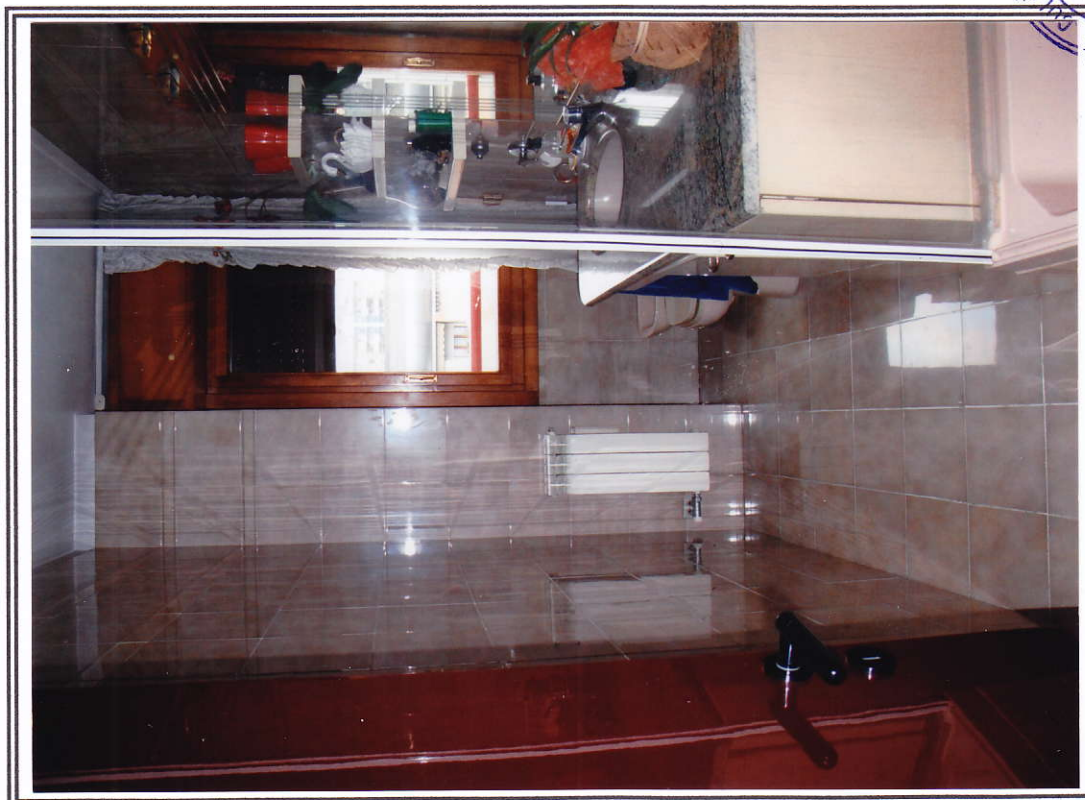
Interno appartamento – bagno secondario