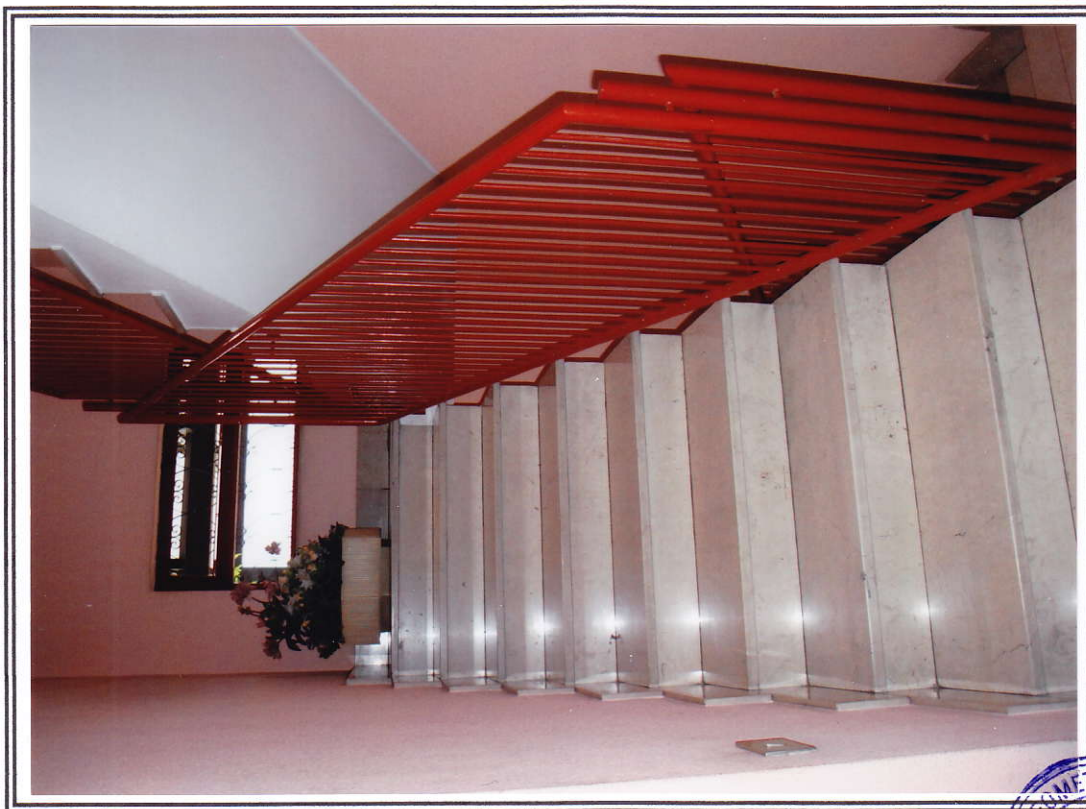
Interno fabbricato – vano scala comune