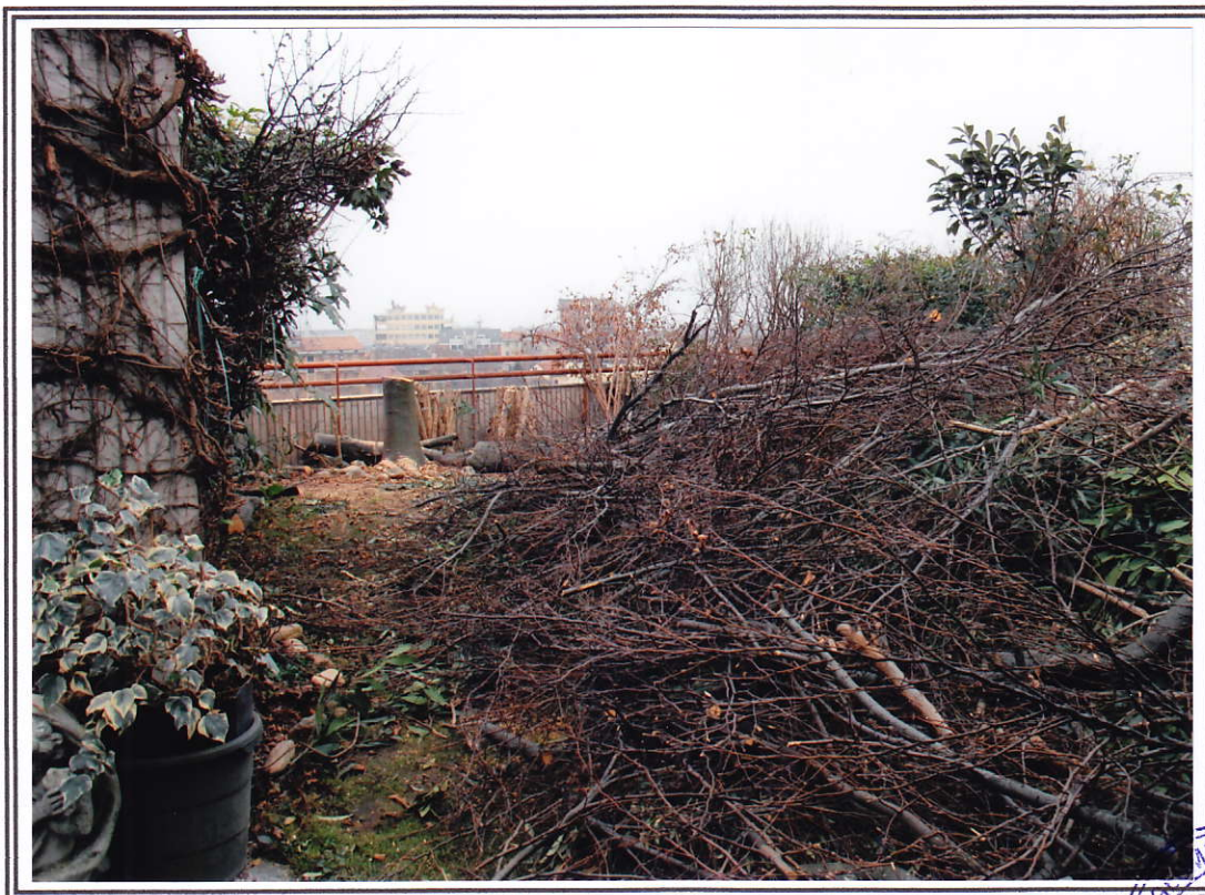
Interno appartamento – terrazzo