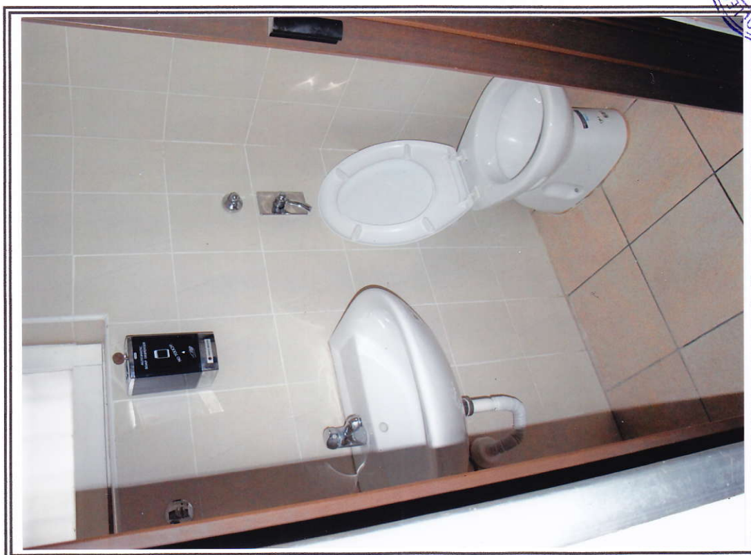
Interno negozio (sub. 13 e sub. 14) – bagno sub. 13