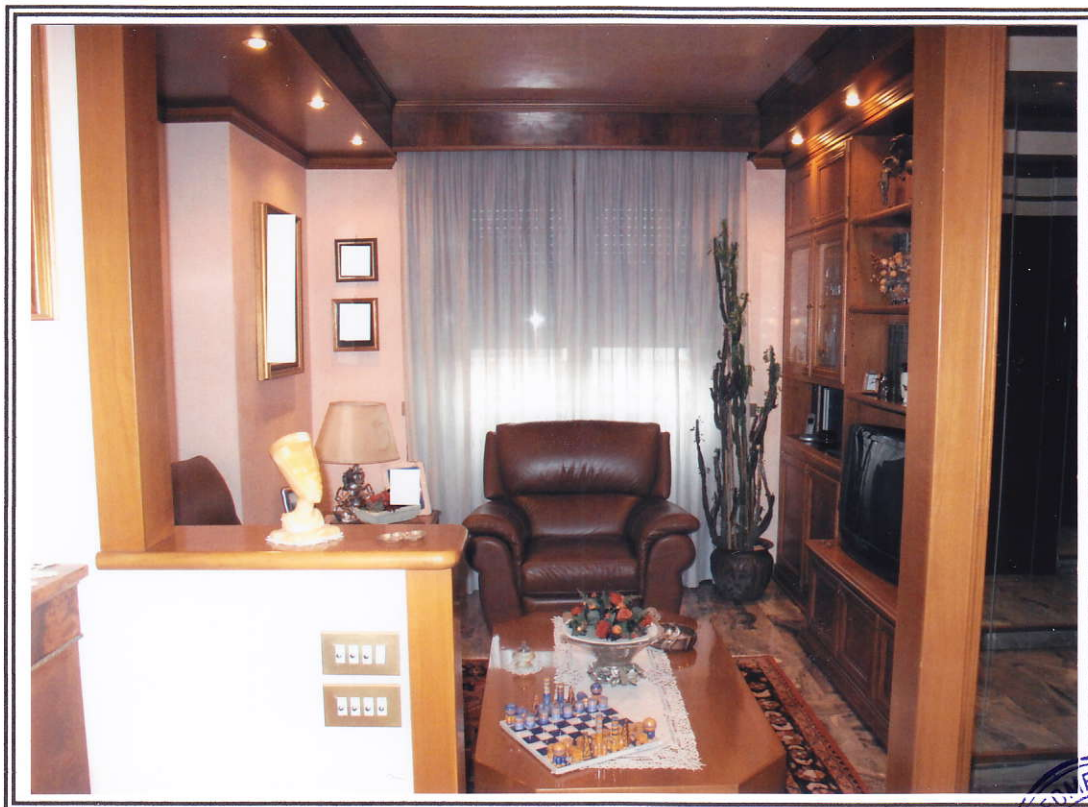
Interno appartamento – soggiorno