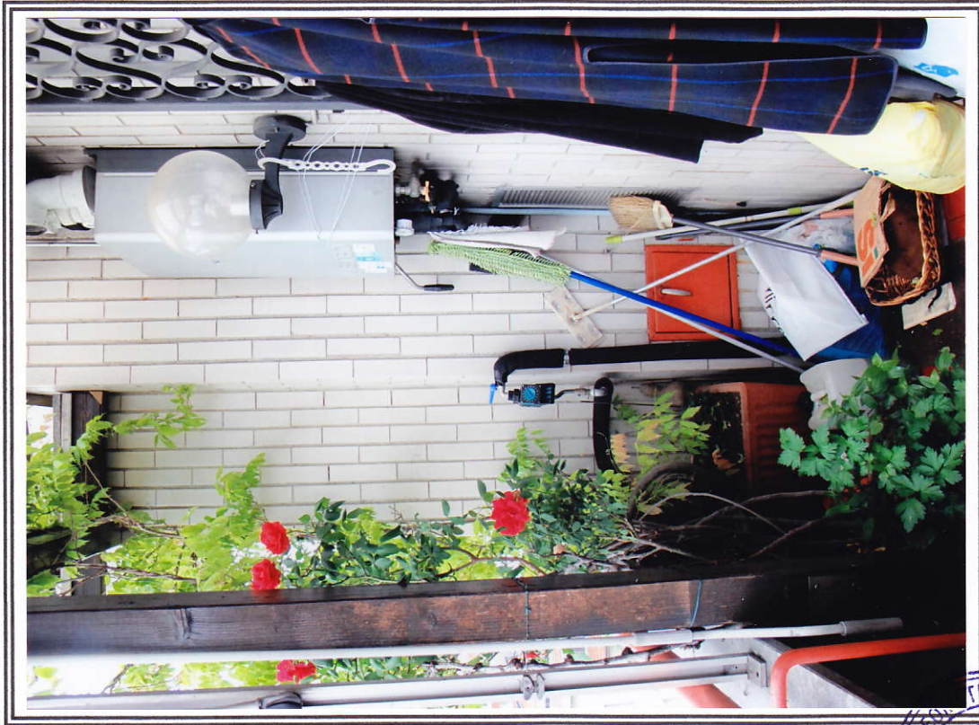
Interno appartamento – balcone