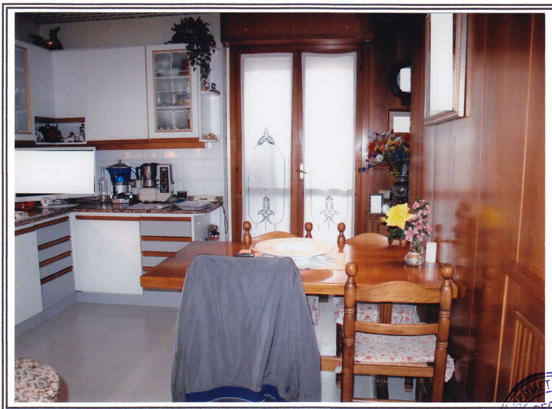
Interno appartamento – cucina