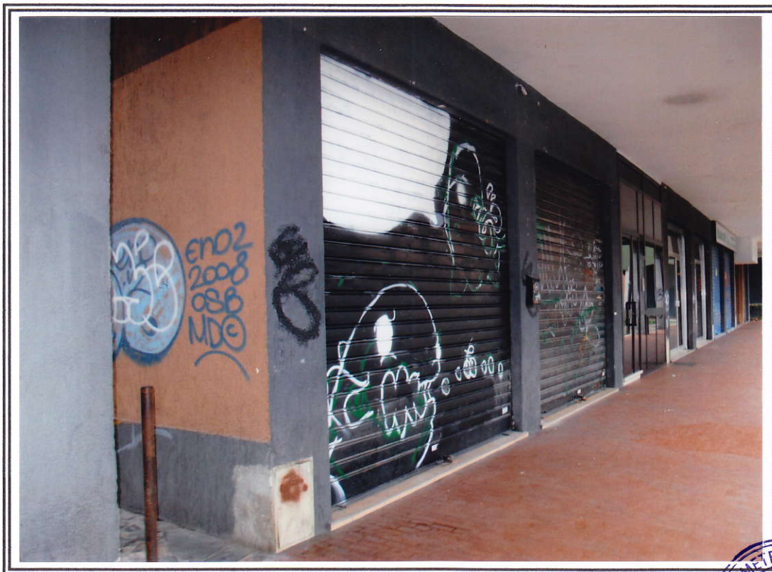
Esterno negozio (sub. 13 e sub. 14)