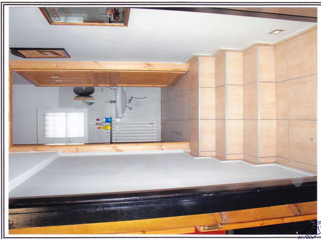
Interno negozio (sub. 13 e sub. 14)