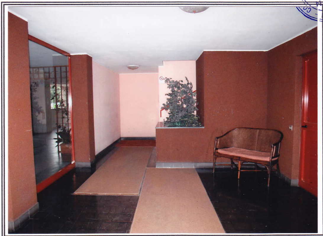
Interno fabbricato – androne comune