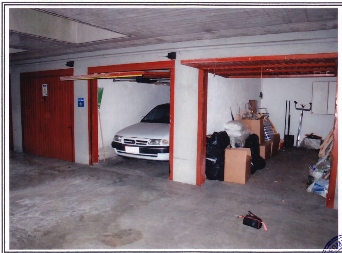
Box sub. 24 e 25