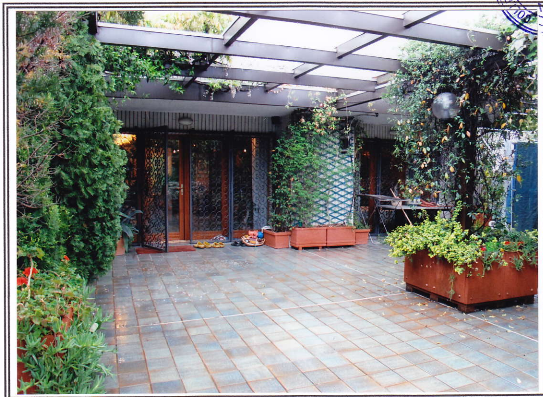
Interno appartamento – terrazzo