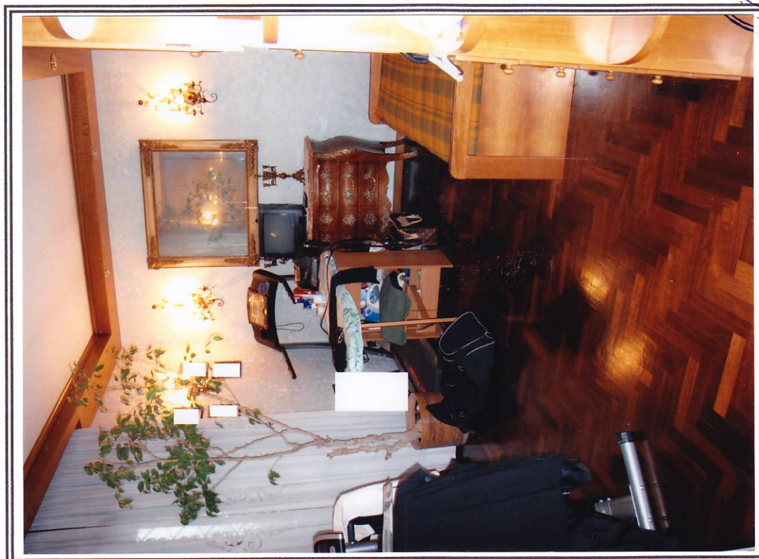
Interno appartamento – camera