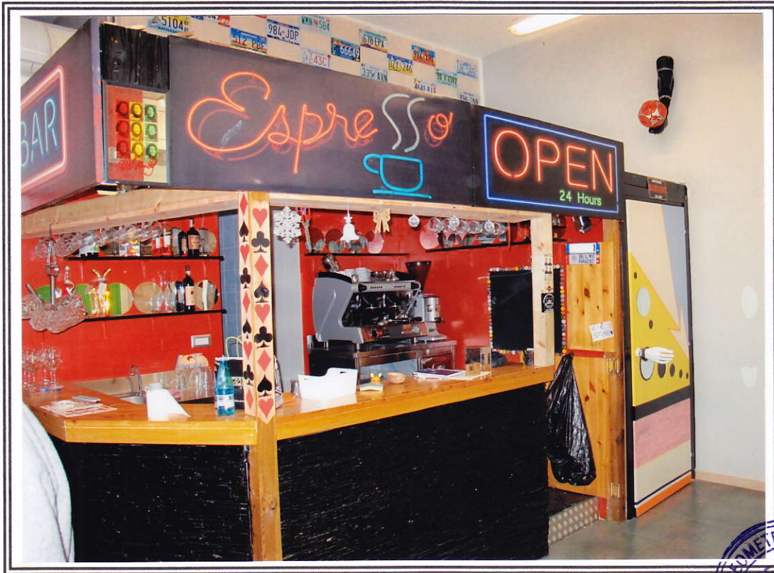
Interno negozio (sub. 13 e sub. 14)