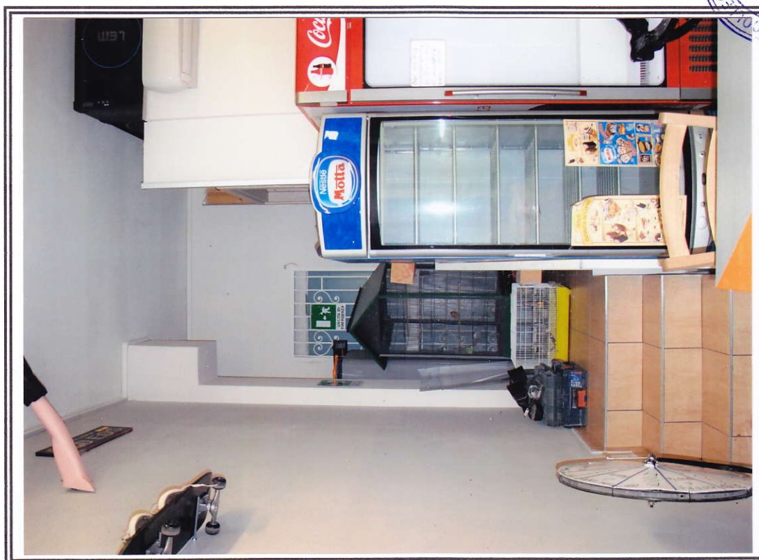
Interno negozio (sub. 13 e sub. 14)