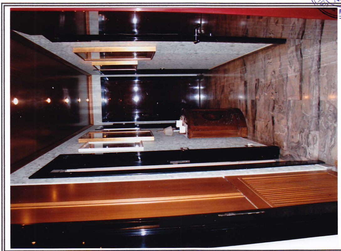
Interno appartamento – corridoio