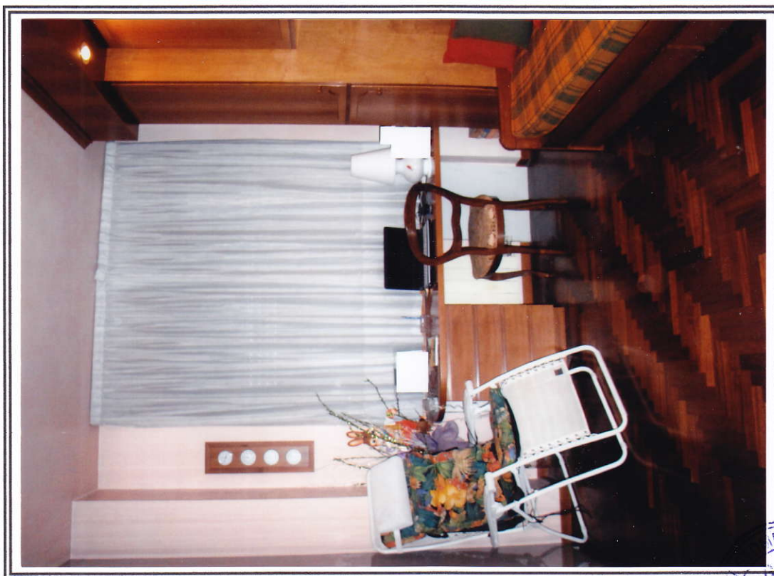
Interno appartamento – camera