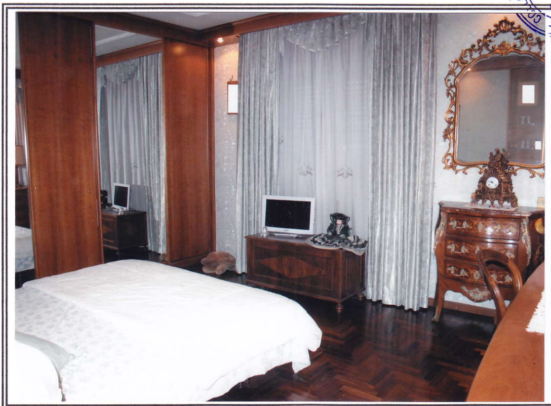
Interno appartamento – camera