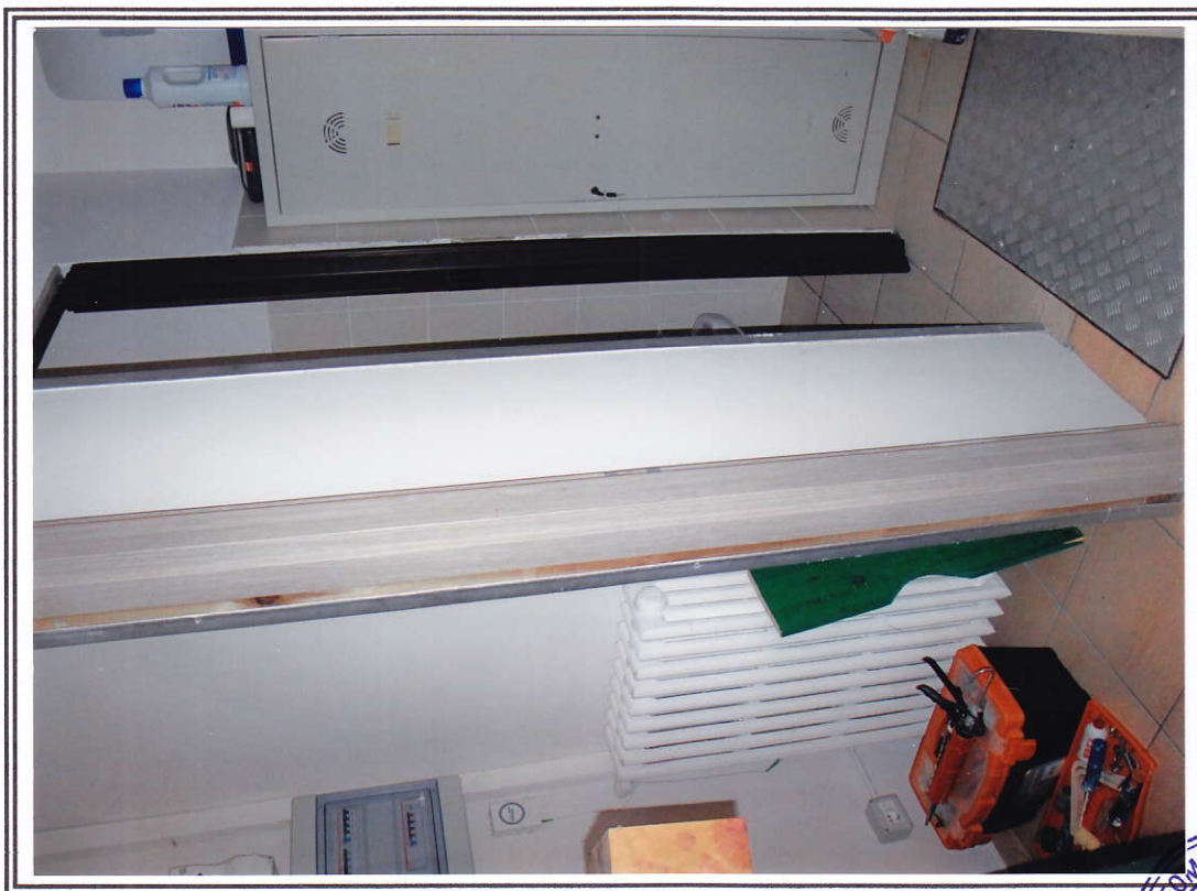
Interno negozio (sub. 13 e sub. 14)