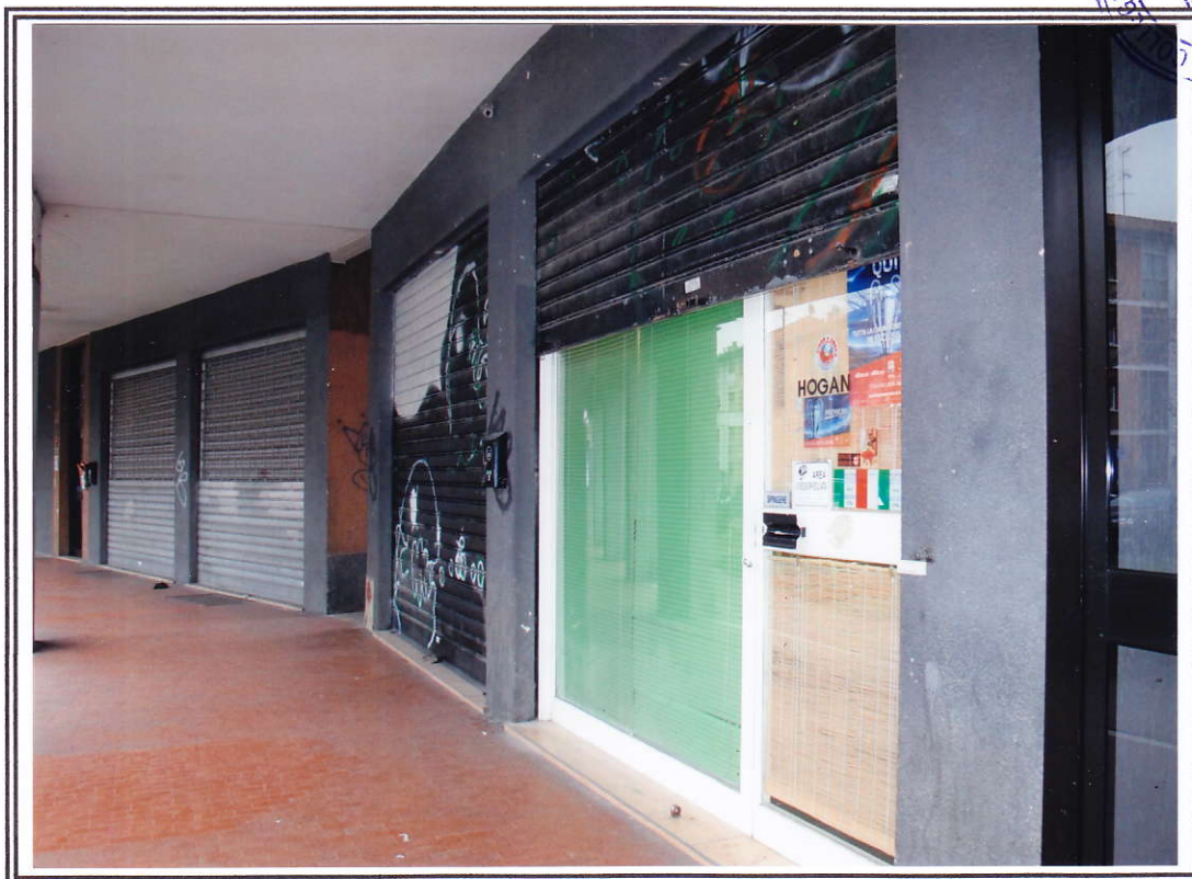
Esterno negozio (sub. 13 e sub. 14)