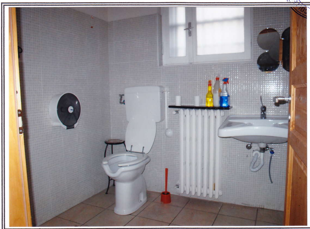
Interno negozio (sub. 13 e sub. 14) – bagno sub. 14