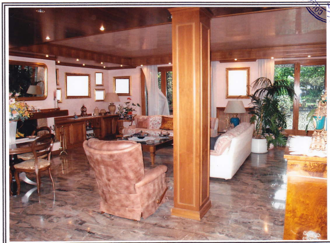
Interno appartamento – soggiorno