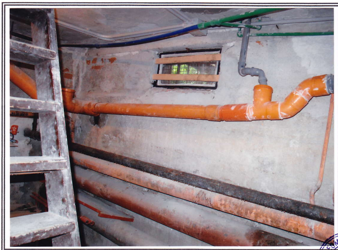
Interno negozio (sub. 13 e sub. 14) – cantina sub. 13