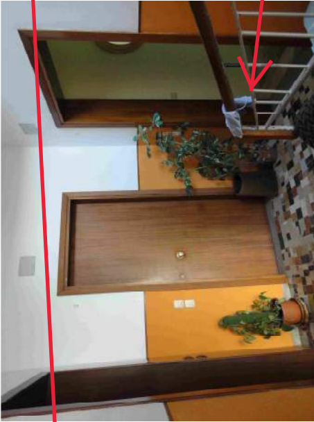
Pianerottolo e vano scale comuni