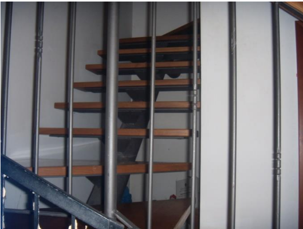
Scala di accesso al 1° Piano