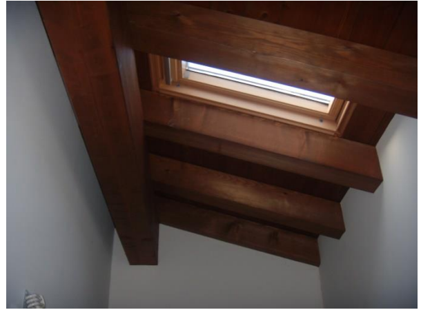
Particolare della copertura locale bagno al 1° Piano