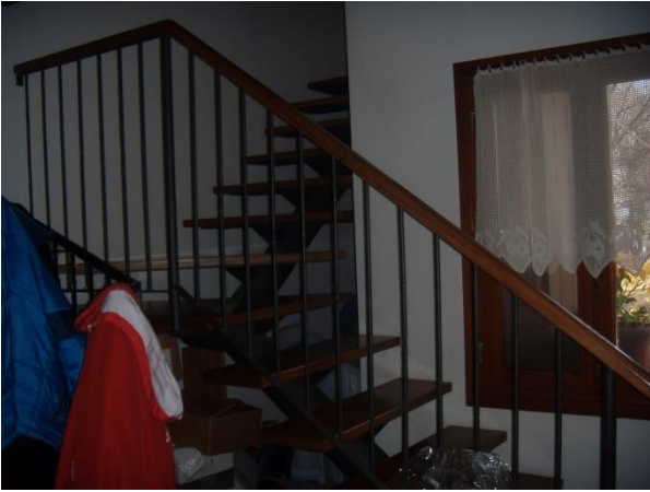
Scala di accesso al 1° Piano