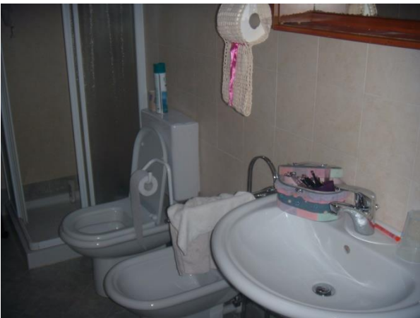
Locale bagno al 1° Piano