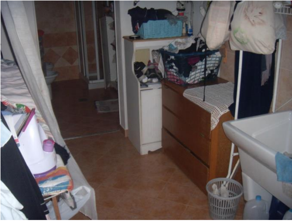
Locale lavanderia C.T. P.T