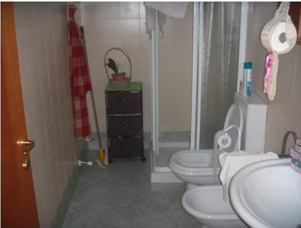
Locale bagno al 1° Piano