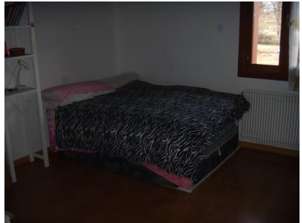
Locale camera al 1° Piano