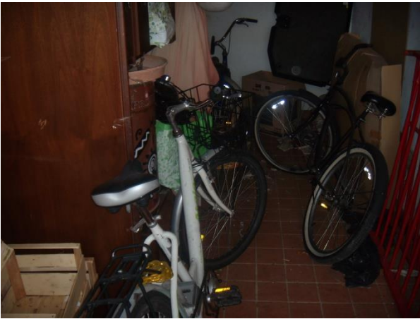
Locale Posto auto Coperto P.T.