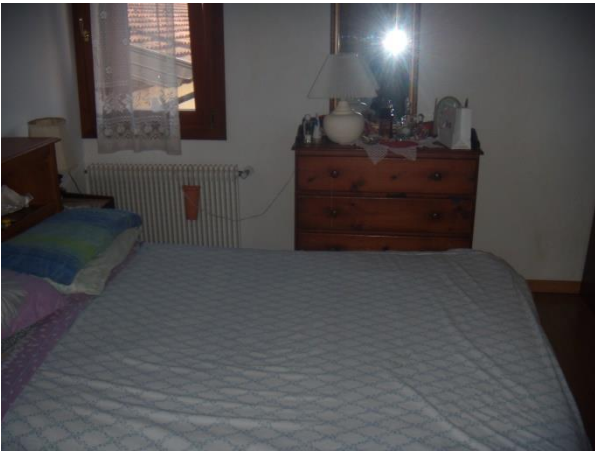
Locale camera non autorizzata al 1° Piano