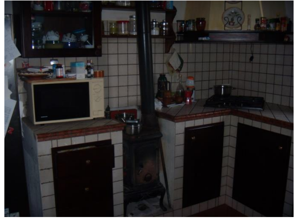
Locale cucina P.T