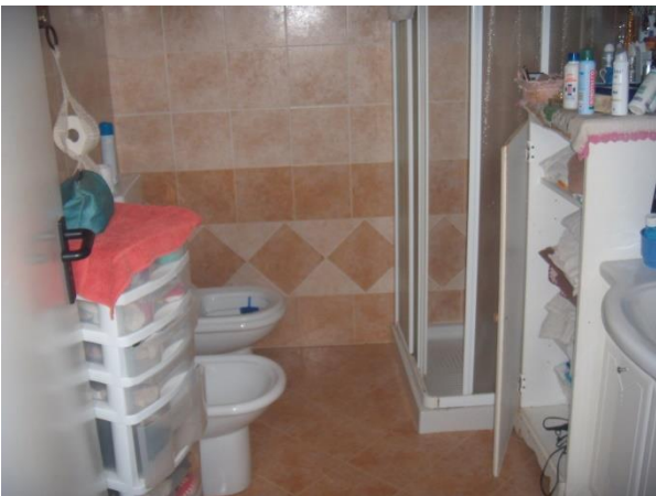
Locale Bagno P.T