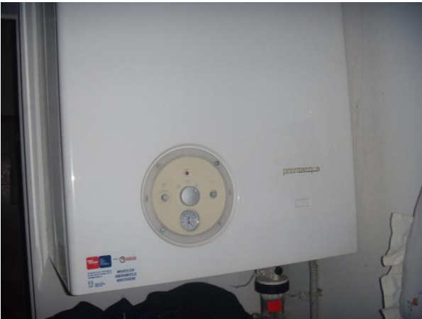
Particolare della Caldaia P.T