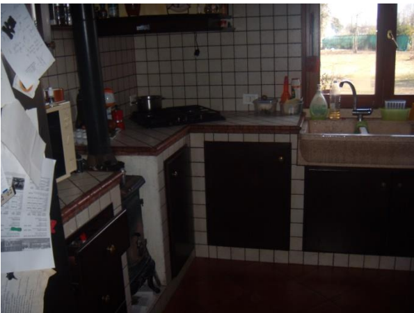
ocale cucina P.T.