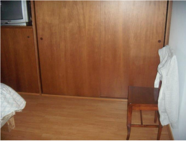
Locale camera non autorizzata al 1° Piano