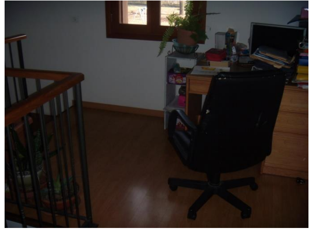
Locale disimpegno al 1° Piano