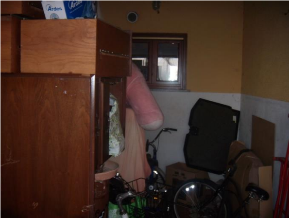
Locale Posto auto Coperto P.T.