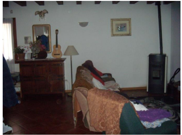
Locale soggiorno-pranzo P.T