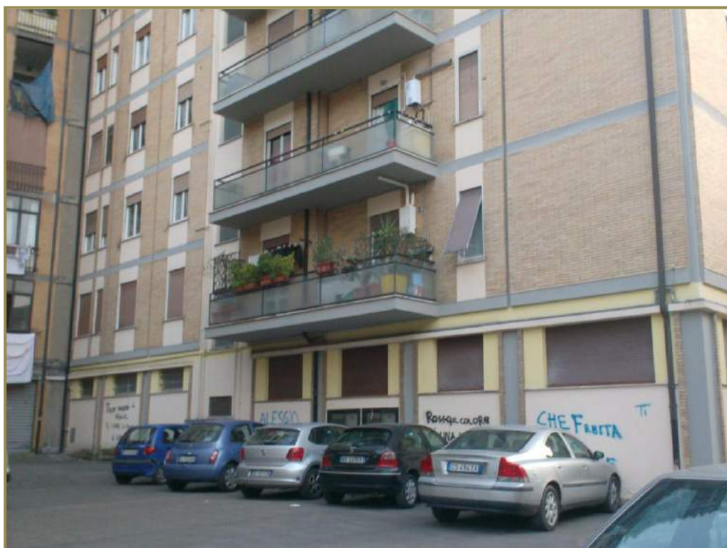
4-vista retro dell'edificio