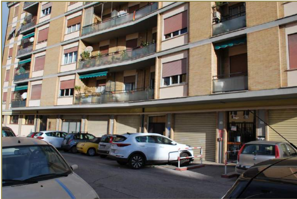
2-vista su via Pola