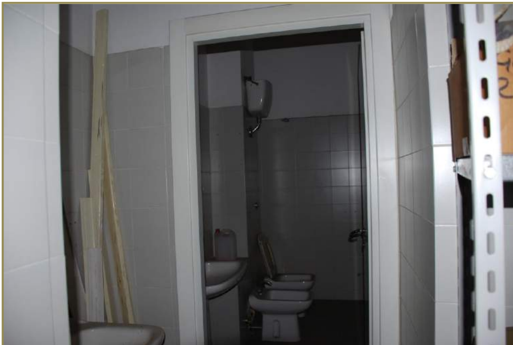
10-interno del locale, antibagno e bagno 1