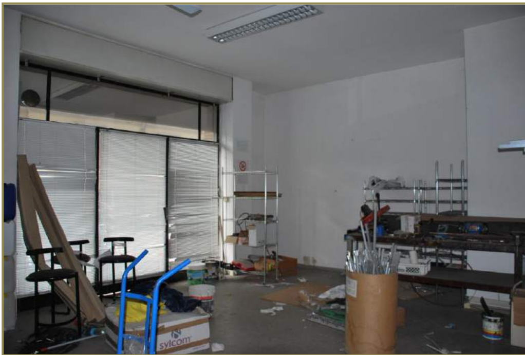
6-interno del locale