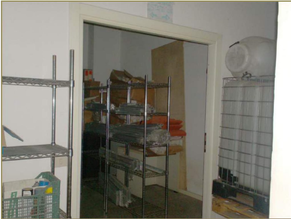
9-interno del locale