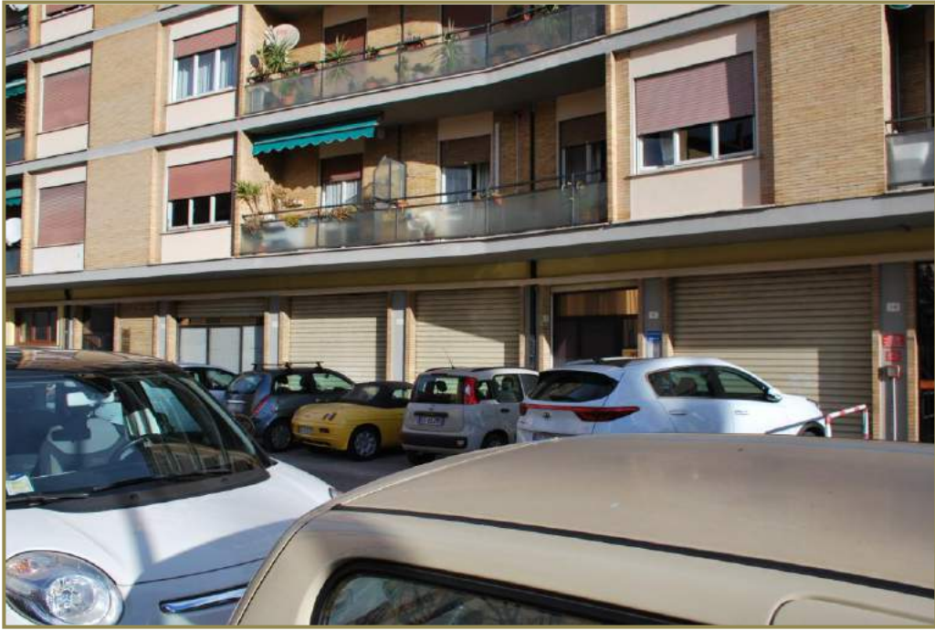
1-vista su via Pola