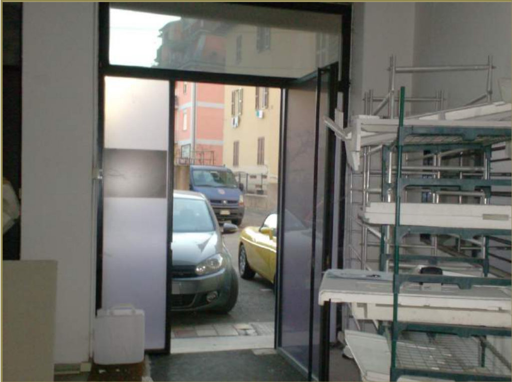
5-Accesso del locale con vista su via Pola