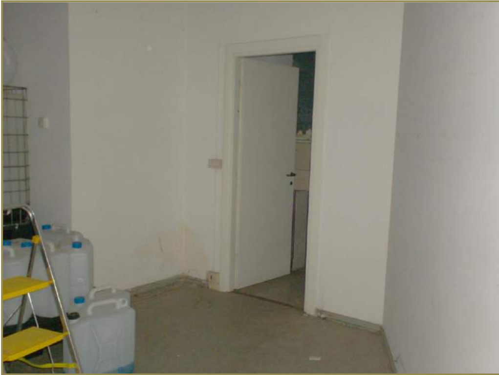
7-interno del locale