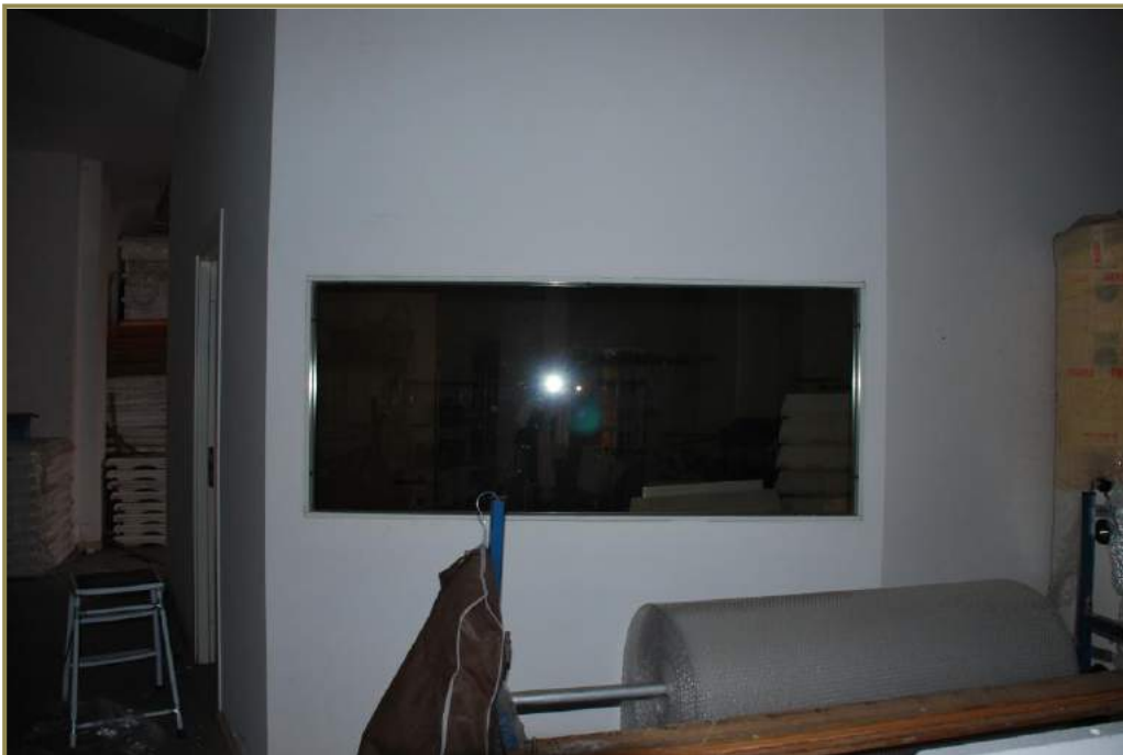
8-interno del locale