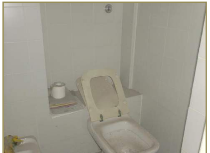
particolare dei sanitari