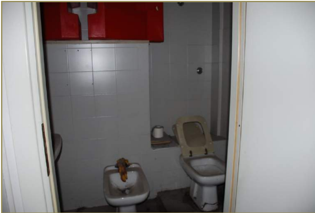
11-interno del locale, bagno 2