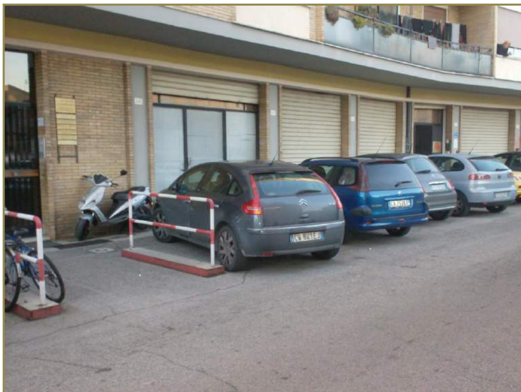
3-vista delle vetrine del locale da via Pola