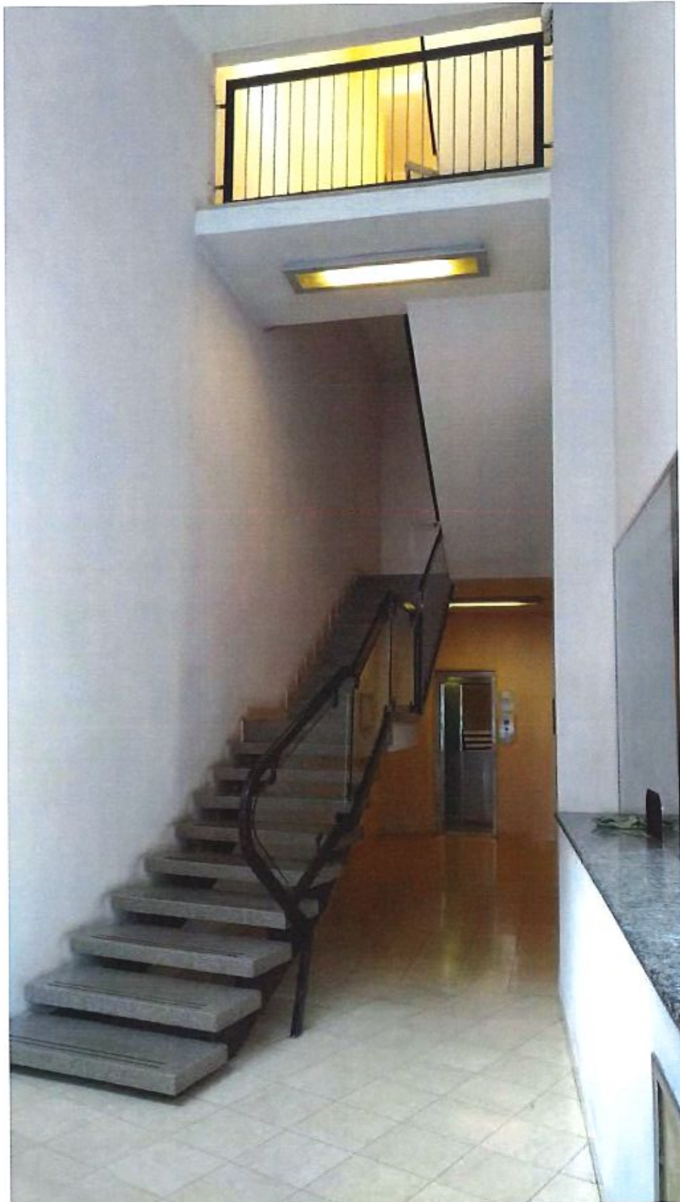
Immagine. 3. Androne di ingresso.