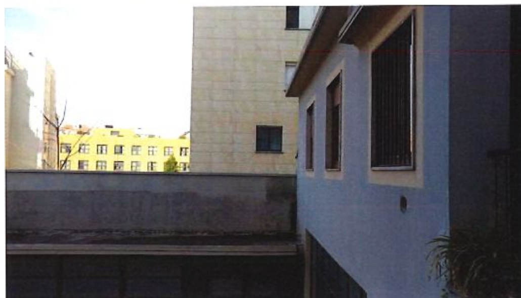
Immagine. 5. Facciata ovest.