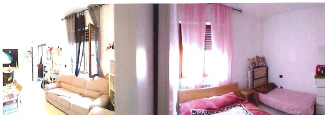
Immagine. 6. Vista panoramica soggiorno (sinistra) e camera (destra).