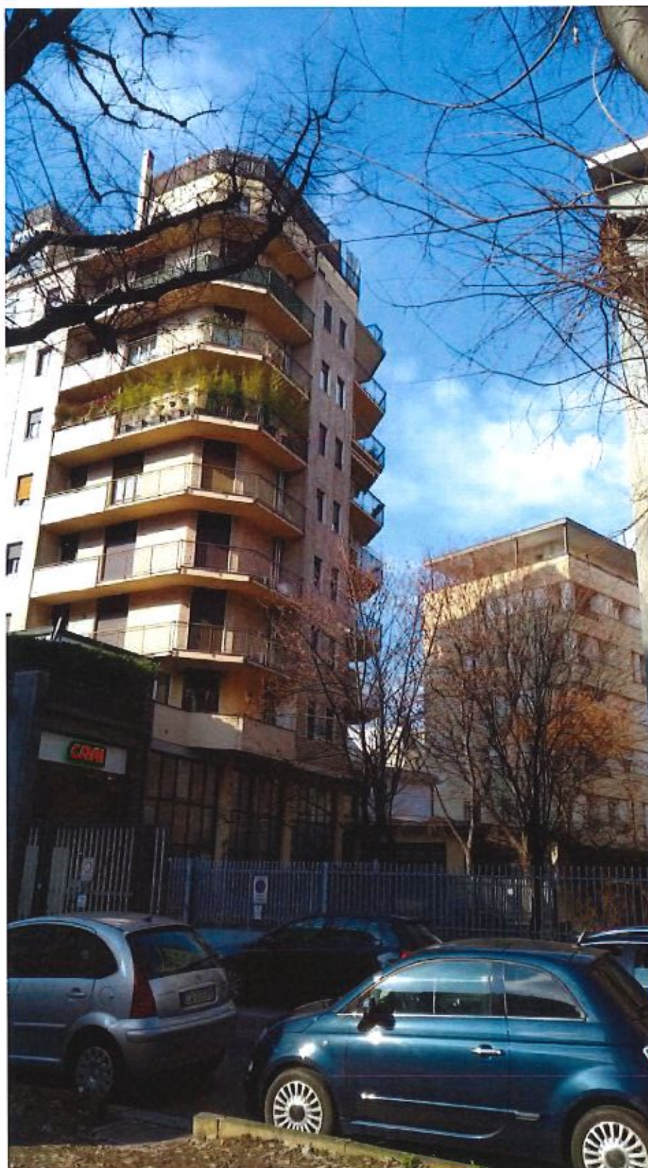
Immagine. 1. Vista da strada