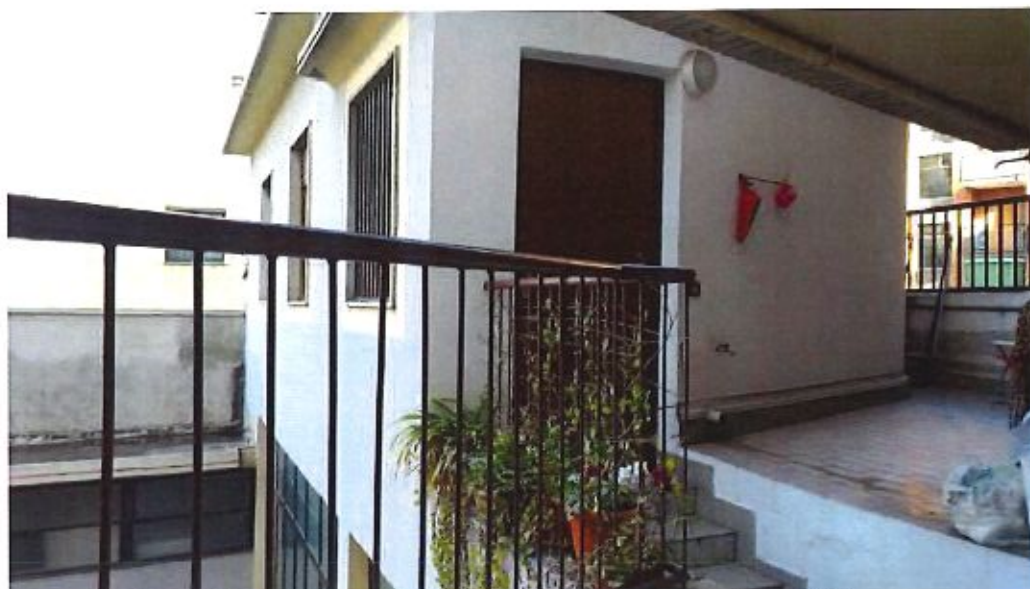
Immagine. 4. Porta di ingresso appartamento. A destra terrazzino di proprietà.