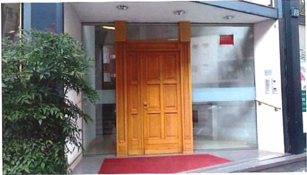
Immagine. 2. Portone ingresso condominiale