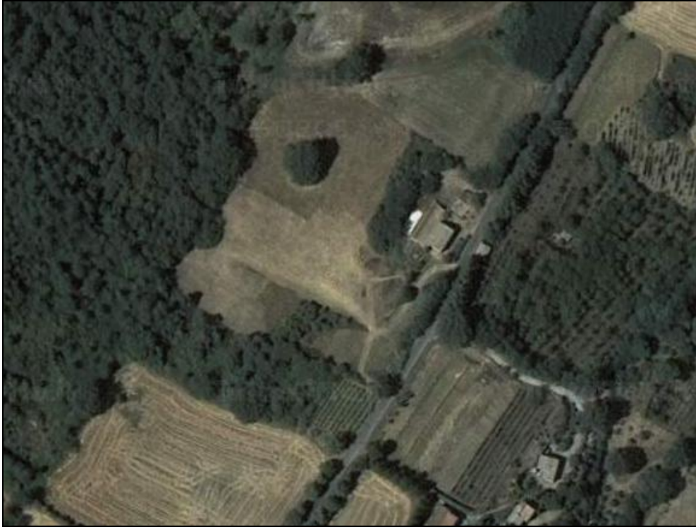
fabbricato principale ad uso abitativo