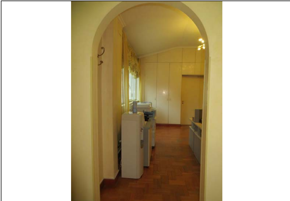
Vista interna degli uffici al piano secondo