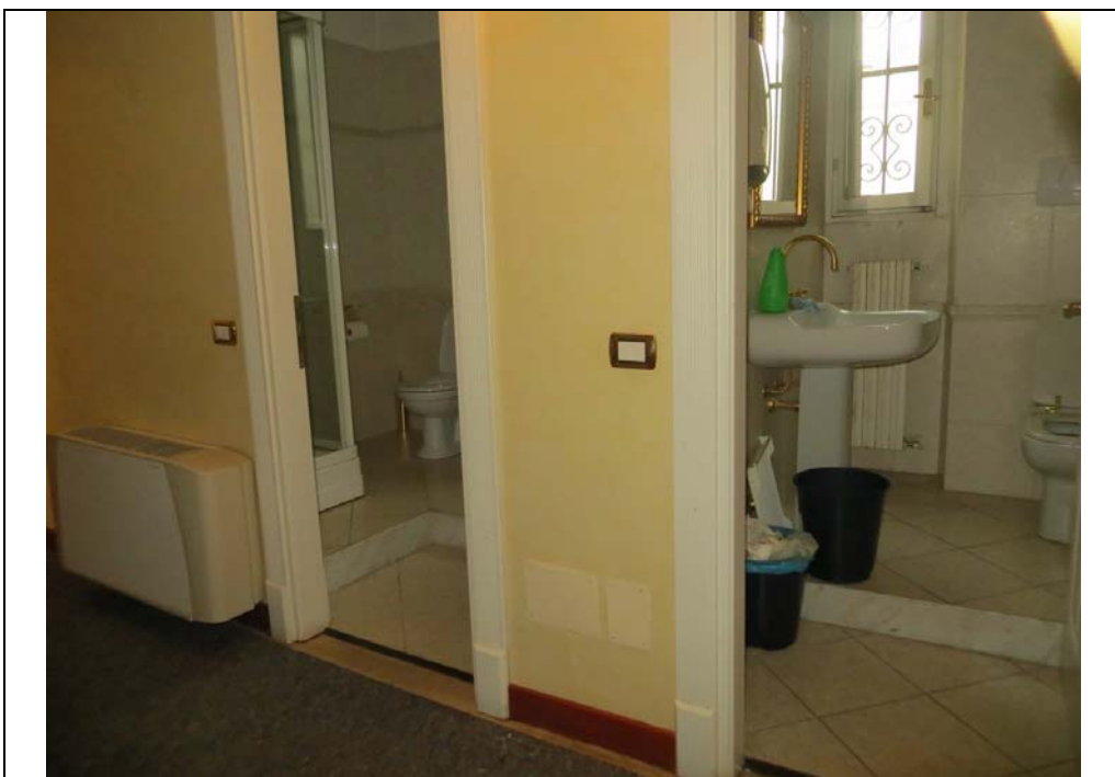
Vista interna degli uffici al piano secondo