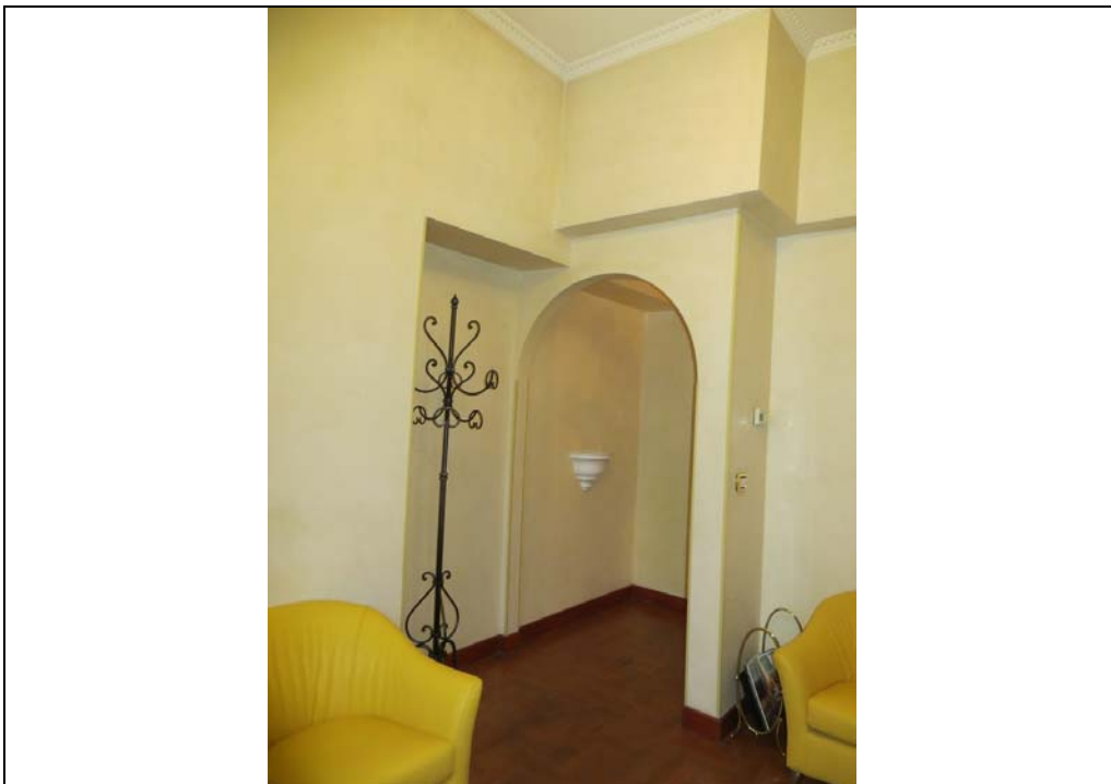
Vista interna degli uffici al piano secondo