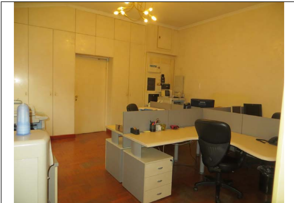
Vista interna degli uffici al piano secondo