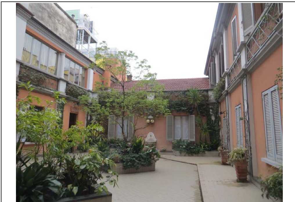
Vista del cortile interno di accesso all'immobile