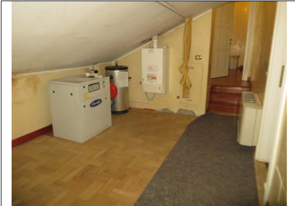
Vista interna degli uffici al piano secondo