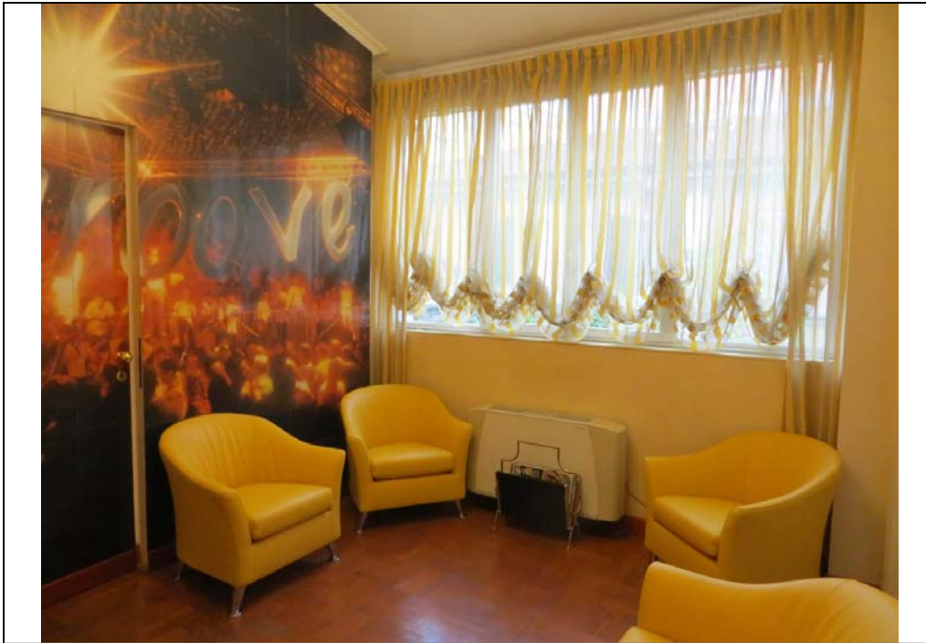
Vista interna degli uffici al piano secondo