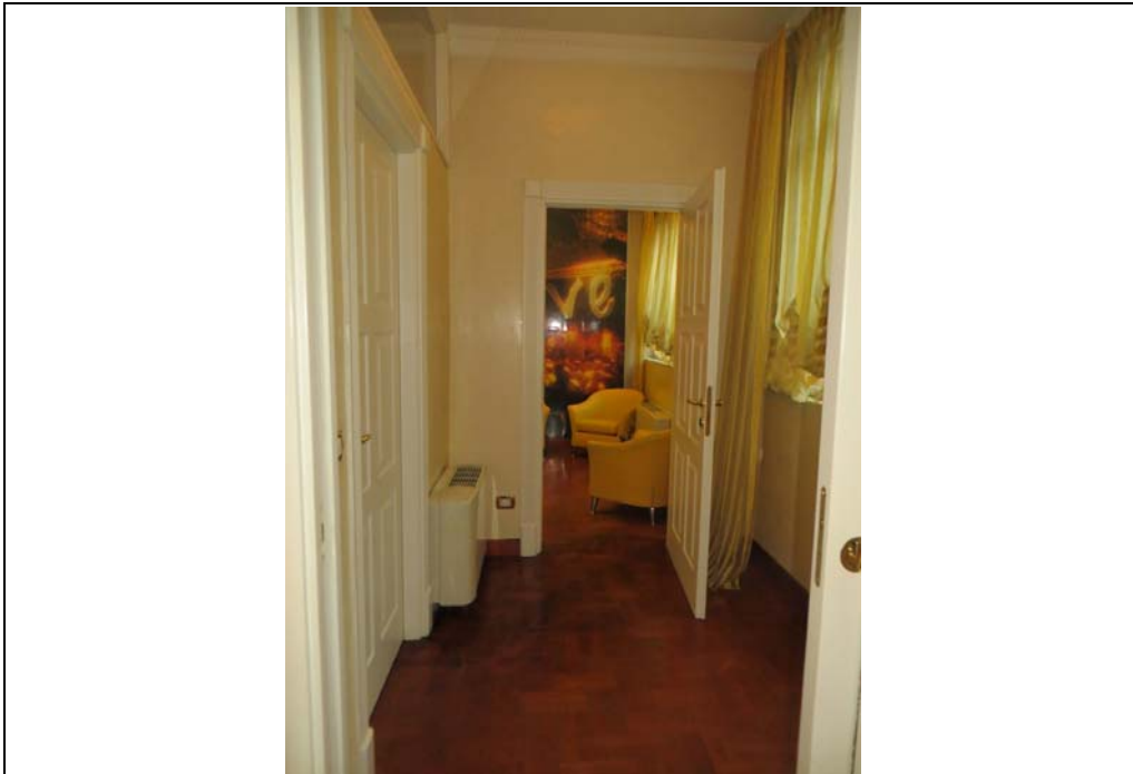
Vista interna degli uffici al piano secondo