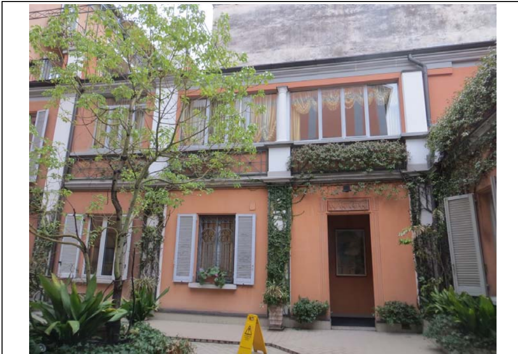
Vista della facciata del fabbricato dal cortile interno