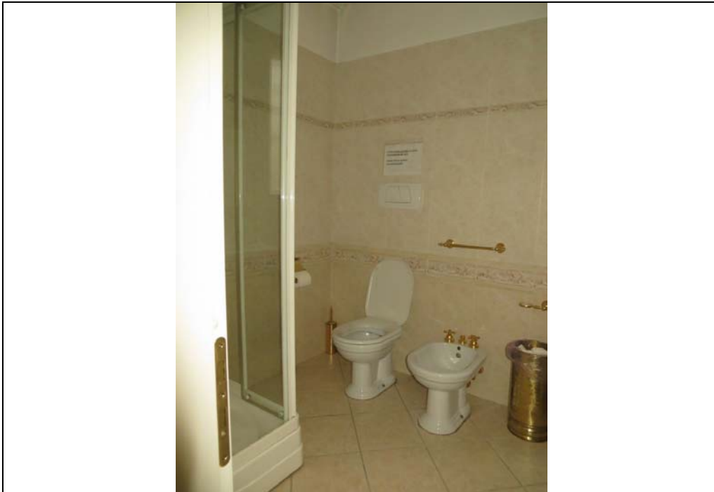
Vista interna di un bagno