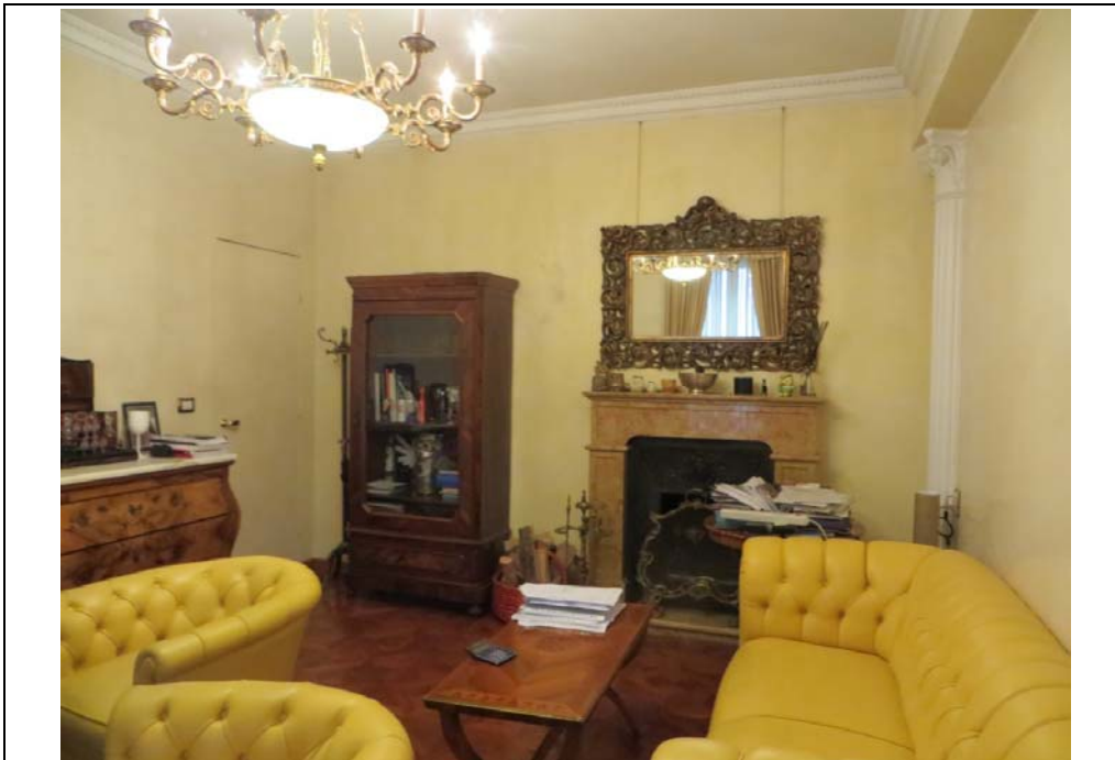
Vista interna degli uffici al piano secondo