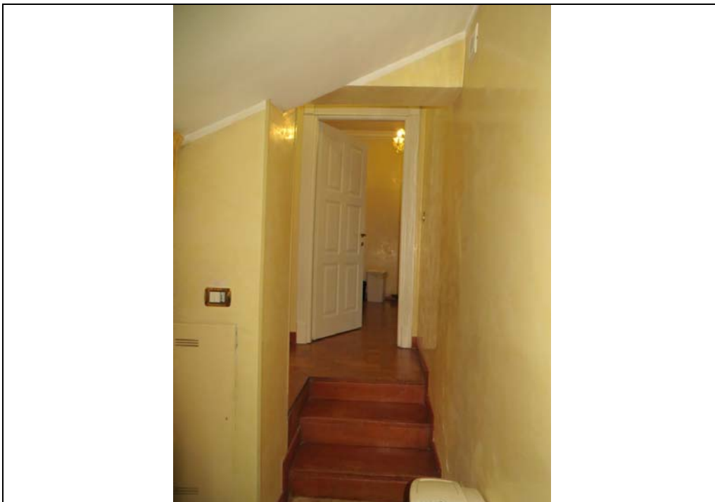
Vista interna degli uffici al piano secondo