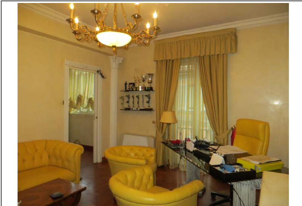
Vista interna degli uffici al piano secondo