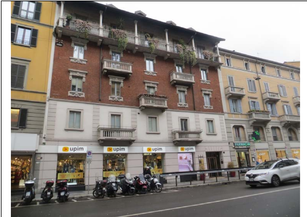
Vista dell'accesso all'immobile da Corso Buenos Aires