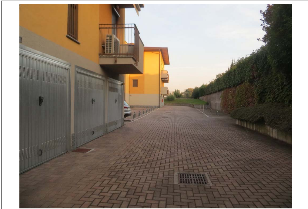
Vista del corsello comune