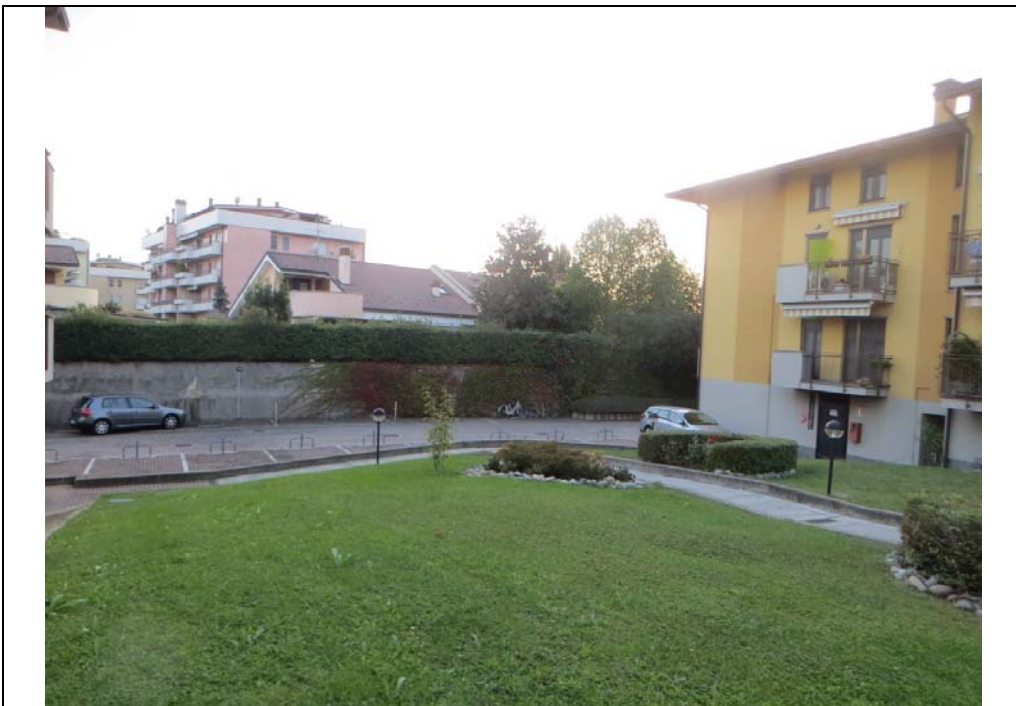
Vista interna del complesso immobiliare