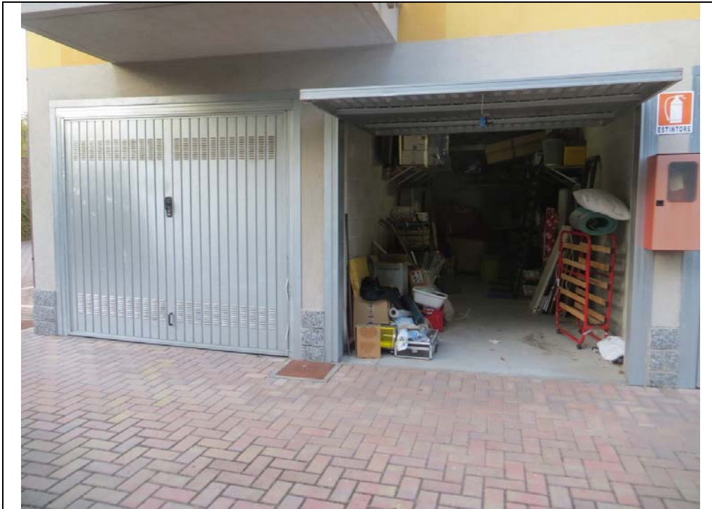
Vista del box