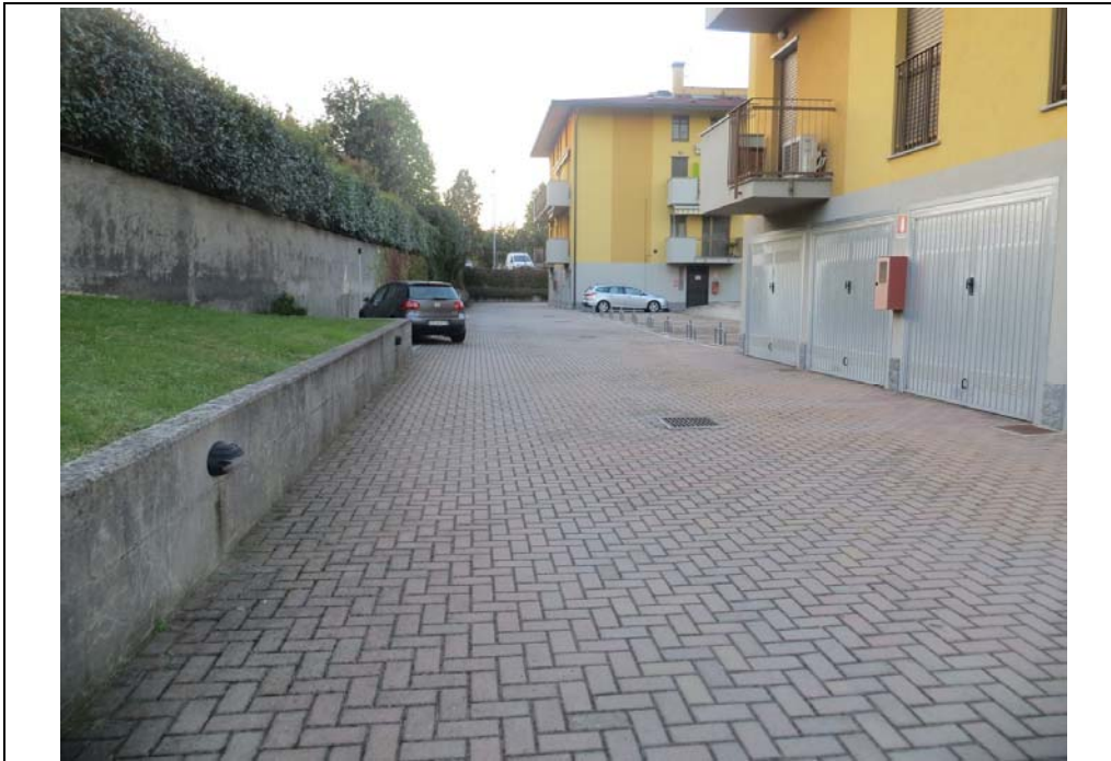
Vista del coresello comune