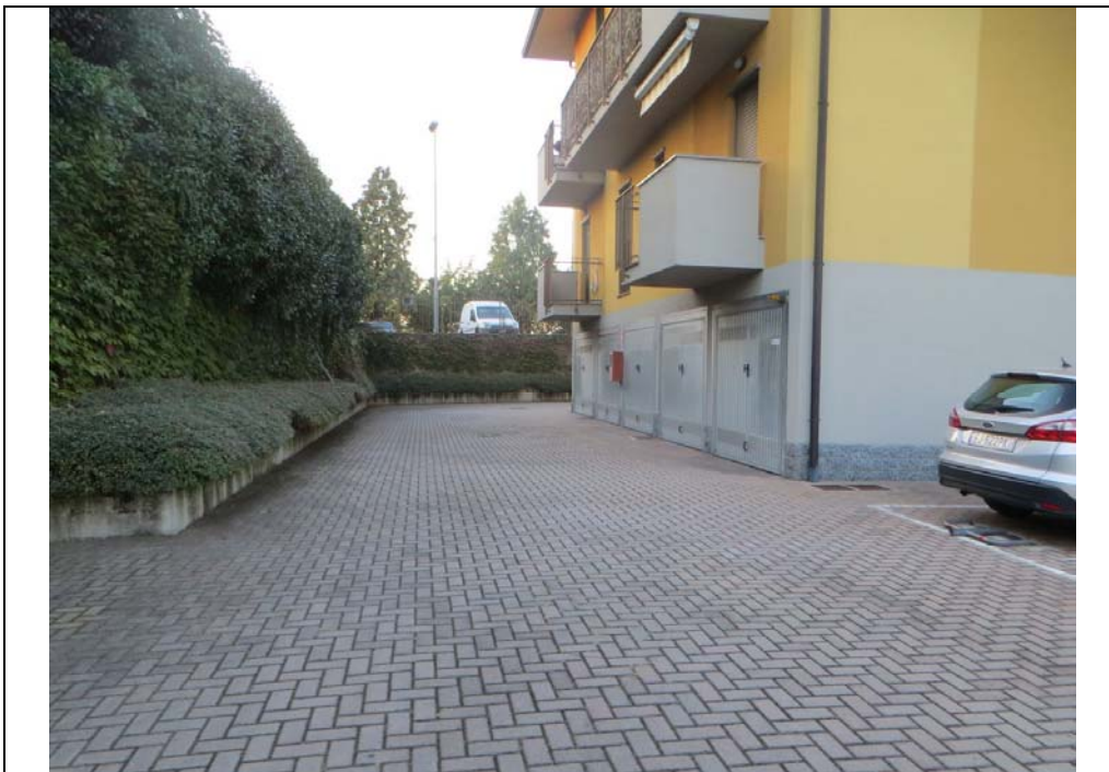
Vista del corsello comune