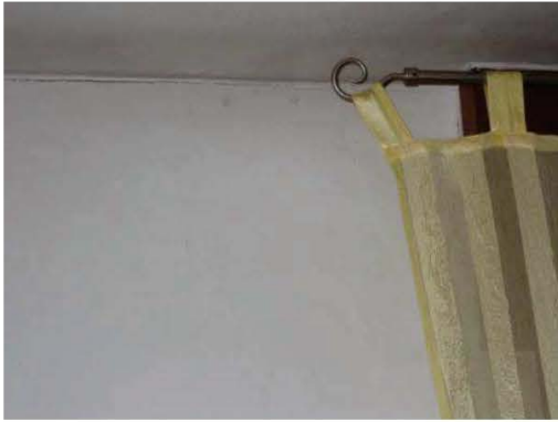
31. Macchia di umidità nella camera