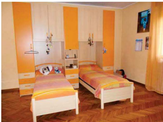
23. Vista panoramica di una camera