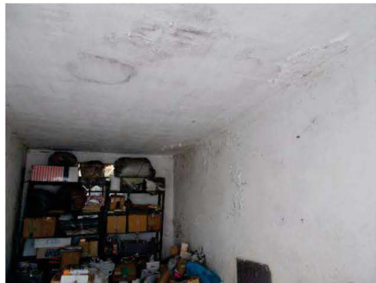
40. Interno del box con tracce di umidità a soffitto e sulle pareti