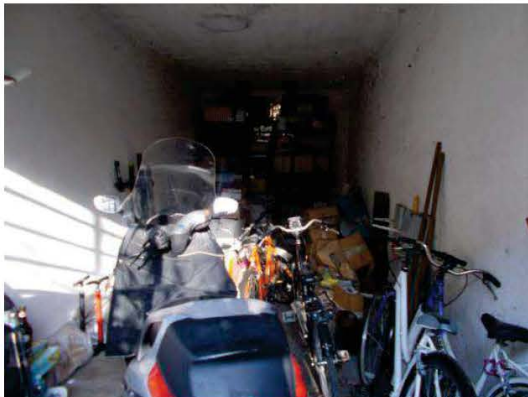
41. Vista interna del box