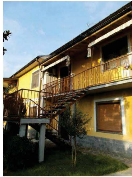
2. Vista esterna dell'immobile verso via Montebianco