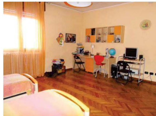
24. Vista panoramica di una camera