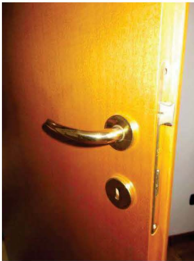
15. Particolare porta interna