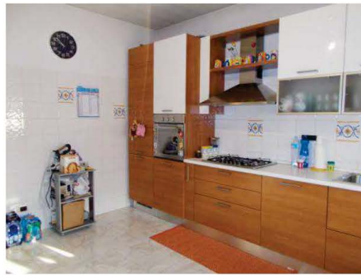
18. Vista panoramica della cucina