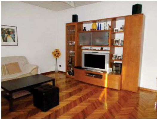
21. Vista panoramica soggiorno