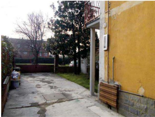
37. Passo carraio di accesso