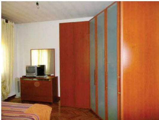
27. Camera matrimoniale