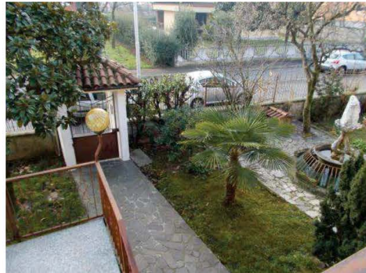
8. Vista del giardino dal ballatoio di ingresso