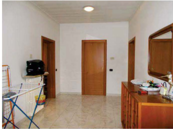
14. Vista panoramica dell'Ingresso