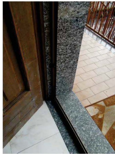
16. Particolare porta di ingresso