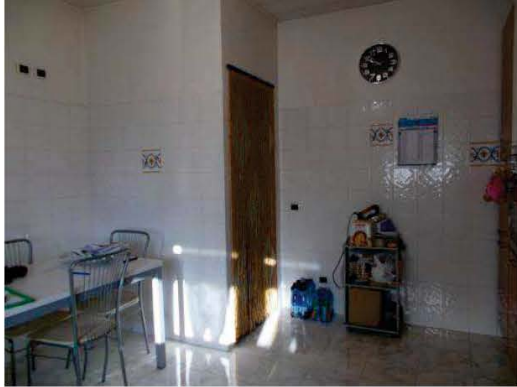
19. Locale ripostiglio in cucina