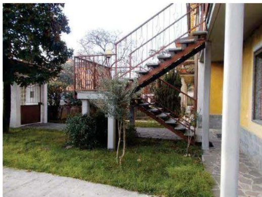
5. Vista della scala esterna