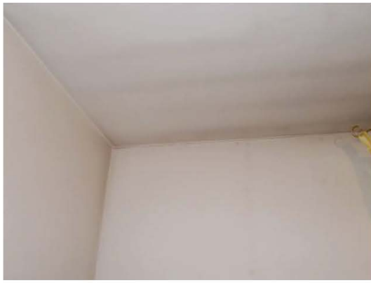
28. Particolare di un "ponte termico" a soffitto nella camera matrimoniale