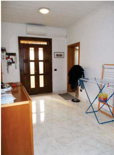
13. Vista panoramica dell'Ingresso