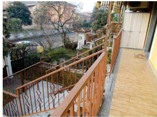
10. Ballatoio esterno di accesso all'immobile