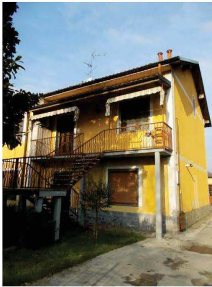
1. Vista esterna dell'immobile verso via Montebianco