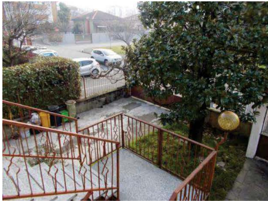
7. Scala esterna di accesso