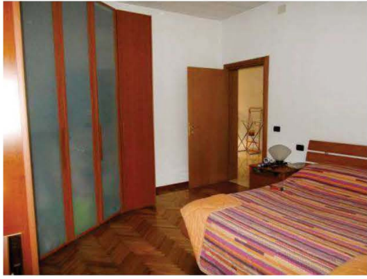
26. Camera matrimoniale