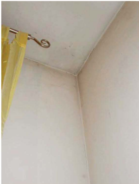
29. Macchia di umidità nella camera matrimoniale