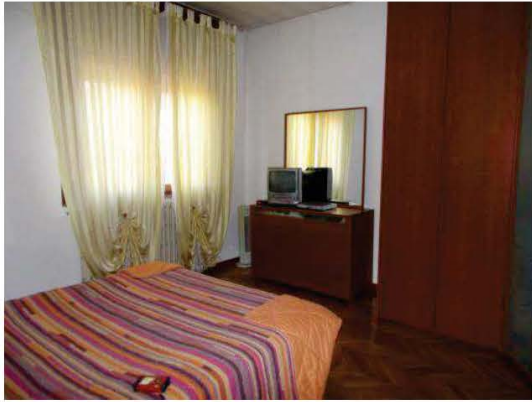
25. Camera matrimoniale