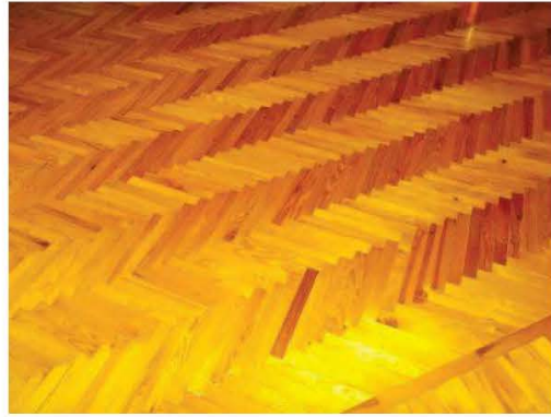
32. Parquet nella camera matrimoniale