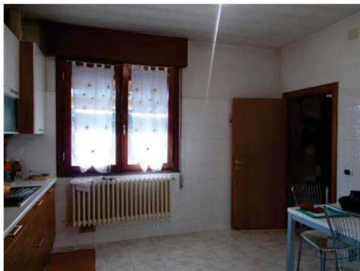
17. Vista panoramica della cucina