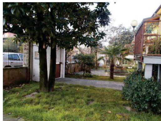
6. Vista del giardino anteriore comune