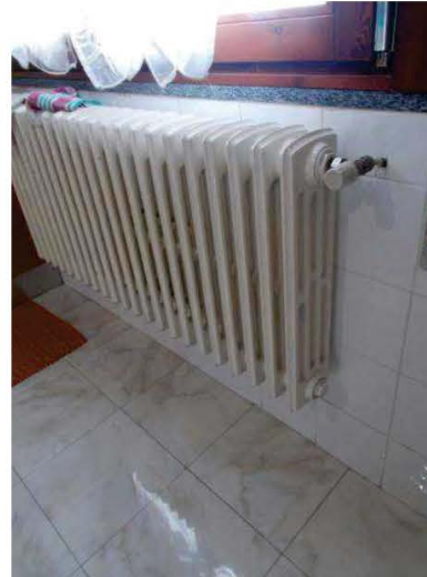
20. Particolare del radiatore in cucina