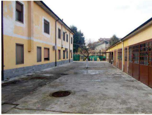
38. Corsello comune dei box