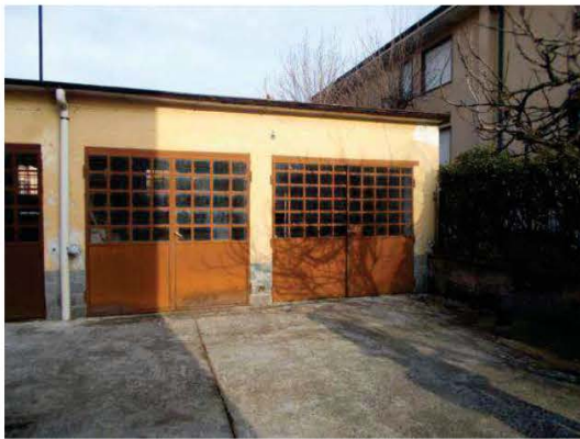
39. Vista esterna del box (primo da destra)