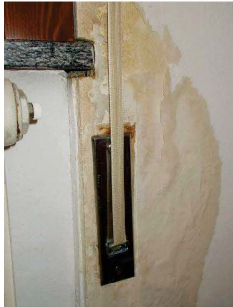
30. Particolare porzione di parete ammalorata nella camera matrimoniale