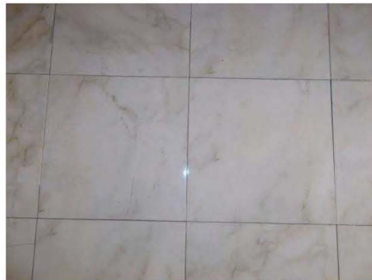
36. Particolare delle piastrelle del pavimento de bagno