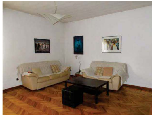
22. Vista panoramica soggiorno