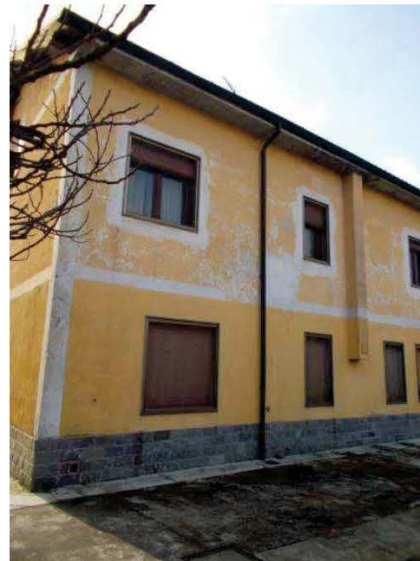
4. Vista esterna della facciata sul retro