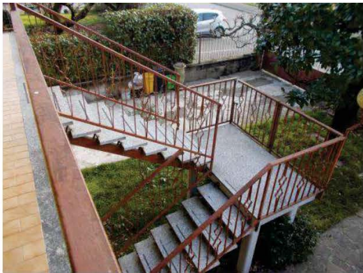
9. Scala esterna