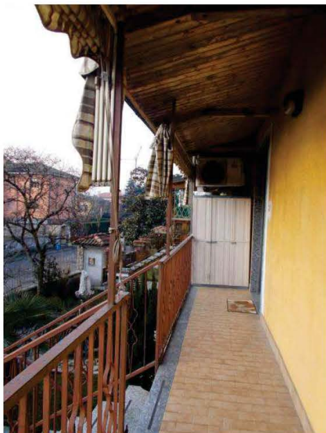
11. Ballatoio esterno di accesso all'immobile