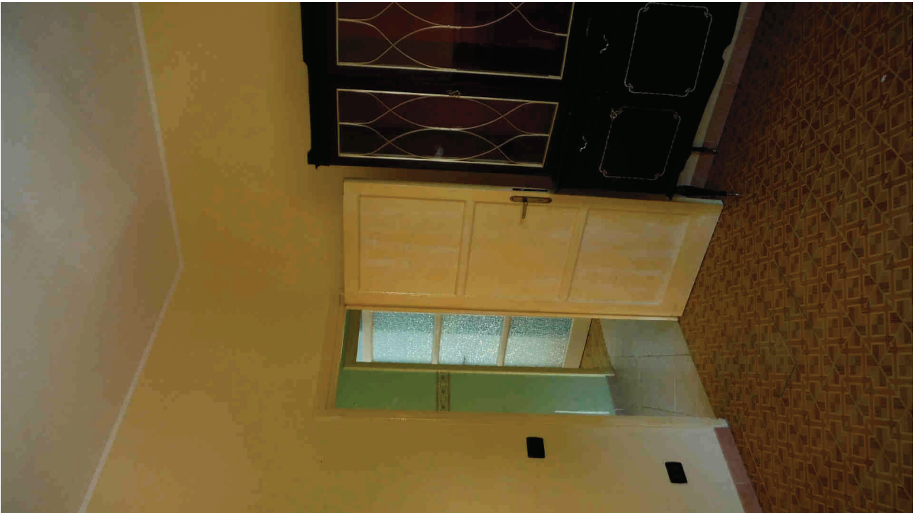
Foto 10 vista dell'interno vano soggiorno