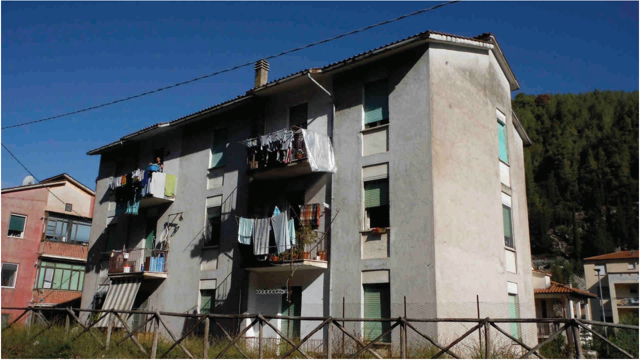
Foto 3 prospetto sud-est