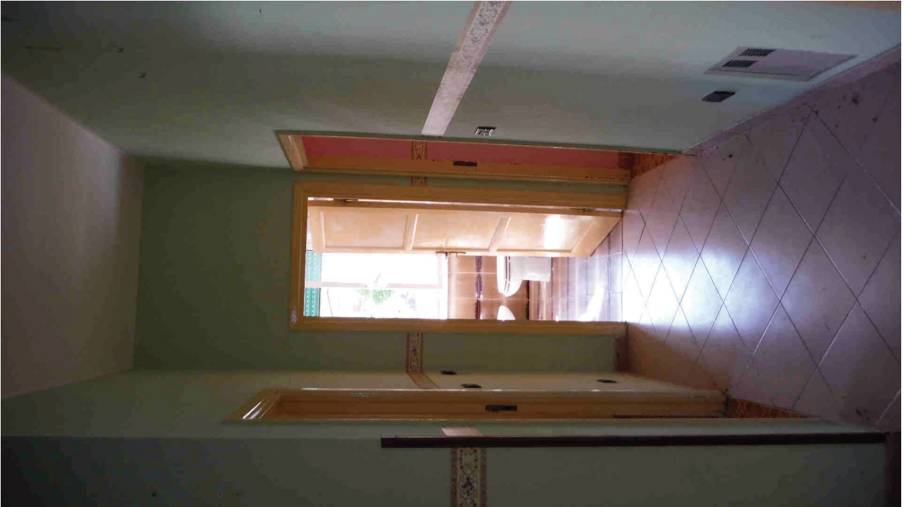
Foto 7 vista dell'interno dall'ingresso verso il bagno.