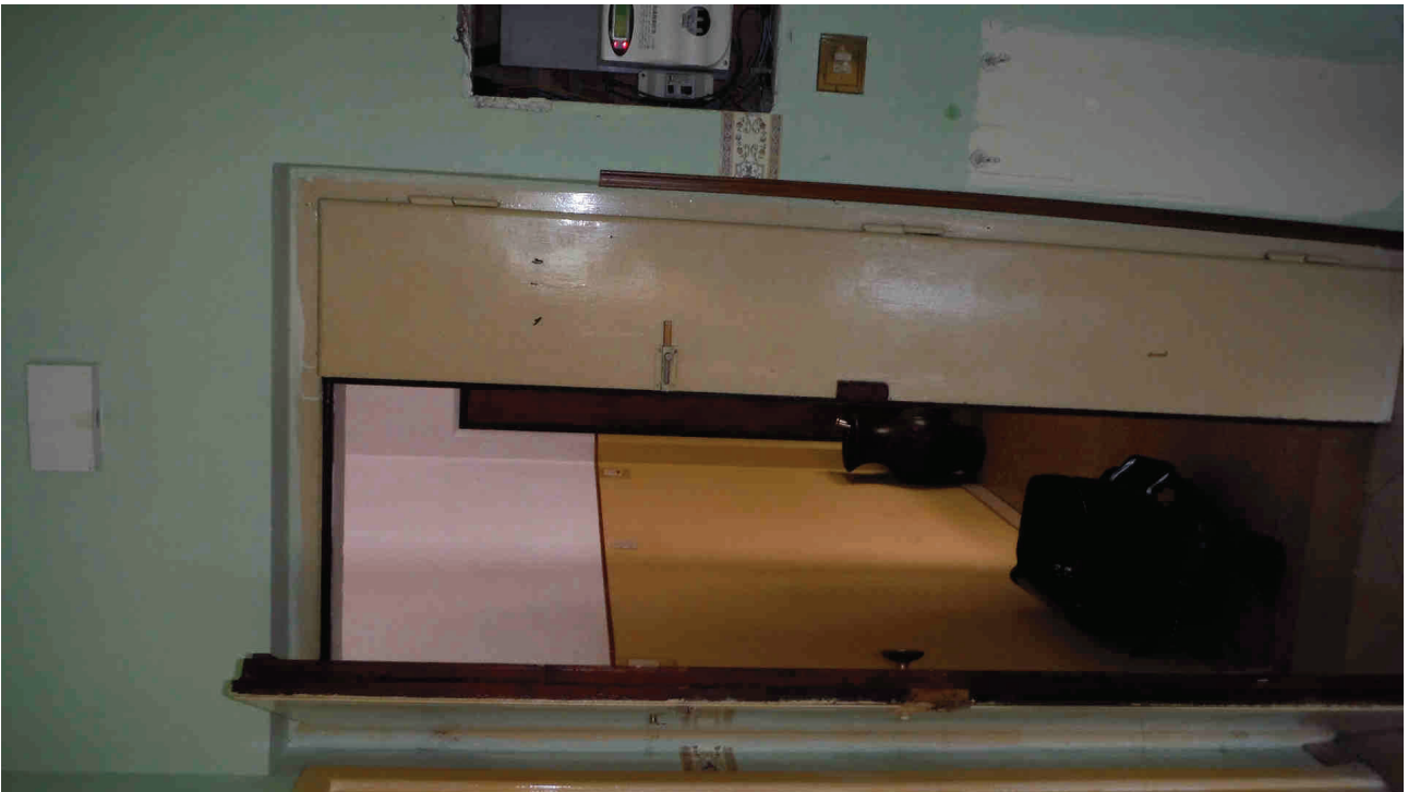
Foto 6 vista dall'interno