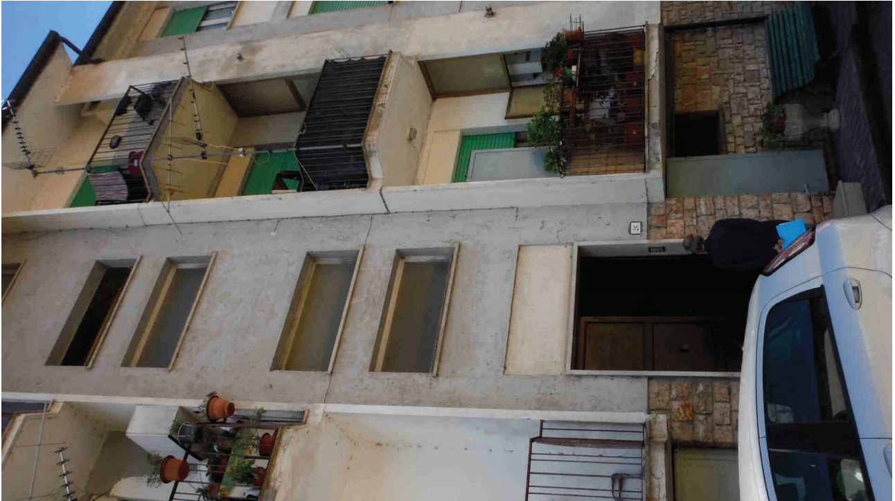
Foto 1 vista dell'ingresso da via della Rinascita 26