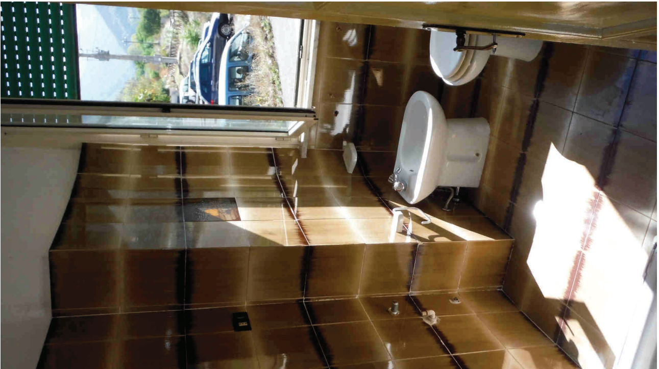
Foto 8 vista del bagno.