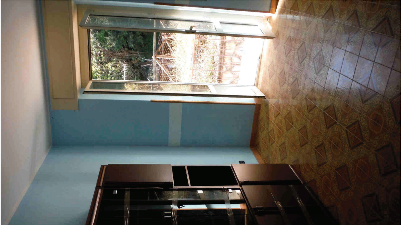
Foto 11 vista dell'interno camera