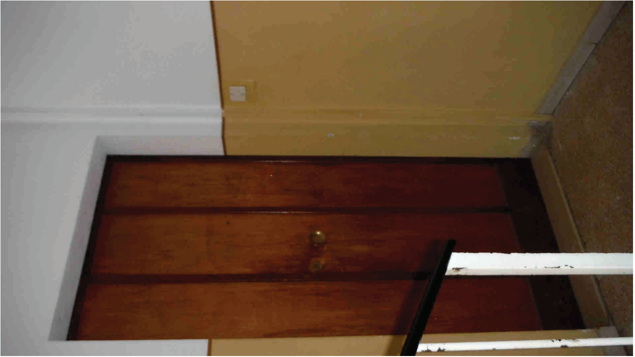
Foto 5 vista del portone d'ingresso.