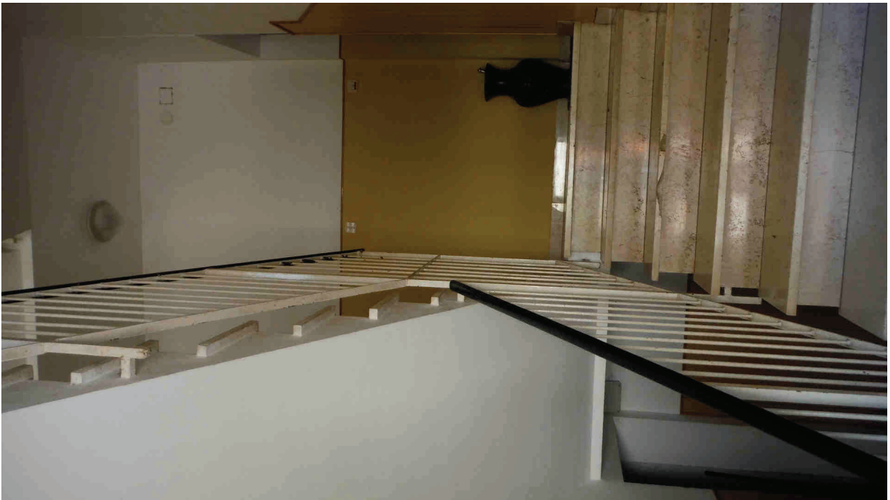
Foto 4 vista dal pianerottolo di ingresso al piano rialzato