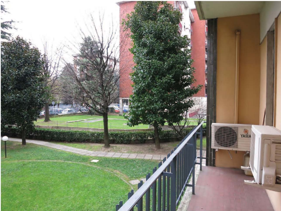
Vista sul verde condominiale