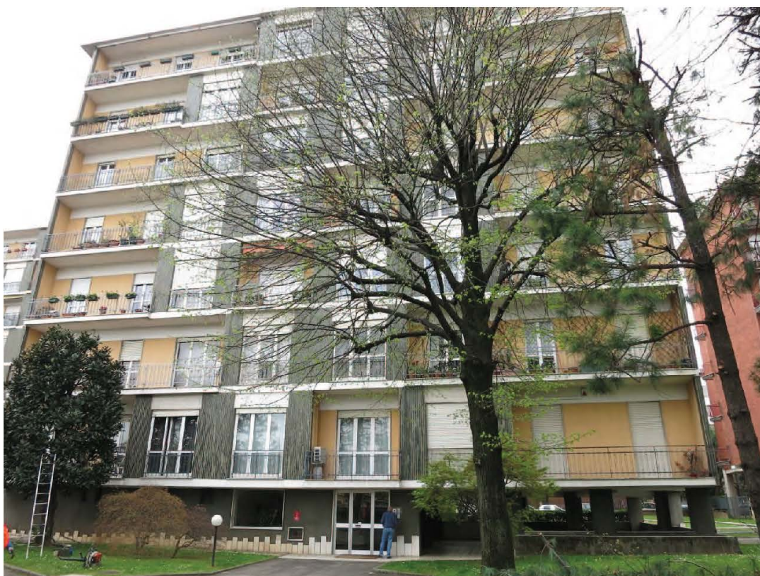
Viste esterne del complesso immobiliare