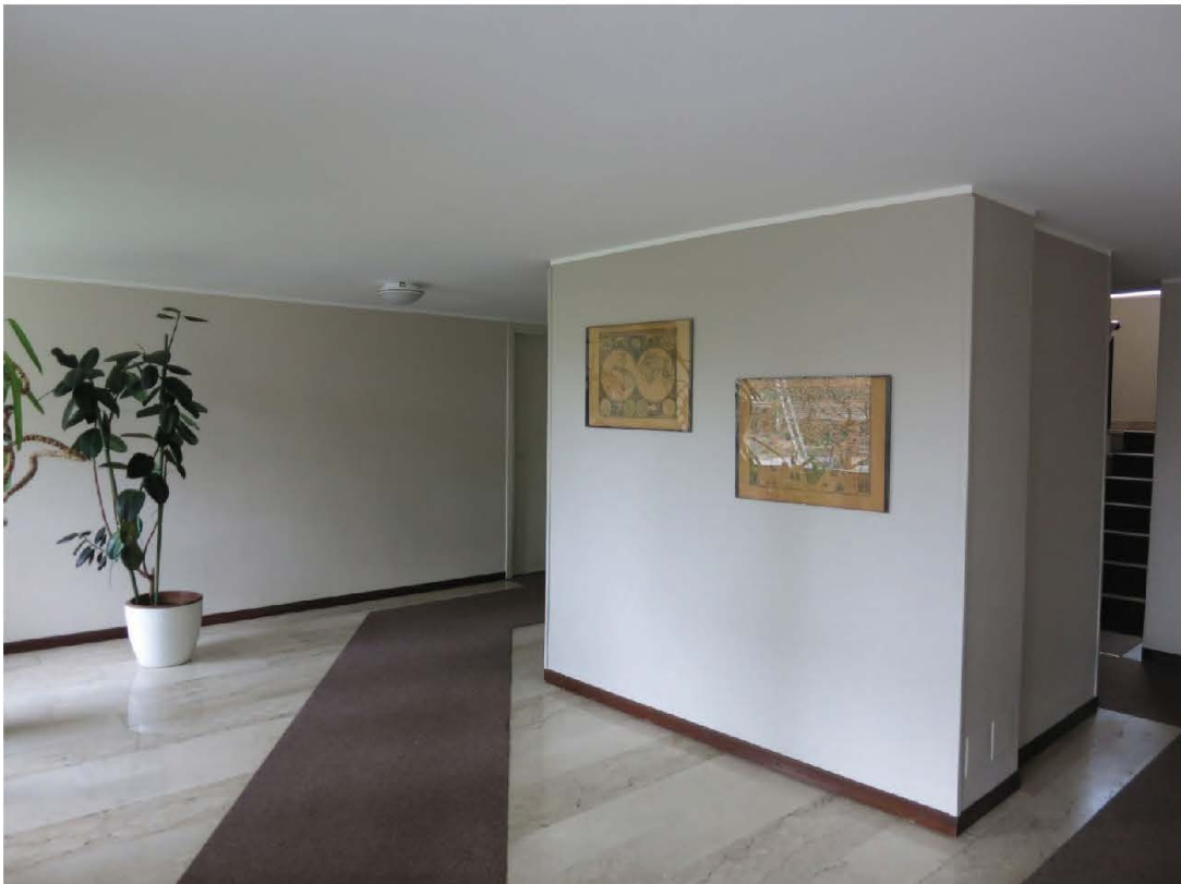
Atrio di ingresso