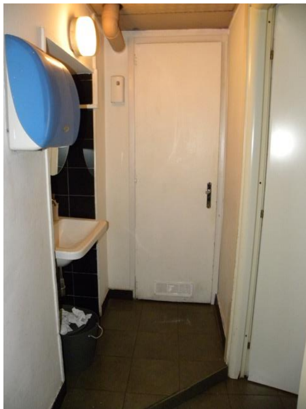
Bagni – Foto 1