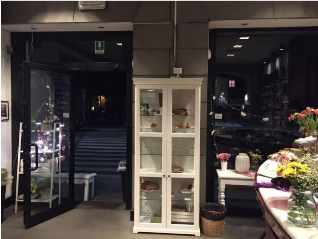
Porta di Ingresso del Locale