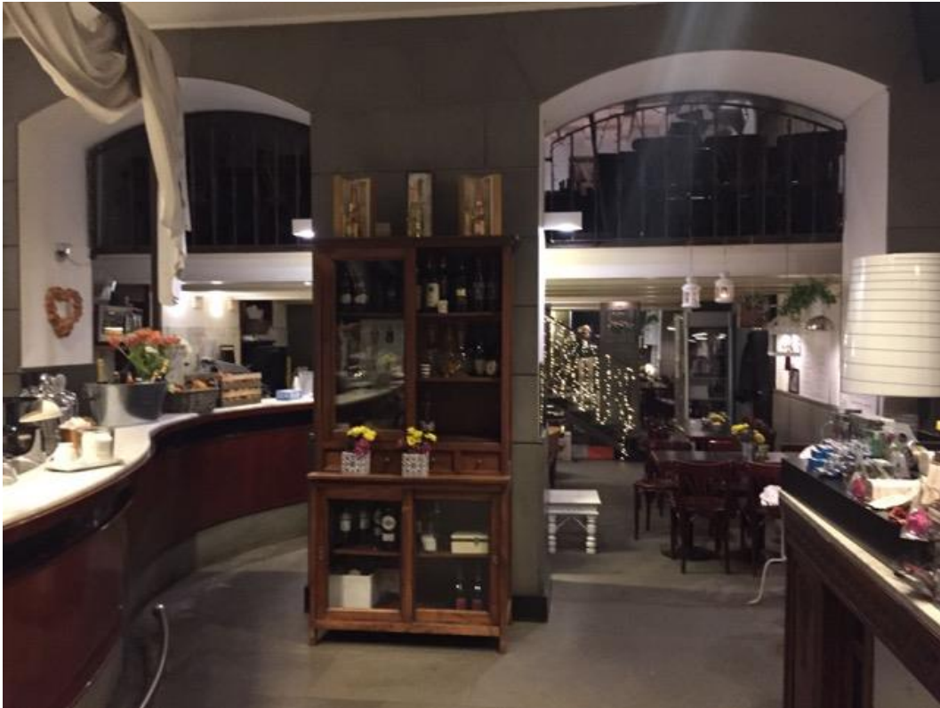
Locale Piano Terra – Vista da Ingresso