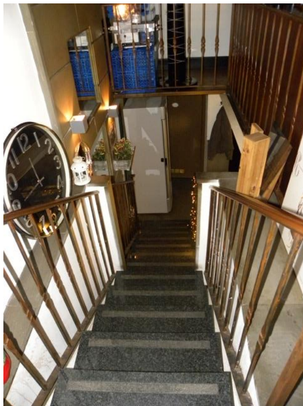
Scala di Accesso al Piano Soppalcato