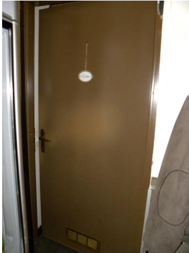
Porta di Accesso ai Bagni