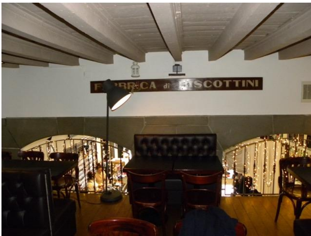
Piano Soppalcato – Foto 2