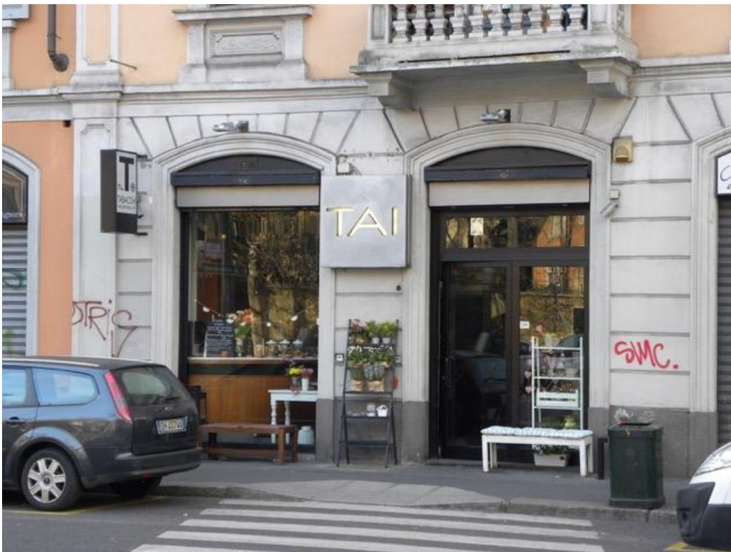
Ingresso del Locale