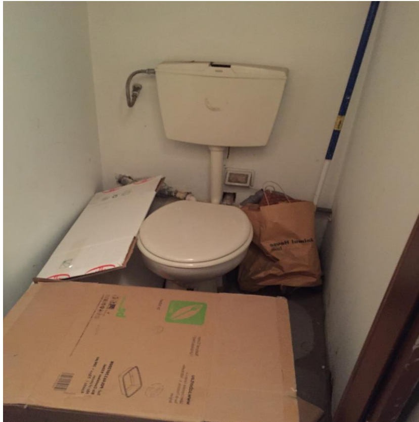
Bagno piano cantina