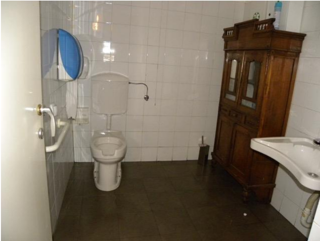
Bagni – Foto 2