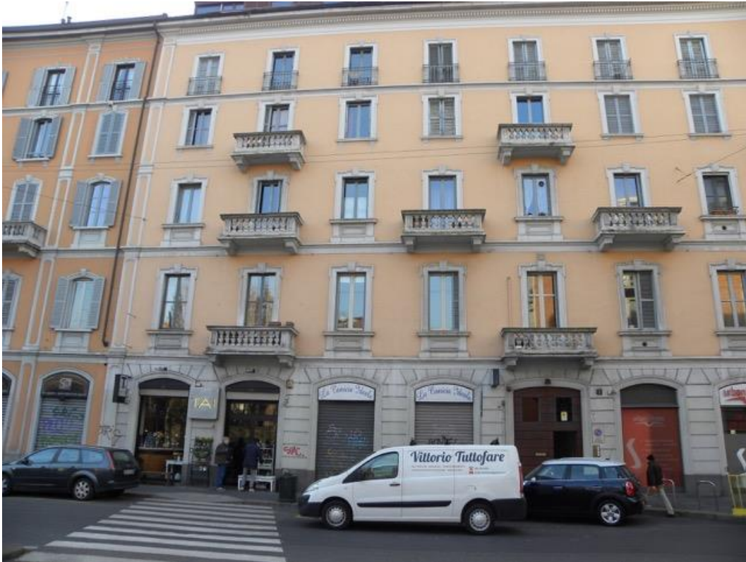
Vista Esterna del Fabbricato