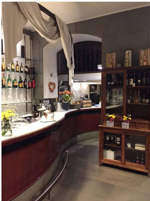
Bancone del Bar