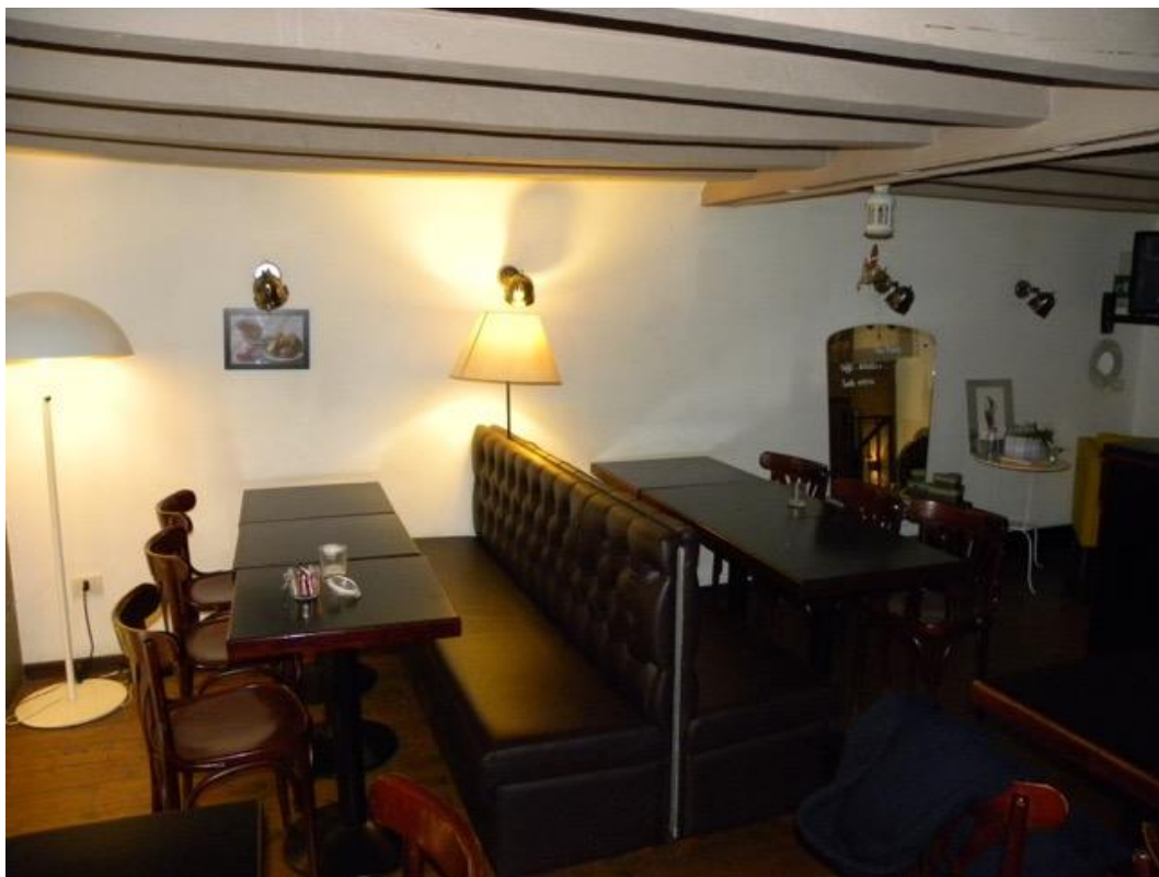
Piano Soppalcato – Foto 1