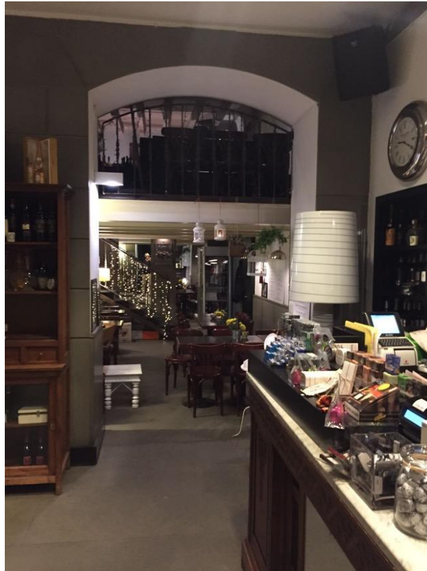
Vista del Locale al Piano Terra