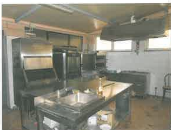
Dispensa cucina piano T