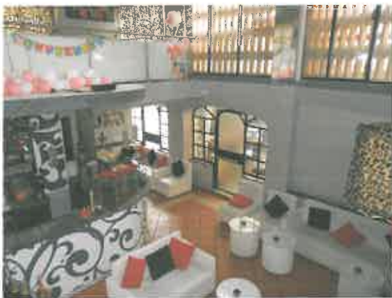
BAR PIANO TERRA