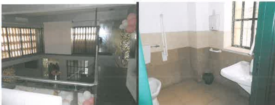
BAGNI PIANO I°