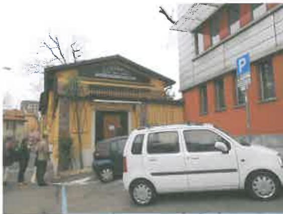
ACCESSO ALLA U.I.