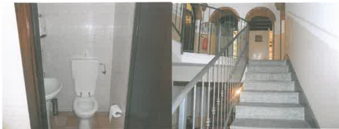
SCALA DI ACCESSO