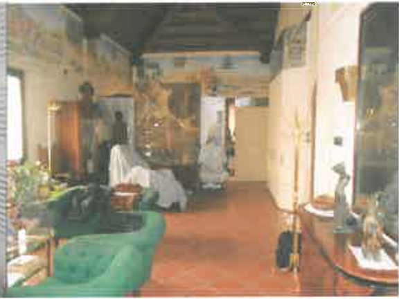
ALTRA VISTA SOGGIORNO