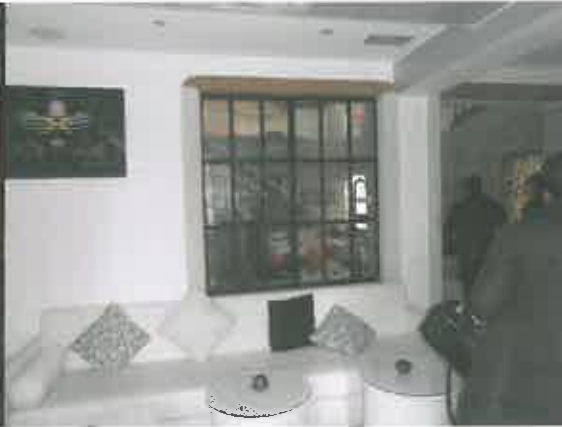
TETTOIA TRASFORMATA IN BAR