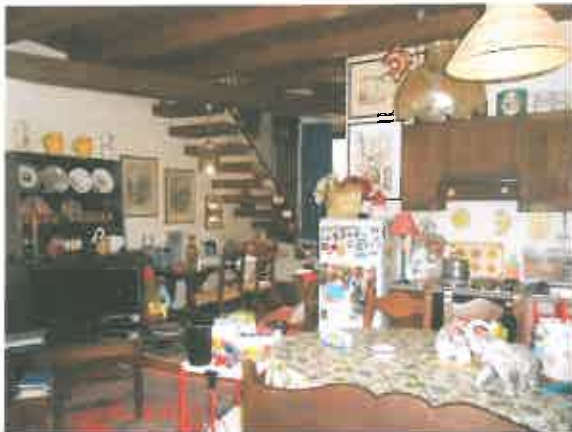
SOGGIORNO COTTURA PIANO T