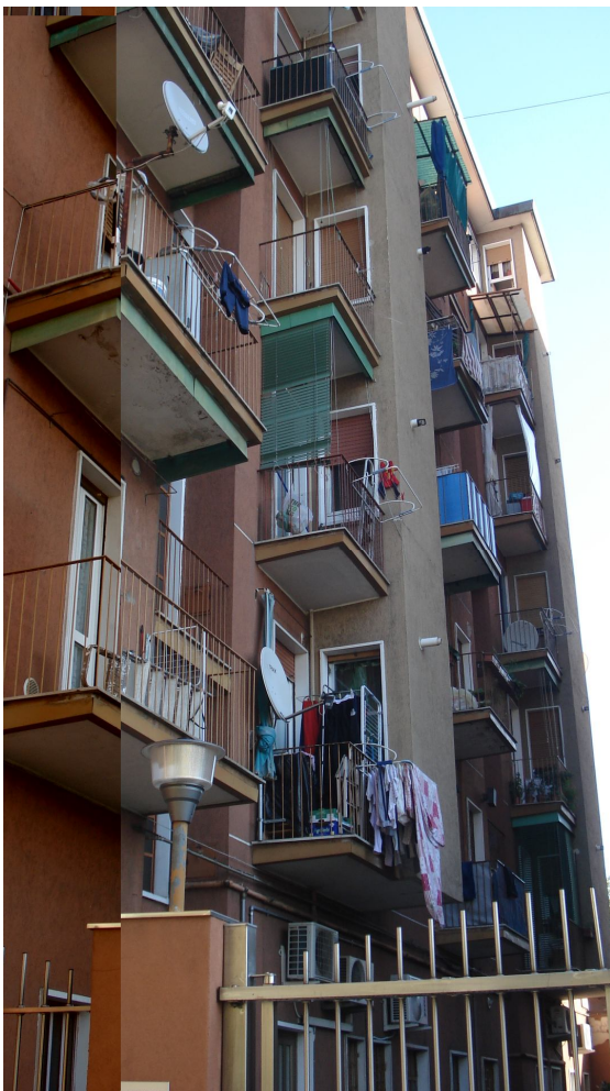
Foto 2: vista facciata interna verso l'appartamento oggetto della presente pratica