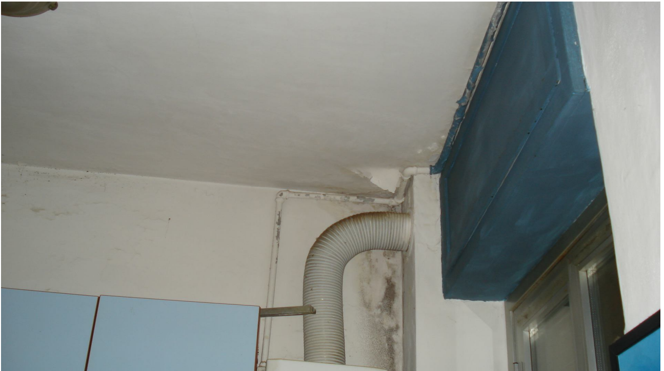
Foto 14: vista delle macchie e dell'intonaco staccato nell'angolo cottura