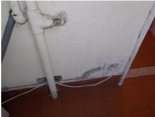
29. Muro della veranda