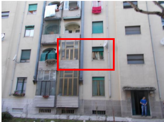
31. Posizione dell'immobile