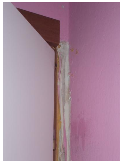
20. Particolare parete della camera