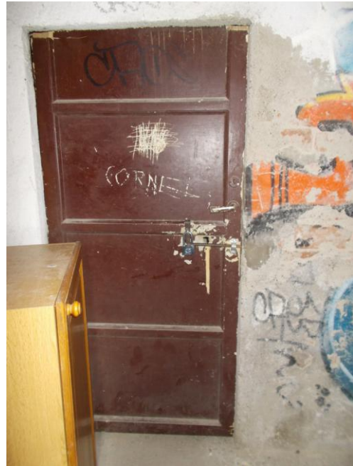
36. Ingresso cantina di pertinenza