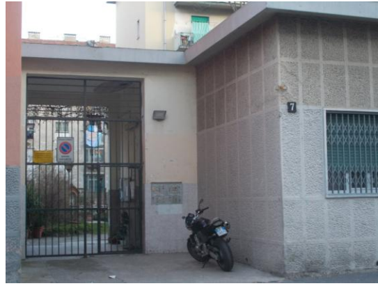
2. Ingresso comune dalla via