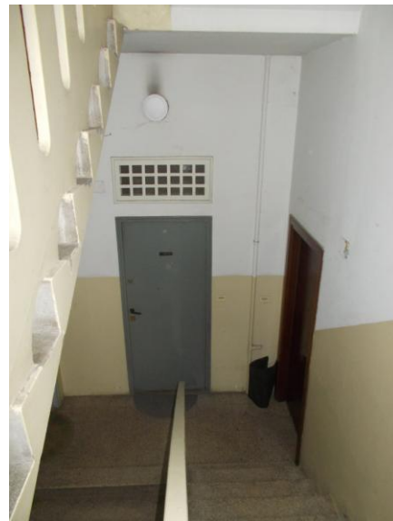
6. Corpo scala comune