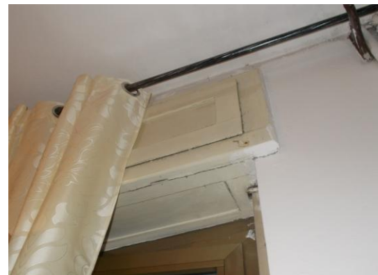
34. Cassonetto coprirullo