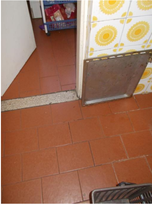
25. Pavimento della cucina