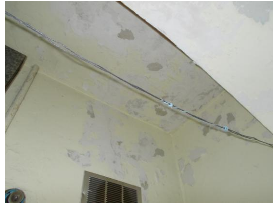
30. Soffitto della veranda