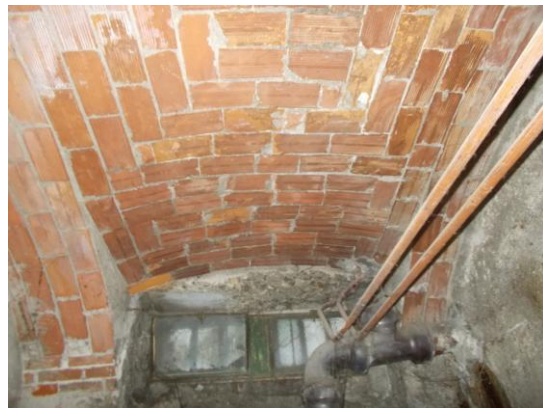
38. Soffitto interno della cantina