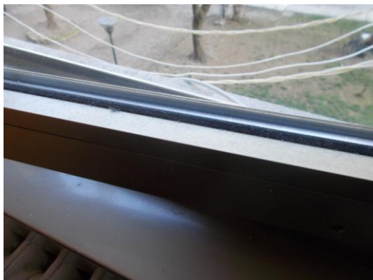
33. Dettaglio serramento interno