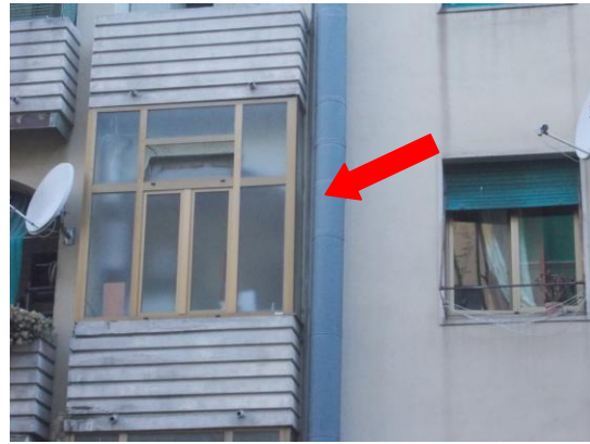
32. Dettaglio della veranda dall'esterno