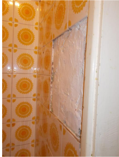
26. Rivestimento della cucina