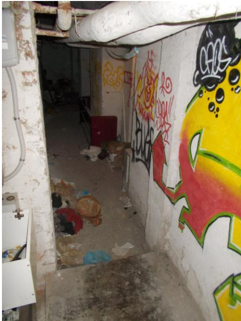
35. Corridoio comune delle cantine