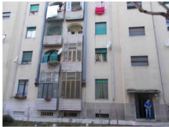
4. Fabbricato scala C