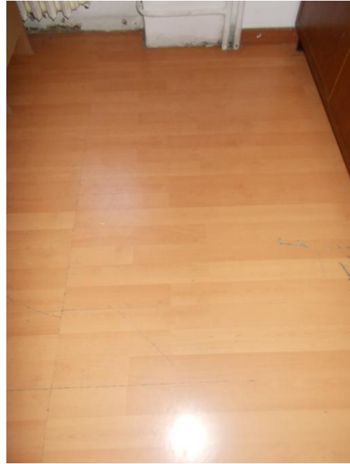
12. Particolare pavimento del soggiorno