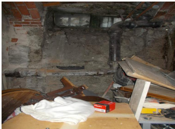
37. Interno della cantina