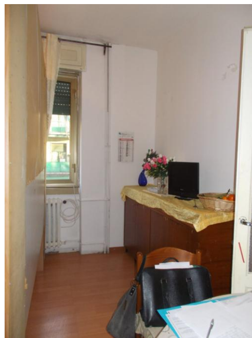
10. Locale soggiorno (mobile collocato in mezzo al locale)