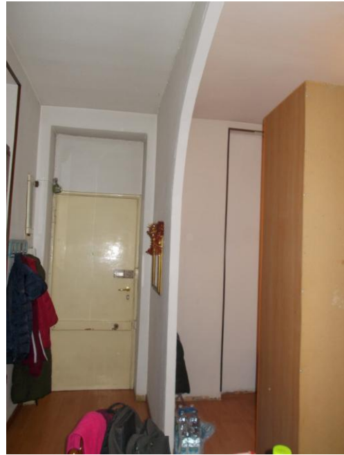
22. Zona ingresso/soggiorno