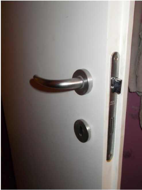
21. Dettaglio porta della camera