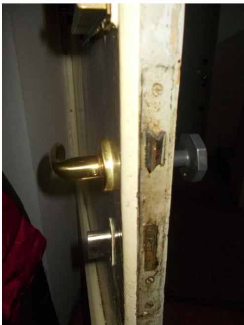
7. Portoncino di ingresso