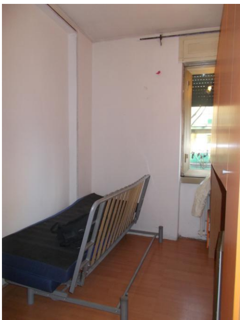
9. Locale soggiorno (mobile collocato in mezzo al locale)