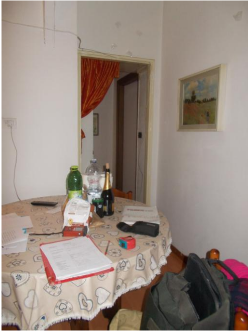
11. Zona pranzo nel soggiorno