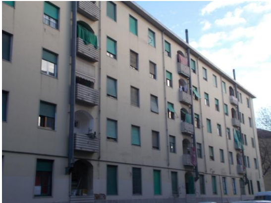
1. Facciata esterna dalla via Abbiati