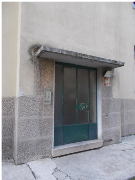
5. Ingresso al fabbricato scala C