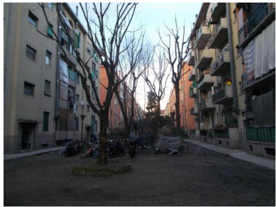
3. Cortile comune centrale