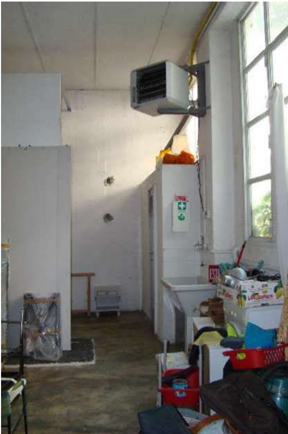
7. Vista del locale.