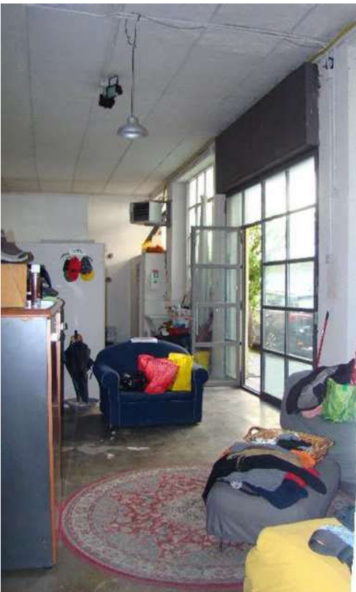
10. Dettaglio dell'ingresso.