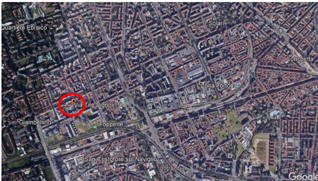
2. Vista aerea del contesto con individuazione dell'edificio.