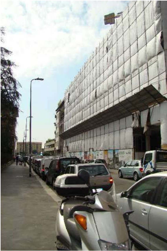
5. Rilievo fotografico del contesto; vista verso via Savona.