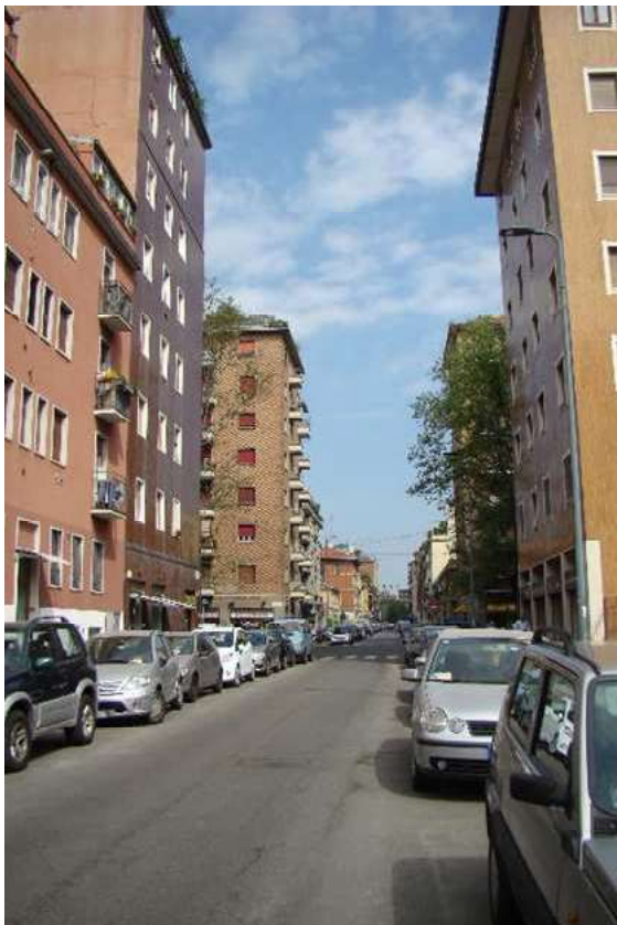
4. Rilievo fotografico del contesto; vista verso via Giambellino.