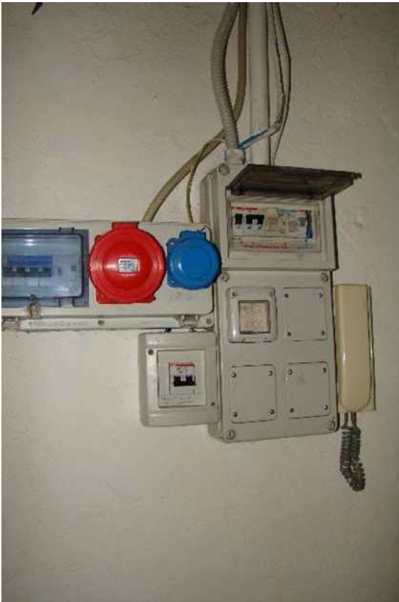
9. Dettaglio dell'impianto elettrico.