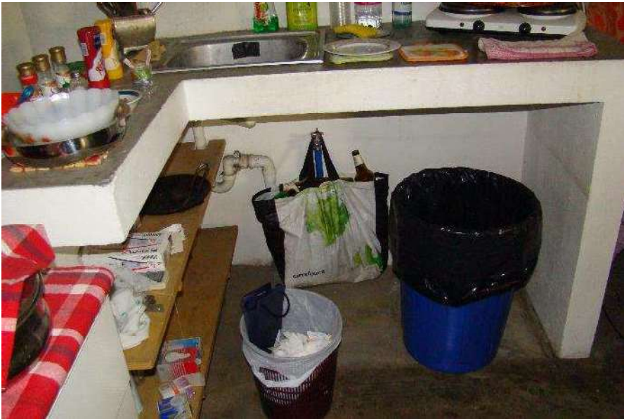
17. Vista dell'angolo cottura creato.