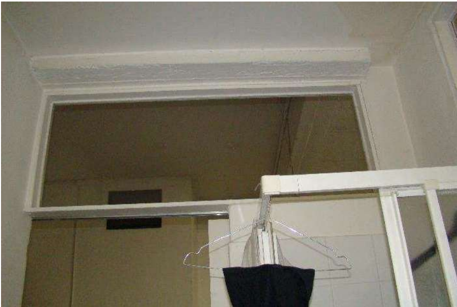
14. Dettaglio della porta di accesso al bagno.