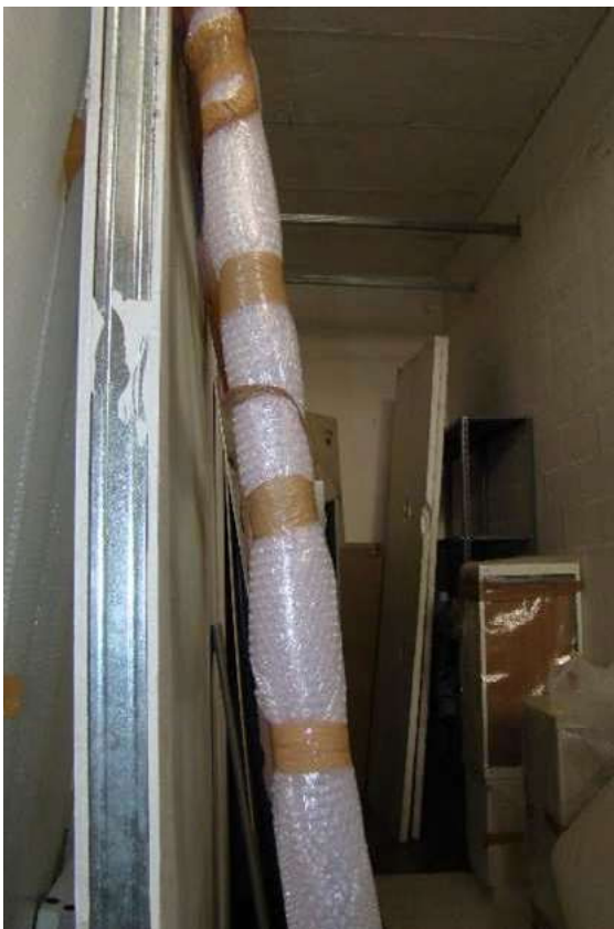
8. Dettaglio della parete in cartongesso.