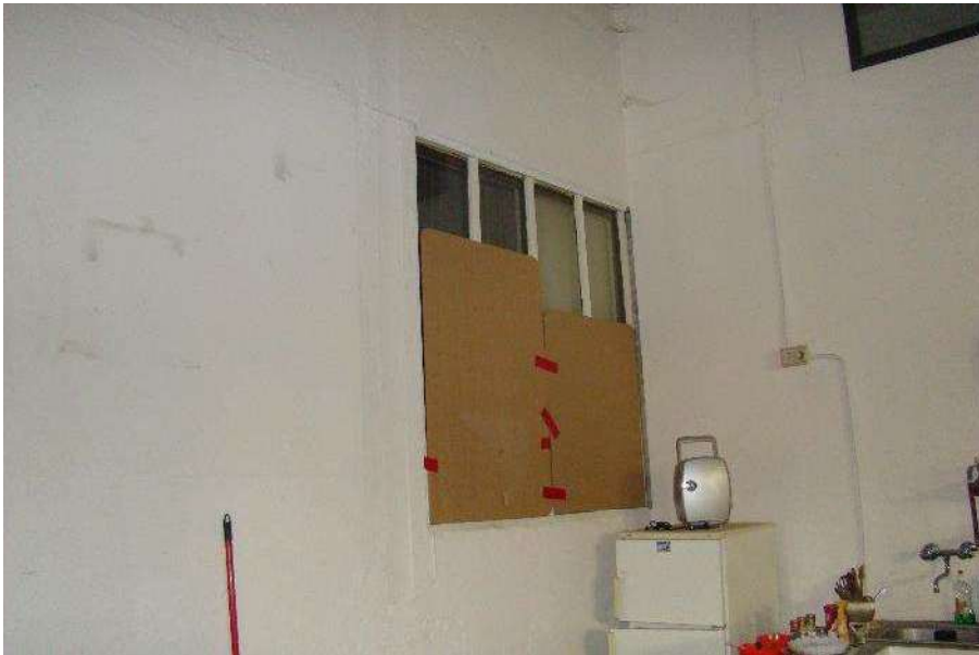
16. Dettaglio della finestra tra il sub. adiacente e il locale.