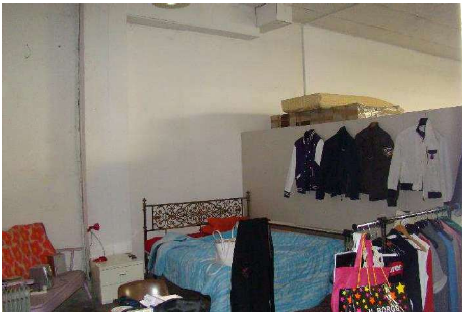
6. Vista del locale.