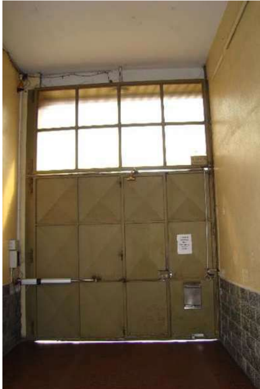
2. Vista del portone dall'interno.