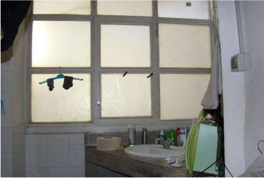
13. Vista del bagno grande.