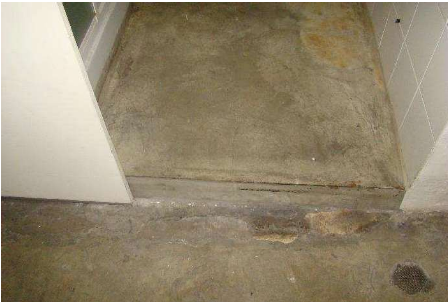
18. Dettaglio della pavimentazione.