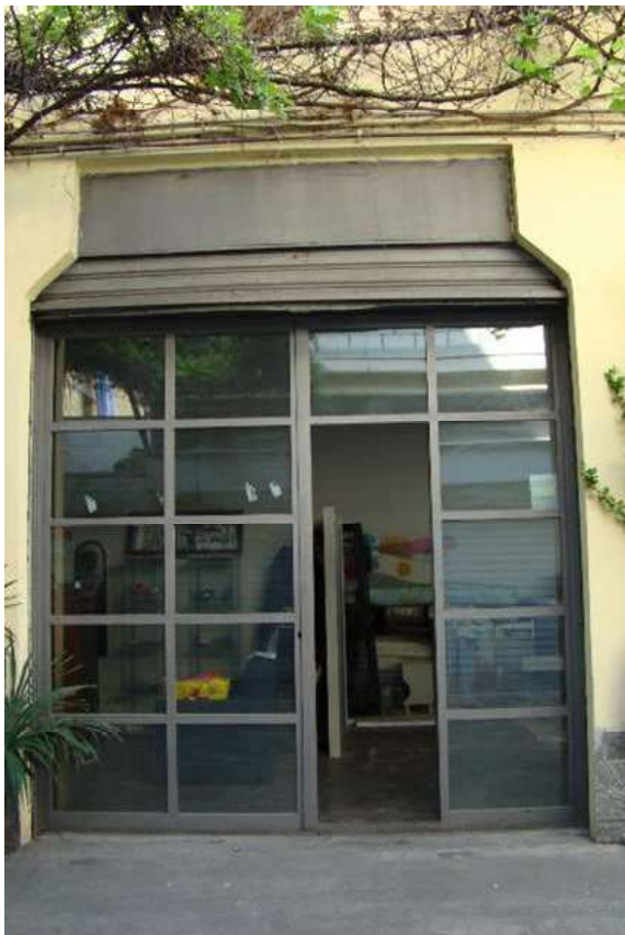
4. Dettaglio dell'ingresso.