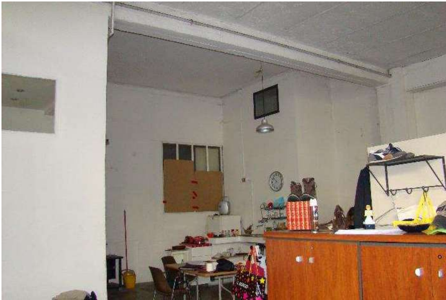
5. Vista del locale.