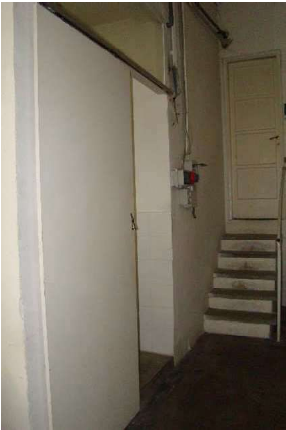
15. Vista della scala e della porta di accesso al subalterno adiacente.