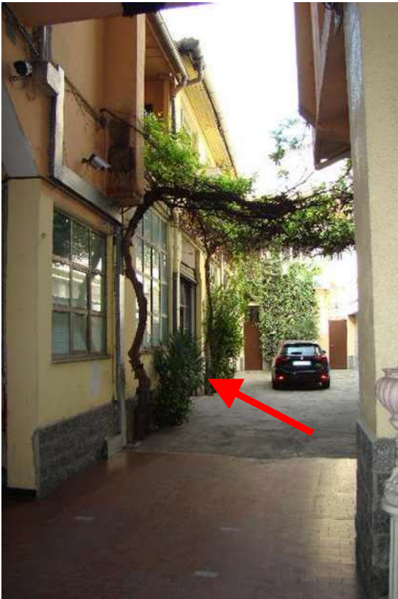
3. Vista del cortile e indicazione di accesso all'immobile.