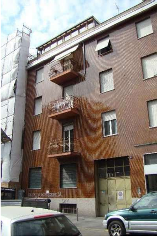
1. Vista principale dell'edificio da via Vignoli ed individuazione dell'ingresso carrabile/pedonale.