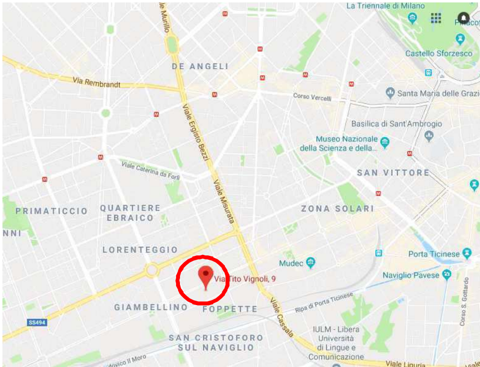
1. Vista aerea del contesto.