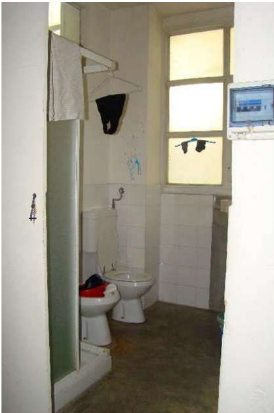
12. Vista dell'altro bagno.