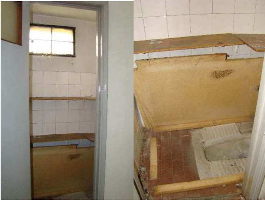
11. Vista del bagno piccolo (latrina).