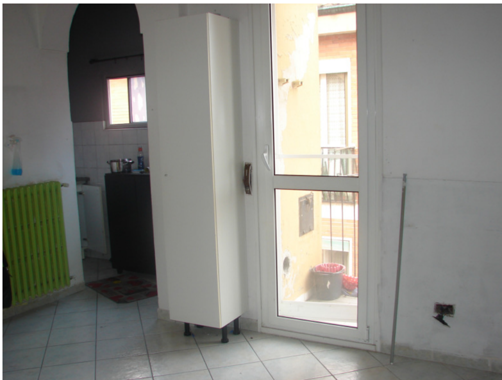
Foto 6 – Accesso al cucinotto e porta su balcone stradina interna