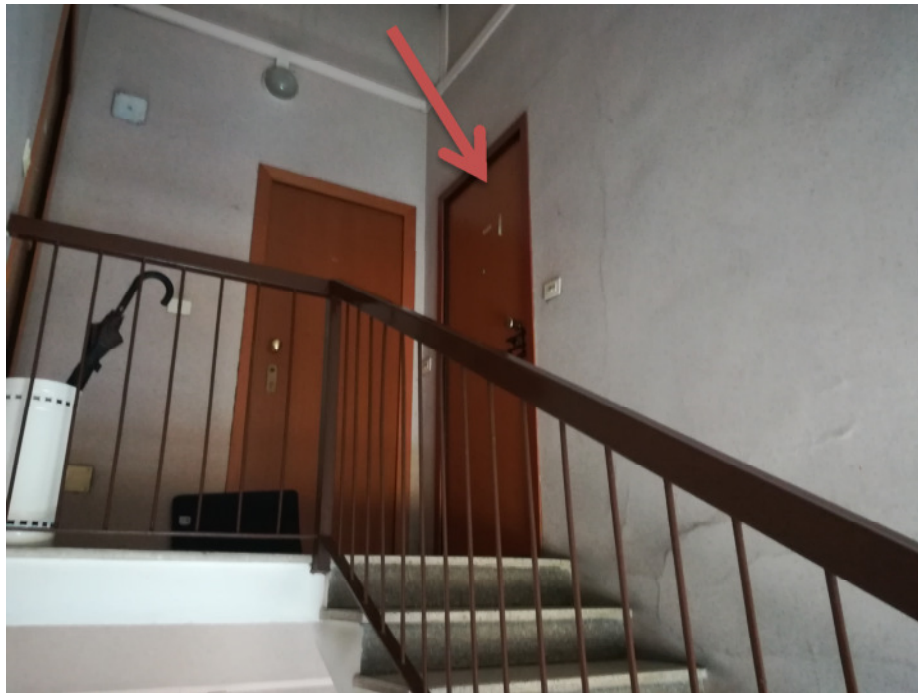
Foto 4 – Scale e porta d'ingresso all'appartamento, terzo ultimo piano