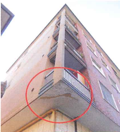
Vistosa crepa sul fianco dell'edificio