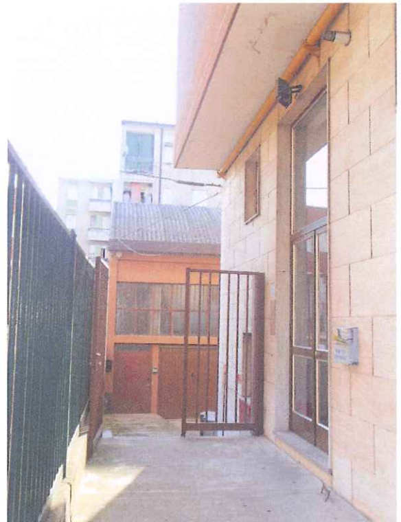
Accesso esterno di accesso condominiale