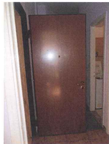
Porta di accesso all'unità immobiliare

Perito del Tribunale di Milano n°10830 . Qualifiche. -Impatto Ambientale-Piani di Sicurezza-Certificazioni Energetiche