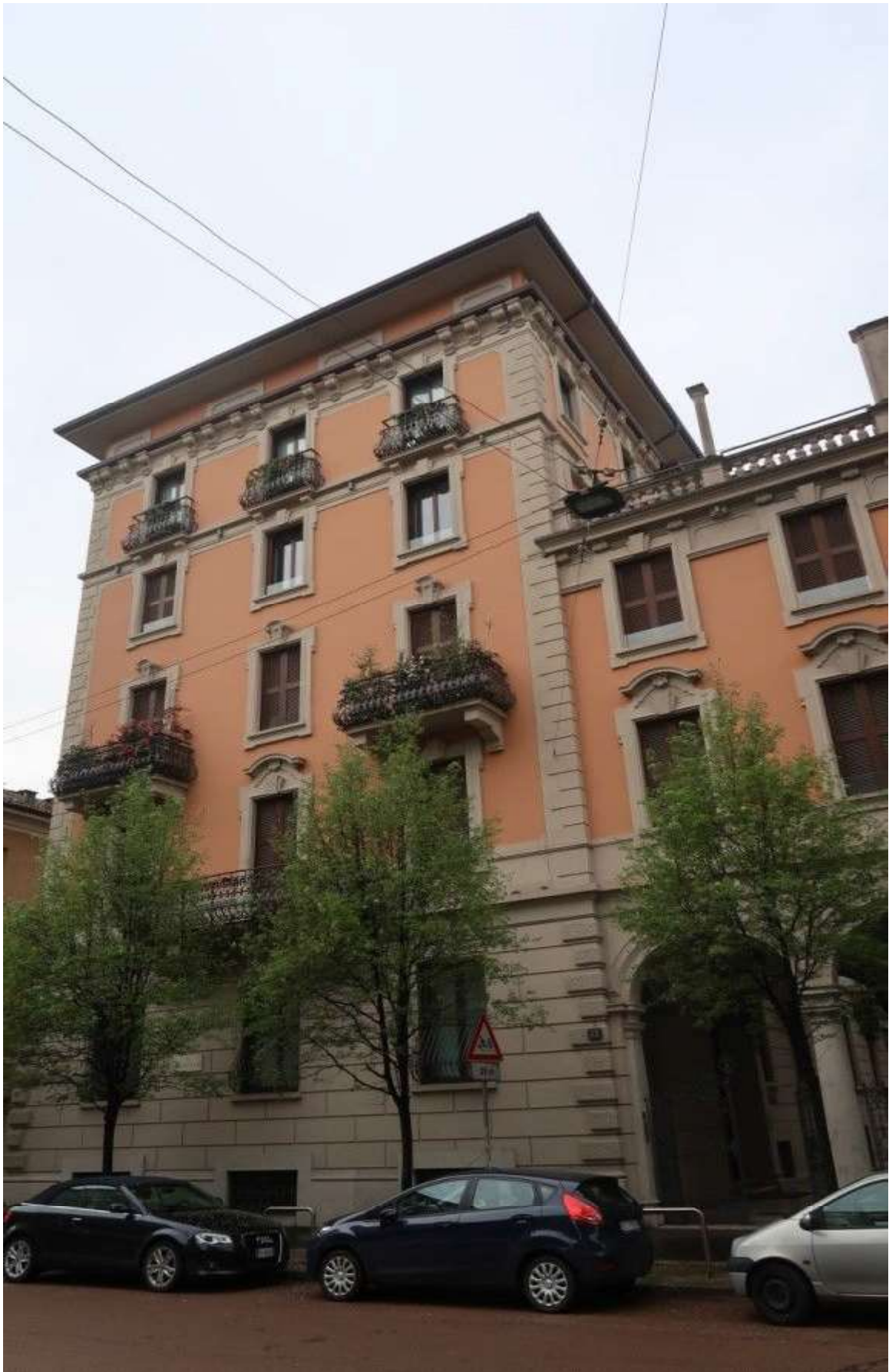
FACCIATA SU VIA S. VITTORE