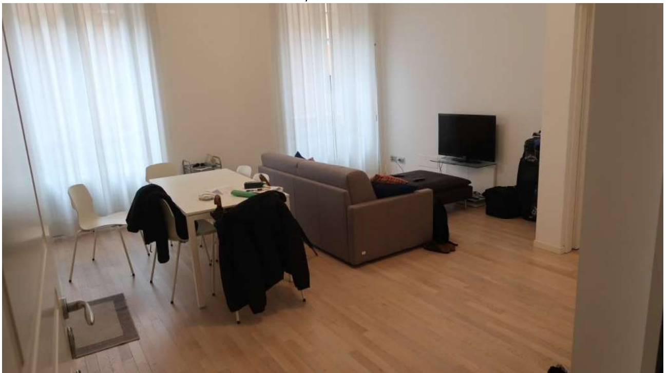
SOGGIORNO/CUCINA FOTO 2