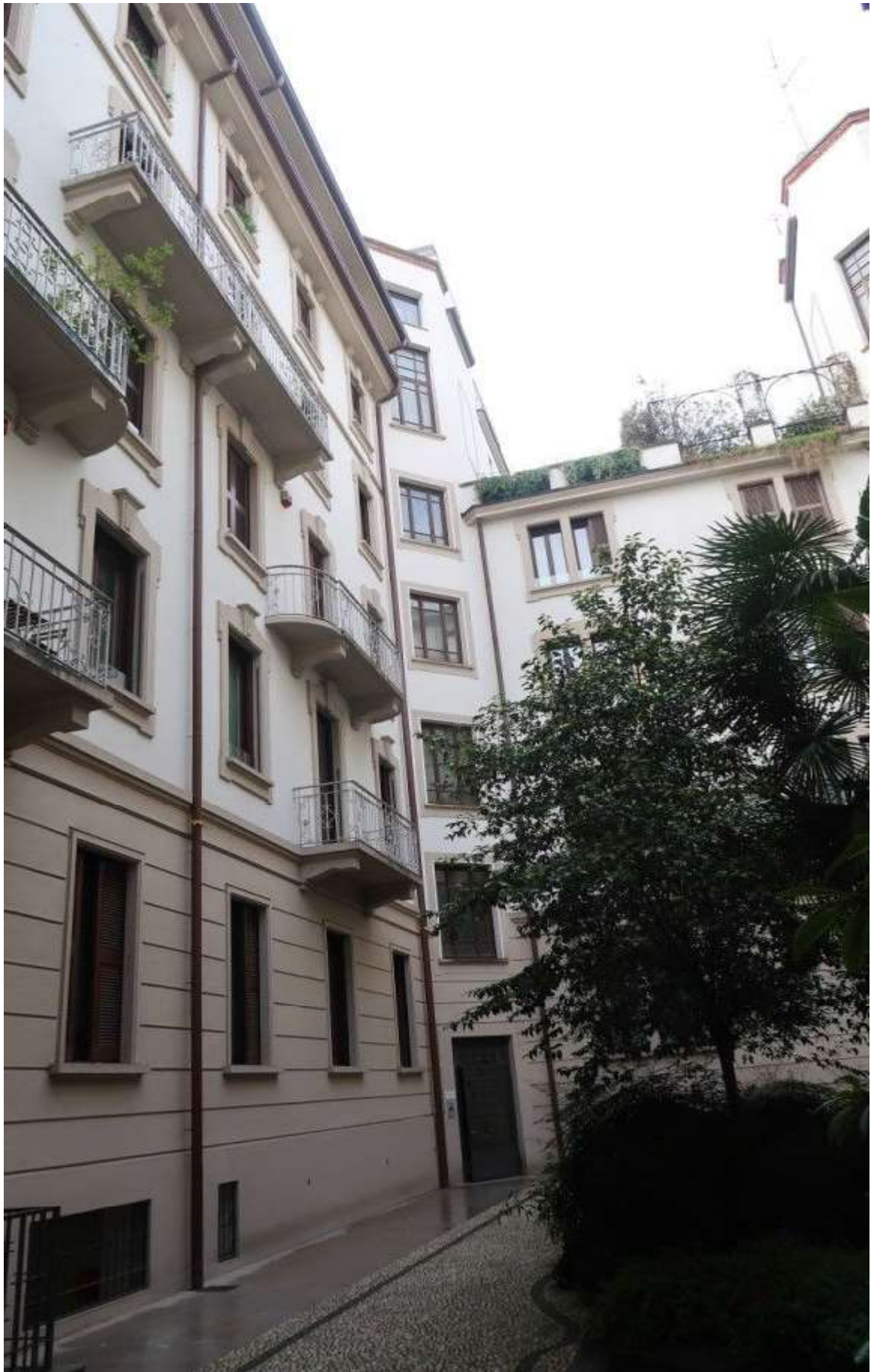
FACCIATA SU CORTILE INTERNO