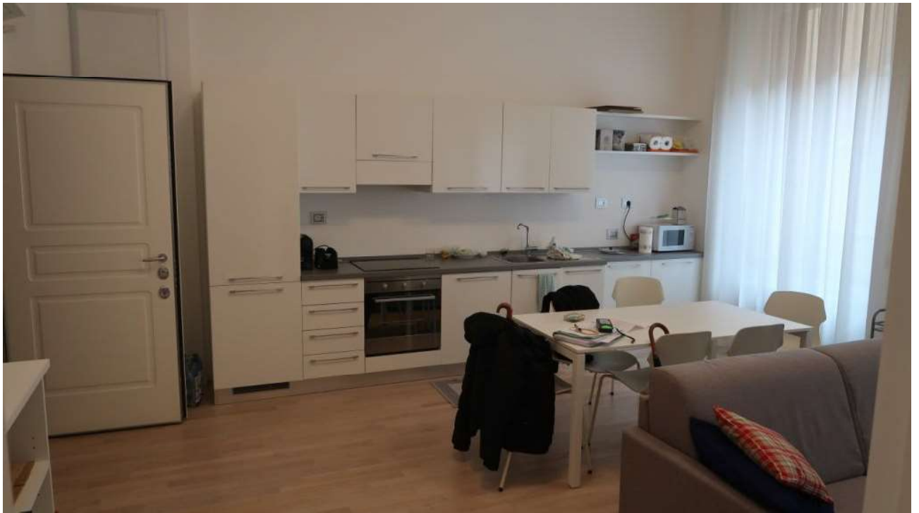
SOGGIORNO/CUCINA FOTO 1