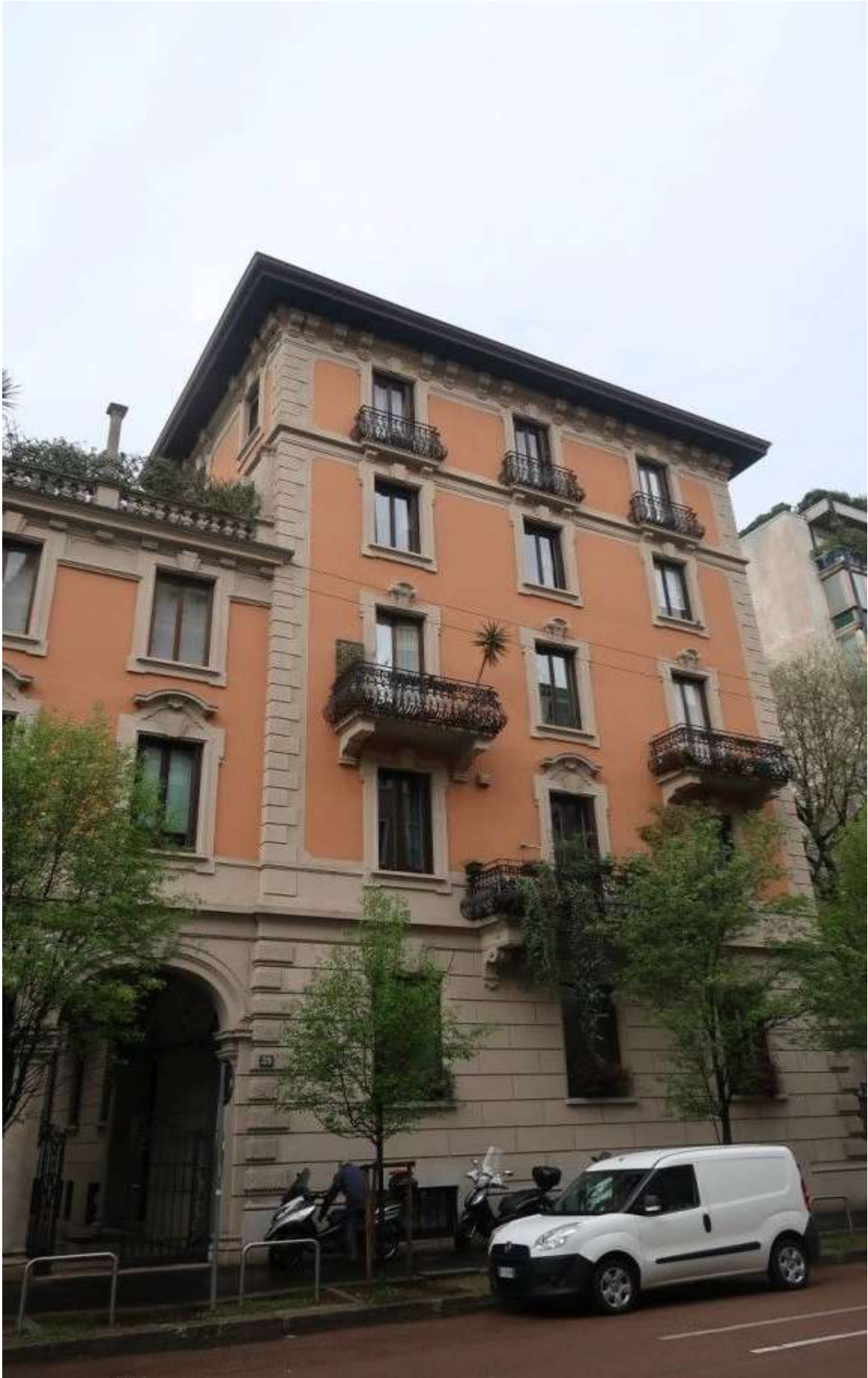
FACCIATA SU VIA SAN VITTORE