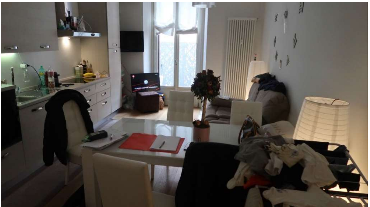
CUCINA FOTO 2