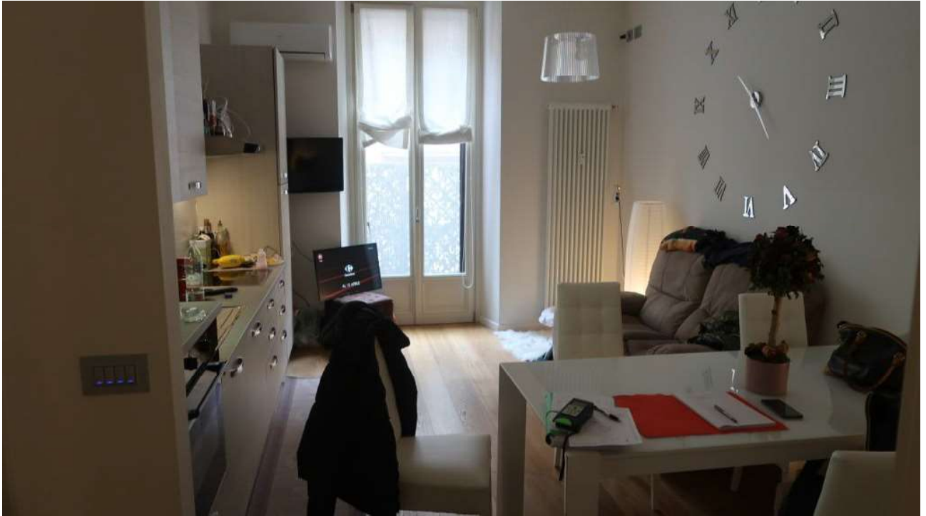
CUCINA FOTO 1