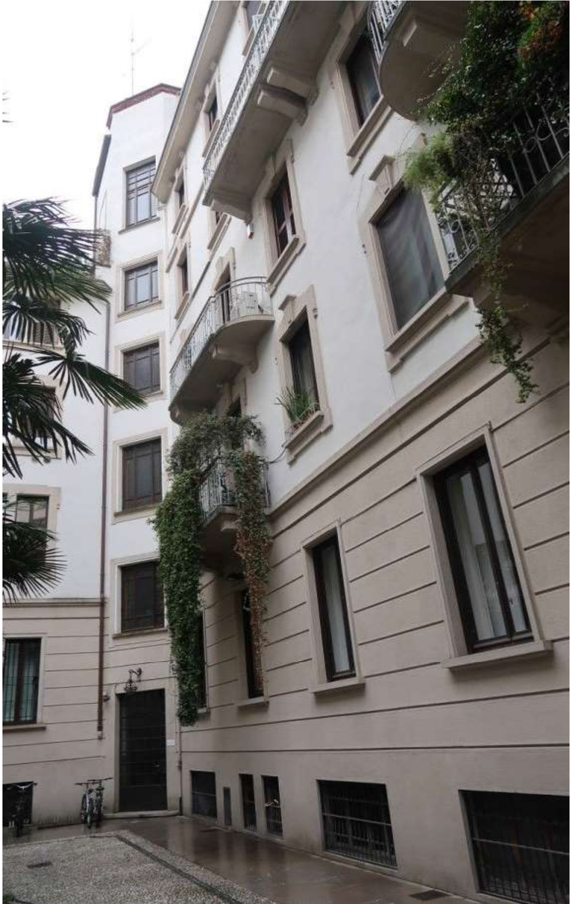
FACCIATA SU CORTILE INTERNO