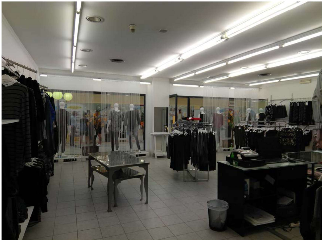
Vista interna del negozio