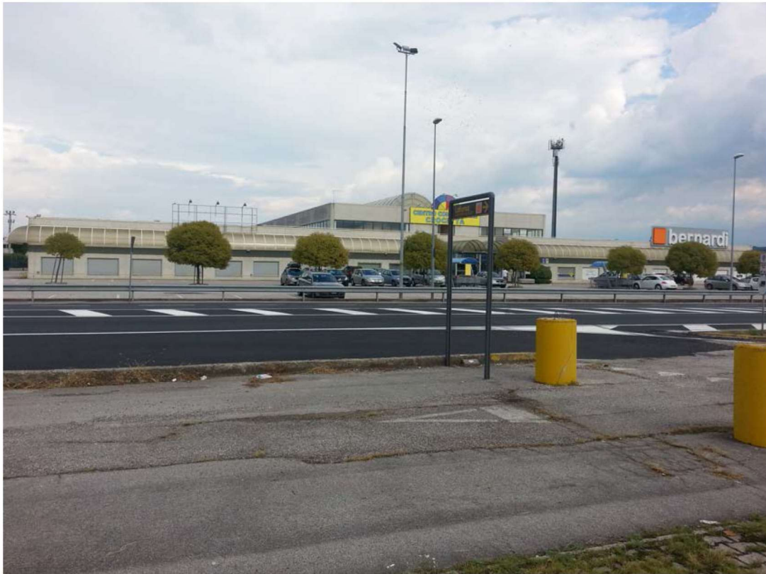
Vista dalla Strada Feltrina Centro Commerciale Crocetta – ingresso principale