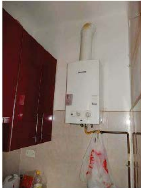
FOTO 12 e 13: Interno dell'unità pignorata – Scorci del cucinotto, con vista di dettaglio, nell'immagine di destra, dello scaldacqua a gas.