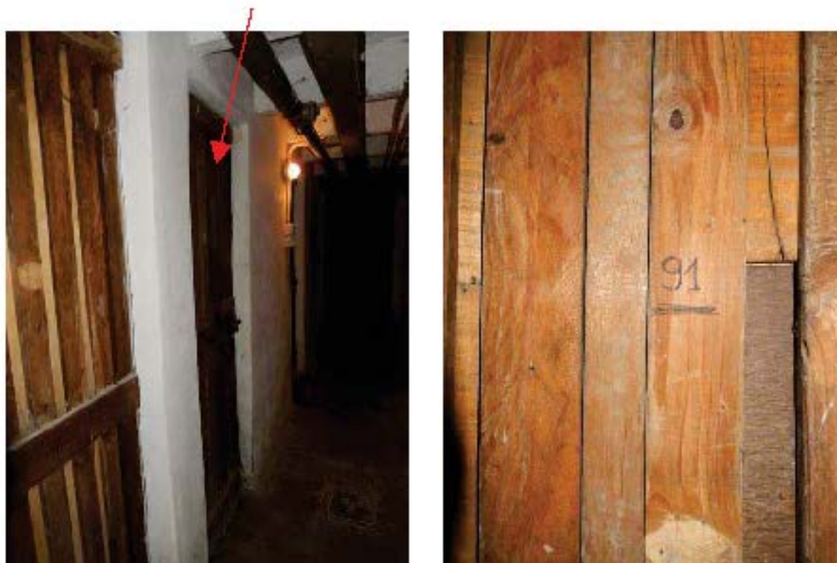
FOTO 22 e 23: Cantina dell'unità pignorata – Viste esterne, con dettaglio del n. 91 che la identifica.