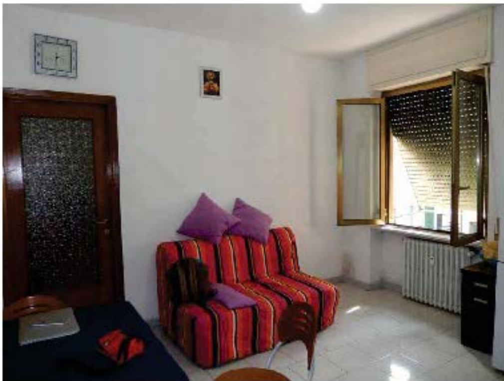
FOTO 10: Interno dell'unità pignorata – Scorcio del soggiorno, con vista verso la porta della camera 2.