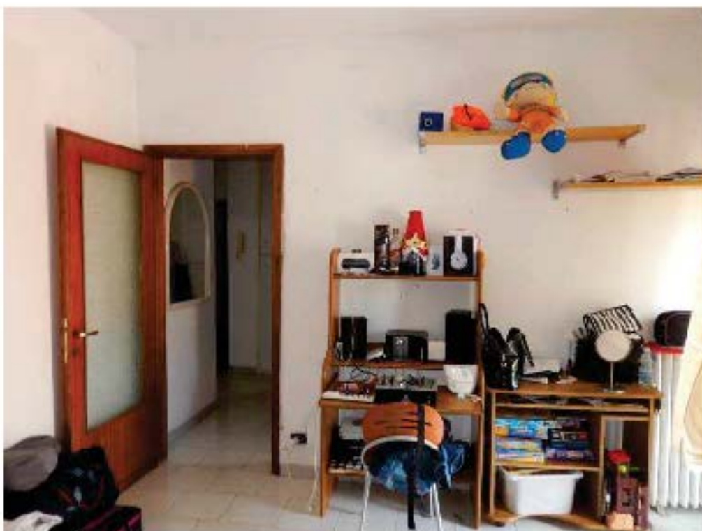
FOTO 17: Interno dell'unità pignorata – Ulteriore scorcio della camera 1.