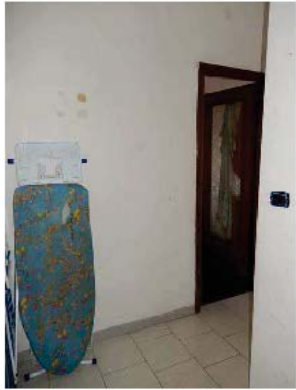
FOTO 8: Vista della porta d'ingresso all'unità pignorata dal disimpegno comune al piano. FOTO 9: Interno dell'unità pignorata – Scorcio del disimpegno all'ingresso, con vista verso la porta del bagno.