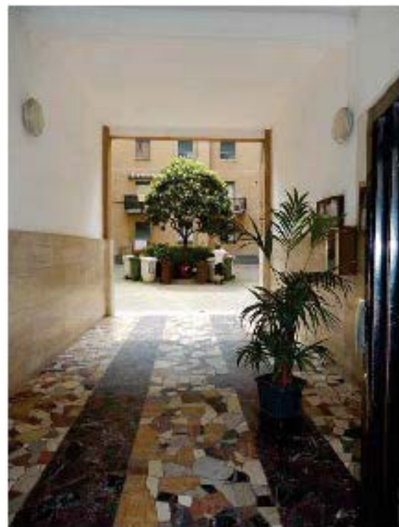
FOTO 2: Vista di maggior dettaglio dell'ingresso allo stabile, con evidenziato l'affaccio dell'unità pignorata. FOTO 3: Scorcio dell'androne d'ingresso comune.