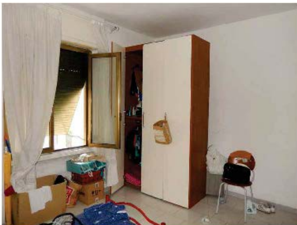
FOTO 15: Interno dell'unità pignorata – Ulteriore scorcio della camera 2.