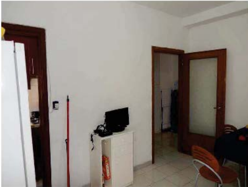
FOTO 11: Interno dell'unità pignorata – Ulteriore scorcio del soggiorno, con vista verso il disimpegno all'ingresso (sulla destra) e la porta del cucinotto (sulla sinistra dell'immagine).