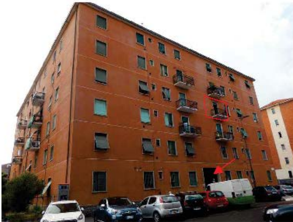
FOTO 1: Vista, dalla Via Cascina Barocco, del fabbricato in cui è sita l'unità pignorata. La freccia indica l'ingresso al condominio, il poligono rosso l'affaccio su strada dell'appartamento in esame.