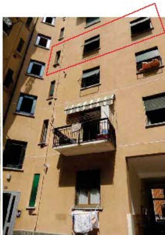
FOTO 5: Vista, dal cortile comune, dell'affaccio dell'unità pignorata, (indicata dal poligono rosso).