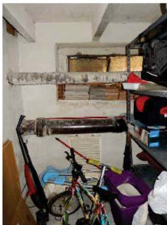
FOTO 24: Cantina dell'unità pignorata – Vista interna. Si notano le tubazioni di impianti comuni che la attraversano.