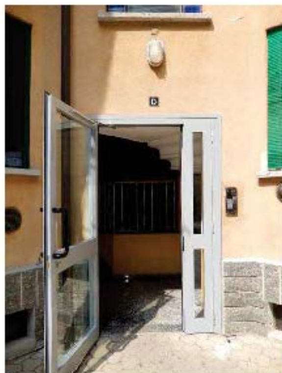
FOTO 6: Vista di dettaglio della porta d'ingresso alla scala D, laddove è ubicata l'unità pignorata.