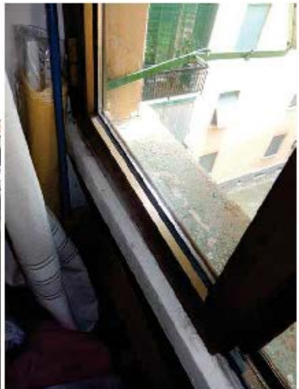
FOTO 20: Esterno dell'unità pignorata – Scorcio del balcone che affaccia sulla via, a servizio della camera 1. FOTO 21: Vista di dettaglio dei serramenti in alluminio, dotati di vetro camera.