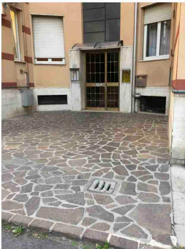
Fotografia n. 4 – Particolare dell'ingresso, sul prospetto principale, al Condominio di Via Gramsci n. 67 – Cormano

Esecuzione Forzata N. 842/2017 UNICREDIT S.P.A. e per essa in qualità di mandataria DOBANK S.P.A. contro [REDACTED]