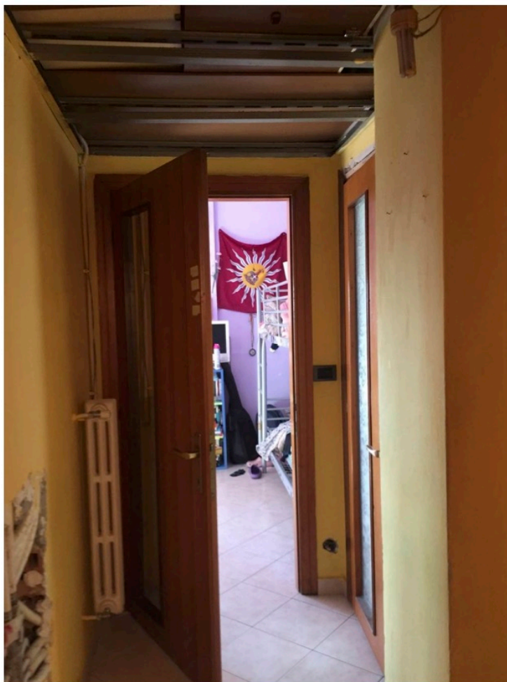
Fotografia n. 15 – Vista del locale disimpegno ribassato ad altezza di ml. 2.20, solo con intelaiatura in alluminio ed assi di legno, ma mancante di chiusura in cartongesso

Esecuzione Forzata N. 842/2017 UNICREDIT S.P.A. e per essa in qualità di mandataria DOBANK S.P.A. contro [REDACTED]