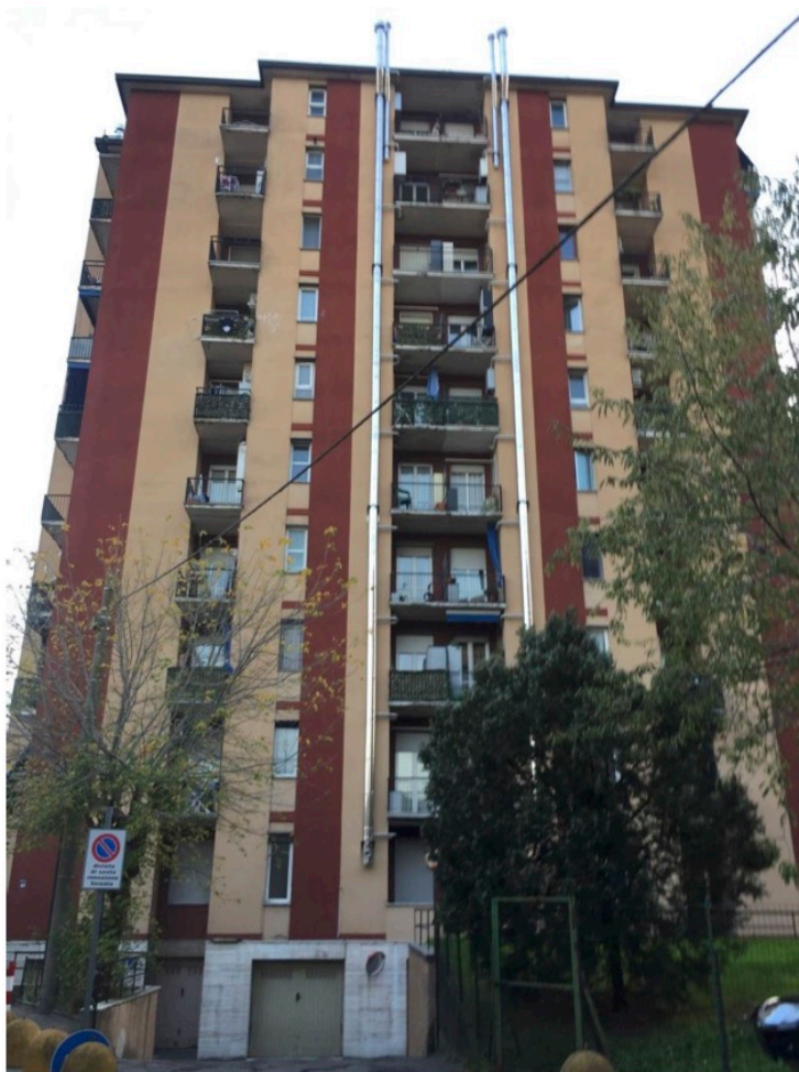
Fotografia n. 2 – Vista del prospetto secondario del Condominio di Via Gramsci n. 67 - Cormano

Esecuzione Forzata N. 842/2017 UNICREDIT S.P.A. e per essa in qualità di mandataria DOBANK S.P.A. contro