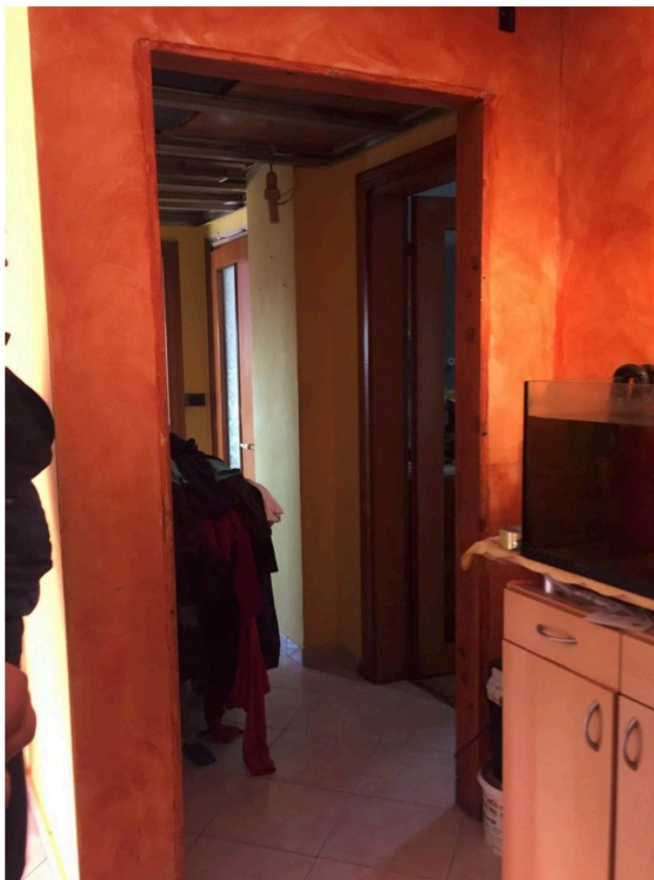
Fotografia n. 14 – Vista dell'accesso al locale disimpegno, sprovvisto di porta e stipiti

Esecuzione Forzata N. 842/2017 UNICREDIT S.P.A. e per essa in qualità di mandataria DOBANK S.P.A. contro [REDACTED]