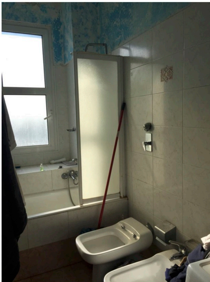
Fotografia n. 20 – Vista del locale bagno, completo di tutti i sanitari

Esecuzione Forzata N. 842/2017 UNICREDIT S.P.A. e per essa in qualità di mandataria DOBANK S.P.A. contro