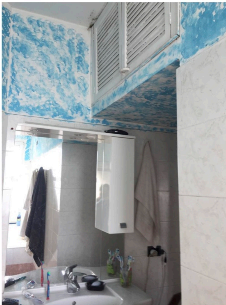
Fotografia n. 19 – Vista del locale bagno, ribassato ad altezza di ml. 2.20 sopra la porta di ingresso al locale, accessibile con doppio sportello apribile