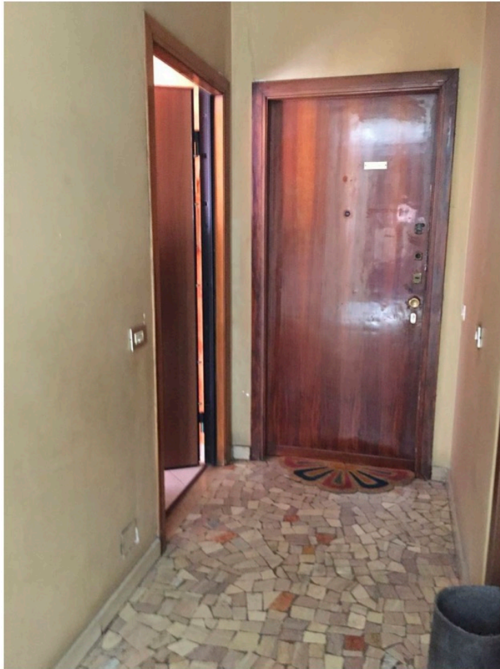
Fotografia n. 9 – Vista del pianerottolo del piano sesto e, sulla sinistra, della porta di ingresso all'appartamento dell'esecutato