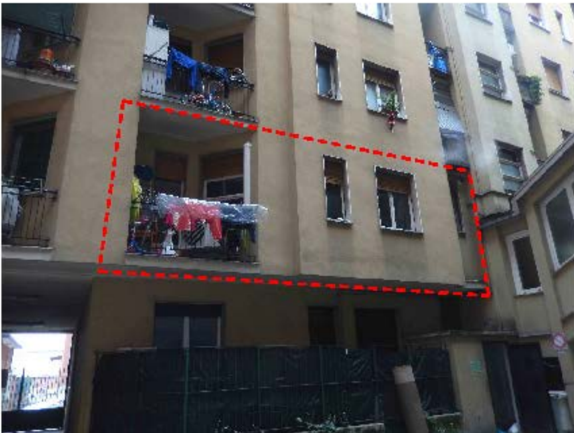
Foto 6 – La facciata sul cortile. Indicato dal tratteggio l'appartamento in esame.