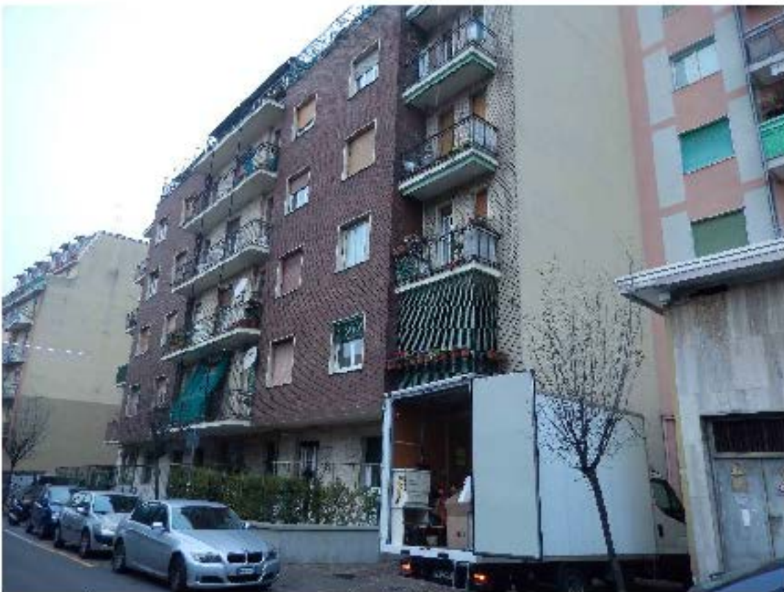
Foto 2 – Il prospetto principale su strada dell'edificio in esame.