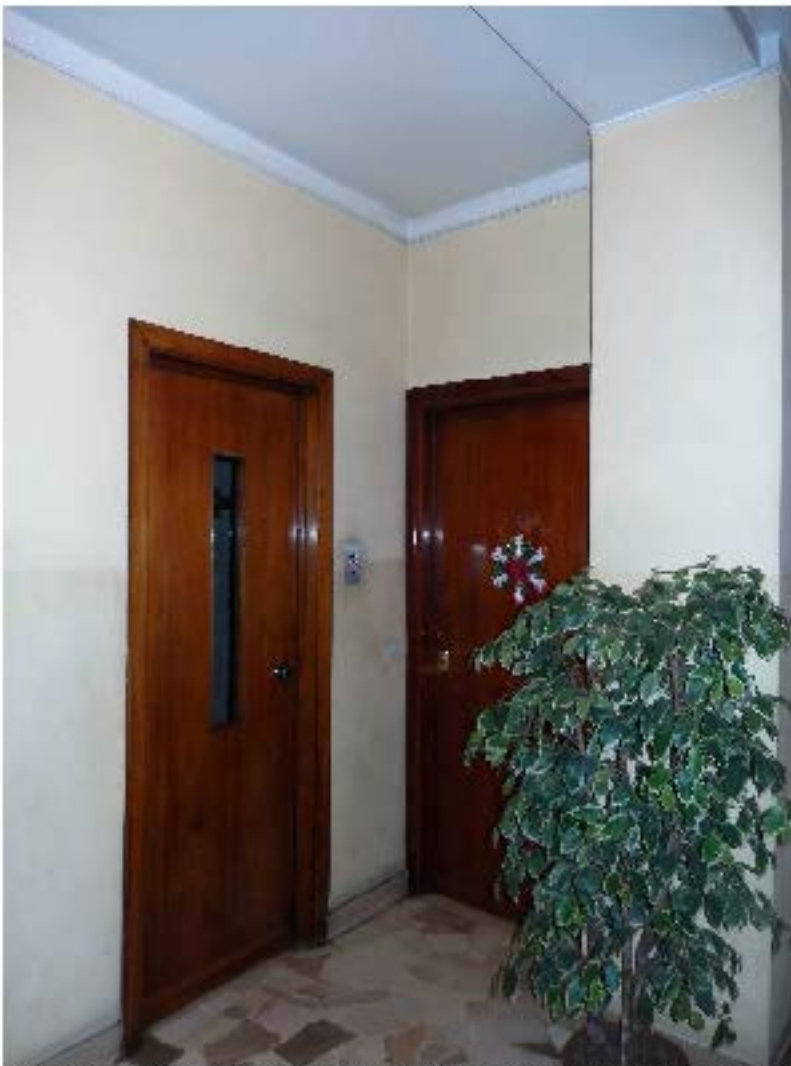
Foto 9 – Il pianerottolo al primo piano. Sulla destra la porta d'ingresso.