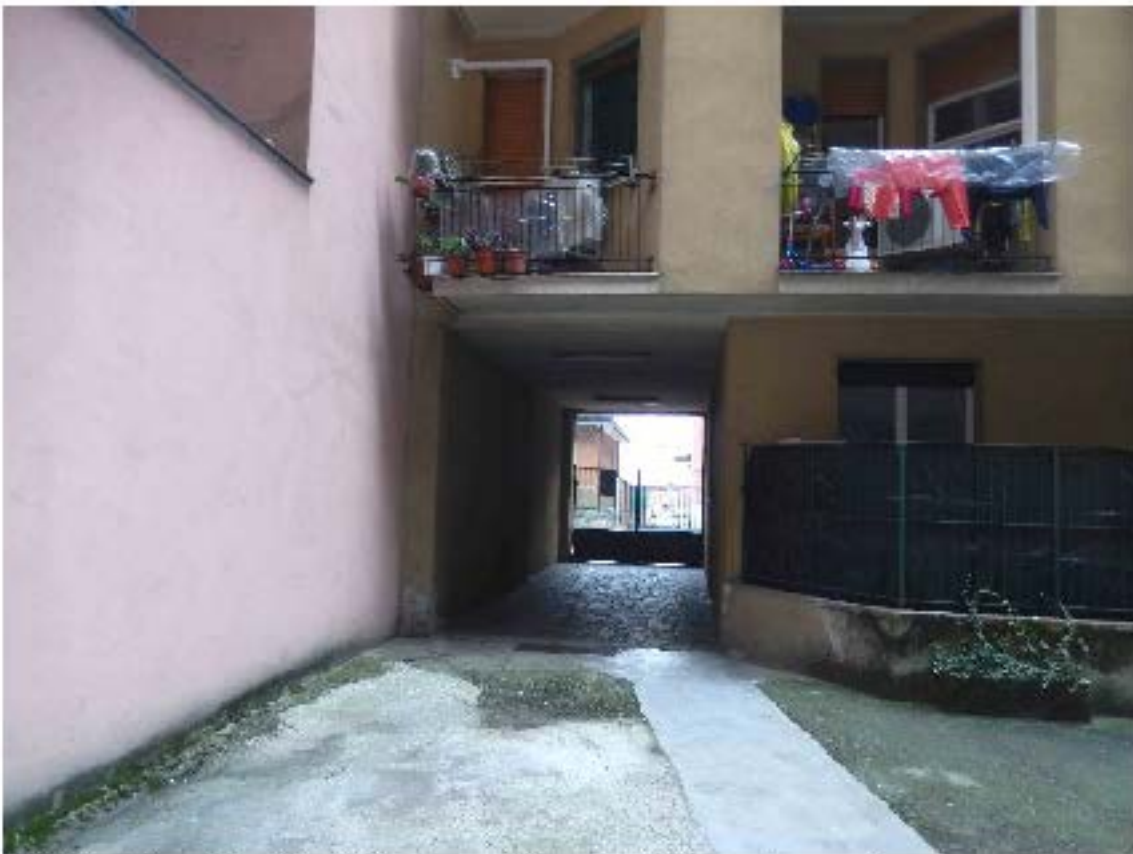
Foto 5 – Altra vista del cortile interno. Sullo sfondo il cancello carraio.