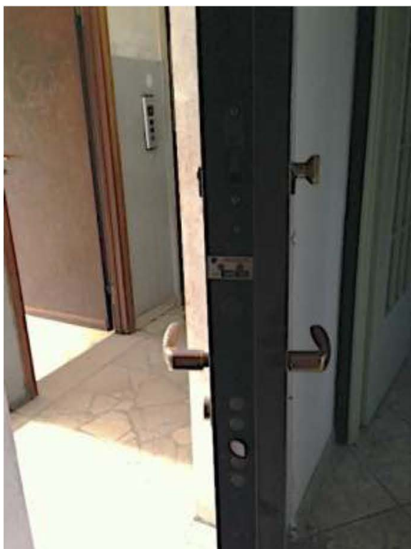
Foto: 06, dettaglio porte interne