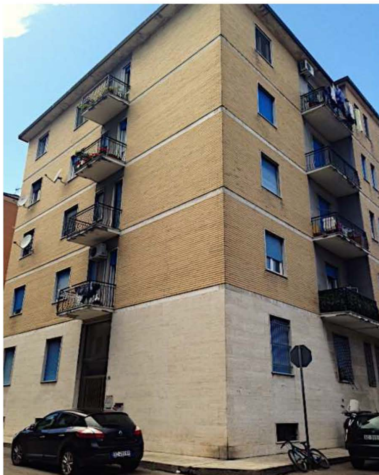
Foto: 02, ingresso dell'edificio

Foto: 03, corridoio d'accesso all'appartamento