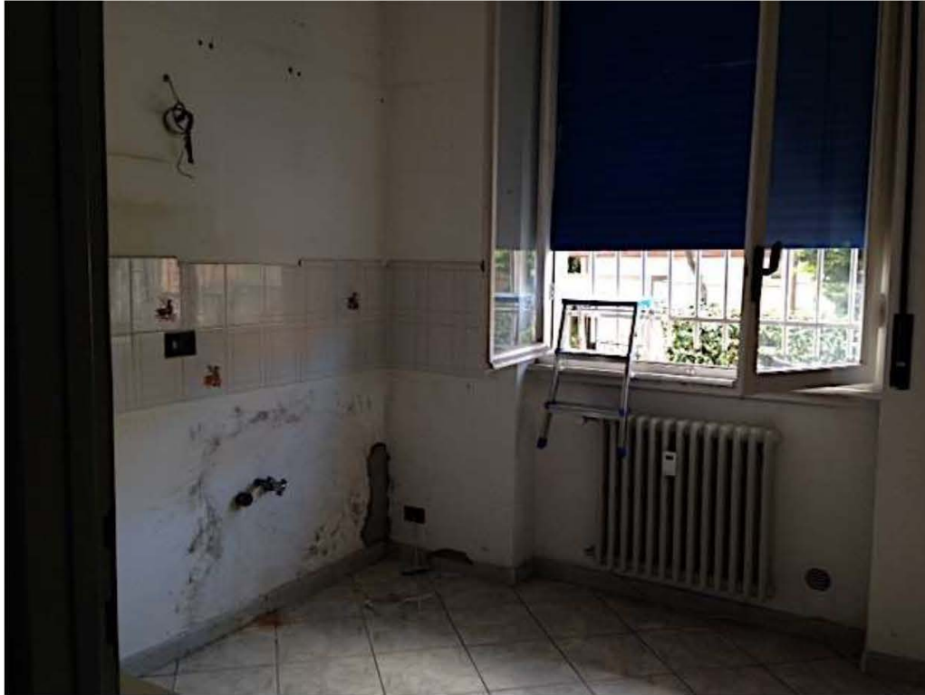
Foto: 12, dettaglio inferiate