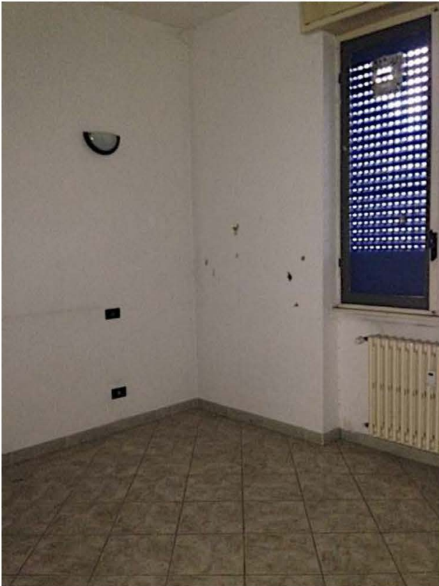
Foto: 08, disimpegno d'ingresso