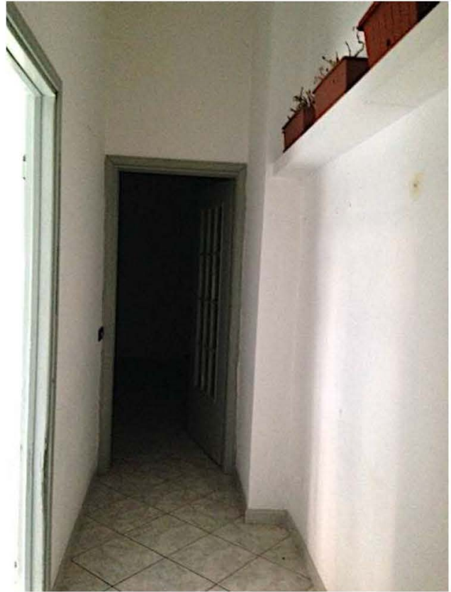
Foto: 09, dettaglio finestra