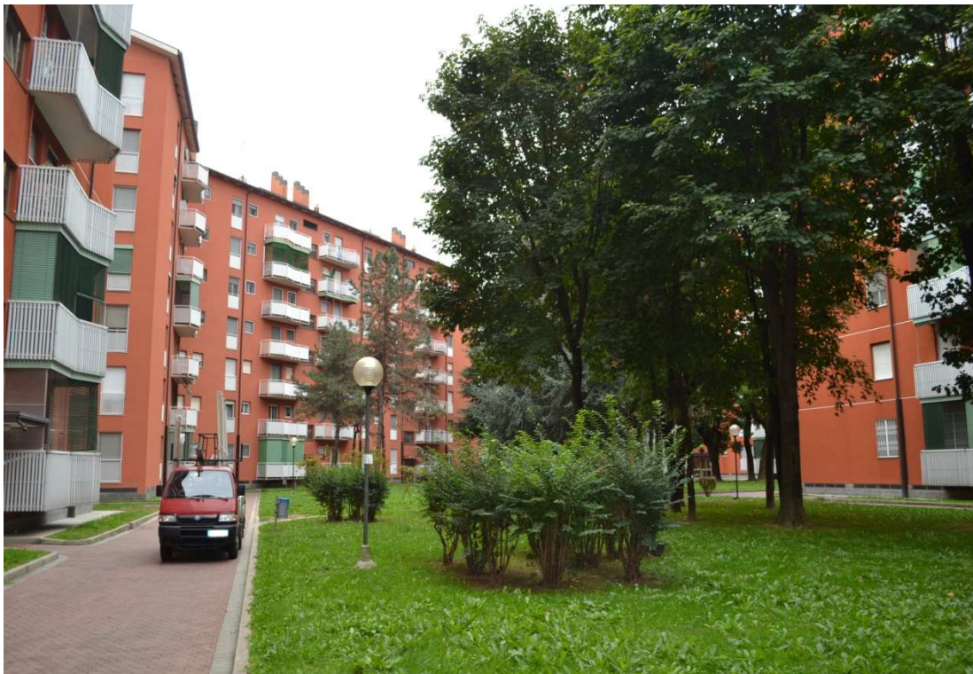
FOTO N. 1 – ESTERNO: Vista facciata edificio sulla sx (scala B) e cortile con giardino del complesso edilizio costituito da più edifici