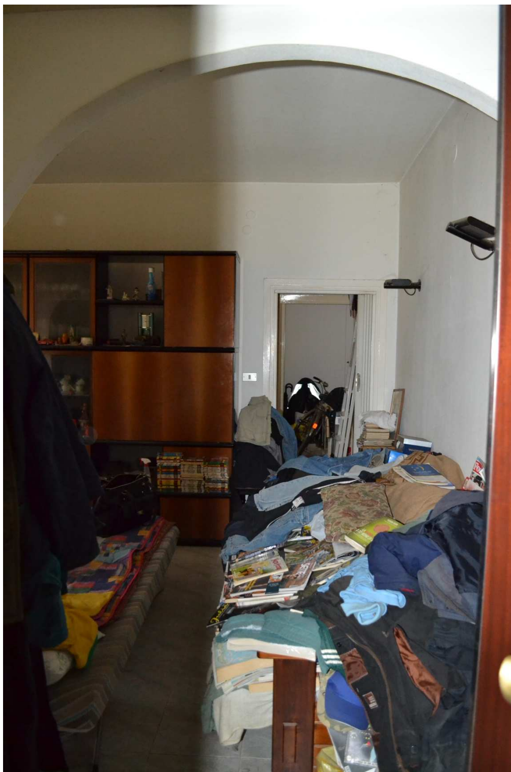
FOTO N. 4 – INTERNO: Locale soggiorno-pranzo. Vista dall'ingresso.