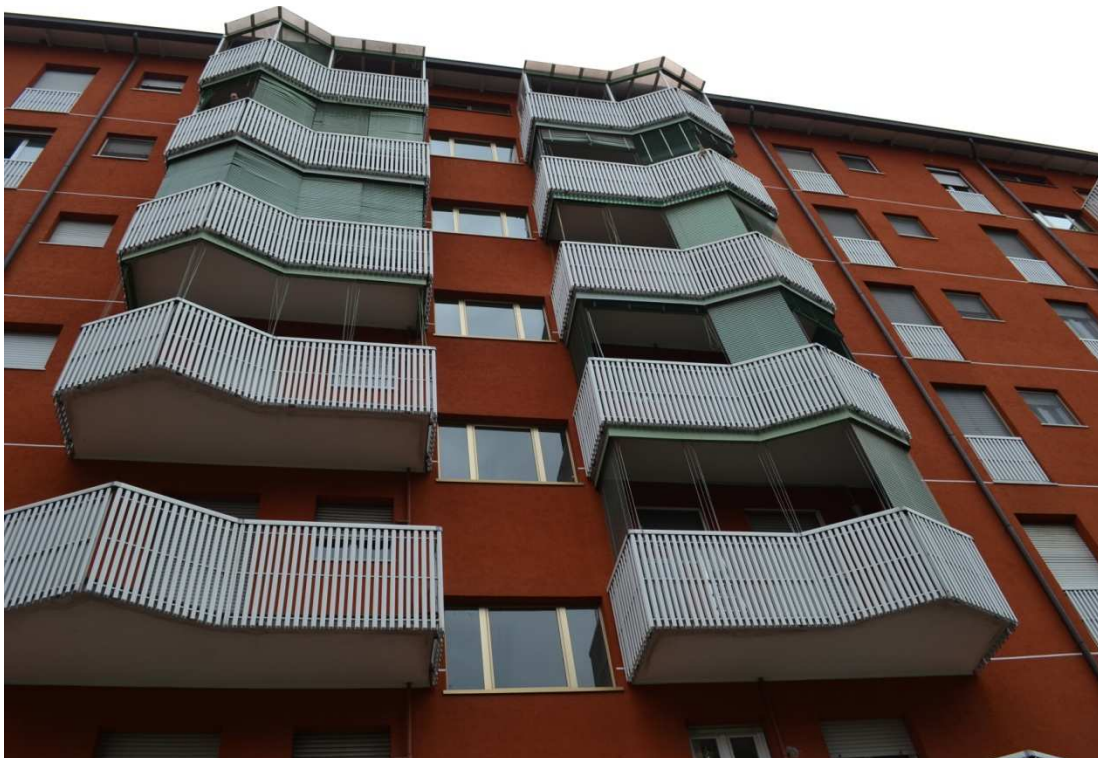
FOTO N. 2 – ESTERNO: Vista facciata edificio scala B su cortile interno