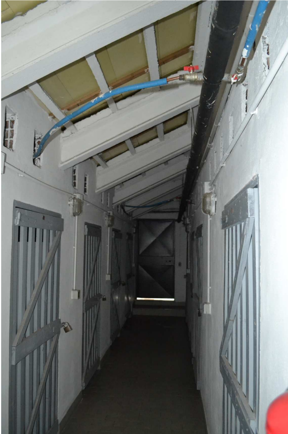
FOTO N. 9 – INTERNO: Sottotetto non abitabile al piano 7°- Vista dalla porta di ingresso al corridoio comune. L’accessorio indiretto dell’appartamento è posizionato sul lato sx (terza porta a sx dall’ingresso comune).