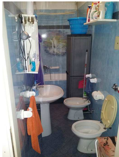
Foto 9 - bagno