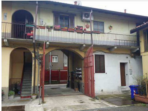
Foto 1 - ingresso allo stabile