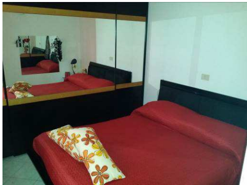
Foto 6 - camera