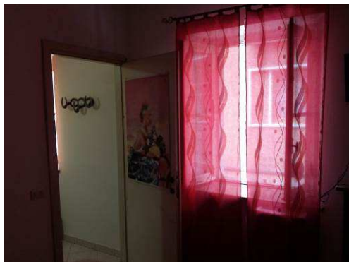
Foto 7 -camera