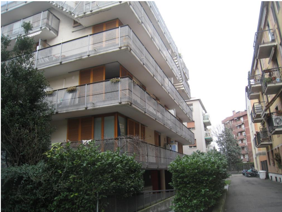
Vista dell'edificio nel contesto del cortile