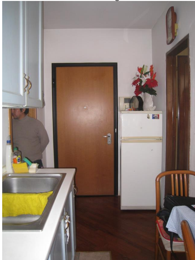
Vista verso la porta di ingresso parete verso destra da demolire )