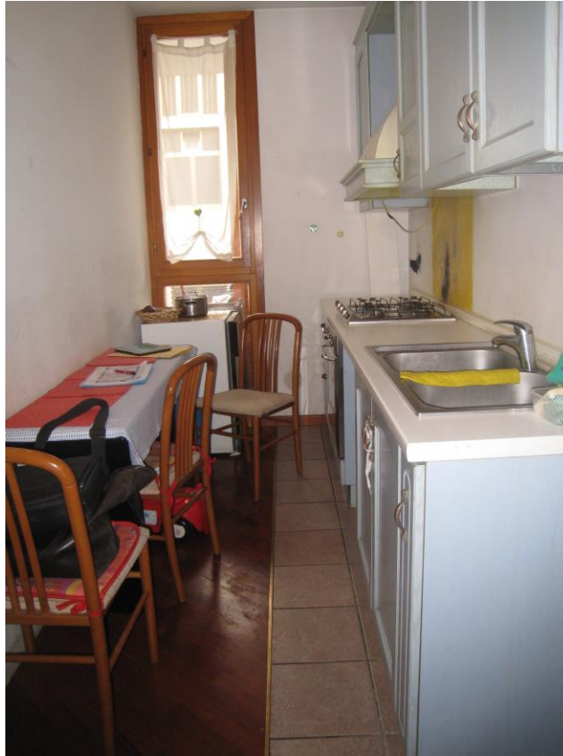
Angolo cottura (parete da demolire)