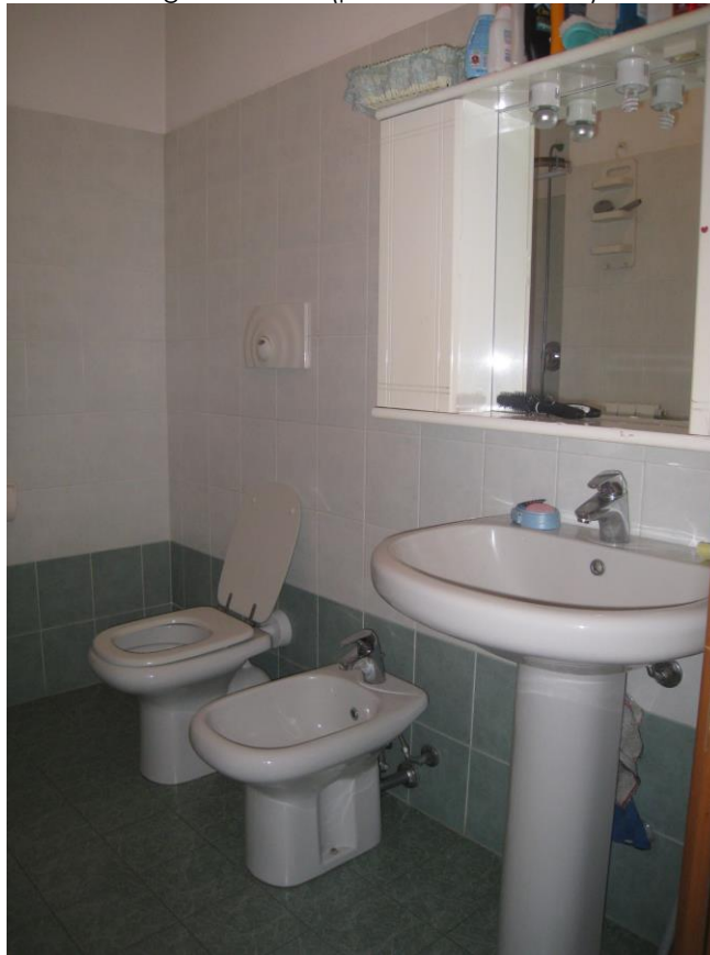
Viste del bagno