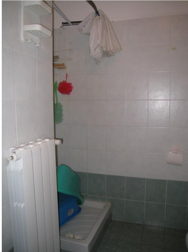
Vista del bagno