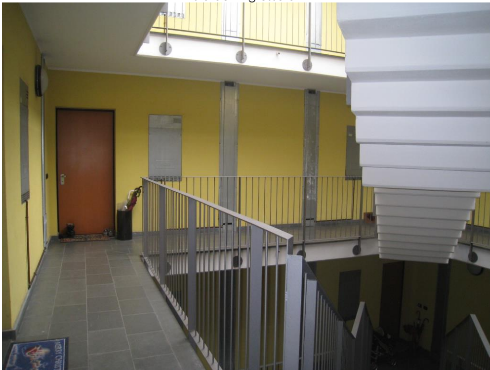
Ballatoi interni e scala comune