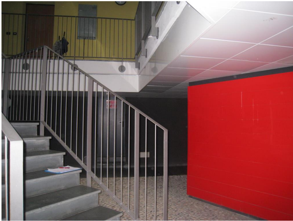
Vista dell'ingresso al PT