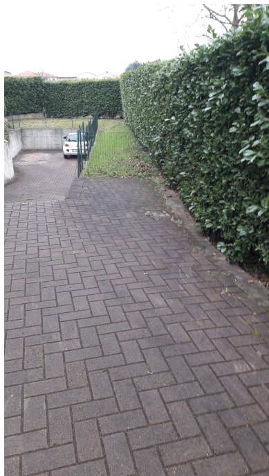
Fig.5: vista posto auto.

Iscritto all'Albo dei Consulenti Tecnici del Tribunale di Milano al n°12247