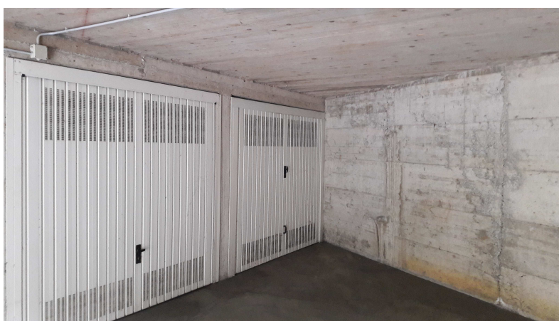
Fig.6: vista box.