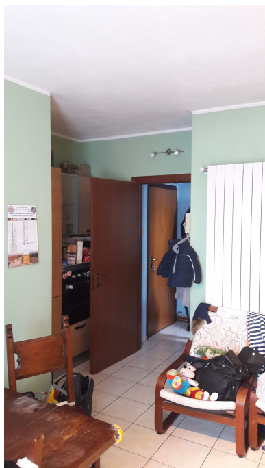
Fig.12: vista del monocale verso ingresso.