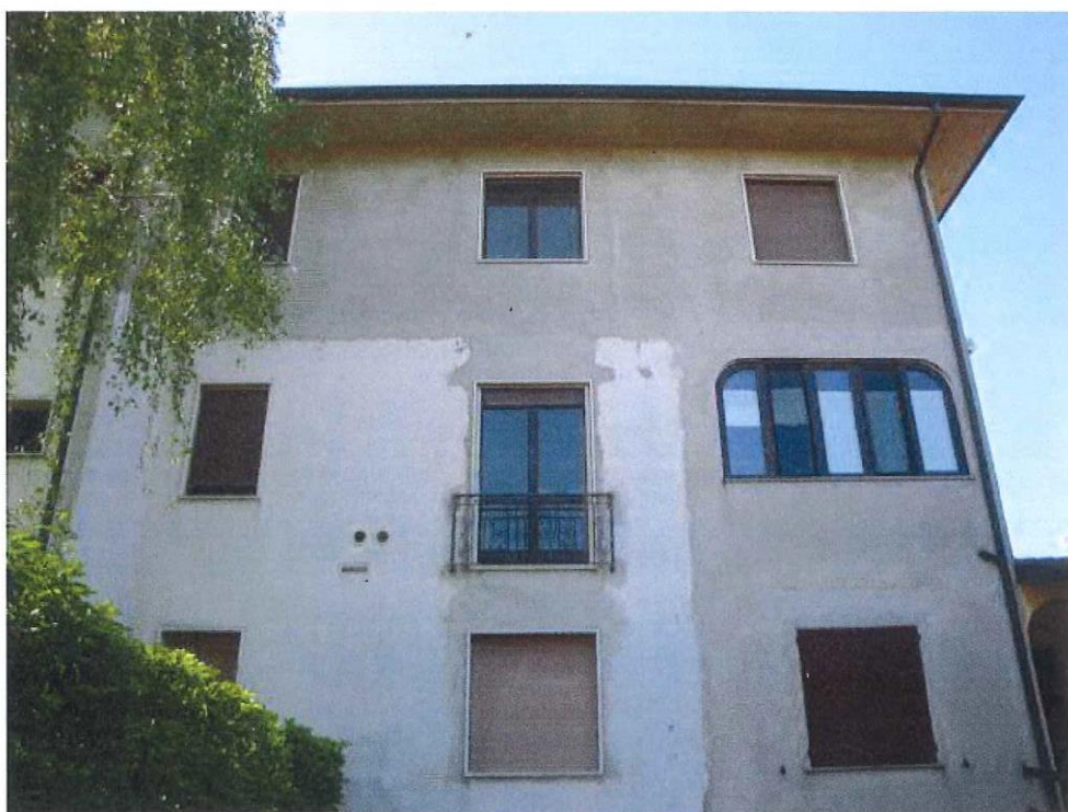
R.G.E. n.° 78/2015 G.E. Dott.ssa M. G. Mennuni Trecella fraz. di Pozzuolo Martesana, Via Pio XII n.°37, piano 1°, F. 4, mapp. 183, sub.702 Prospetti esterni: il lato sud e il lato nord