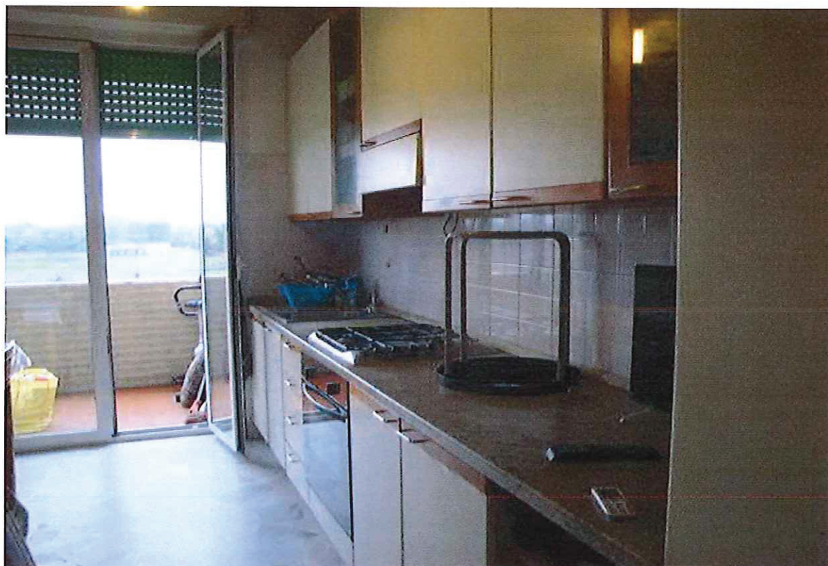
R.G.E. 306/2017, G.E. Dott.ssa M. G. Mennuni Milano, Via Fratelli Zanzottera n.°16/A, piano 2°-5°, Foglio 163, mapp. 45, sub. 43 Prospetti interni: la cucina e il balcone