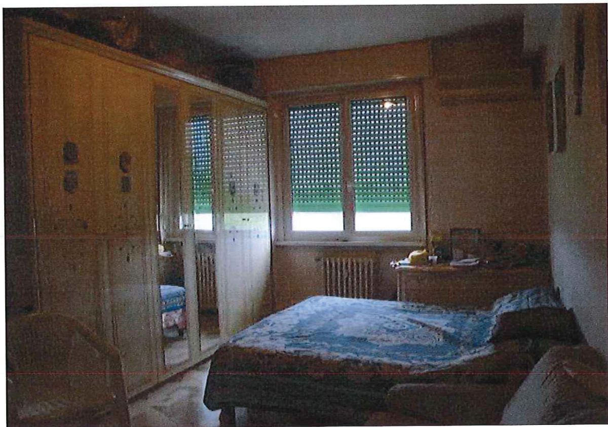
R.G.E. 306/2017, G.E. Dott.ssa M. G. Mennuni Milano, Via Fratelli Zanzottera n.°16/A, piano 2°-5° Foglio 163, mapp. 45, sub. 43 Prospetti interni: la camera da letto