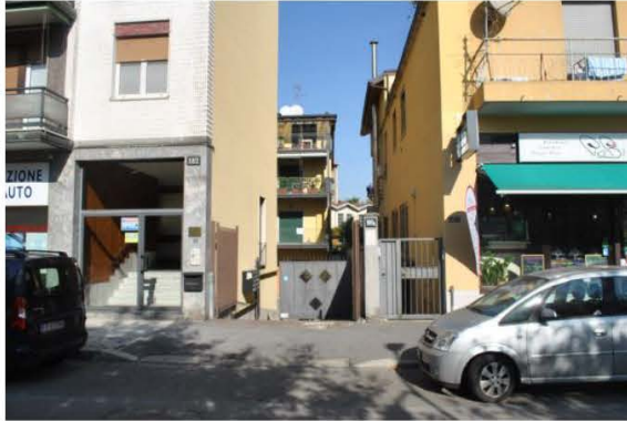
Ingresso carraio e pedonale 180/A