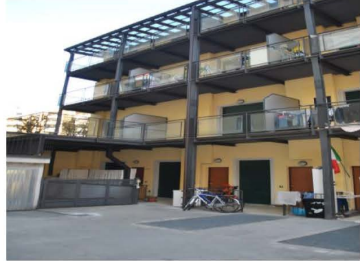
Facciata su corte interna