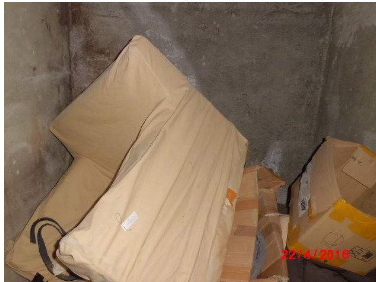
interno della cantina