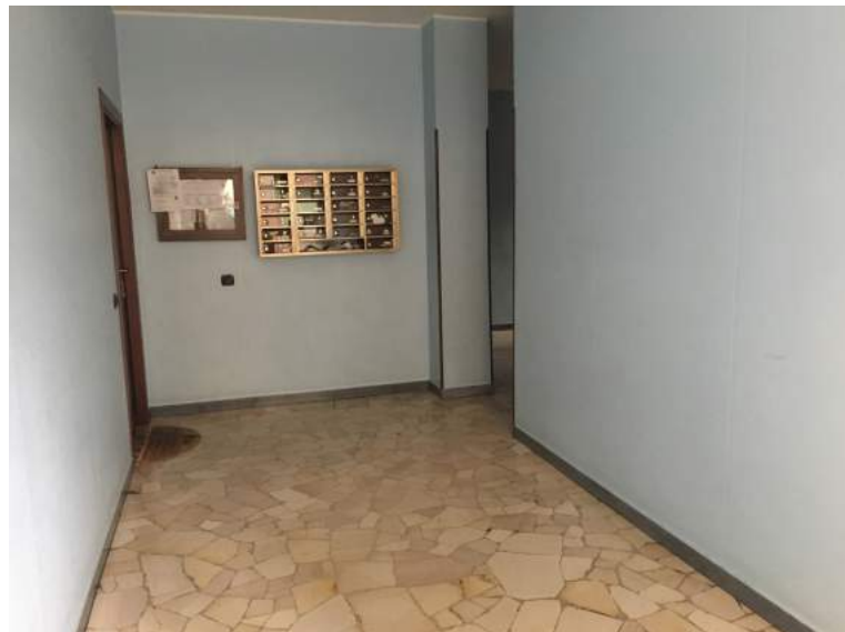
atrio ingresso condominiale