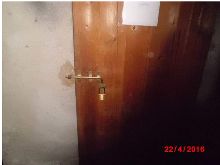
porta della cantina