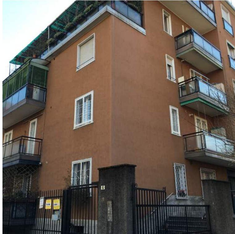
edificio Via Pordenone 6 Baranzate