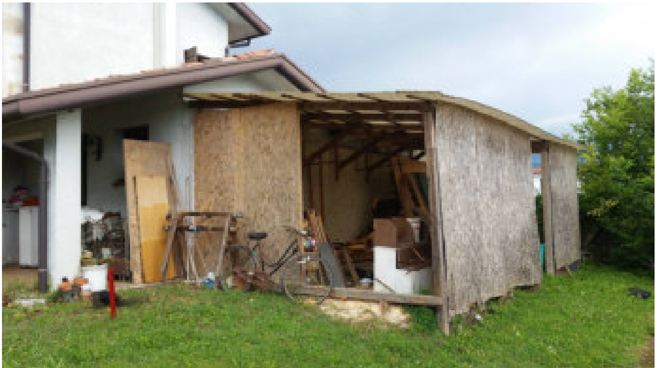
Foto 4 - Tettoia precaria oltre l'ampliamento abusivo