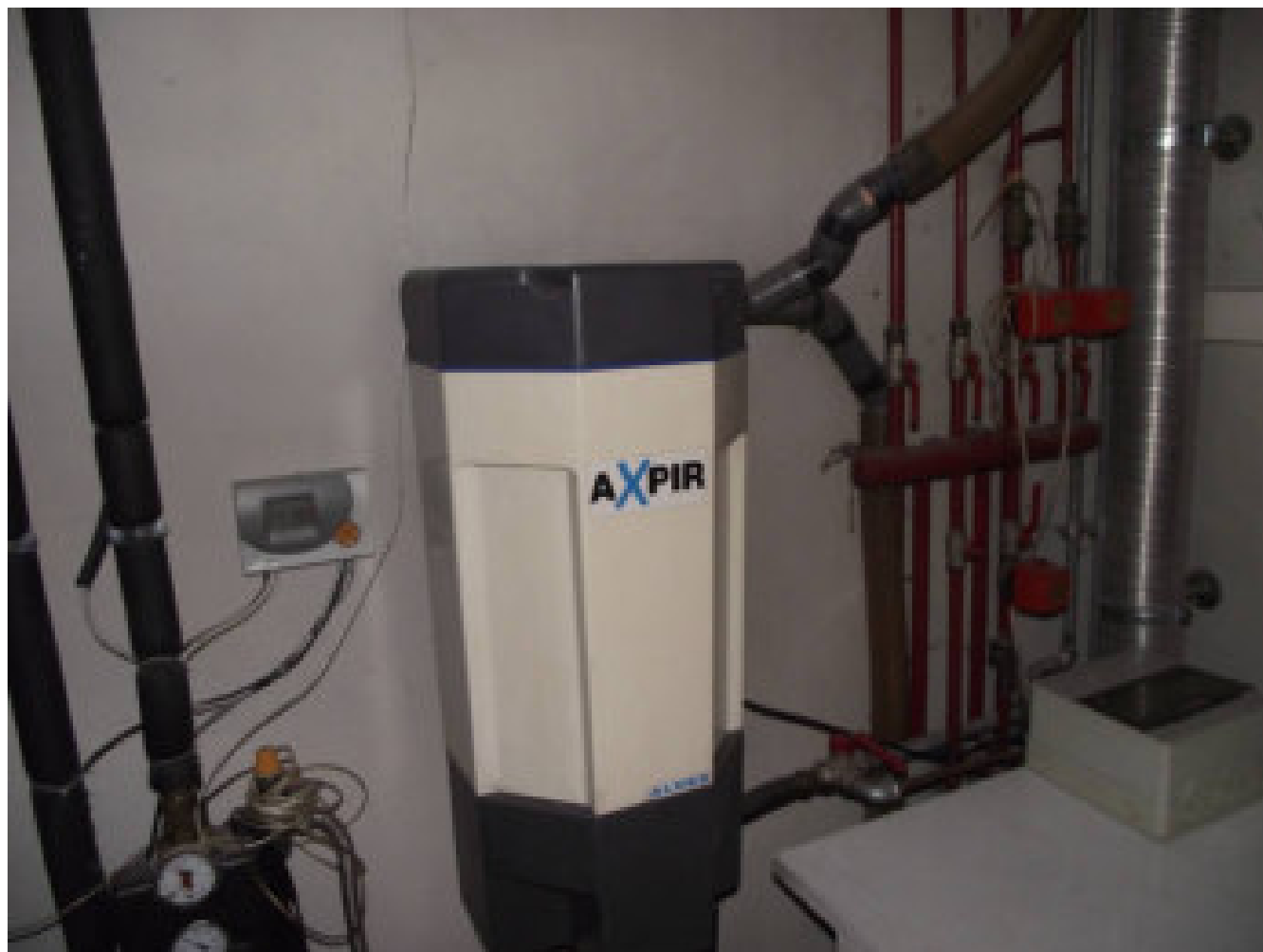
Foto 15 - impianto di aspirazione centralizzato