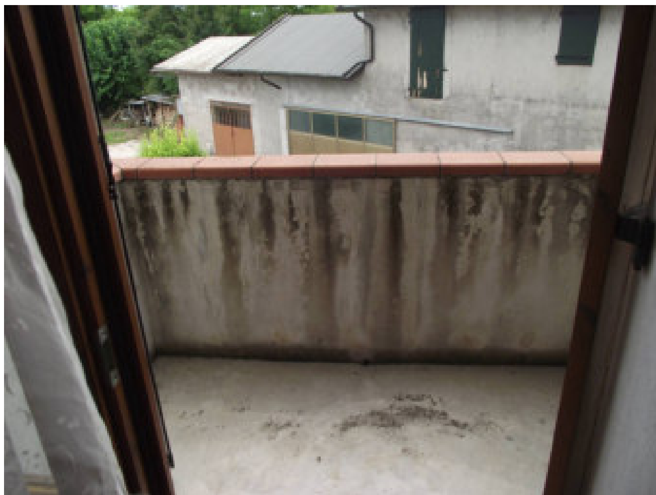
Foto 19 - terrazzino della camera da letto matrimoniale