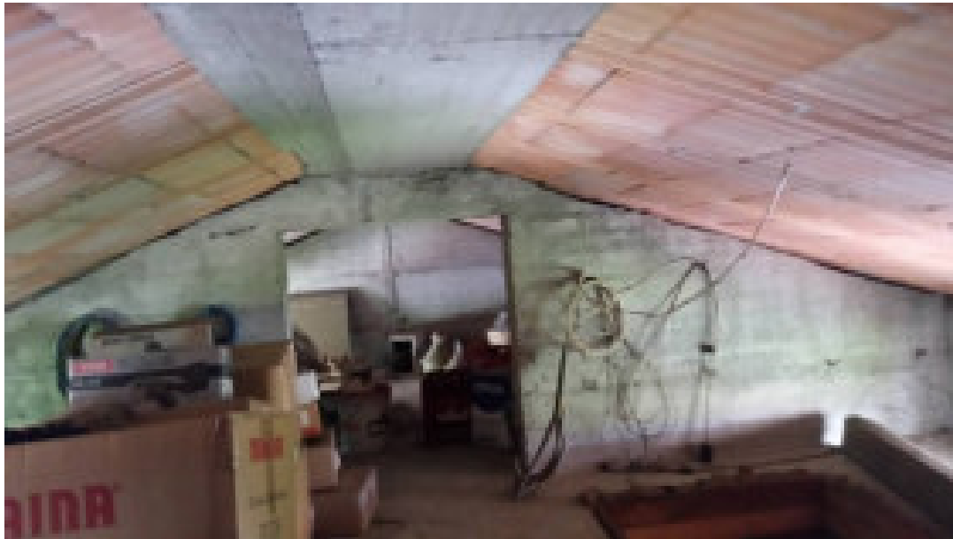
Foto 25 - Sottotetto