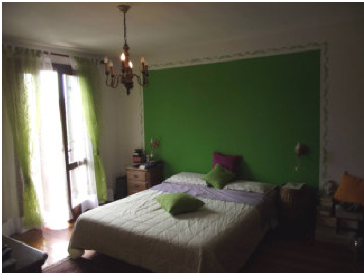
Foto 18 - Camera da letto matrimoniale