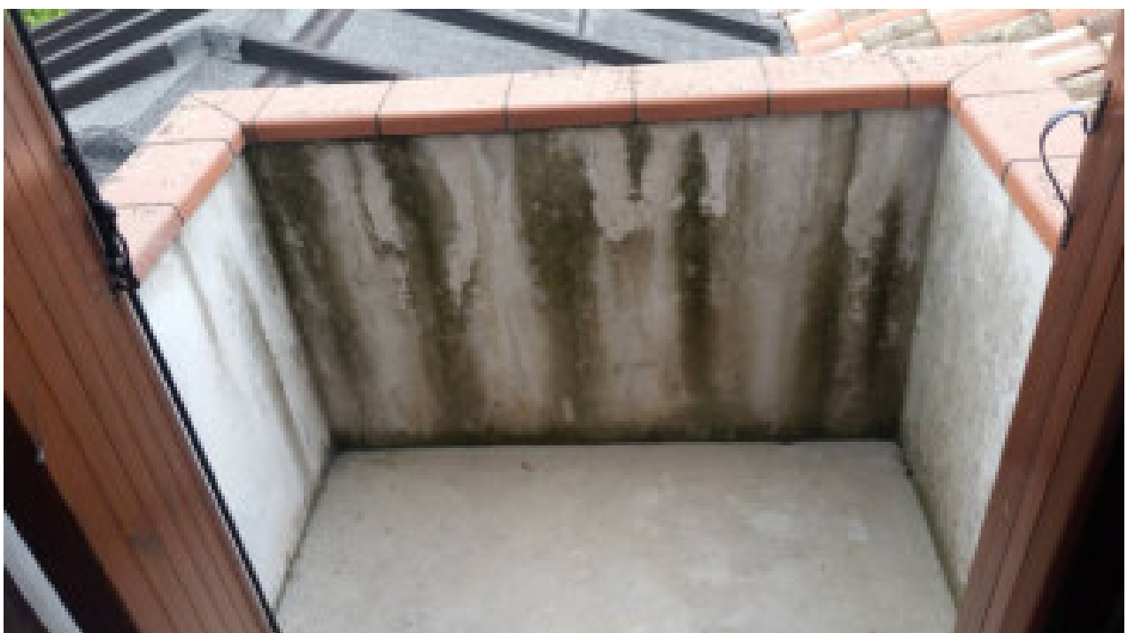
Foto 23 - terrazzo del bagno al piano primo