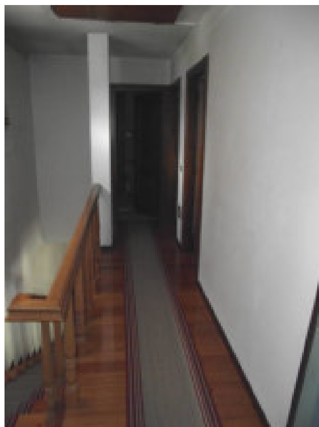
Foto 16 - 17 - Scale di accesso e corridoio al piano primo