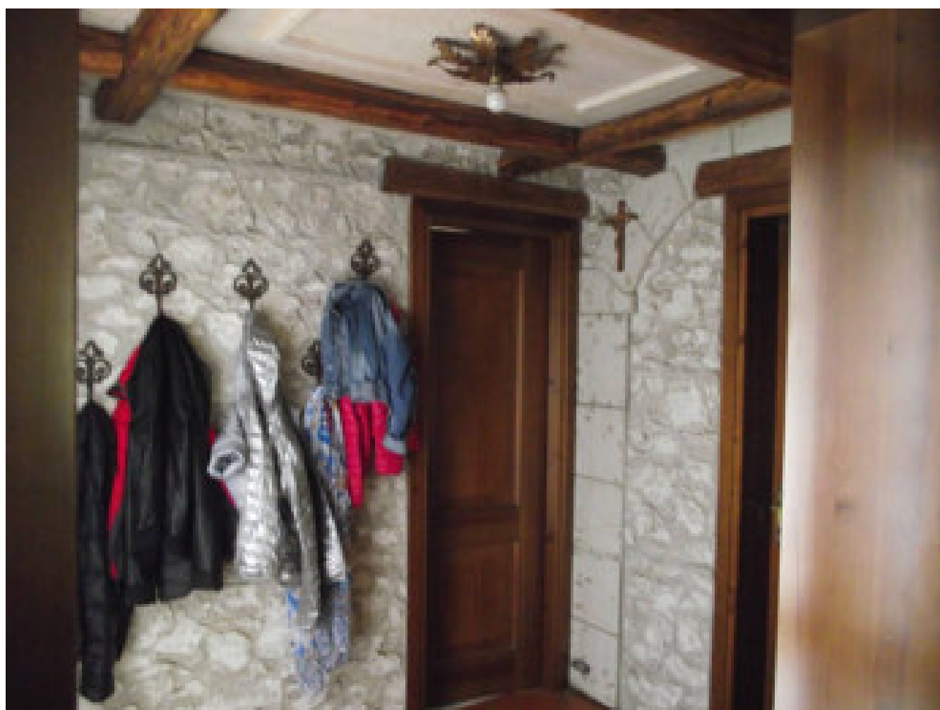
Foto 6- Ingresso