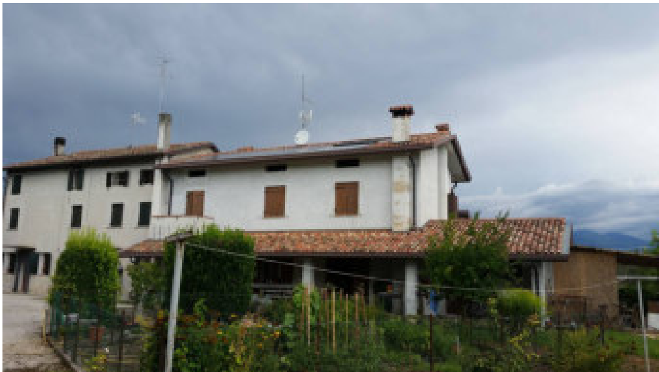
Foto 5 - Prospetto posteriore