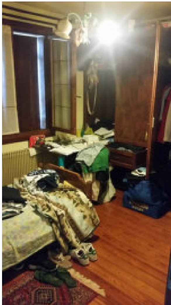
Foto 21 - camera da letto