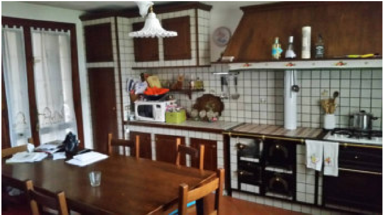
Foto 7 - Cucina