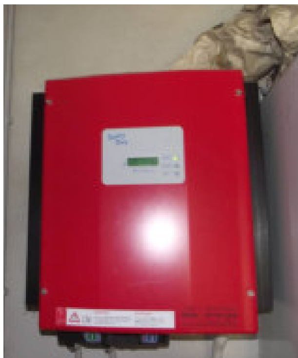
Foto 14 - Centrale termica