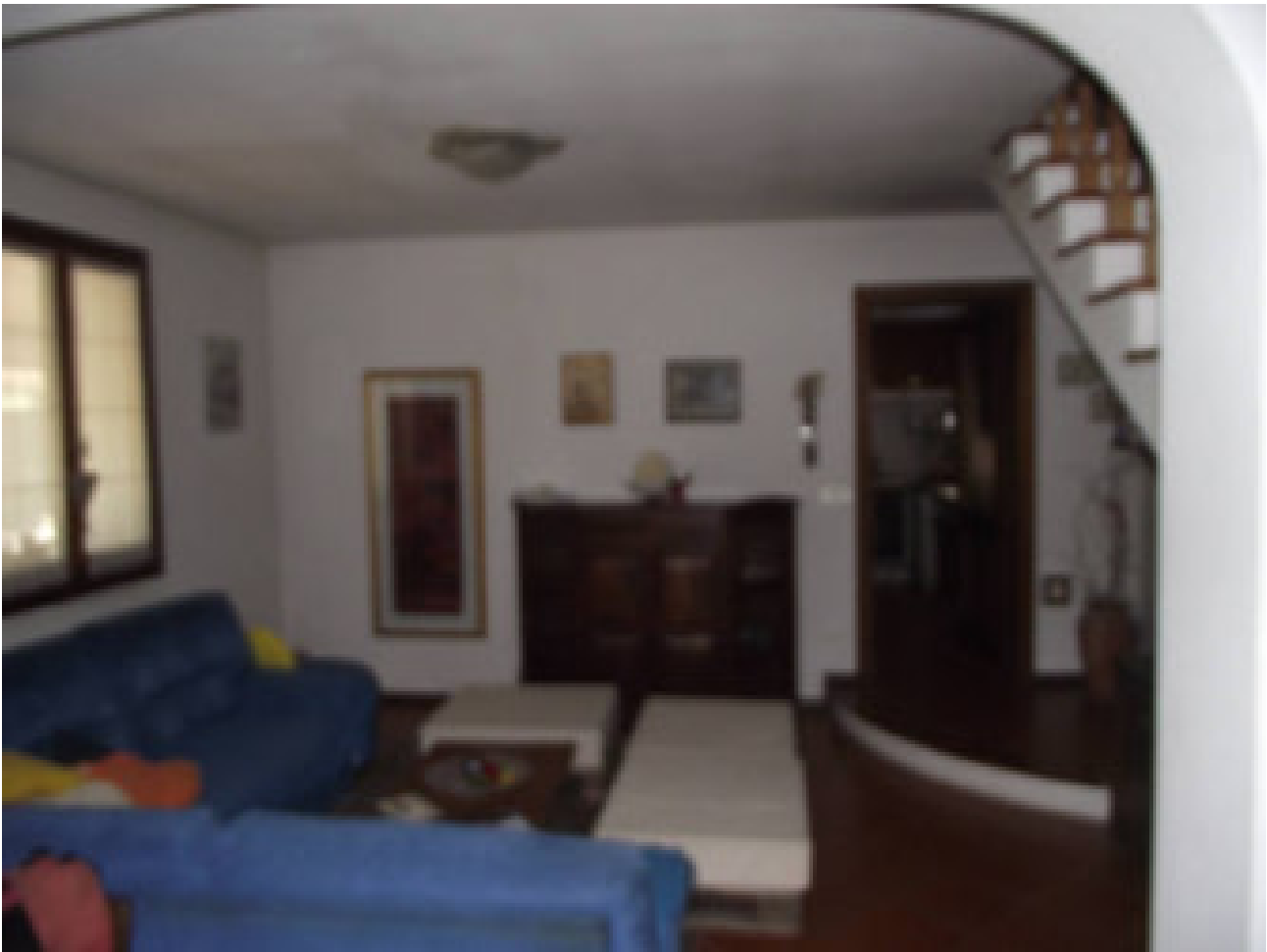
Foto 9 - Zona giorno