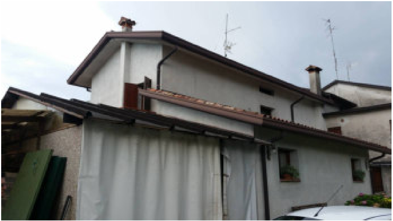
Foto 3 - prospetto laterale con ampliamento garage abusivo