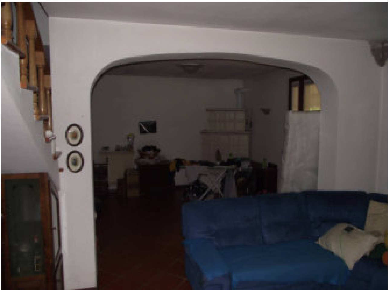
Foto 10 - Zona Giorno