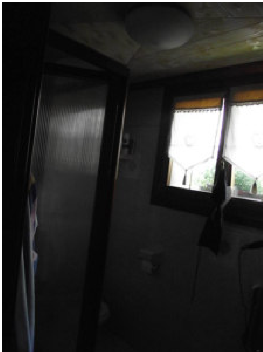
Foto 8 - Bagno P.T.