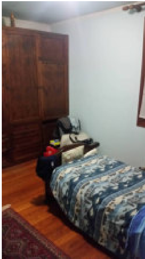
Foto 20 - camera da letto