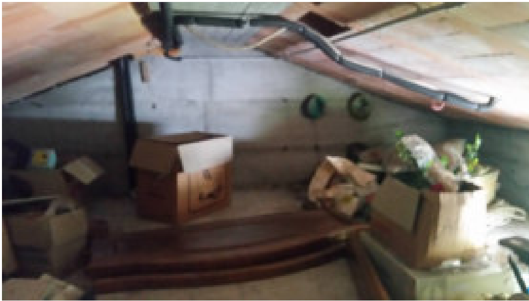
Foto 24 - Sottotetto