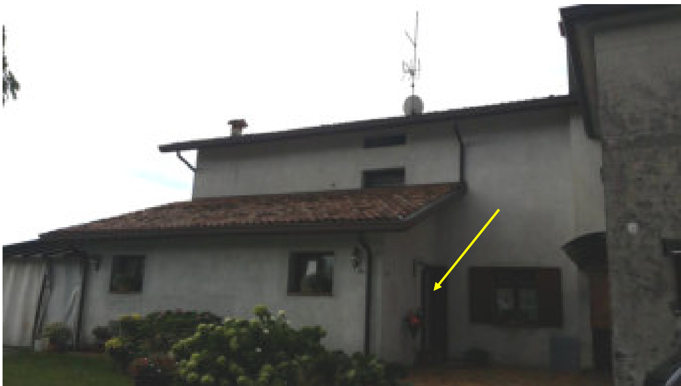
Foto 2 - prospetto principale ed ingresso