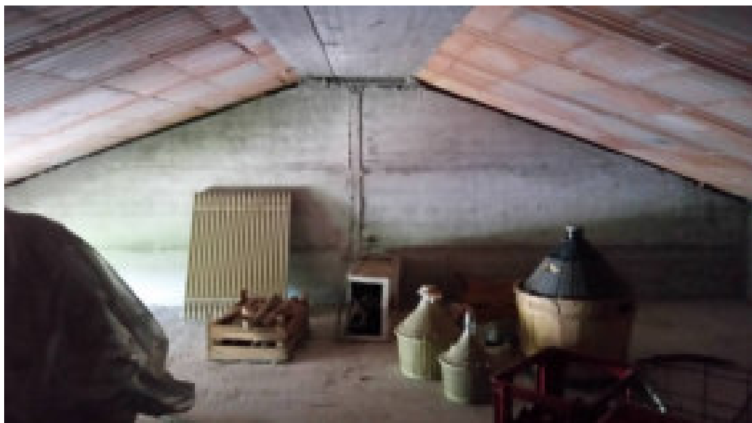
Foto 26 - Sottotetto