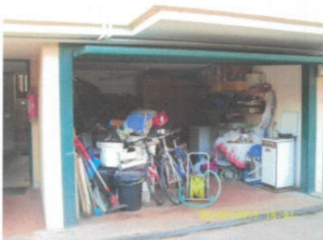
AUTORIMESSA - F. 11, Mapp.797, Sub.24