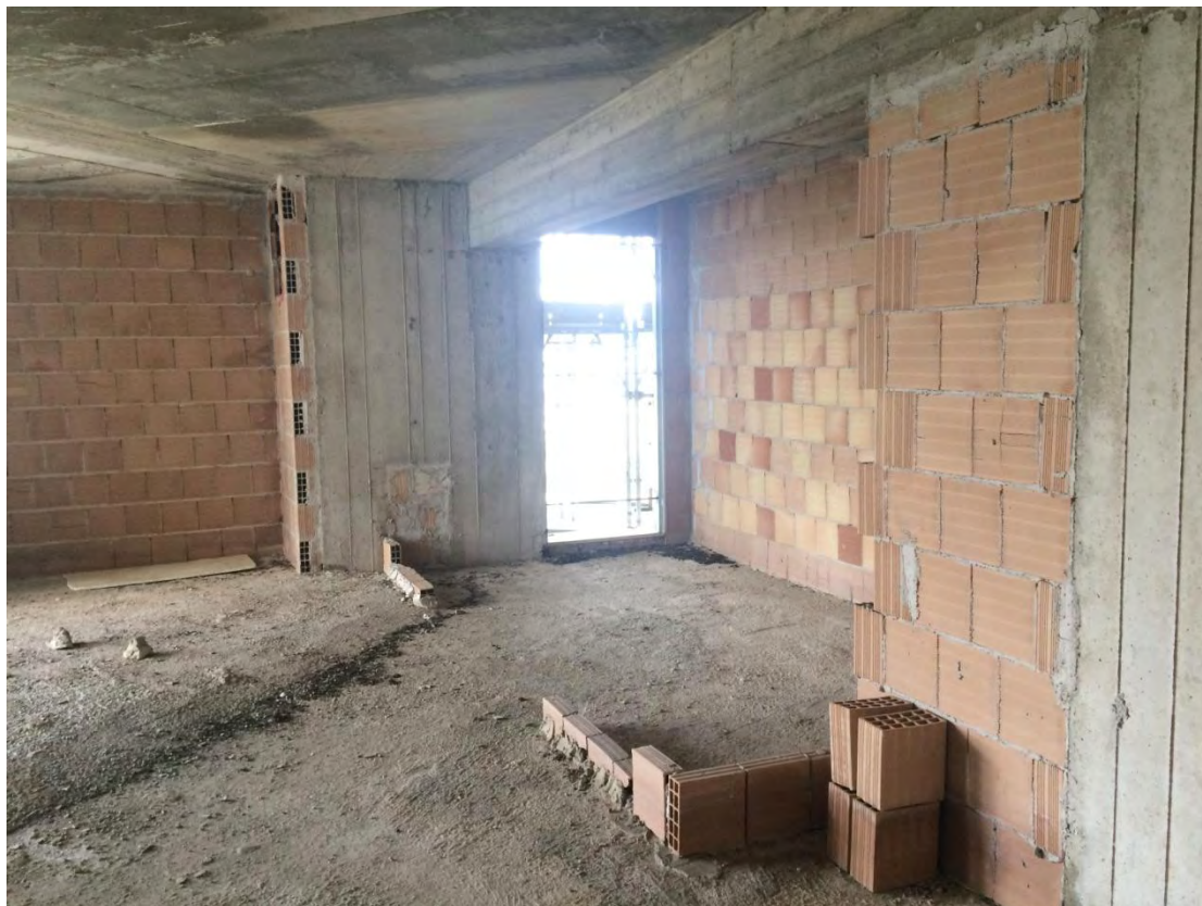
Fotografia n. 31