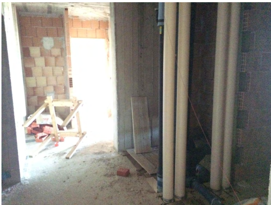
Fotografia n. 29