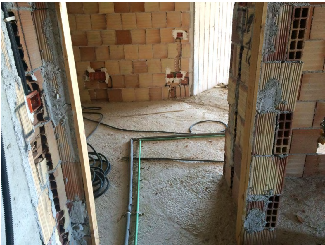
Fotografia n. 26