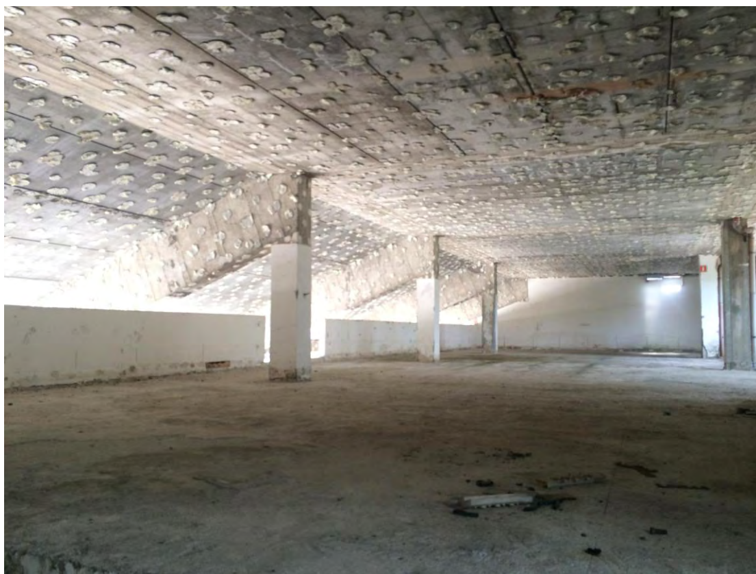
Fotografia n. 11