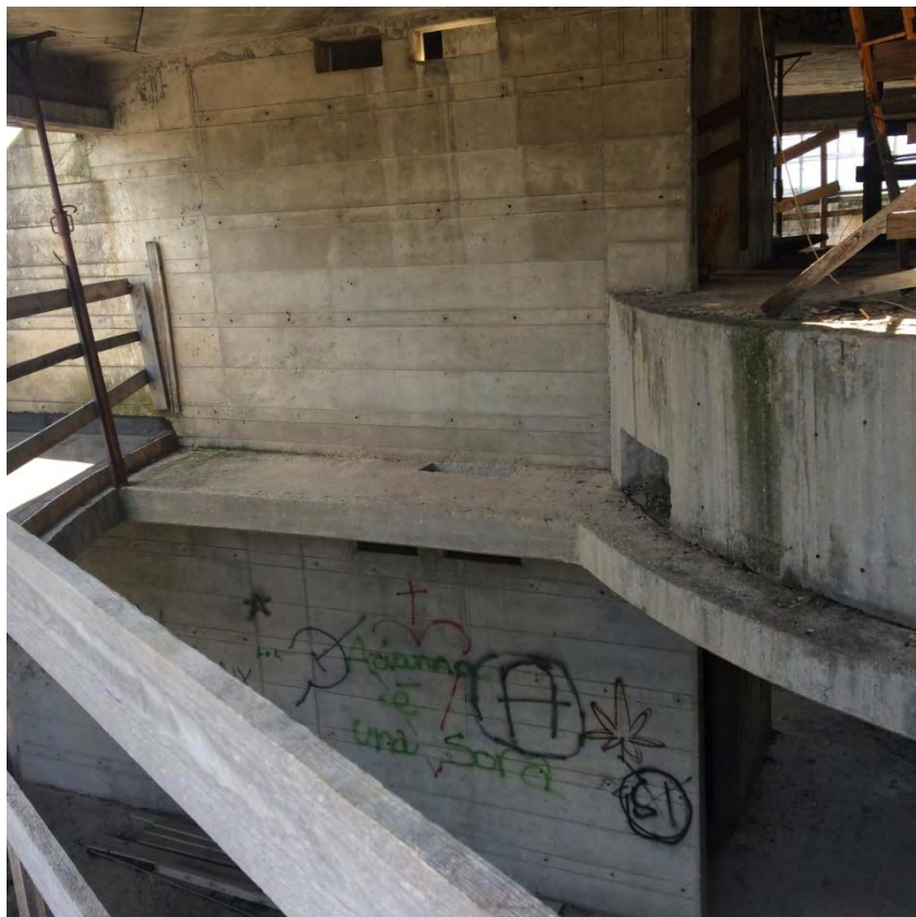
Fotografia n. 41