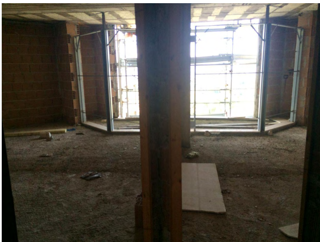
Fotografia n. 32