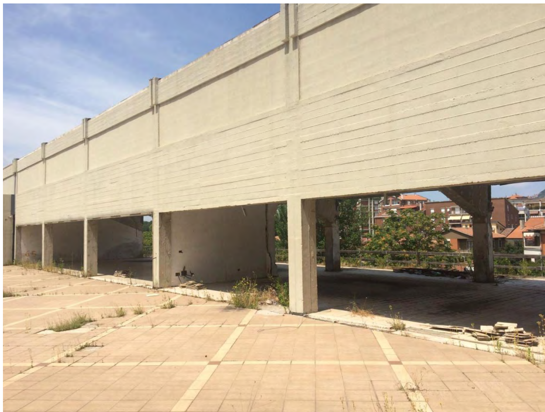
Fotografia n. 7