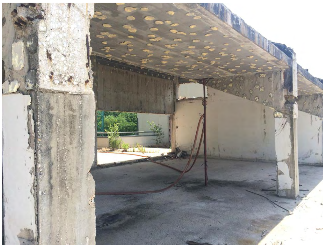
Fotografia n. 12