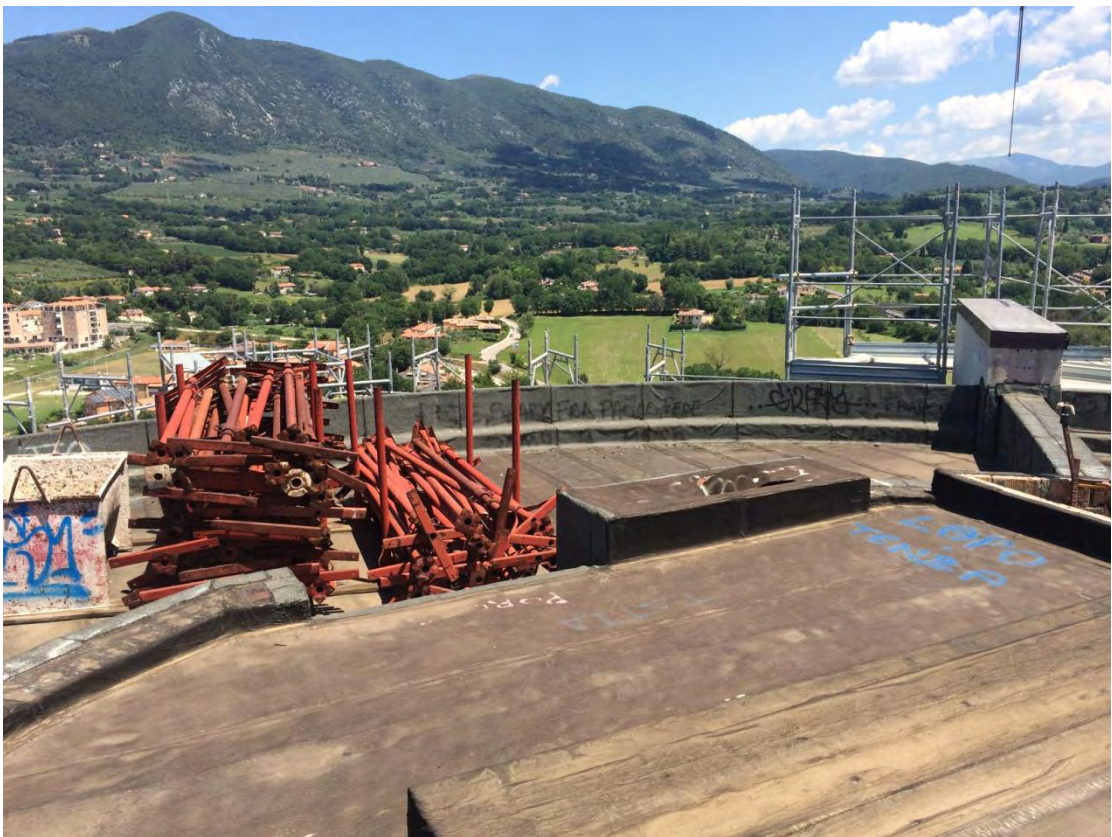
Fotografia n. 48