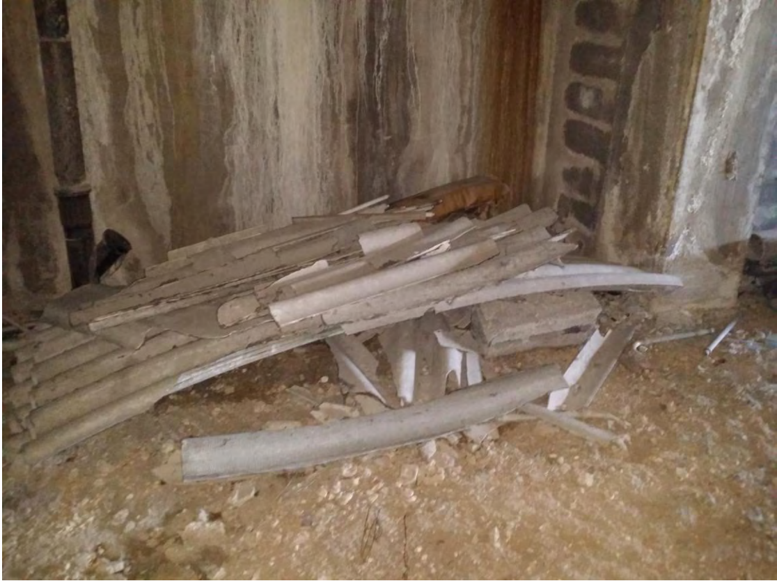
Fotografia n. 59