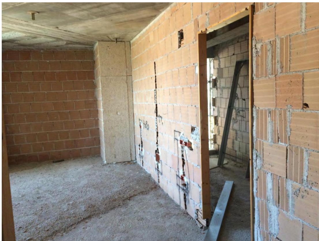
Fotografia n. 30