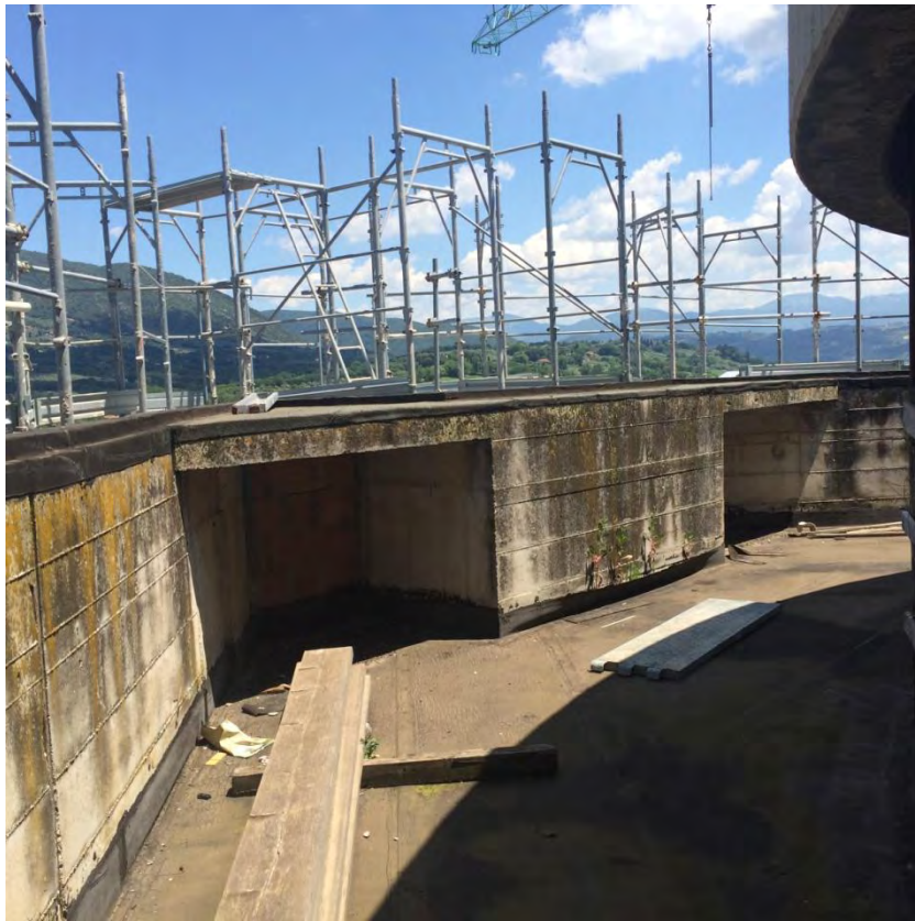
Fotografia n. 43