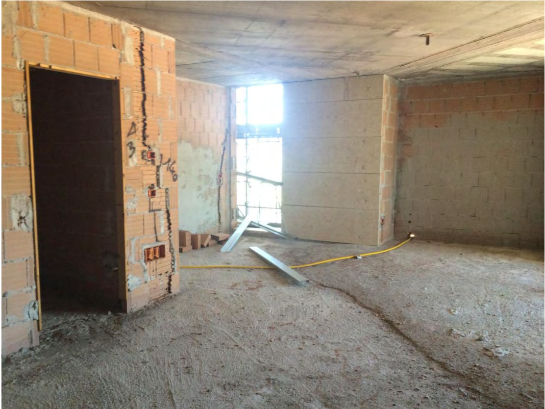
Fotografia n. 23