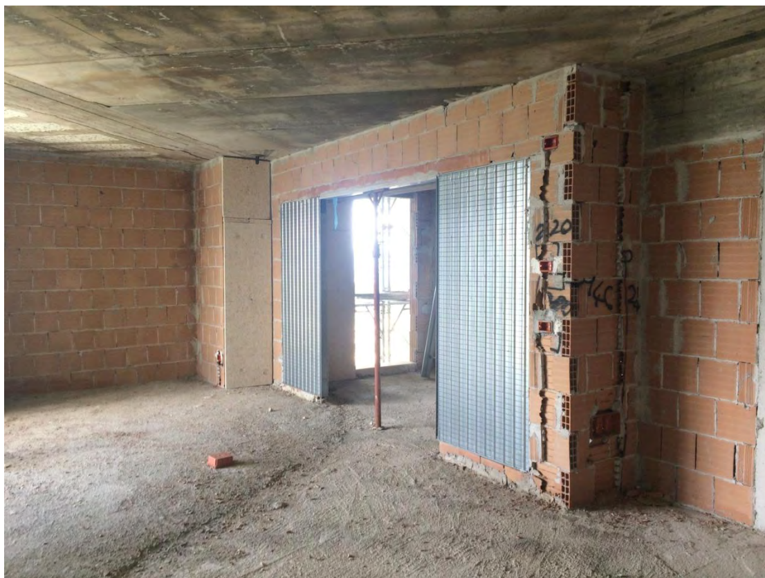
Fotografia n. 28