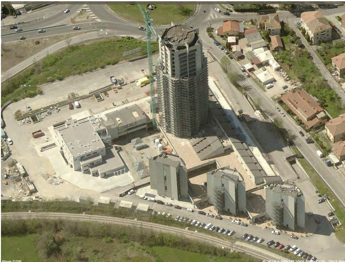
Fotografia n. 54