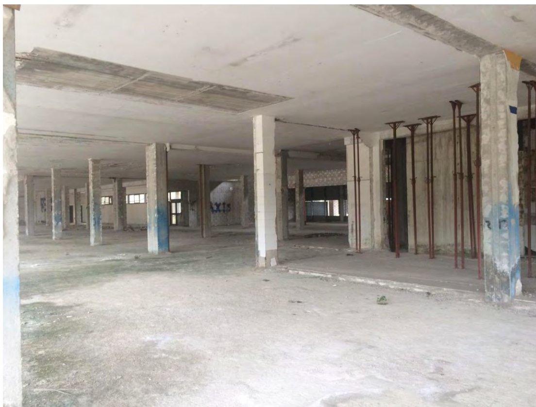
Fotografia n. 2