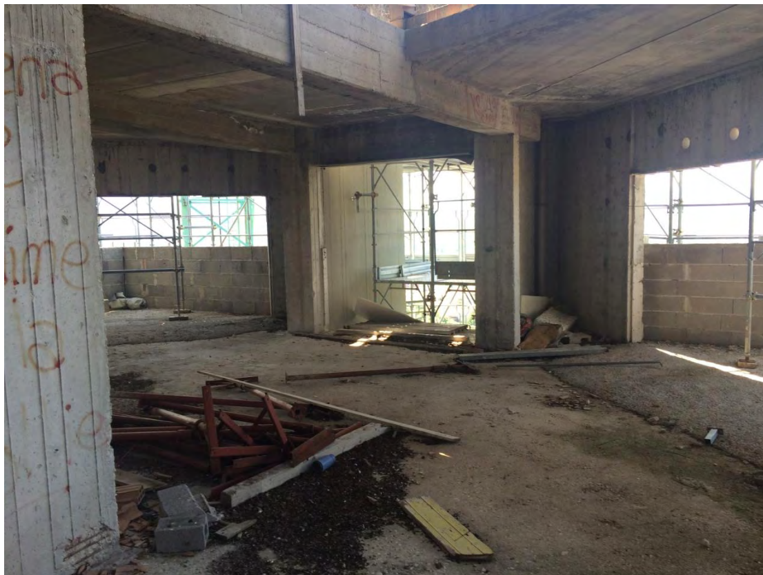
Fotografia n. 35