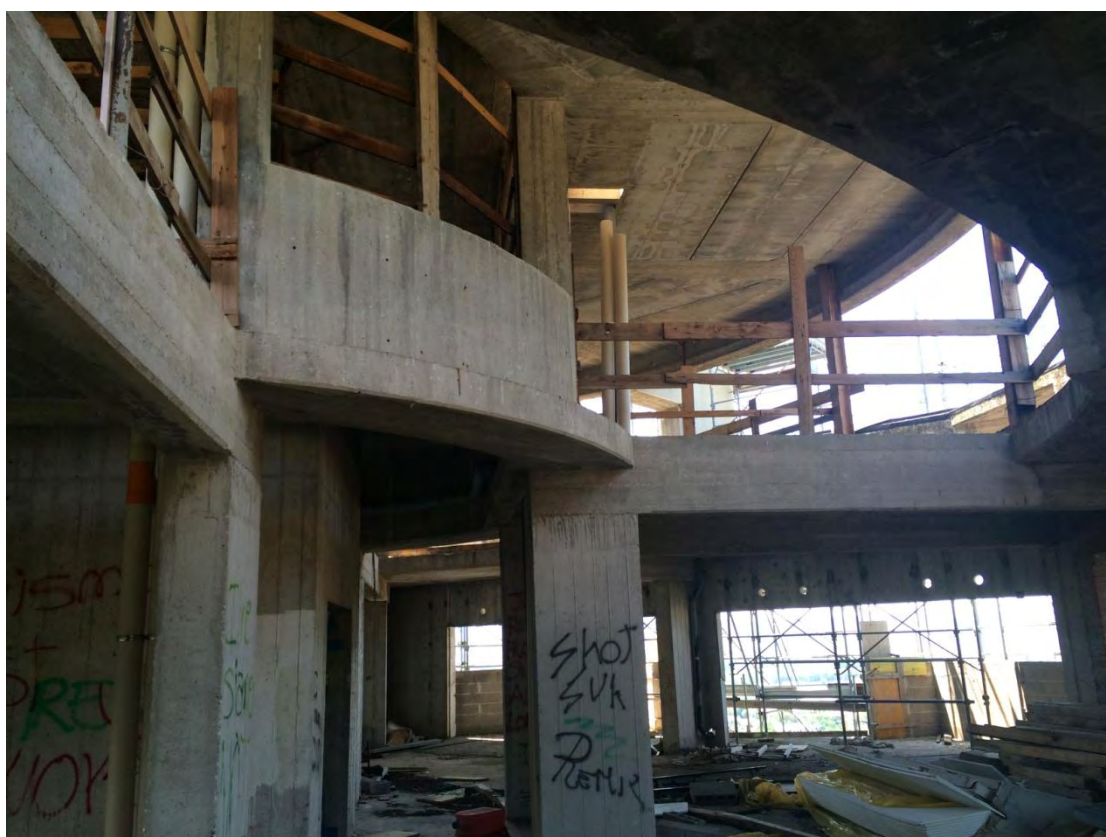
Fotografia n. 36