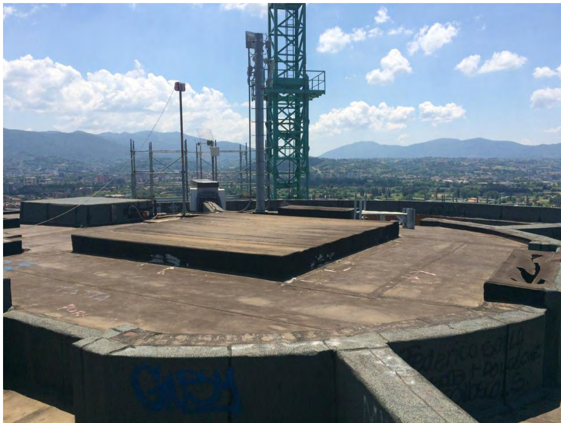
Fotografia n. 49