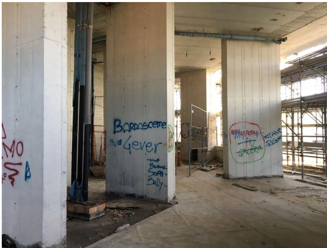
Fotografia n. 9