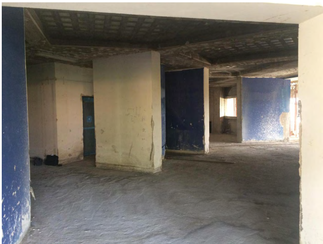
Fotografia n. 6