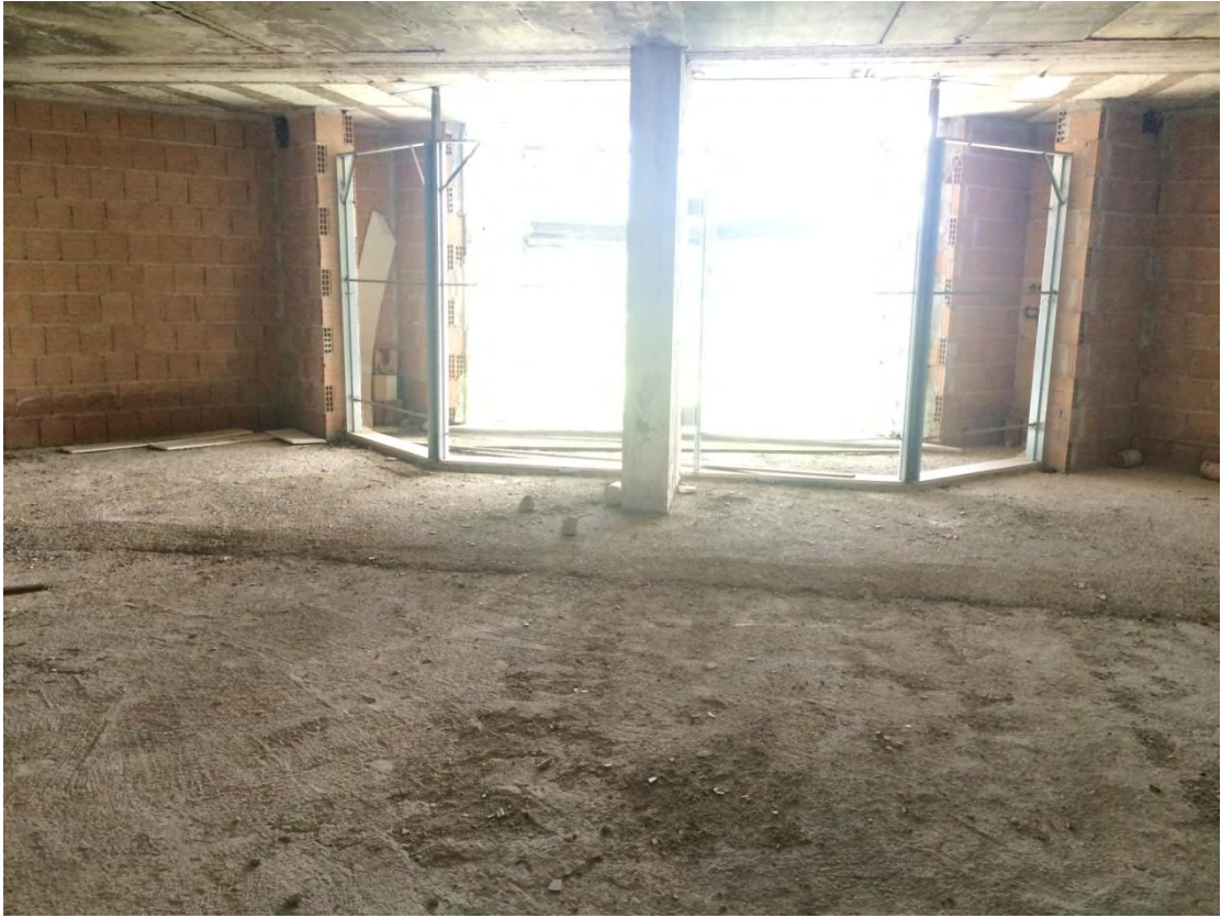
Fotografia n. 33