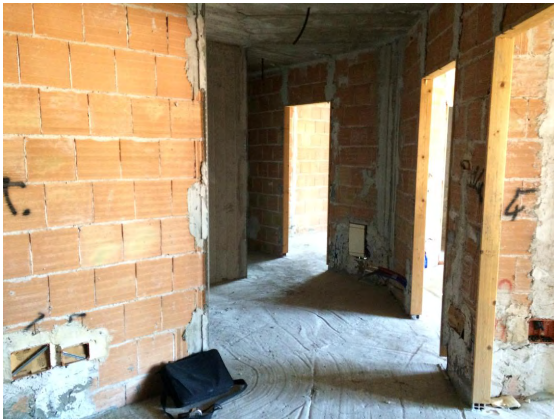
Fotografia n. 17