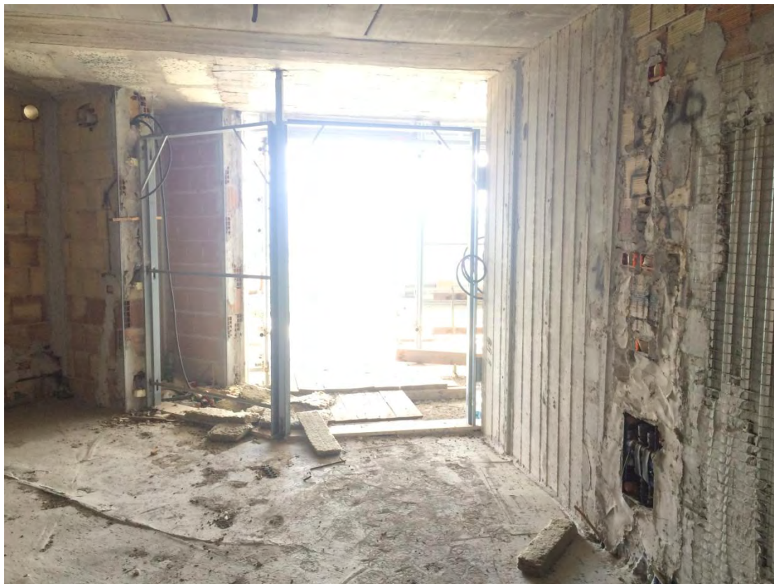
Fotografia n. 21