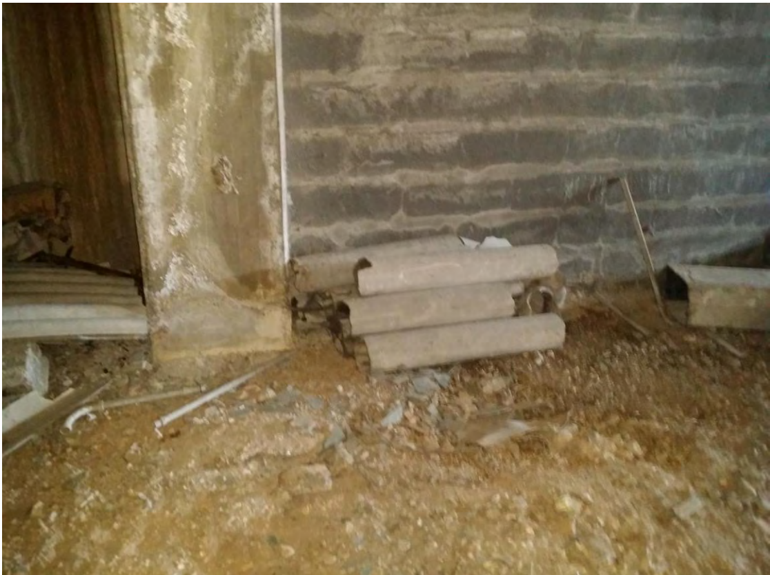
Fotografia n. 604950