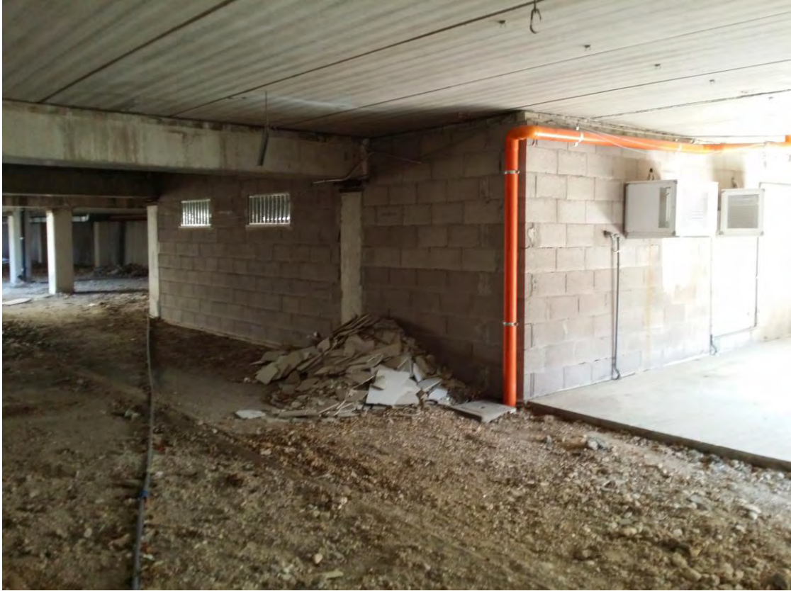
Fotografia n. 57