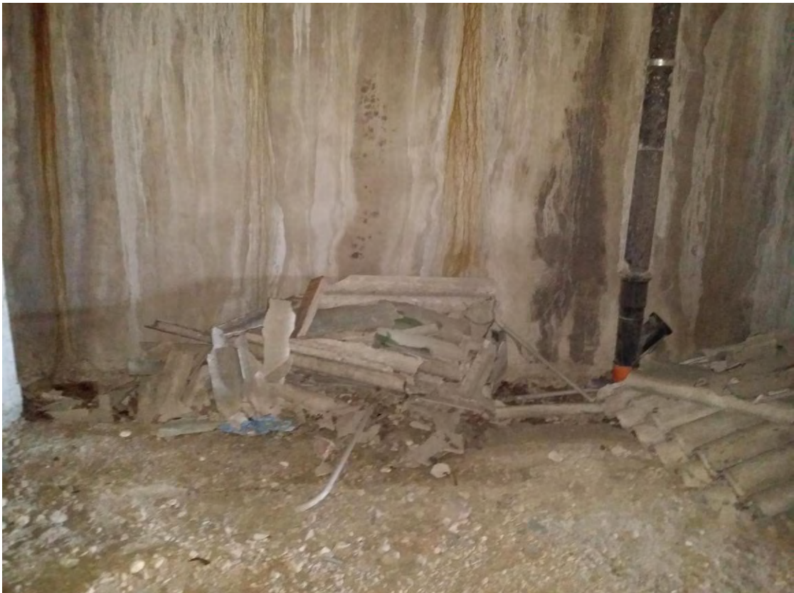
Fotografia n. 58