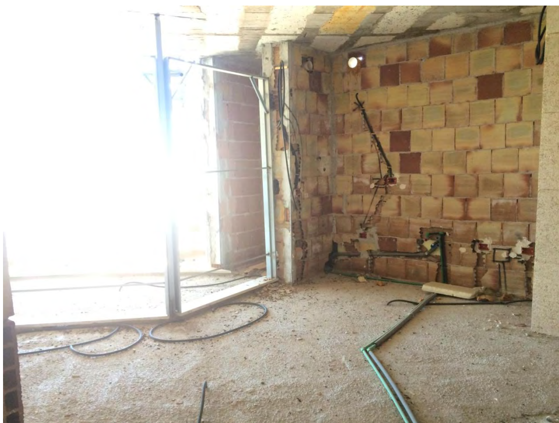
Fotografia n. 22