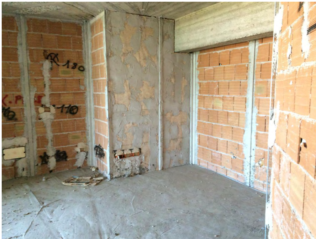
Fotografia n. 15