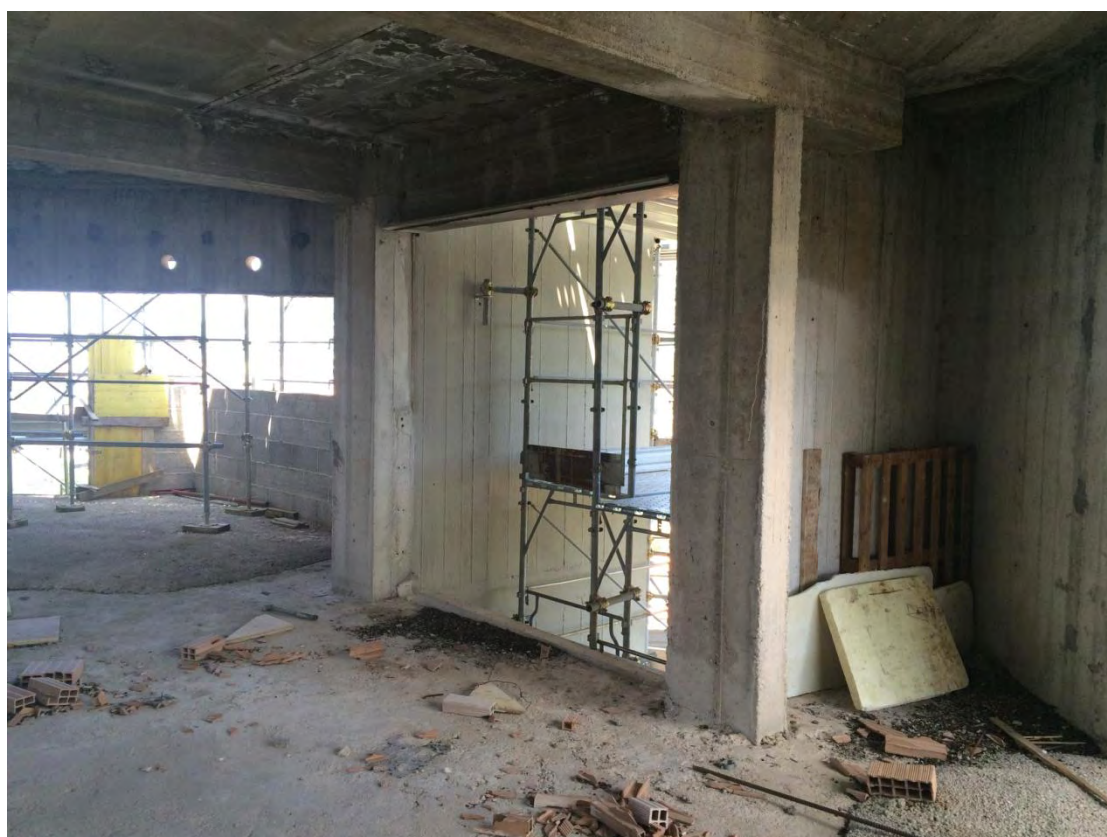
Fotografia n. 40