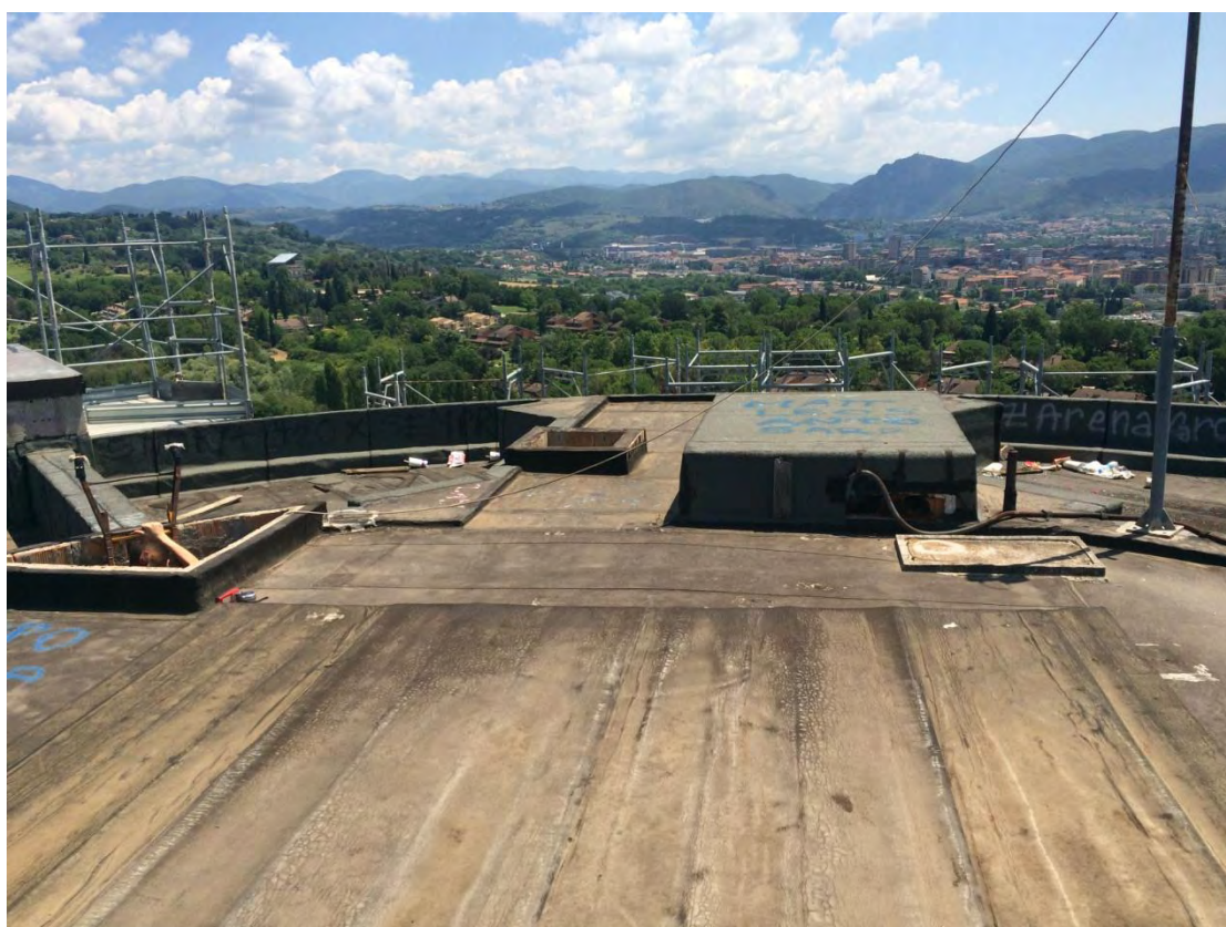
Fotografia n. 50