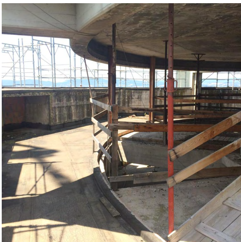
Fotografia n. 42