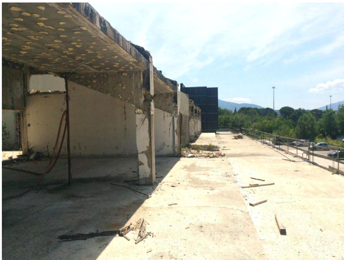
Fotografia n. 8