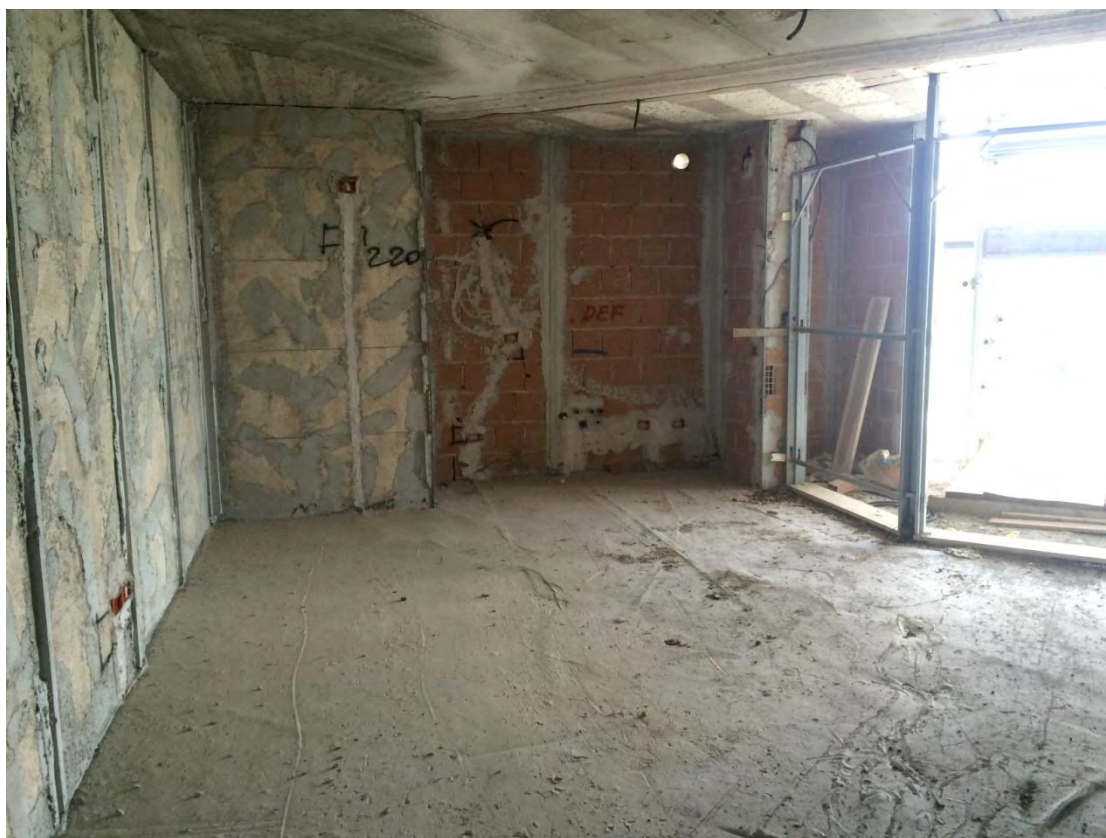
Fotografia n. 20