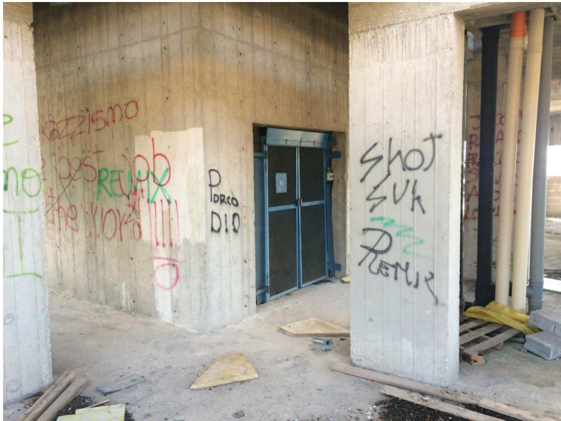
Fotografia n. 37