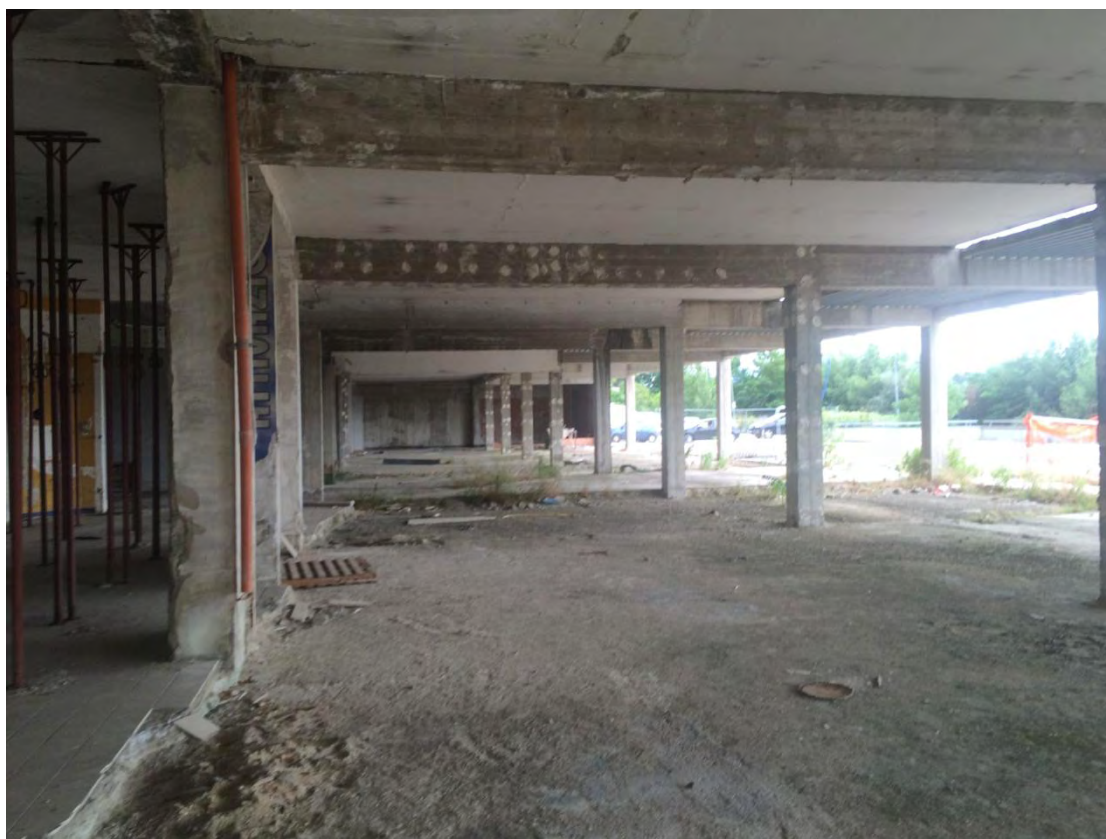
Fotografia n. 3