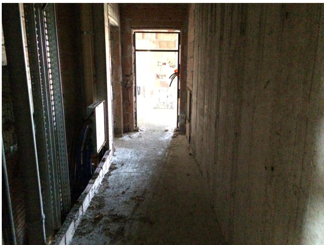
Fotografia n. 16