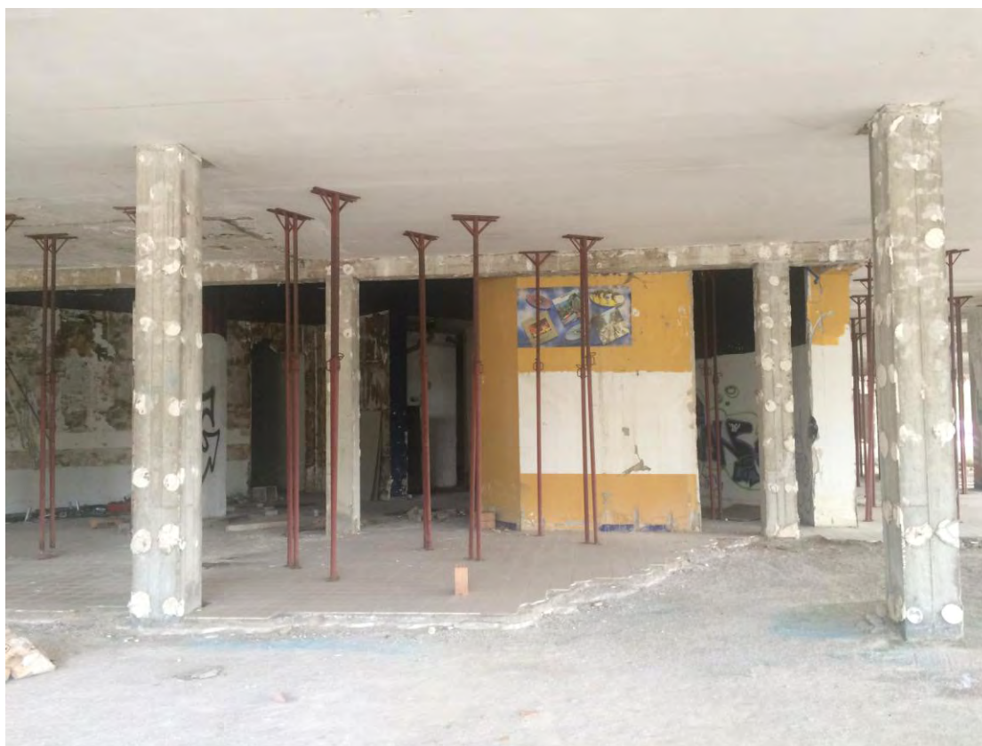
Fotografia n. 1