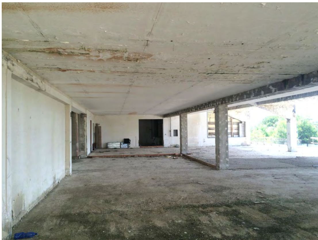
Fotografia n. 10