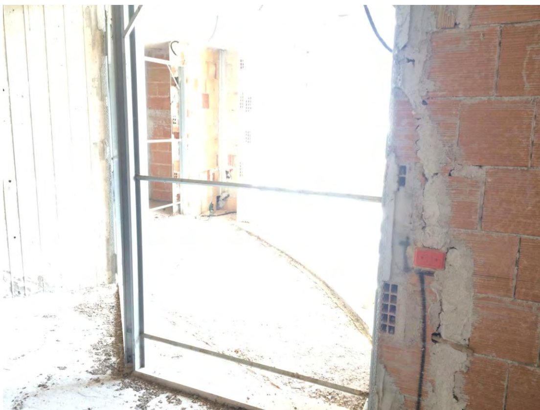
Fotografia n. 18