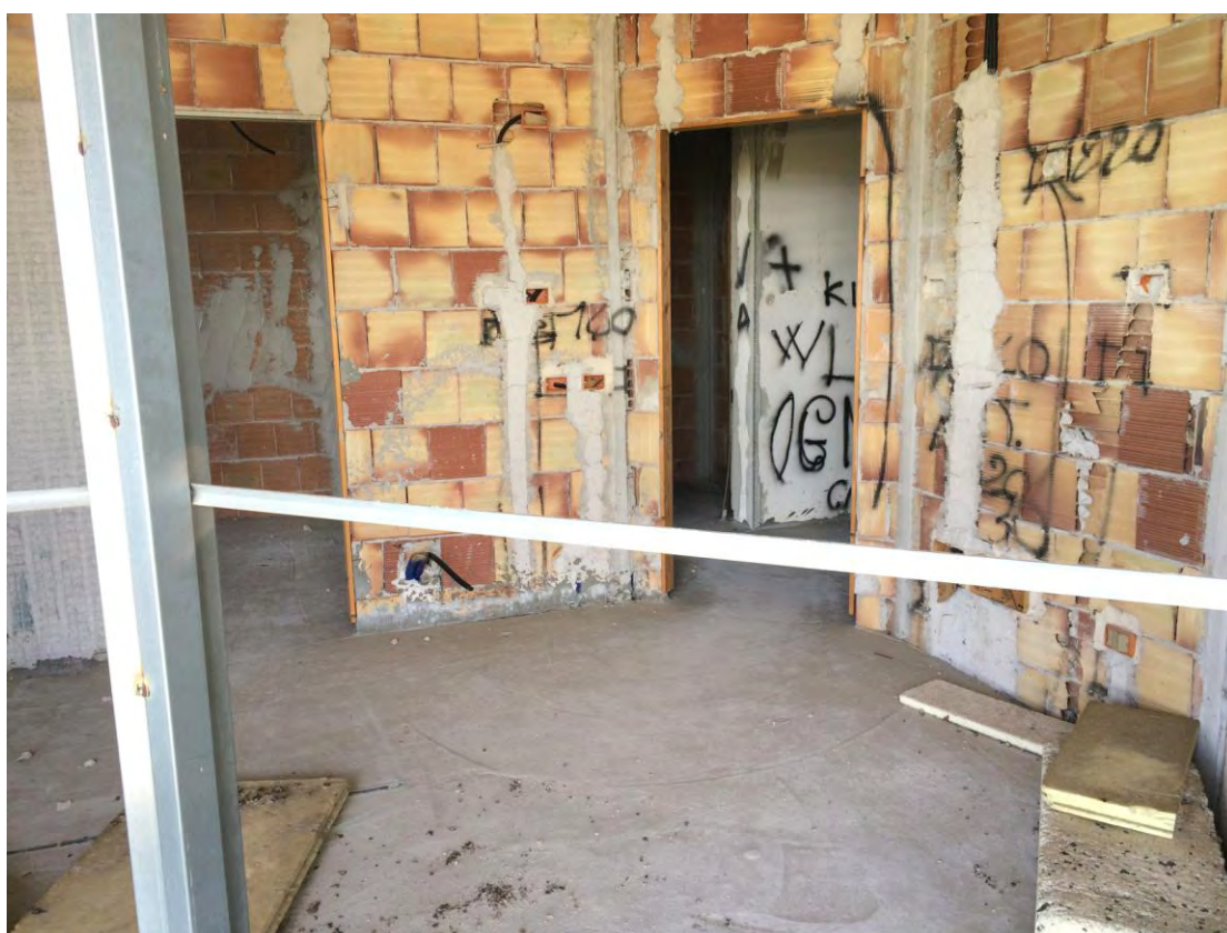
Fotografia n. 14