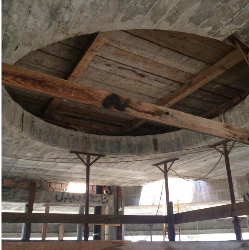
Fotografia n. 45