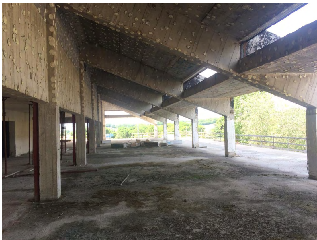
Fotografia n. 5