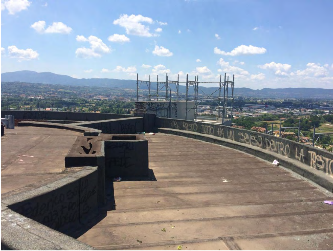
Fotografia n. 47