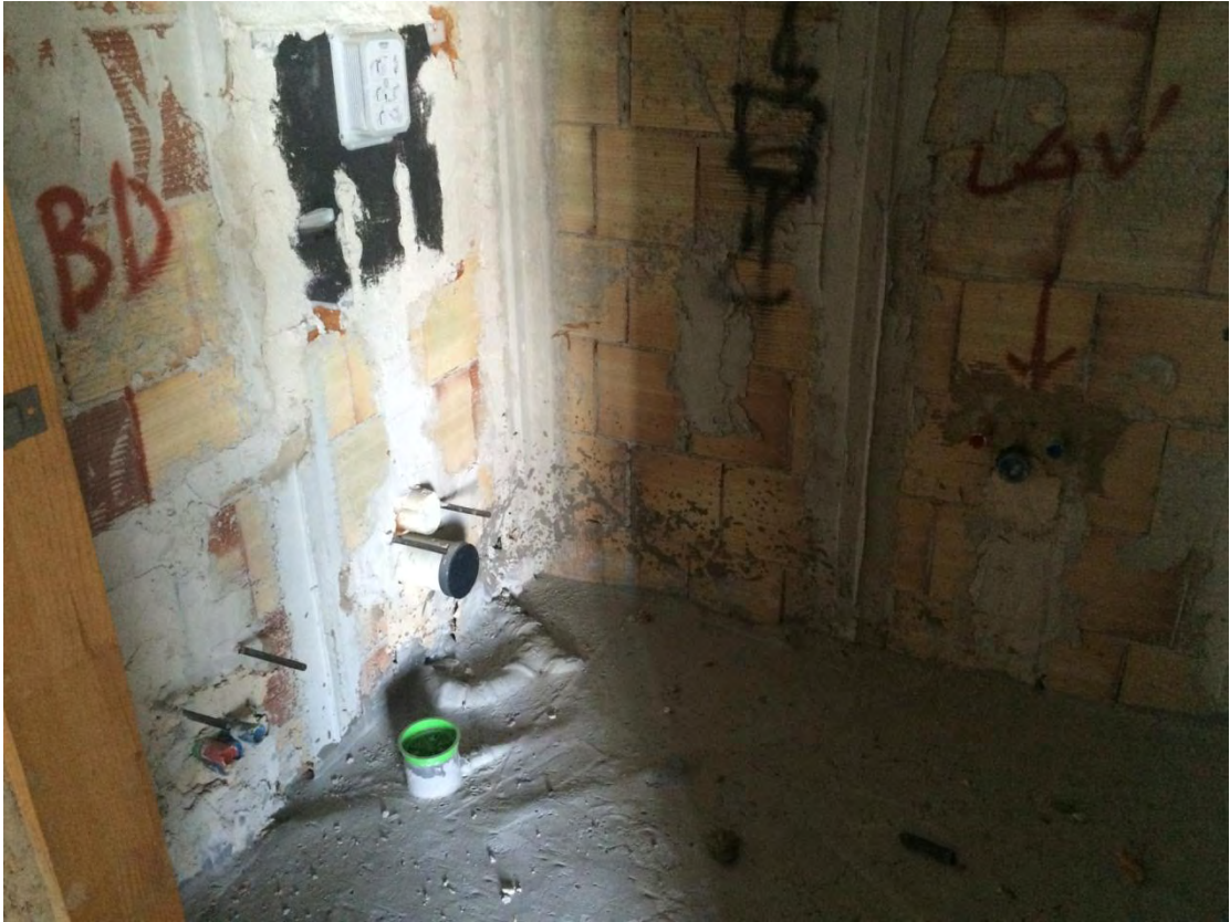
Fotografia n. 25