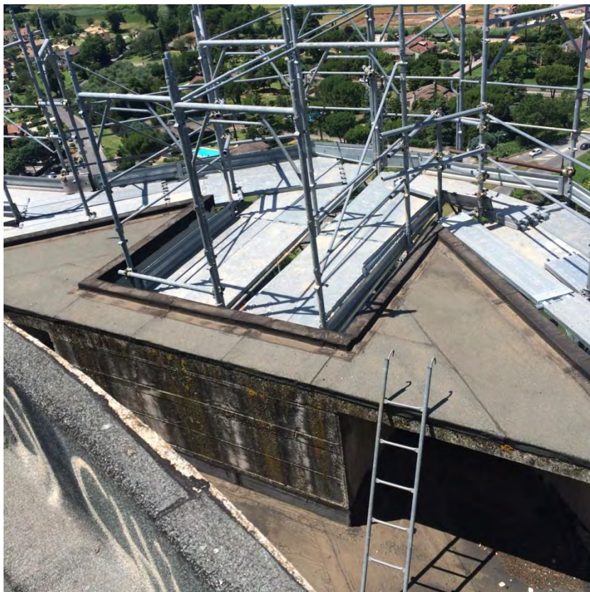
Fotografia n. 46