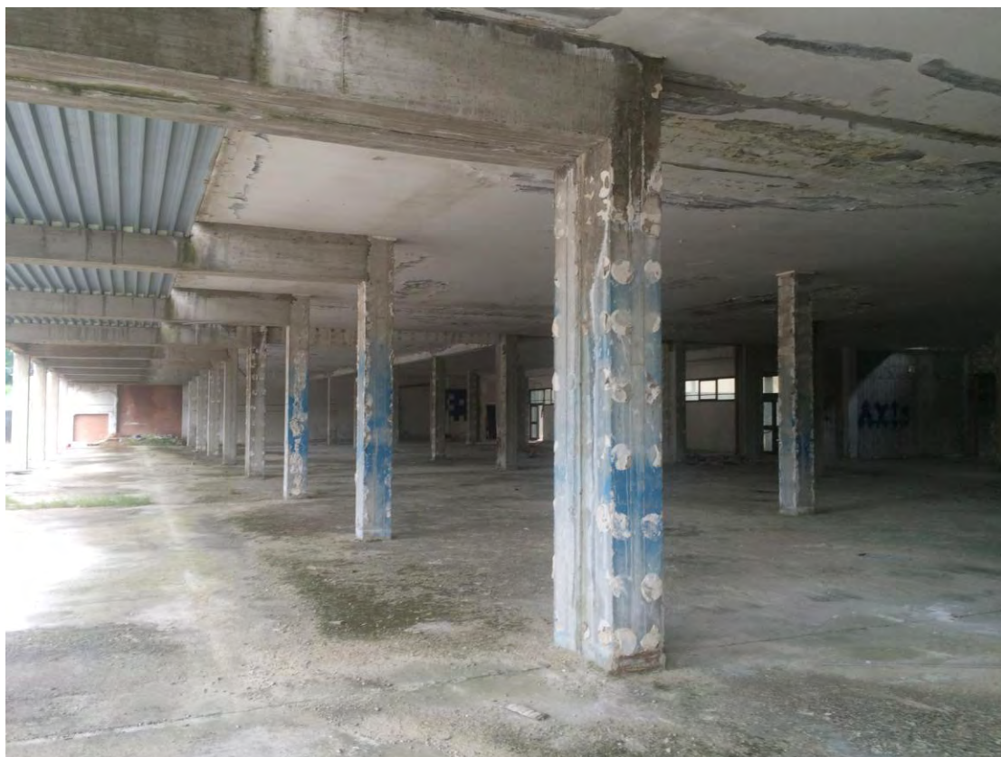
Fotografia n. 4