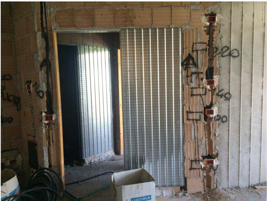
Fotografia n. 24