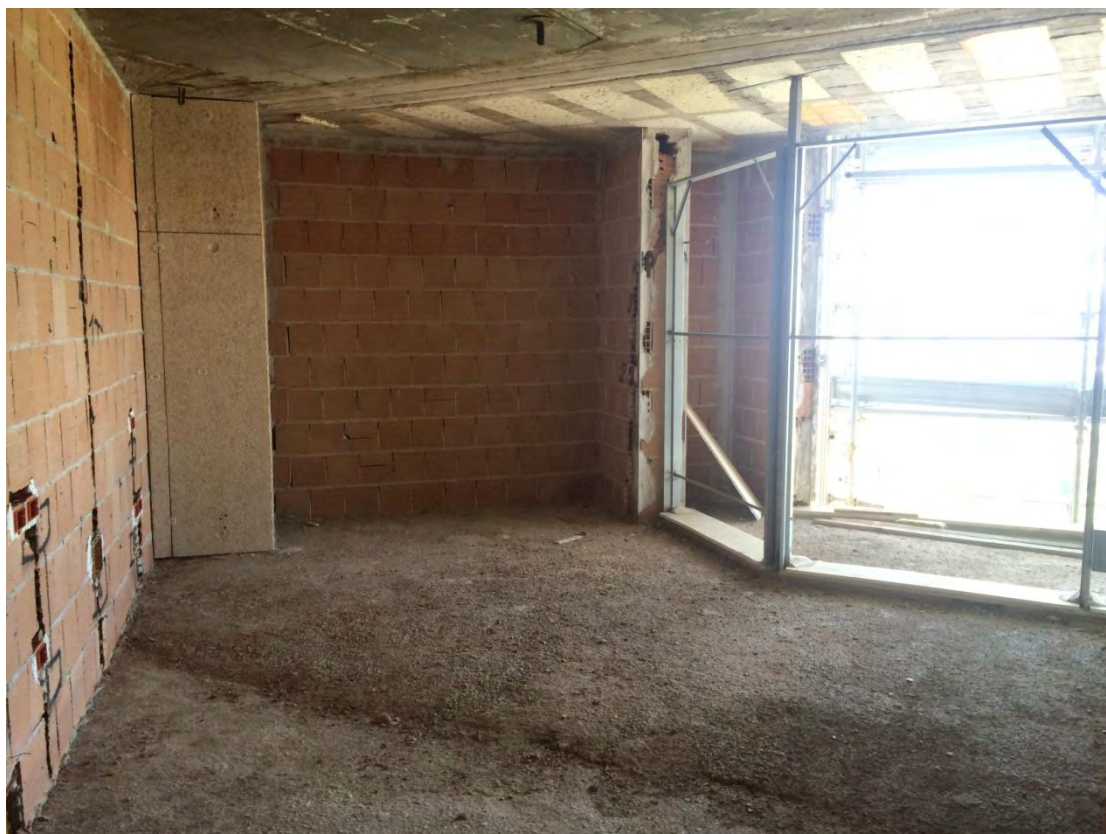
Fotografia n. 27