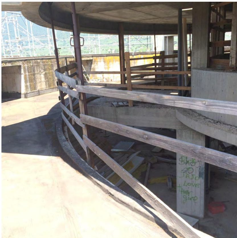
Fotografia n. 44