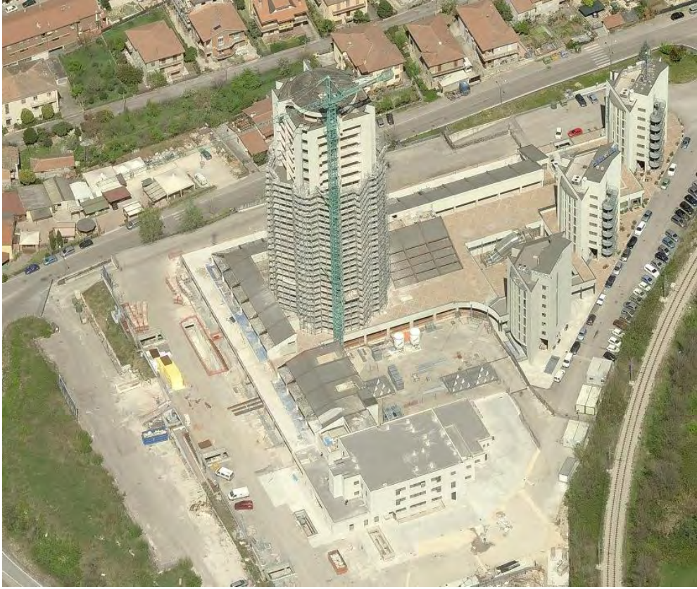
Fotografia n. 53