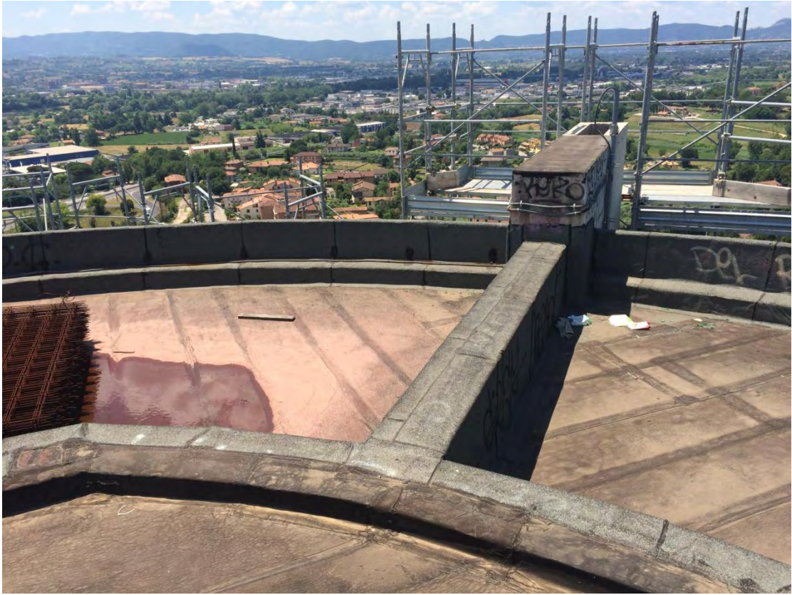
Fotografia n. 51