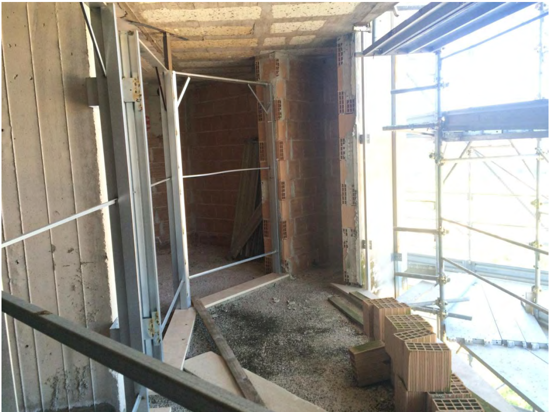
Fotografia n. 34