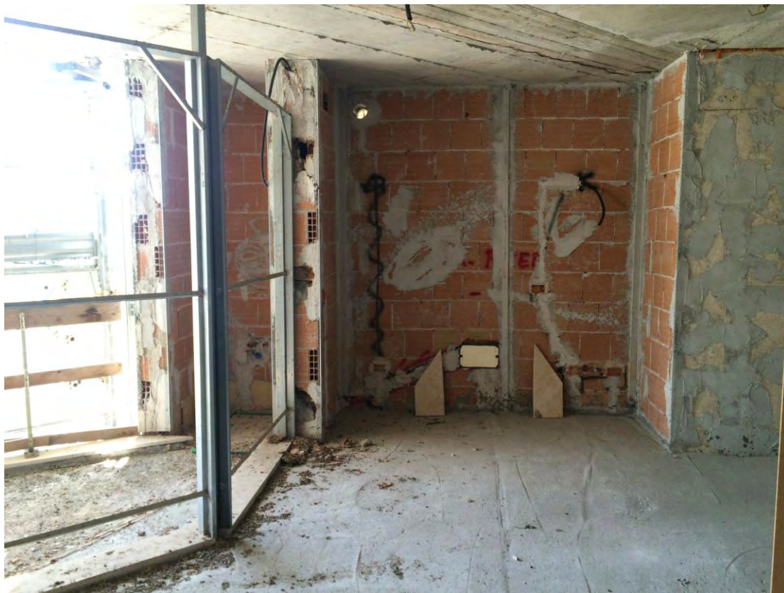
Fotografia n. 13