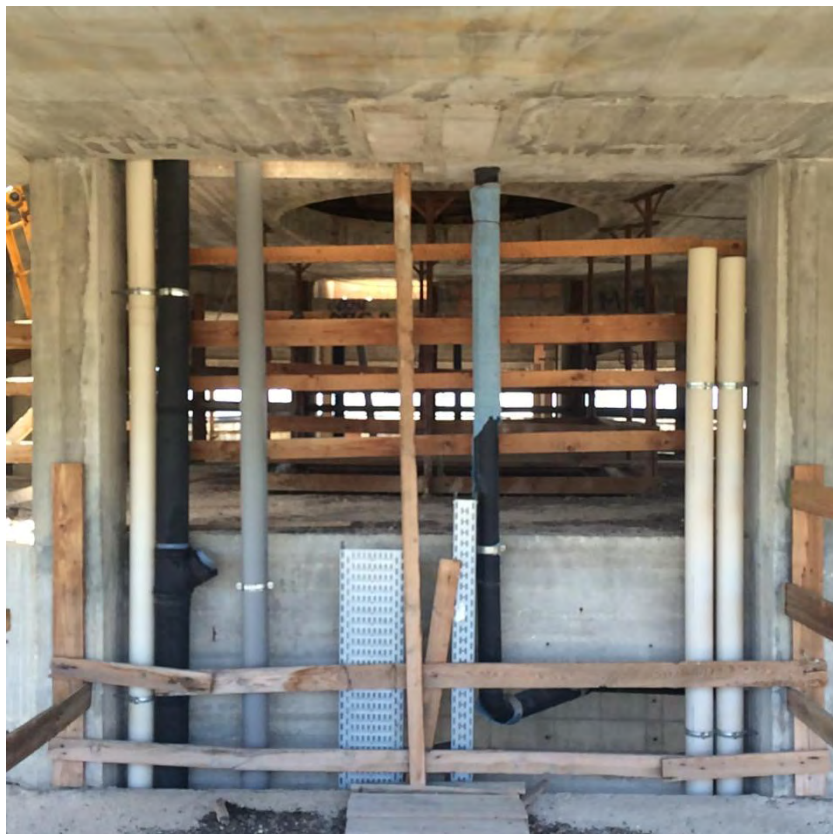
Fotografia n. 39