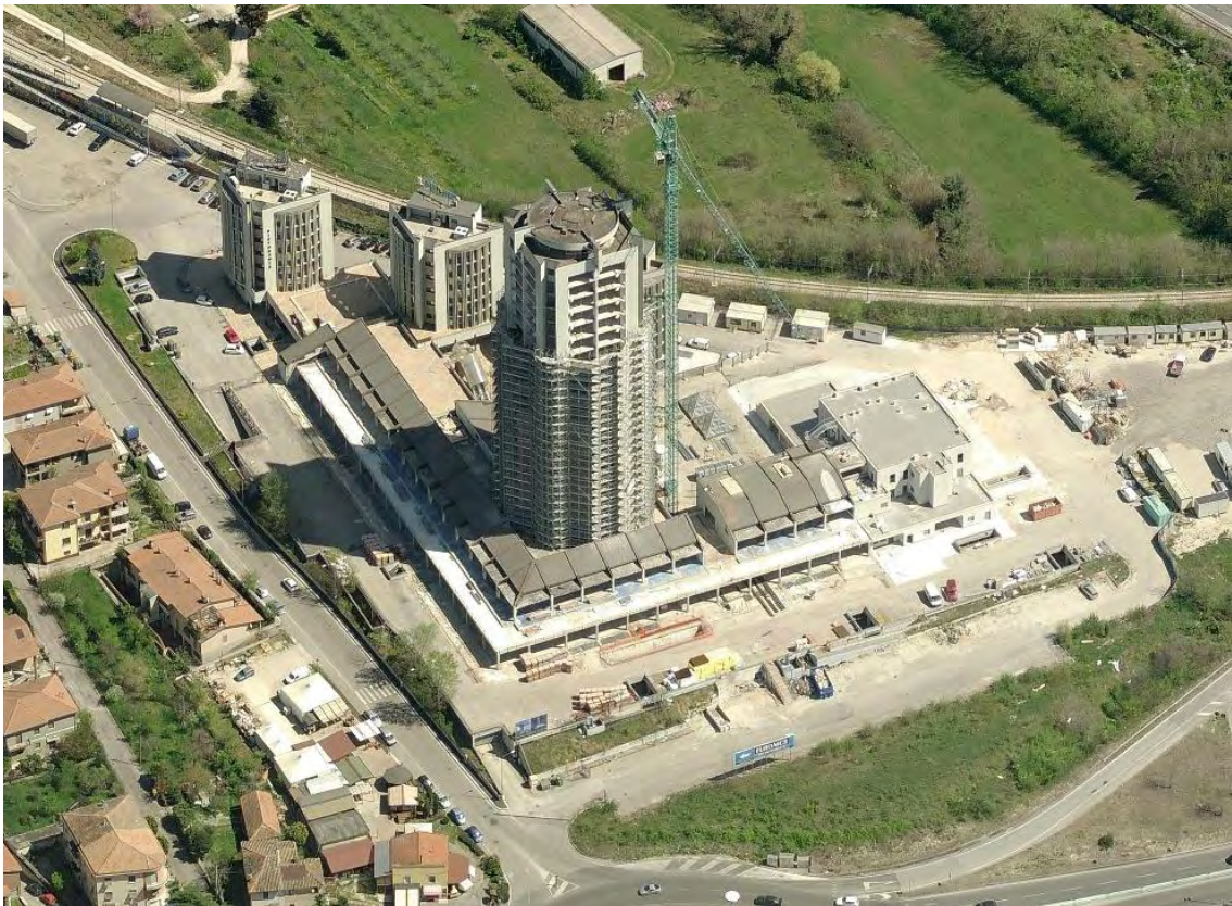
Fotografia n. 56