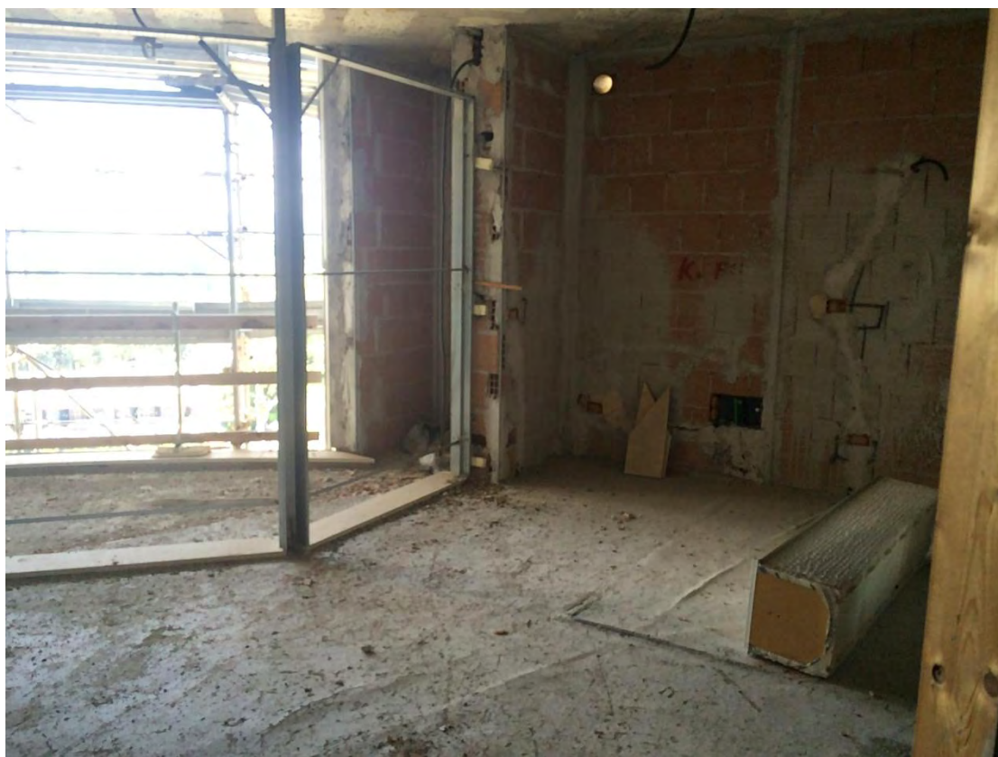
Fotografia n. 19