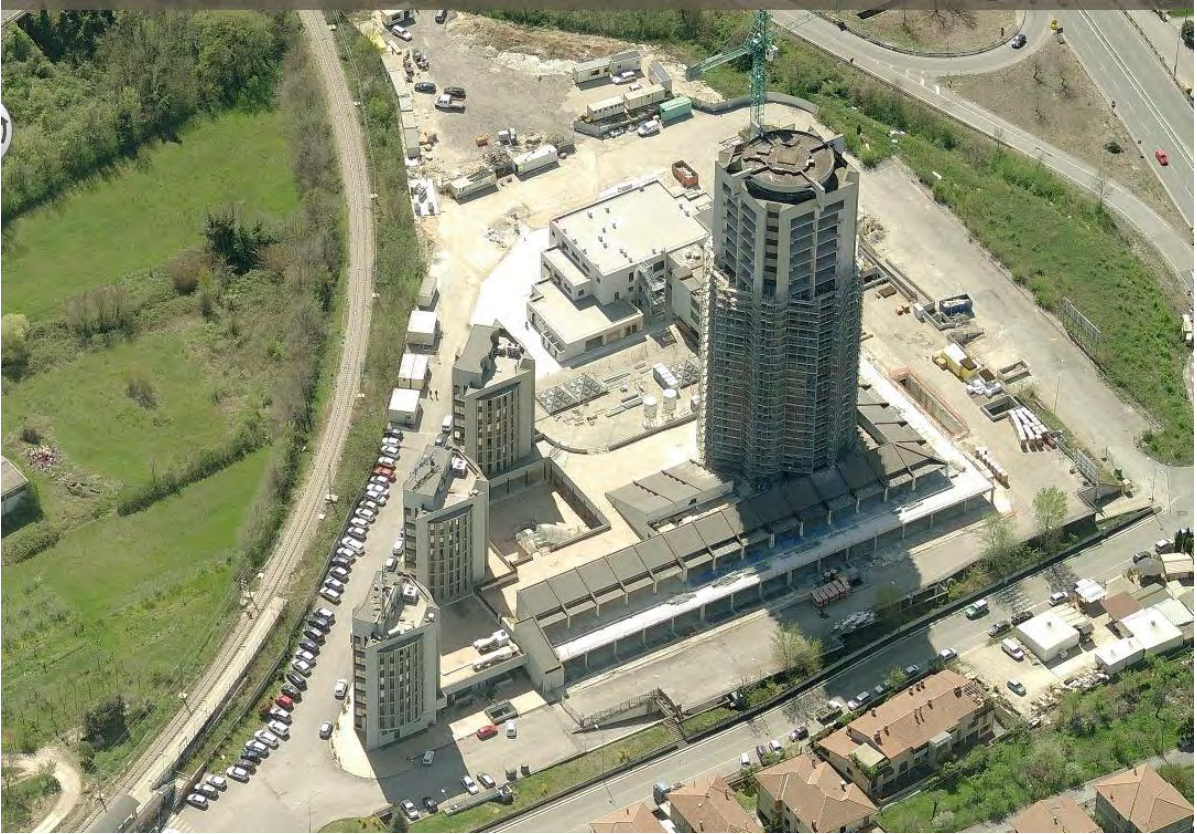
Fotografia n. 55