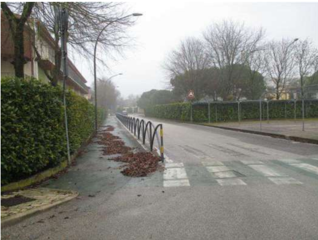
3) Veduta di via Pago, afferente alla Piazzetta Rialto