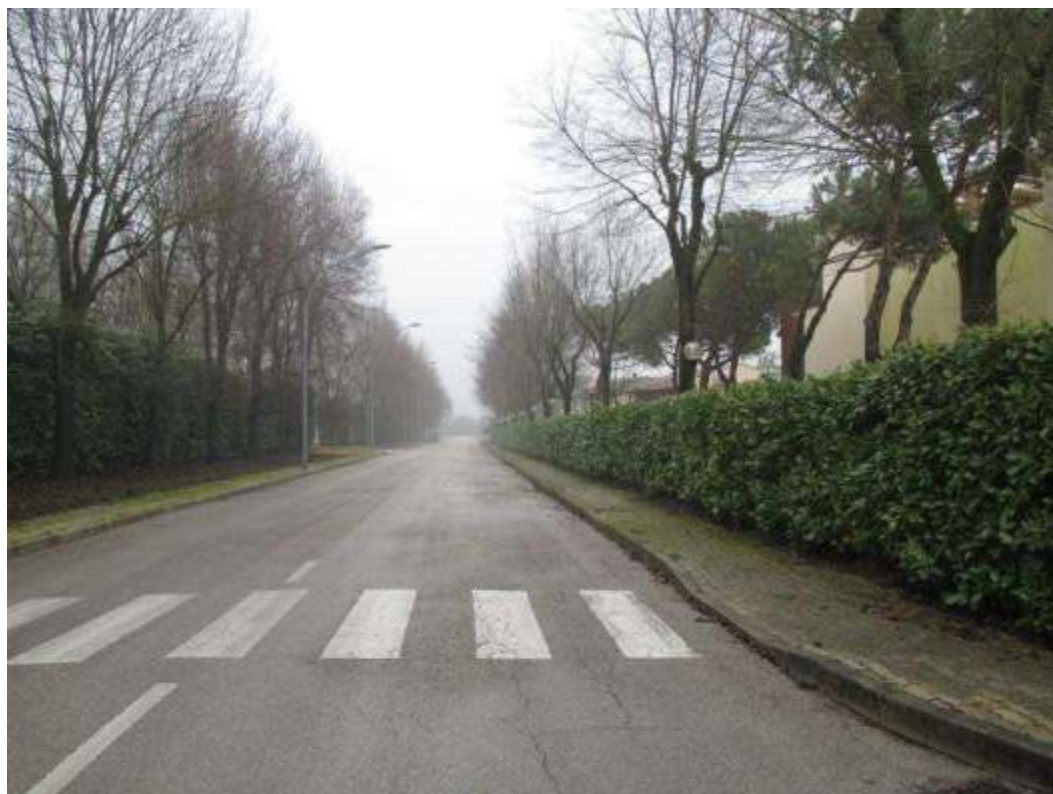
1) Veduta di via Selva Rosata