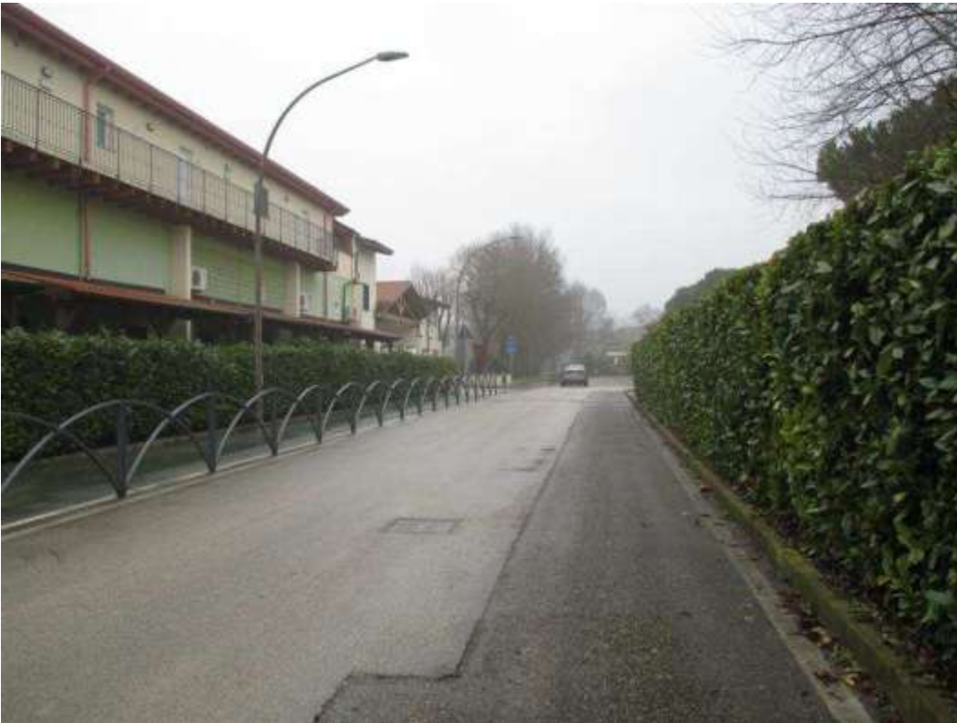
4) Veduta di via Pago