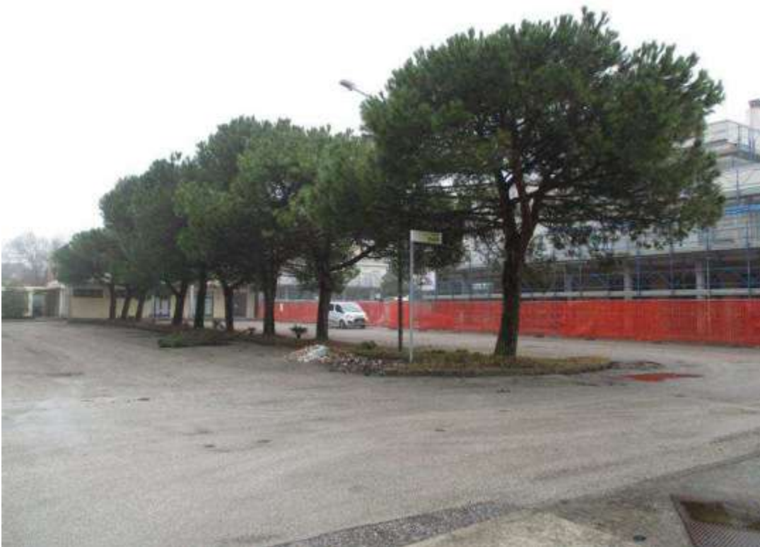
7) Veduta di Piazzetta Rialto