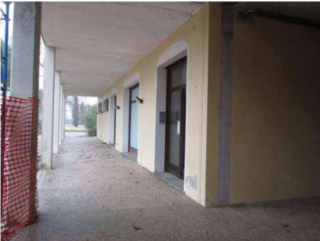
17) Veduta del portico: in primo piano, portone di ingresso alla scala E