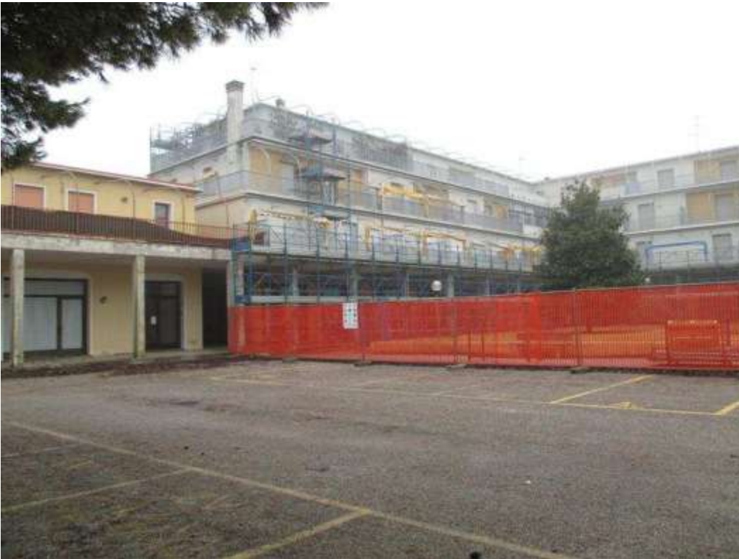
10) Vedute del Condominio Saturno su Piazzetta Rialto