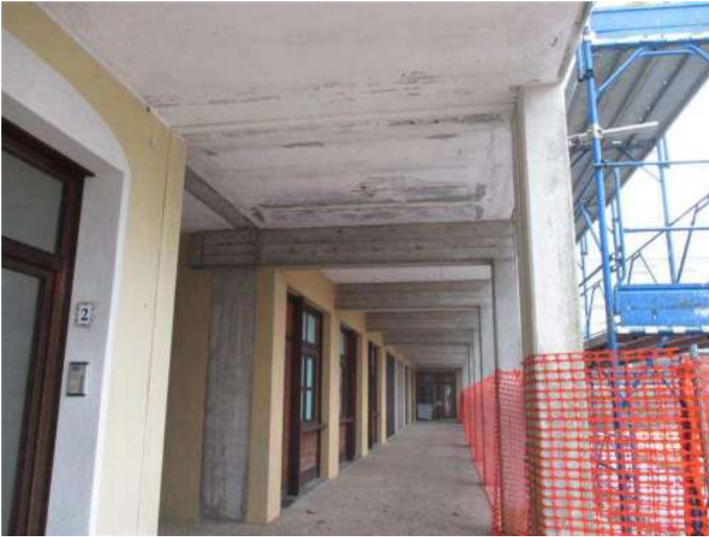
28) Ingresso al vano scala E dal portico, attraverso il portone con il n. 2