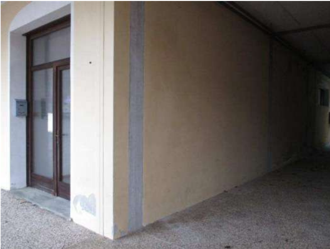
18) Portone di ingresso alla scala E