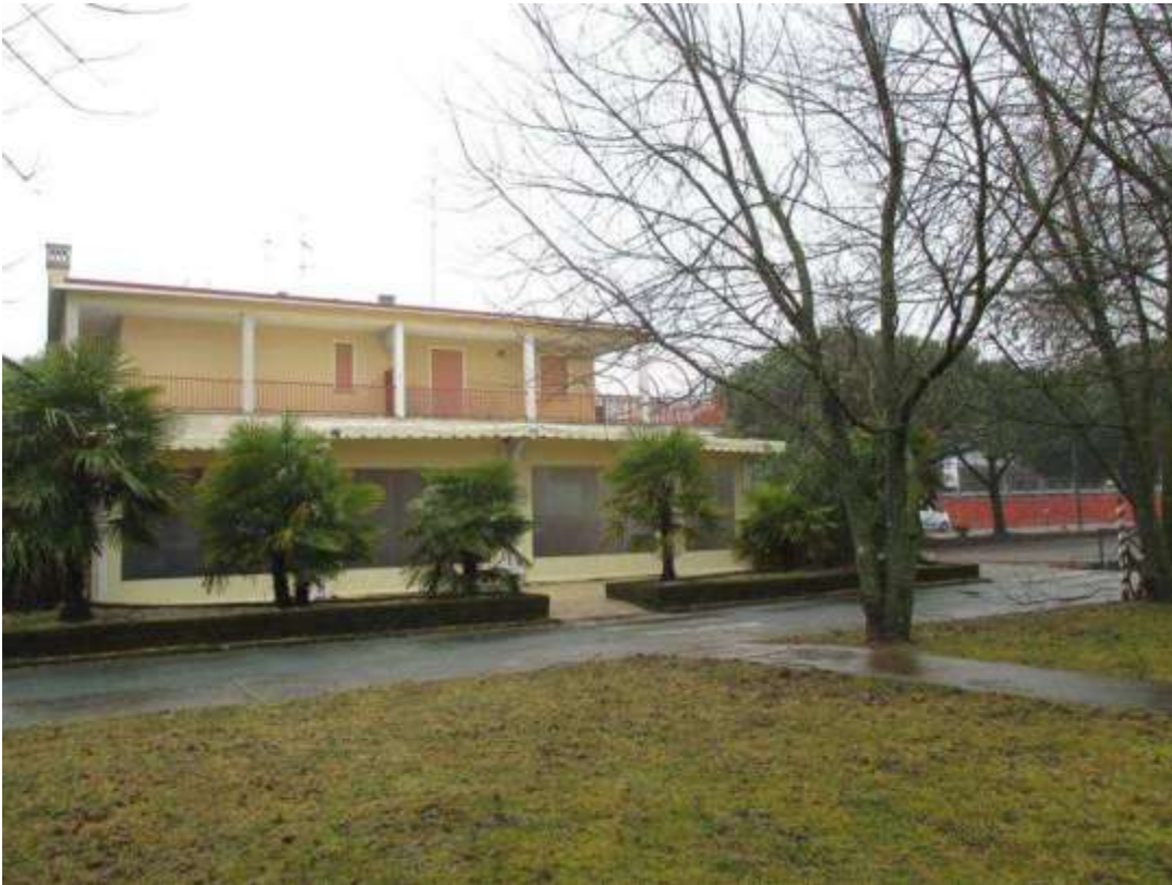
6) Fronte nord-est del Condominio Saturno