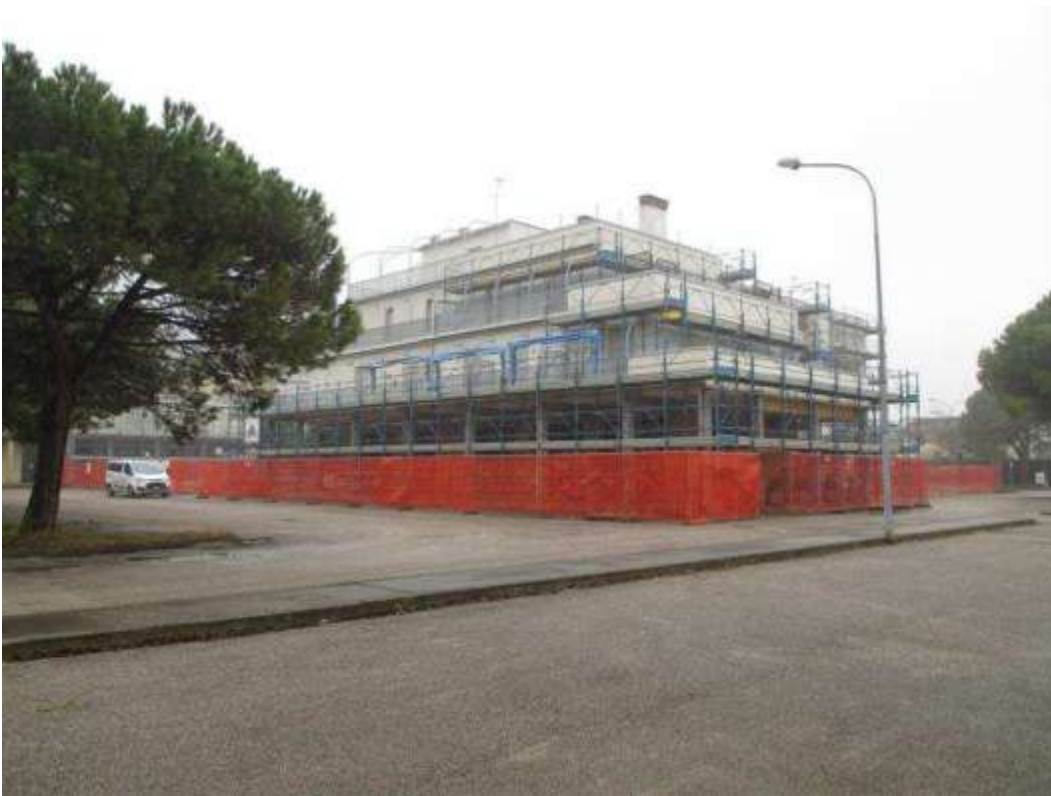
8) Fronte nord-ovest del Condominio Saturno su Piazzetta Rialto