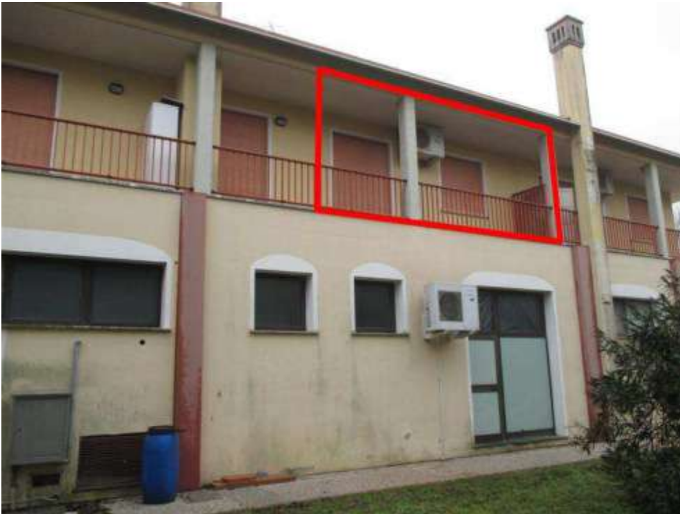
24) Affaccio dell'abitazione pignorata sul fronte sud-est del fabbricato