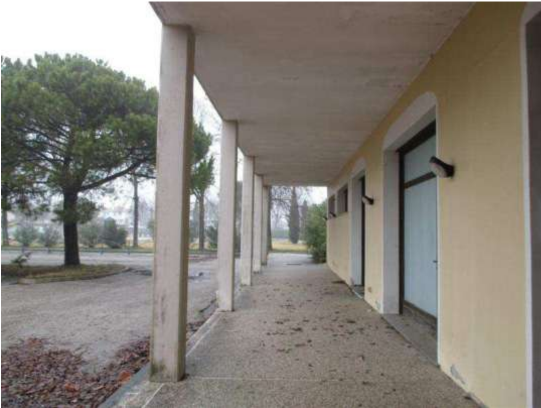
16) Veduta del portico