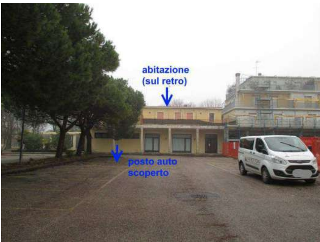
9) Fronte sud-est del Condominio Saturno, e localizzazione dei beni Immobili pignorati