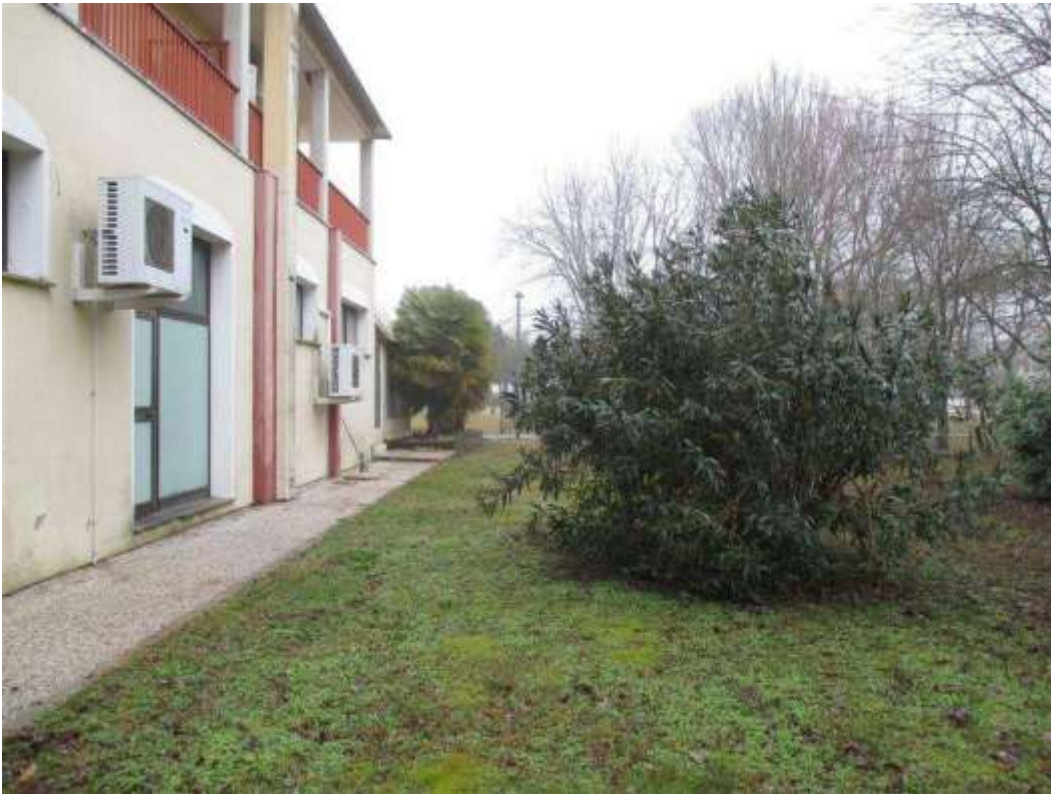
26) Area esterna scoperta adiacente al fronte sud-est del fabbricato