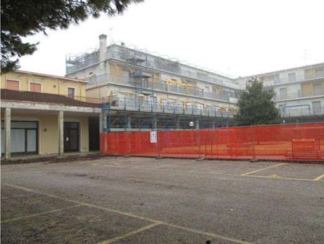
10) Vedute del Condominio Saturno su Piazzetta Rialto