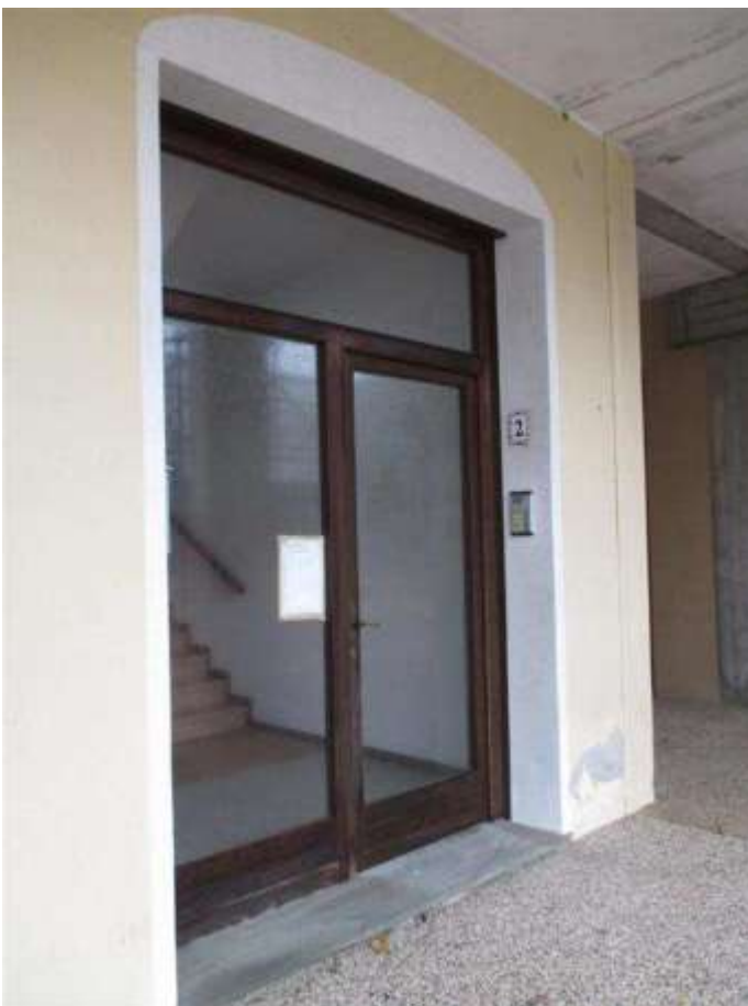
29) Particolare del portone di ingresso alla scala E