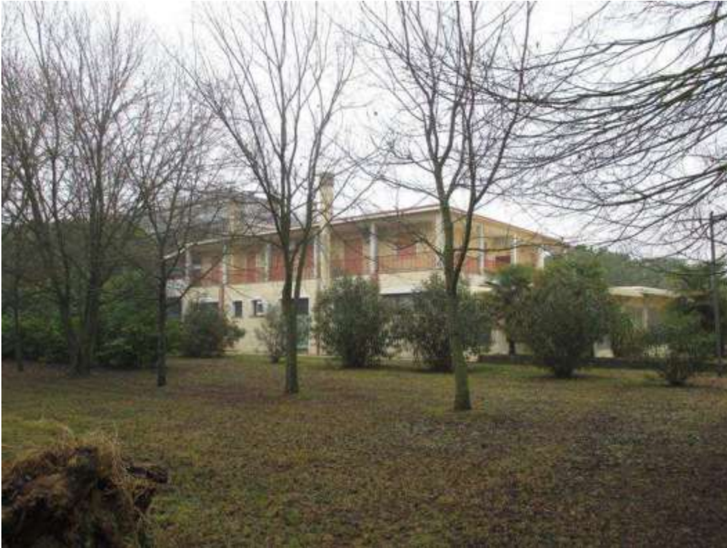
20) Vedute d'insieme del fronte sud-est del fabbricato