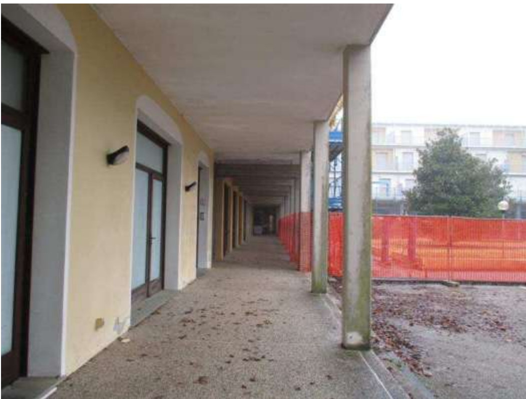
15) Portico sul fronte nord-ovest dell'ala del fabbricato in cui è ubicata l'abitazione pignorata (scala E)