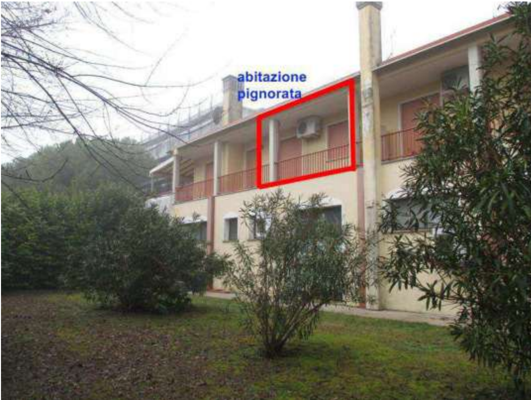
22) Affaccio dell'abitazione pignorata sul fronte sud-est del fabbricato