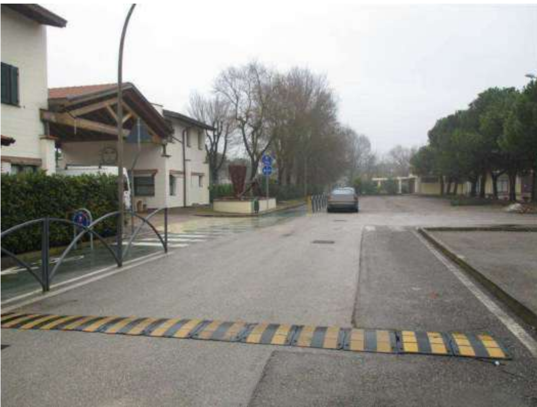
5) Accesso alla Piazzetta Rialto