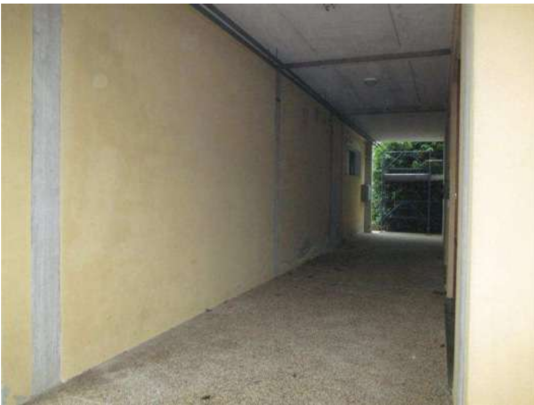
19) Passaggio coperto tra il portico e l'area esterna scoperta prospiciente Il fronte sud-est del fabbricato