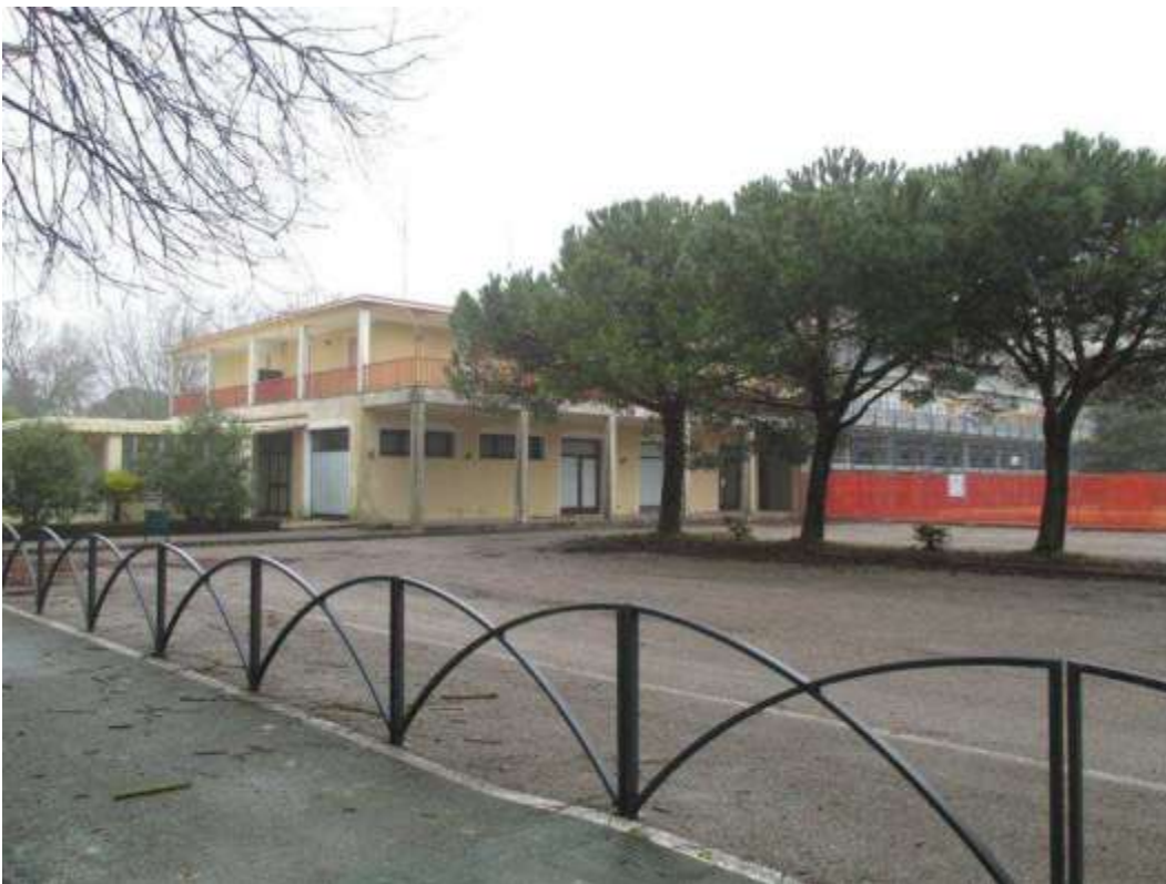
27) Veduta del fronte nord-ovest dell'ala del fabbricato in cui è ubicata l'abitazione pignorata