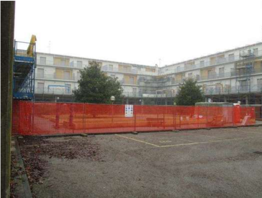
12) Vedute del Condominio Saturno su Piazzetta Rialto