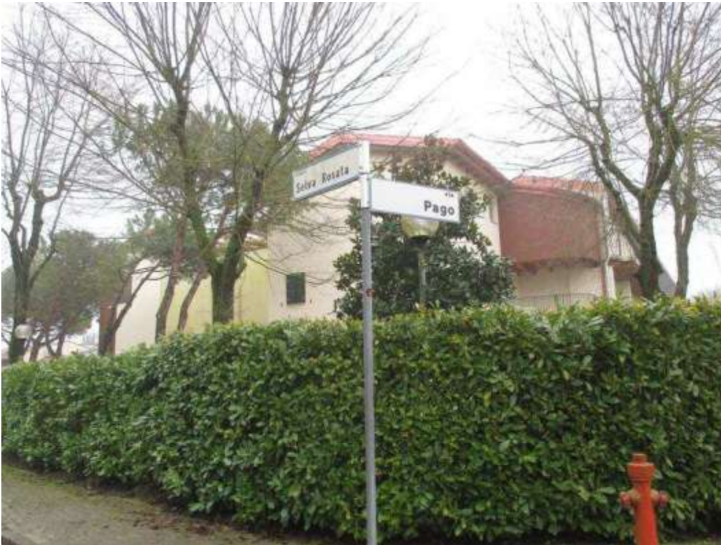
2) Incrocio tra via Selva Rosata e via Pago