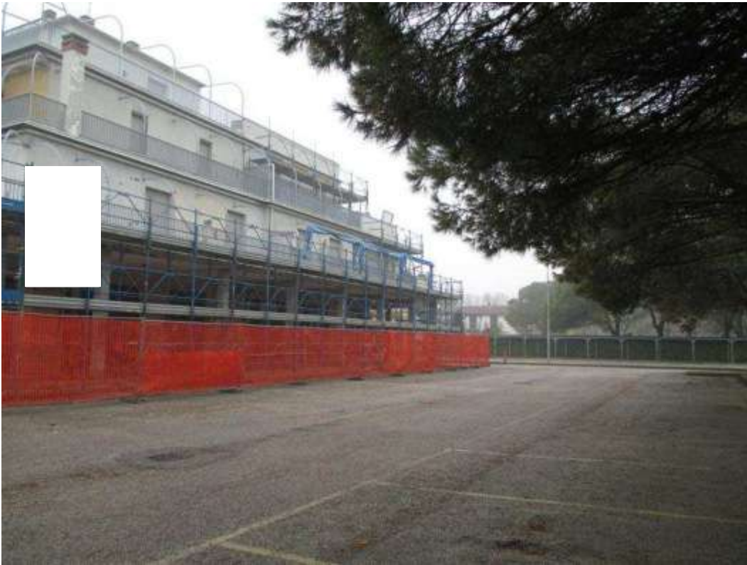
14) Posti auto scoperti afferenti alle unità immobiliari del Condominio Saturno